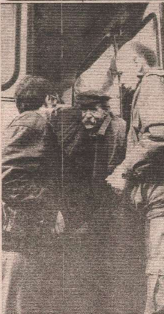
ТУРБЕ: Излазак цивила из Зенице