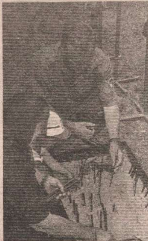
БИЛЕЋА: Генерал Ратко Младић, Видовдан 1994. године