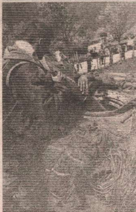
Увијек на првим линијама: гораждански фронт