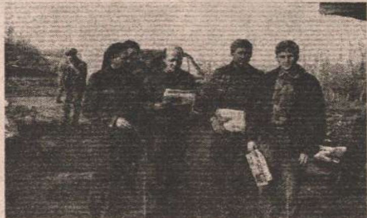
Најважније да су стигла издања "Гласа српског"

Цијели дан на обали Саве. Вријеме изузетно