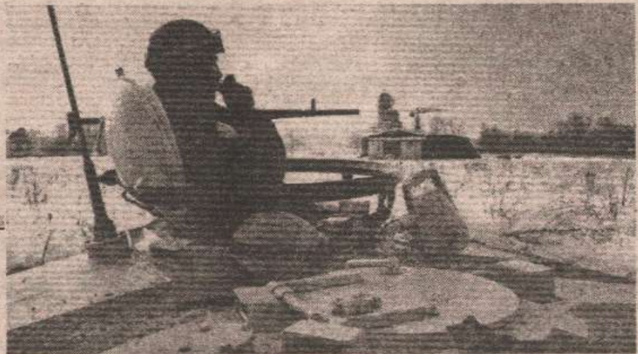
Долазак руског батаљона УНПРО-ФОР-а, Сарајево ове године