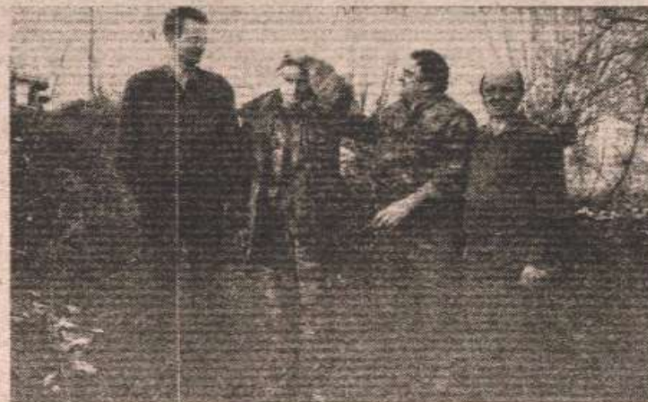
Група радника "Гласа"