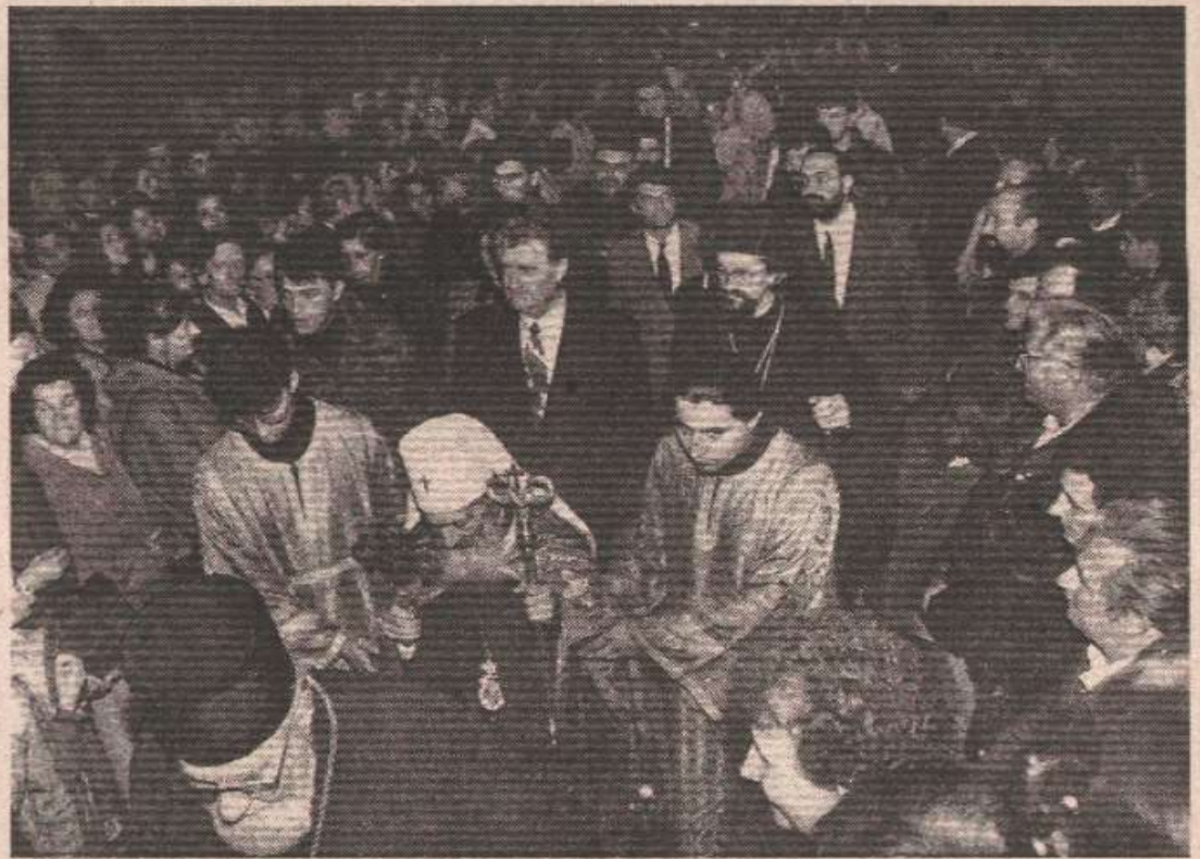
Догађај године у Републици Српској - тек notiца у новинама Југославије - Ванредно засједање Светог архијерејског сабора, Бања Лука, октобра 1994. године

Вијест мјесеца у октобру је отварање сурчинског аеродрома. Након двије и по године први авион је слетио у Београд, а међу путницима је био и Виталиј Чуркин, забиљежио је Танјуг. Београдски новинари буквално су дежурали на аеродромским листама, помно биљежећи полјетање и узлијетање авиона. Али, "заборавили" су да региструју да је патријарх српски господин Павле одбио да авионом отпутује у Русију. "Ови су летови прескупи, плаћени су крвљу наше браће у Републици Српској", изјавио је патријарх Павле и у Москву се одвезао колима. Као што се у Београду