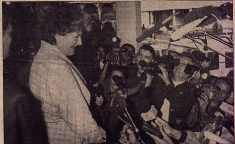
Председник РС Биљана Плавшић пред новом изборном побједом

Информације које се пласирају из штабова СРС РС и СДС-а су некомплетне и у функцији