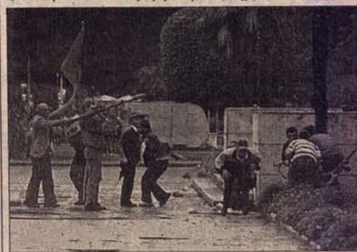
Демонстранти у главном граду Албаније наоружани противтенковским гранатама

Асоцијетед прес тврди да су демонстранти заробили четири тенка, док Ројтерс јавља да је телевизија приказала три тенка и двоја оклопних возила у центру Тиране. (Танјуг)