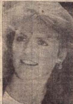
Дајанина узданица: Сара Фергусон, супруга принца Ендруа

У то вријеме љубавна прича између Чарлса и Камиле постала је јавно власништво. Док је Чарлс био прелудник, леђи Дајану јавност је видјела као жртву. Резултат тога је био да Чарлс, ионако непопуларан, још више