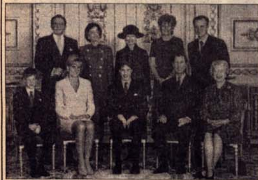
Велика и срећна краљевска породица: Дајана између синова Харија и Вил-ијема

да задовољим своју породицу. Од тренутка када нисам могао да се оженим Камиллом, осим ако се одрекнем пријестоља, Дајана је вриједила као и свака друга“. Оваква изјава човјека, који је до тада био центар Дајаниног живота, уништила би и психички много јачу жену од леди Ди.