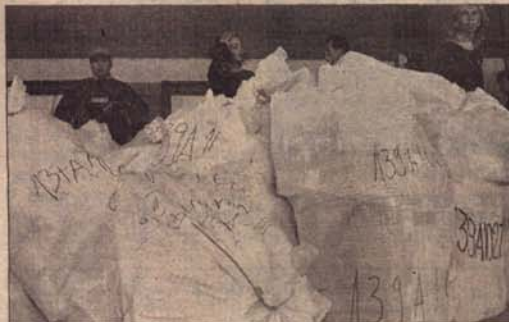
Гласачки листићи пристижу у Лукавицу и Сарајеву гдје ће се вршити пребројавање

„Не можемо толерисати чињеницу да бирачки спискови нису стигли на вријеме до гласачких мјеста или да се на списковима нису налазила имена гласача који су се уредно регистровани и прошле, али и ове године“, нагласила је Пак.