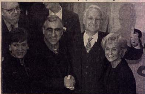
Радост послје изборне побједе у Баварској