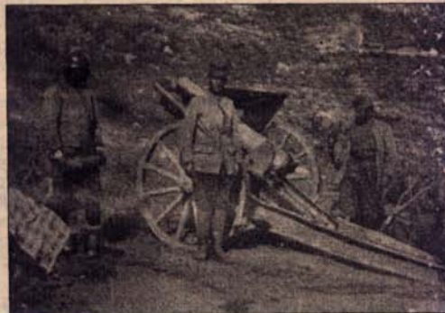
Српска артиљерија на положају

Добропољска битка почела је 14. септембра артиљеријском припремом, а завршила се 21. септембра избијањем српске Друге армије у долину Вардара од Демир