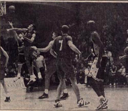
Бањолучани очекују велику подршку навијача у мечу са Монтаном

им је смјештај у хотелу „Босна“, а имаће прилику да од 18 до 19 часова тренирају и осјете атмосферу у Спортској дворани „Борик“.