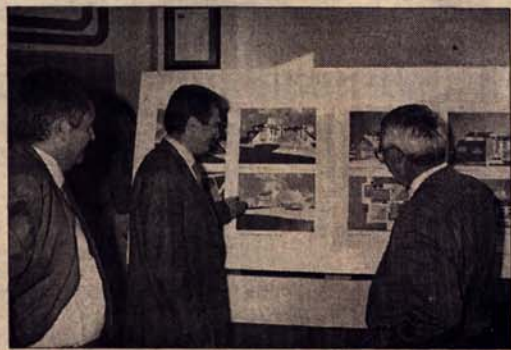
Презентација пројекта бањско-љечилишног центра Ђешљани