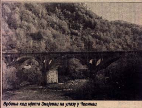
Врбања код мјеста Змајевац на улазу у Челинац