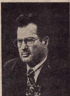
војницима других земаља у саставу Сфора који су „омогућили“ да се избори уопште одрже.“

Њемачки министар је посебно захвалио војницима Бундесвера, као и