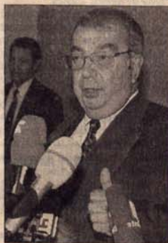
Екипа истимишљеника и професионалаца - Јевгениј Примаков

По његовим ријечима, нови потпредседник владе Јуриј Масљук и министар спољних послова Игор Иванов су „веома високи професионалци“.