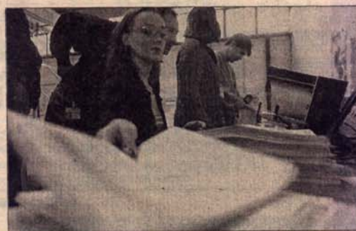
Пребројавање гласачких листића

У 123 вреће налази се 110.000 попуњених листића које ће 150 контролора, уз надзор 30 међународних представника, разврстати по општинама РС и ФБиХ.