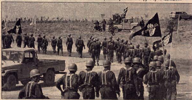
Ирански војници на путу према граници са Авганистаном

Према агенцијским извјештајима, иранске оружане снаге су у стању пуне приправности на граници према Авганистану, гдје довлаче појачања. То изазива велику забринутост, не само у региону, него и свијету, пошто екстремисте у Кабулу подржава Пакистан, који им шаље и наоружање, и мувахедине.