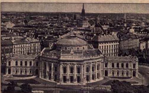
Редовни контакти са хрватским политичарима: Беч

„Очито су политичари из Сплита имали више слуха од оних из Ријеке и Задра, који нису схватили шта значи овај корак“, истиче се у „Хрватским новинама“.