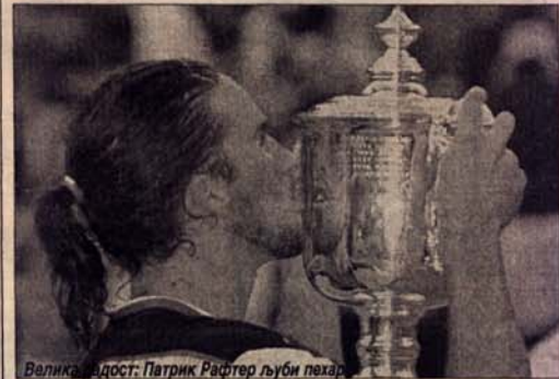
Велика младост: Патрик Рафтер љуби пехар

За ову побједу припала му је награда од 700.000 америчких долара, док је поражен Филипусис добио 400.000 „зелених новчаница“.