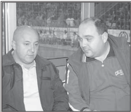
Миљевић и Зрнић: Подршка новом тренеру

Фудбалери Слоге били су јесени хит на друголигашком западу. Први дио сезоне завршили су на трећем мјесту са 32 бода, баш колико су сакупили водећа