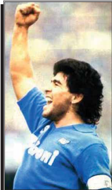
Дијеџо Армандо Марадона: Окупља шампионски тим Наполија

- Разговарали смо током божићних празника о могућности одигравања опроштајне утакмице, а Дијеџо је жеља да окупи екипу Наполија из сезоне 1988/89, која је освојила наслов првака Италије. Што се тиче противника, то би био тим састављен од играча против којих је Дијеџо играо за вријеме своје