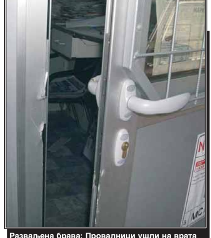
Разваљена брва: Провалници ушли на врата