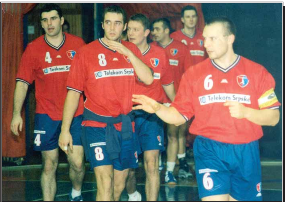
Играчи Борца Телеком Српске: Заједничким снагама до зацртаних циљева