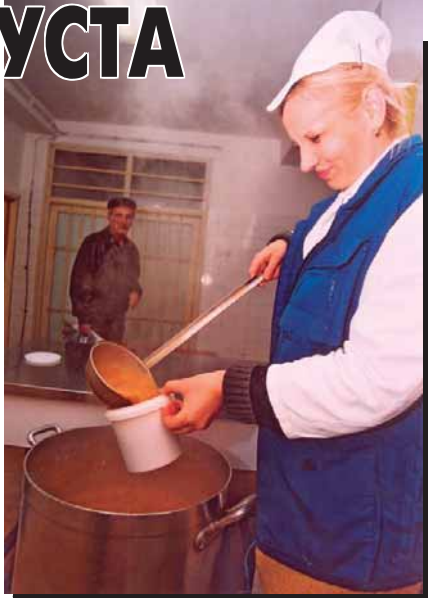
Јавна кухиња: Пензионери најчешћи корисници