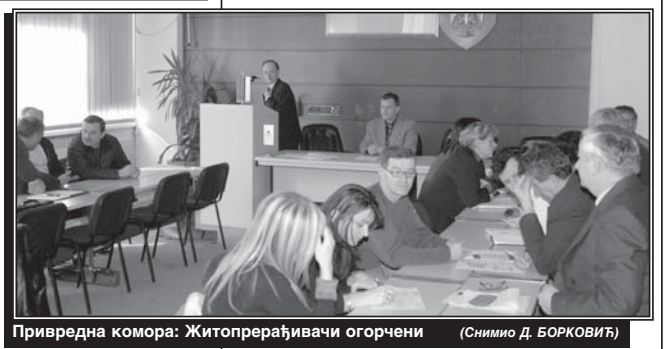
Привредна комора: Житопрерађивачи огорчени

БАЊА ЛУКА - Током јучерашњег трговања на Бањалучкој берзи остварен је промет од 360.149 марака, кроз 632 трансакције. Вриједност индекса је умањена, берзанског за 0,93 одсто, а индекса фондова за 0,25 одсто.