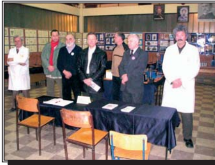
Челинац: Отварање изложбе

Организатори изложбе нагласили су да послије серије изложби по Републици Српској сљедеће организације посјета родној кући Николе Тесле у Смиљану код Госпића и Музеју „Николе Тесле“ у Београду, а и одлазак на традиционални „Мали иност“ који ће се одржати у Бањој Луци од 20. до 24. априла.