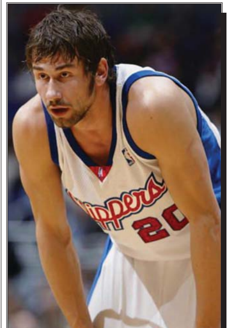
Плејмејкер репрезентације Србије Марко Јарић: Лани играо промјенљиво

Владимир Радмановић ће за ову сезону добити 5,6 милиона долара, док ће најмање новца зарадити Ненад Крстић - 1,8 милиона.