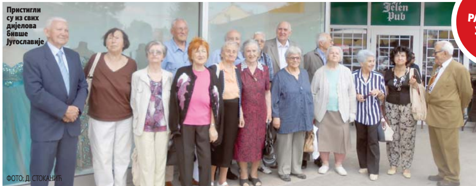
Пристигли су из свих дијелова бивше Југославије

Иако у позном животном добу јер су загазили у девету деценију живота, али веома витални, њих двадесетак пристигло је у град на Врбасу из свих дијелова бивше Југославије. Дошли су како би се присјетили дана младости и ђачког доба. Дружење на имању једне од