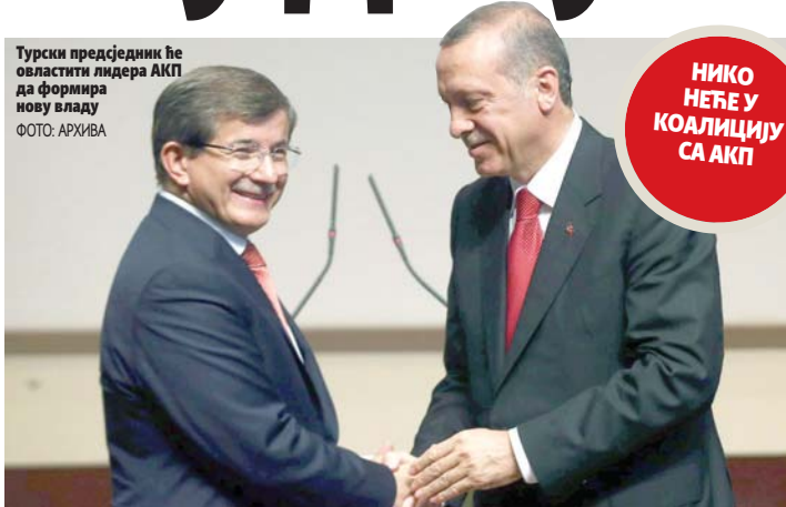
Турски председник ће овласти лидера АКП да формира нову владу

Ердоган је прихватио оставку владе, са Давутоглуом на челу, током једночасовног сасатанка у његовој палати у Анка-