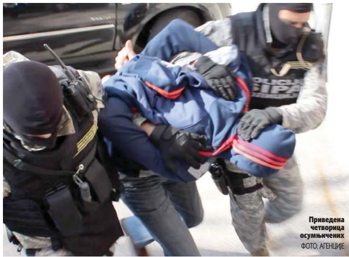
Приведена четворцица осумњичених