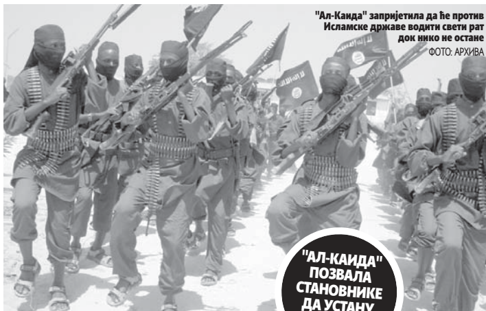
"Ал-Каида" запријетила да ће против Исламске државе водити свети рат док нико не остане

Група ИС је настала као филијала "Ал-Каида", али је испала из глобалне цихадистичке мреже 2014. године, када су се двије групе сукобиле у Сирији.