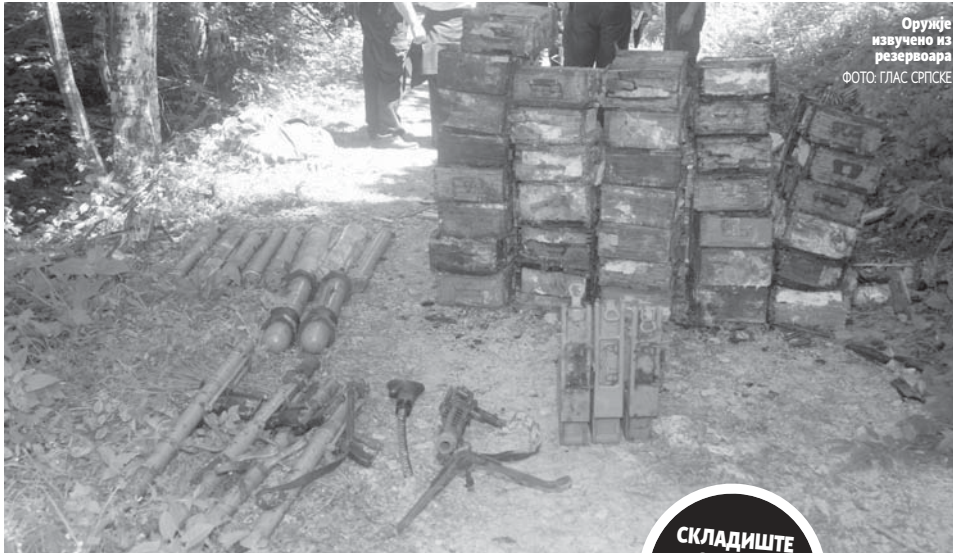
Оружје изучено из резервоара