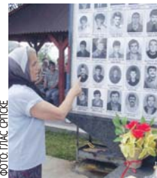
ЗЛОЧИН НА ПЕТРОВДАН 1992. ГОДИНЕ У СЕЛИМА ЗАЛАЗЈЕ, САСЕ, БИЈАЧА И ЗАГОНИ

То ће довести до различитих реакција и појела у БиХ. Очигледно је да Тужи-