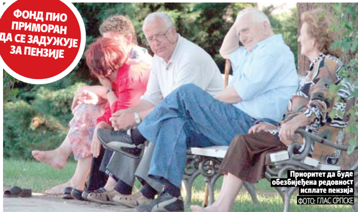
Приоритет да буде обезбијеђена редовност исплате пензија

Влада РС разматрала стање у пензијском систему и најавила промјене