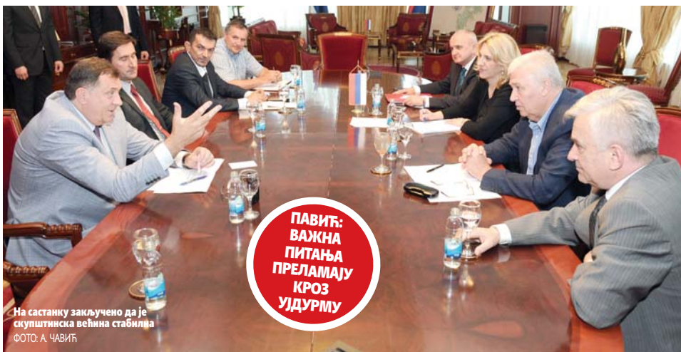
На састанку закључено да је скупштинска већина стабилна

ПАВИЋ: ВАЖНА ПИТАЊА ПРЕЛАМАЈУ КРОЗ УЈДУРМУ