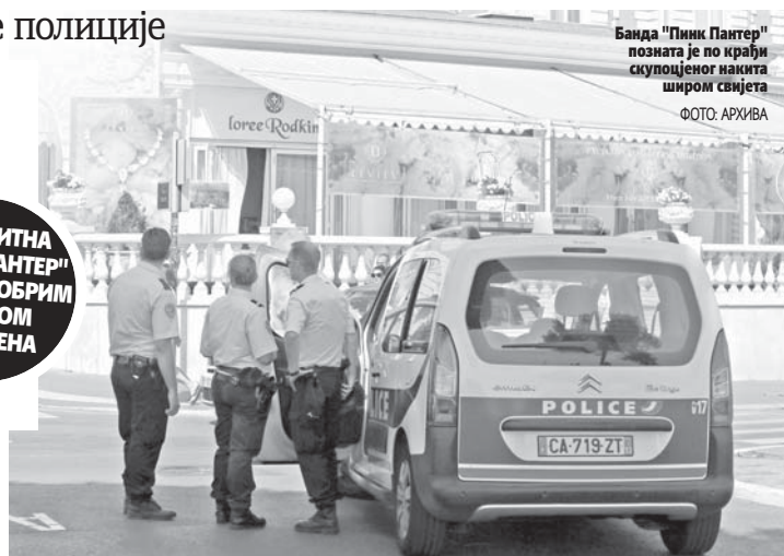
Банда "Пинк Пантер" позната је по крађи скупоцијеног накита широм свијета

ПРВОБИТНА "ПИНК ПАНТЕР" МРЕЖА ДОБРИМ ДИЈЕЛОМ РАЗБИЈЕНА