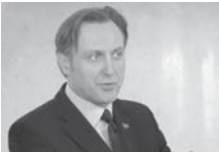
САТАНИЗУЈУ СДП ГОРЕ НЕГО ТОКОМ РАТНОГ НОВИНАРСТВА.

У полицијском саопштењу је наведено да је Сектор за унутрашњу контролу и професионалне стандарде извршио проверу околности бјекства једног од приведених припадника криминално-терористичке групе, те да је констатовано да су полицијаци који су били задужени за чување и обезбјеђивање терористе поступили непрофесионално. (Агенције)