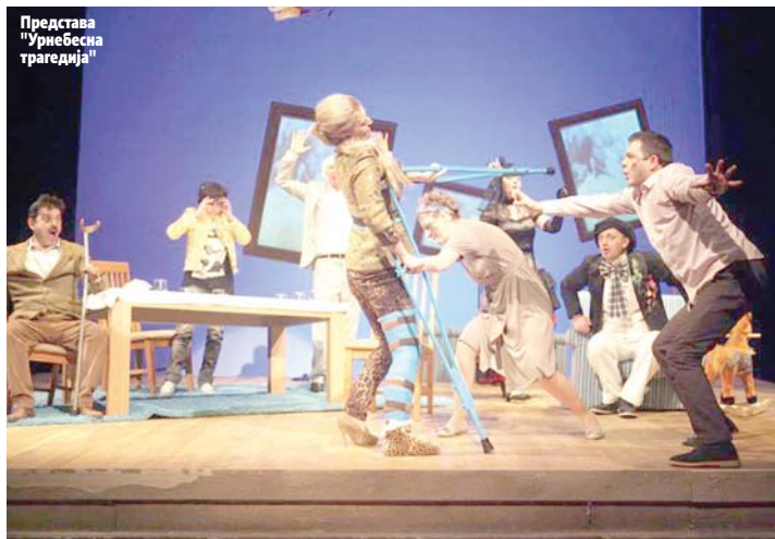
Представа "Урнебесна трагедија"

БАЊАЛУКА - Своје прве глумачке кораке са драмском секцијом Медицинске школе