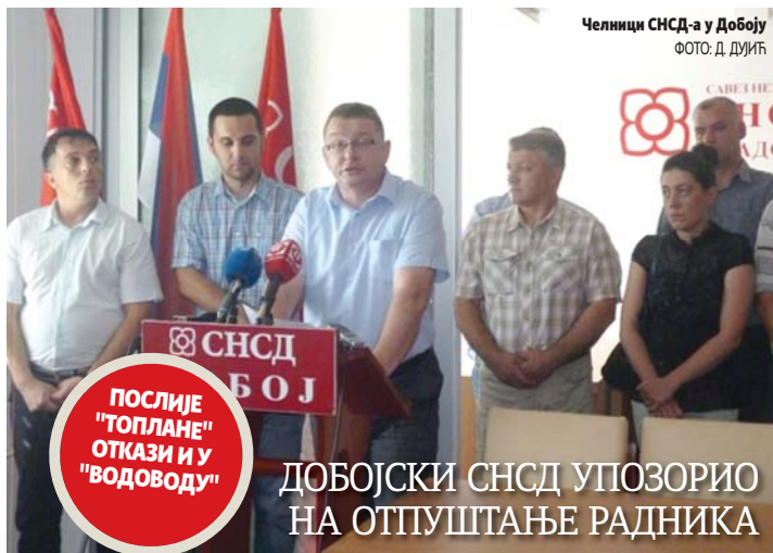
Челници СНСД-а у Добоју

Поход на највиши врх Аљаске је четврта експедиција бањалучких алпиниста, који планирају успон на највише врхове на свим континентима. А. Ј.