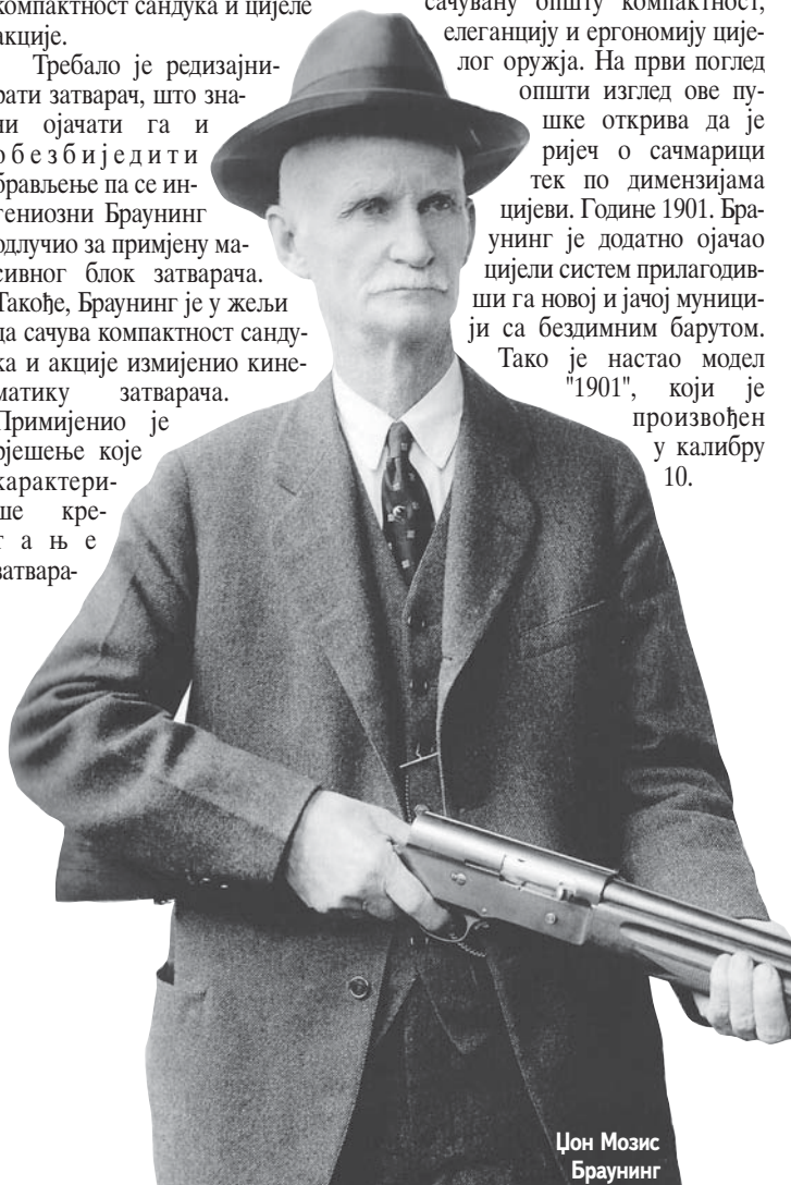
Џон Мозис Браунинг