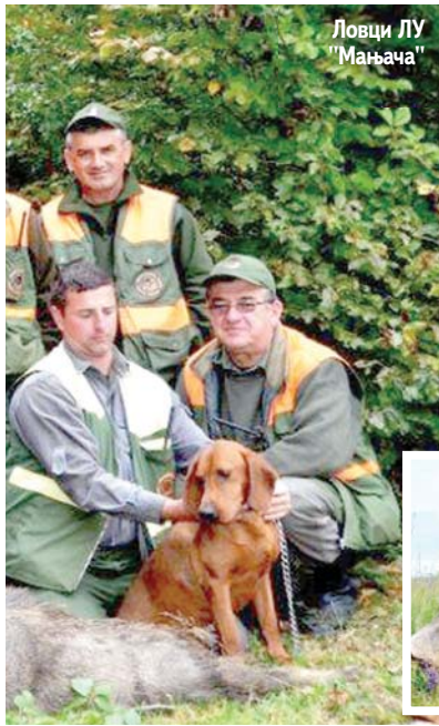
Ловци ЛУ "Мањача"