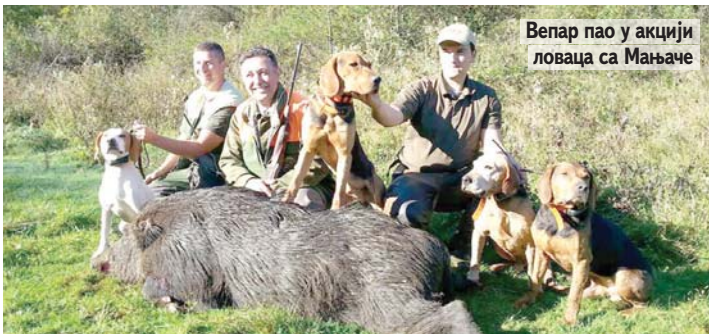
Вепар пао у акцији ловаца са Мањаче