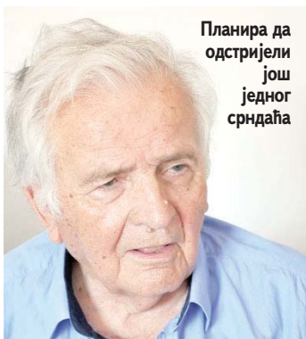
Планира да одстријели још једног срндаћа