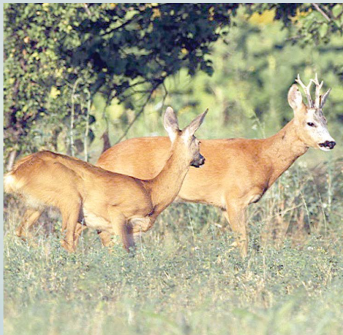
Очекује се проширење ловишта

- Нашу општину су прије двадесетак и више година редовно посећивали ловци из Италије којих има и сада, али је њихов број занемарљив. Они уредно плаћају накнаду за одстријељену дивљач, али су незадовољни због правних процедура који им умањују значај и сатисфакцију лова - рекао је Кусић.