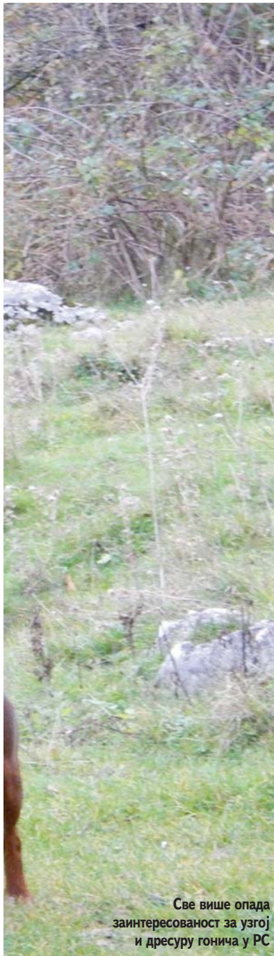
Све више опада заинтересованост за узгој и дресуру гонича у РС

гоничи са наших простора веома су цијењени због самосталног рада па један наш пас у лову замјењује четири или пет страних гонича.