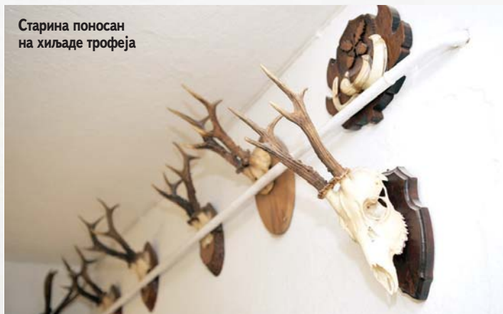
Старина поносан на хиљаде трофеја

Лов је страст коју не могу описати, а ни отарасити је се. И са деведесет година сам пасионирани ловац какав сам био кад ми је било тридесет, прича Нишкановић