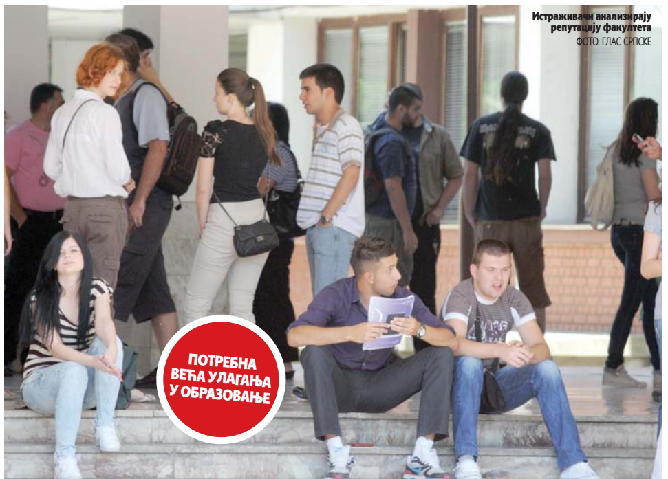
Истраживачи анализирају репутацију факултета

Сваке године буде анкетирано око 34.000 особа које одговарају на питања како виде