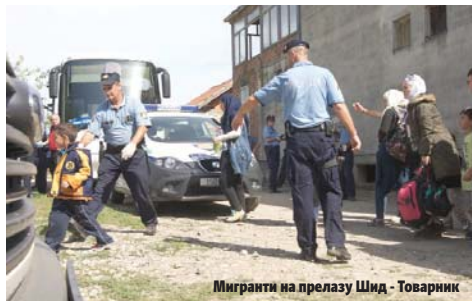
Мигранти на прелазу Шид - Товарник

- Ту већ имамо појединачне покушаје улазка сиријских држављана. Могуће је да се ради о пробама јер је то одлично угодна рута. Имамо