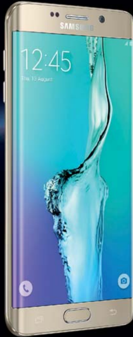
SAMSUNG Galaxy S6 edge+ Moj Mix VIP 1 KM