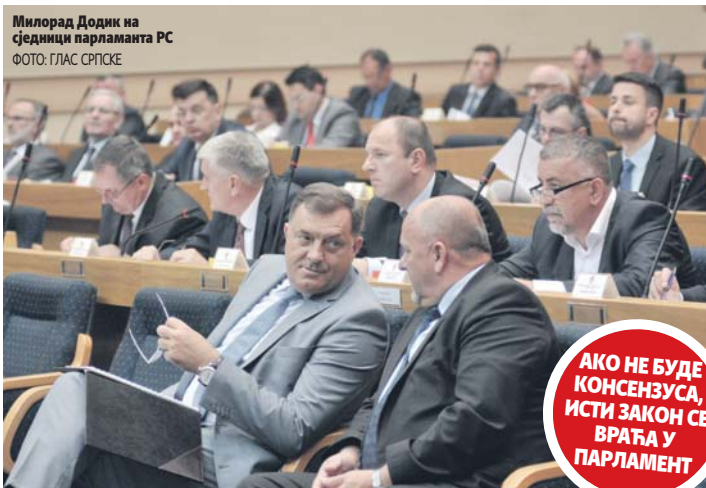
Милорад Додик на сједници парламента РС

РС најмање потребно да се на овом питању политички разматује. У јавности је у значајном обиму на дјелу политизација овог закона. Мој циљ је био да регулишемо статус људи, а не да то буде тема за политичке расколе у РС, истакао Додик