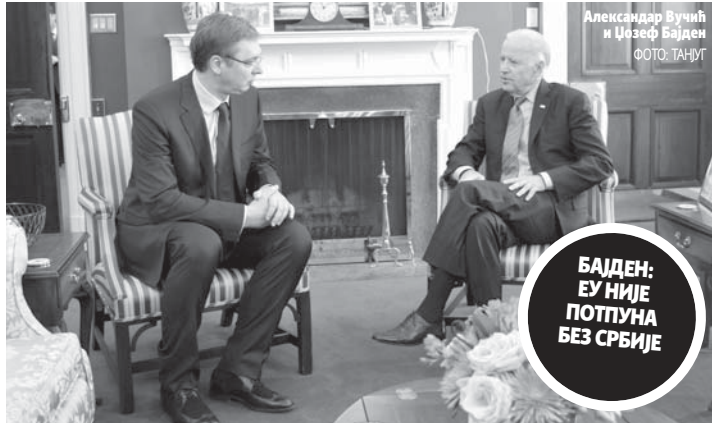
Александар Вучић и Џозеф Бајден

Премијер је додао и да се нада да ће долазак америчких инвеститора у Србију бити