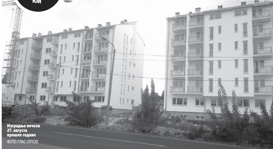
Изградња почела 27. августа прошле године