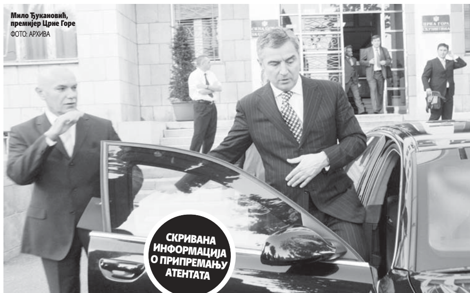
Мило Ђукановић, премијер Црне Горе

СКРИВАНА ИНФОРМАЦИЈА О ПРИПРЕМАЊУ АТЕНТАТА