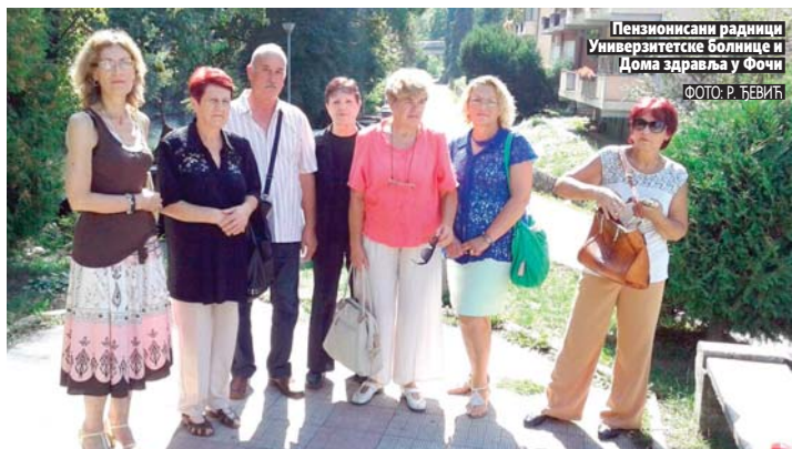
Пензионисани радници Универзитетске болнице и Дома здравља у Фочи

Пензионисани радници болнице и Дома здравља у Фочи огорчени на Фонд ПИО РС