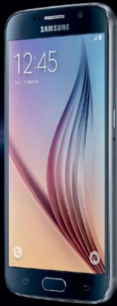
SAMSUNG Galaxy S6 Moj Mix VIP 1 KM