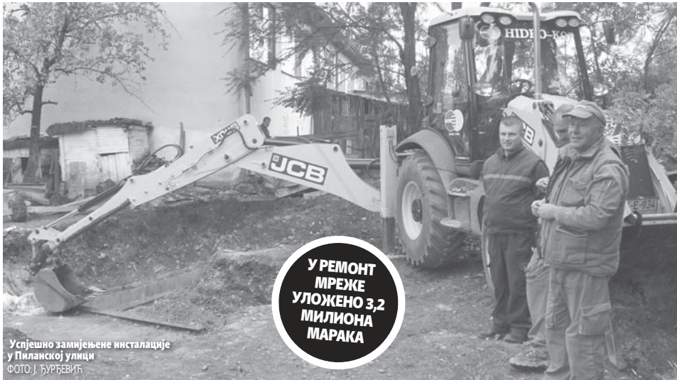
Успјешно замијењене инсталације у Пиланској улици

У РЕМОТ МРЕЖЕ УЛОЖЕНО 3,2 МИЛИОНА МАРАКА