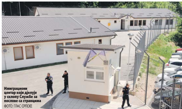
Имиграциони центар који дјелује у склопу Службе за послове са странцима

Иако позиција директора по страначкој и етничкој расподјели припада српском кадру, занимљиво је да су конкурисала и тројица Бошњака