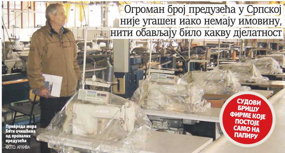
Приредла мора бити очишћена од пропалих предузећа

БАЊАЛУКА - Огроман број предузећа у Српској нема имовине, нити обавља било