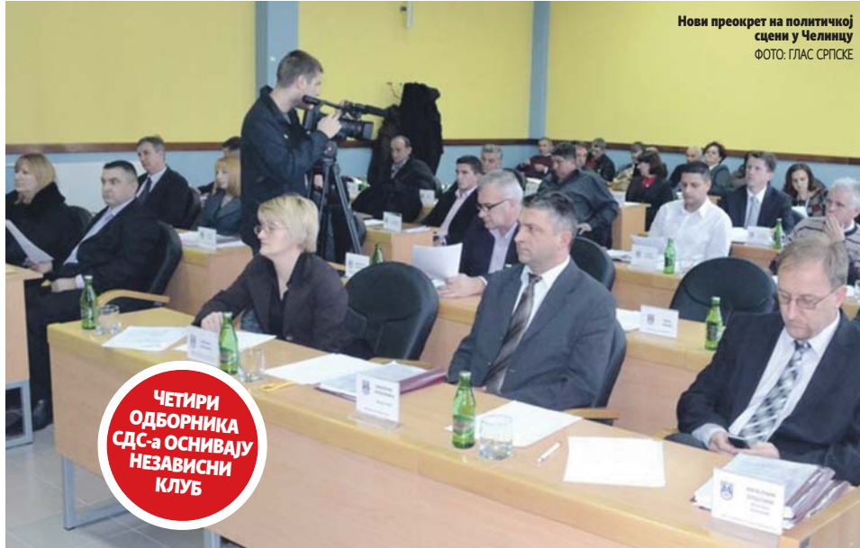
Нови преокрет на политичкој сцени у Челинцу