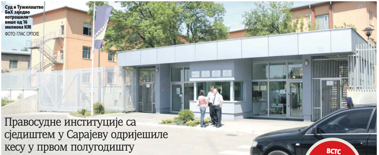
Суд и Тужилаштво БиХ заједно потрошили више од 16 милиона КМ