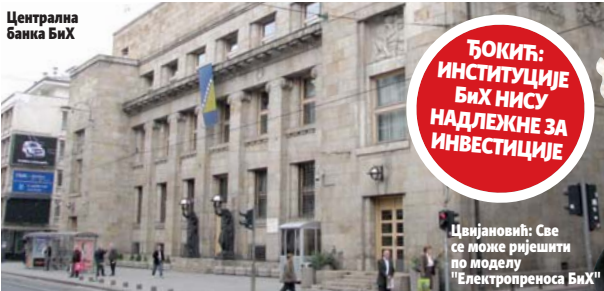
Цвијановић: Све се може ријешити по моделу "Електропреноса БиХ"

ПИШЕ: МАРИНА ЧИГОЈА marinacigojaa@glassrpske.com