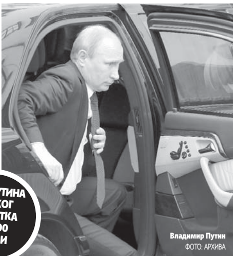
Владимир Путин

Након тога, агенти Федералне службе безбједности (бившег КГБ), организам од око 20.000 чланова, праве ана-