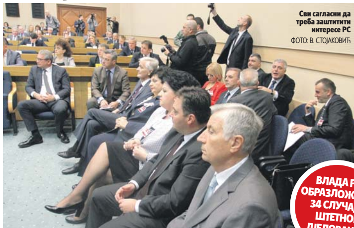
Сви сагласни да треба заштити интересе РС

Сједница је почела уводним излагањем премијера РС Жељке Цвијановић, током којег су опозициони посланици изашли, а у скупштинској сали