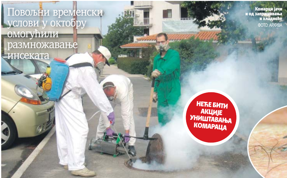
Комарци јачи и од запрашивања и хладноће

Повољни временски услови у октобру омогућили размножавање инсеката