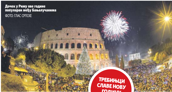
Дочек у Риму ове године популаран међу Бањалучанима

Многи туристи чији пеп није довољно дубок уплаћују једнодневне аранжмане по прис-