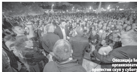
Опозиција ће организовати протестни скуп у суботу

До окупљања је, наводи он, дошло незаконито, а полиција је нападнута, па су