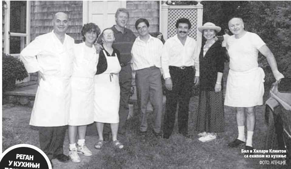
Бил и Хилари Клинтон са екипом из кухиње

ПЕКИНГ - Три дјечака узраста од 11 до 13 година на смрт су претукла наставницу да би украли њен мобилни телефон и неколико стотина долара, а инцидент се десио на југу Кине. Напали су је дрвеним палицама, запушили јој уста одјећом и одвукли је у тоалет гдје је преминула.