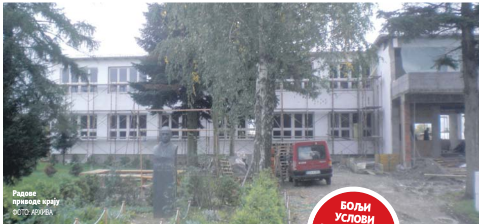
Радове приводе крају

Опремену за кабинете информатике, биологије, физике и хемије већ имамо и те ће учионице бити изузетно модерне, каже Ђокићева