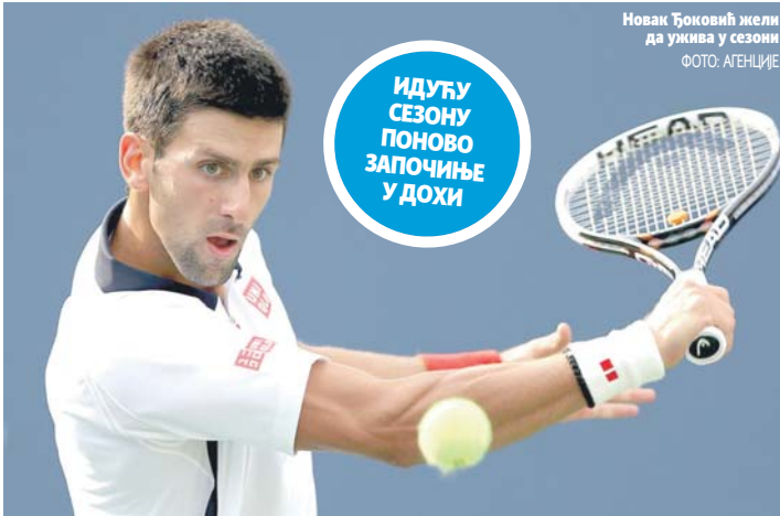
Новак Ђоковић жели да ужива у сезони