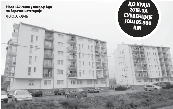
Нова 142 стана у насељу Ада за борацке категорије

Како су објаснили у Одјељењу за борацко-инвалидску заштиту, од укупног износа 195.000 марака је издвојено за стамбено збрињавање девет породица погинулих бо-