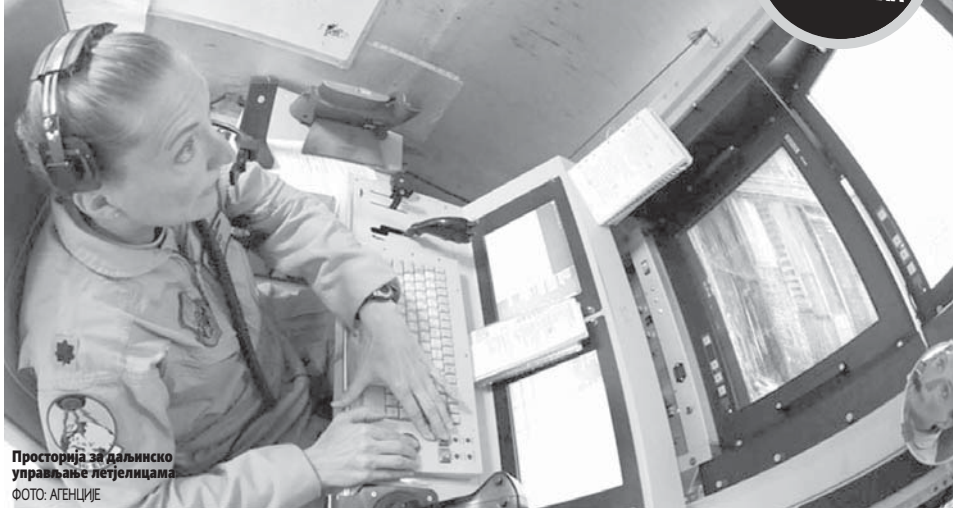
Просторија за даљинско управљање летјелицама

- Када погодите камион пун људи, руке и ноге се разлете на све стране. Гледала сам типа како се послје напада извлачи из олупине без доњег дијела тијела. Умирао је полако. Морате то да гледате. Не можете се бавити овим послом ако сте њежна жена у традиционалном смислу. Ово су људи који ће имати кошмаре - каже она. Ана, коју колеге зову Спарк (Искра), прије него што се придружила Америчком ратном ваздухопловству радила је у конкарници у Луизијани да би финансирала студије. Почела је као аналитичар сателитских снимака, на којима је тражила знакове непријатељске војне активности. Премјештена је у програм за