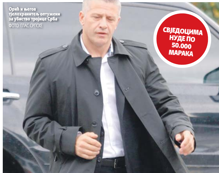
Орић и његов тјелохранитељ оптужени за убиство тројице Срба

Петорица су одбила да лажно свједоче, а тројица су се полакомила на новац и прихватила понуду. Новац им је на Руманију одио и исплатио бивши командир Полицијске станице у Милићима (име по-