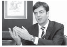
И ЈА САМ ИЗАБРАН КАО КАДАР СНС-а, АЛИ САМ НА КОНКУРСУ БИО НАЈБОЉИ ОД 70 КАНДИДАТА

Они истичу да је Мали навео да је радио као консултант у приватној фирми и саветовао друге приликом куповине станова, али да га њихова документација демантује "и показује да је Мали активно учествовао у купопродаји станова и потписивао уговоре - за себе или неког другог, мистериозног кушца". (Агенције)