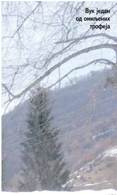
Вук један од омиљених трофеја