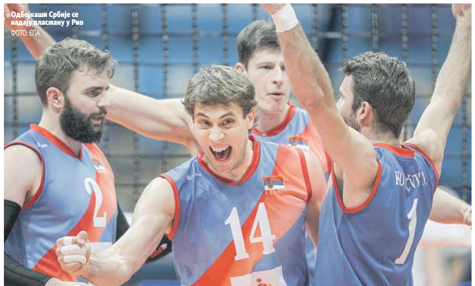
Одбојкаши Србије се надају пласману у Рио

Свака утакмица на овом турниру је финале за нас, па тако и ова са Пољацима. Надам се да ће момци пружити одличну партију, јер сви желимо да се нађемо на Олимпијади, казао Грбић