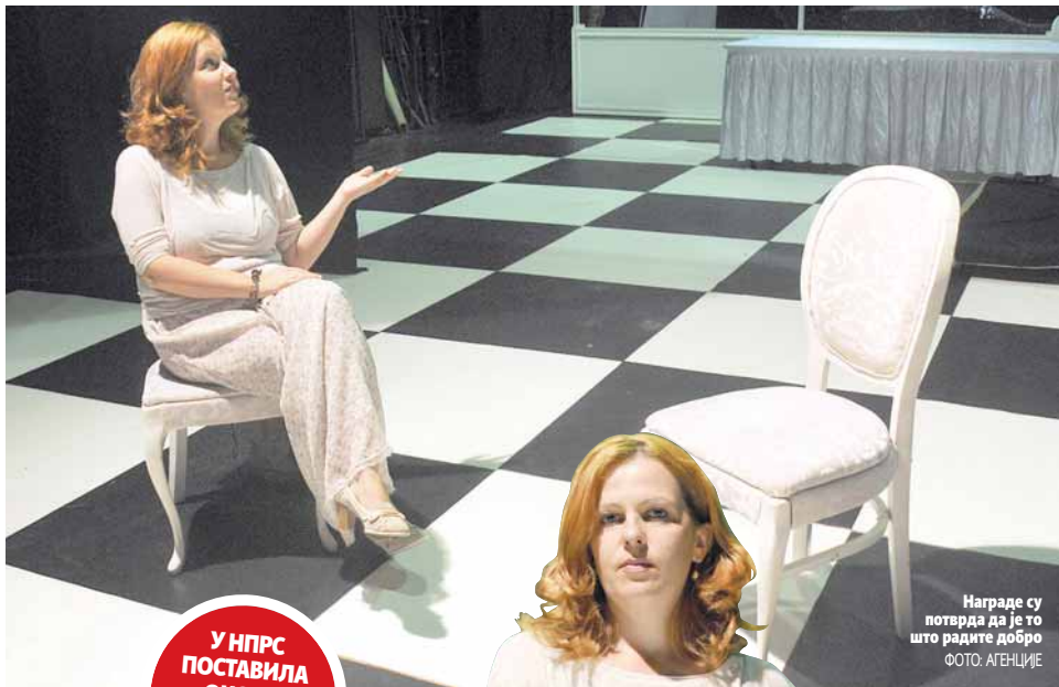
Награде су потврда да је то што радите добро