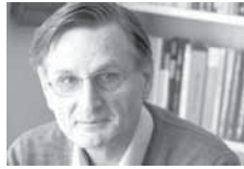
ПОЗВАО САМ ЗОРАНА МИЛАНОВИЋА НА ОСТАВКУ, ЈЕР ЈЕ ПОТПУНО ИЗГУБИО САМОКОНТРОЛУ

Одлуку о министрима донијеће мандатар Тихомир Орешковић, рекао је Карамарко. Карамарко је на свом "Фејсбук" профилу поручио да имају планове који могу подстаћи отварање великог броја радних мјеста и бити замајак привредног опоравка земље. (Танјуг)