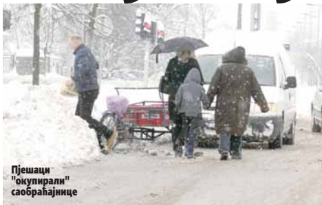
Пешаци "окупирали" саобраћајнице

ЦИЈЕЛОЈ ТЕРИТОРИЈИ ГРАДА ПТЕВИМА, КБЕ У СНУ