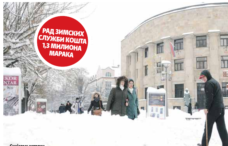
Снијегом затрпан строги центар града

Мјештанка Борика Сања Мркоњић каже да је поражава-