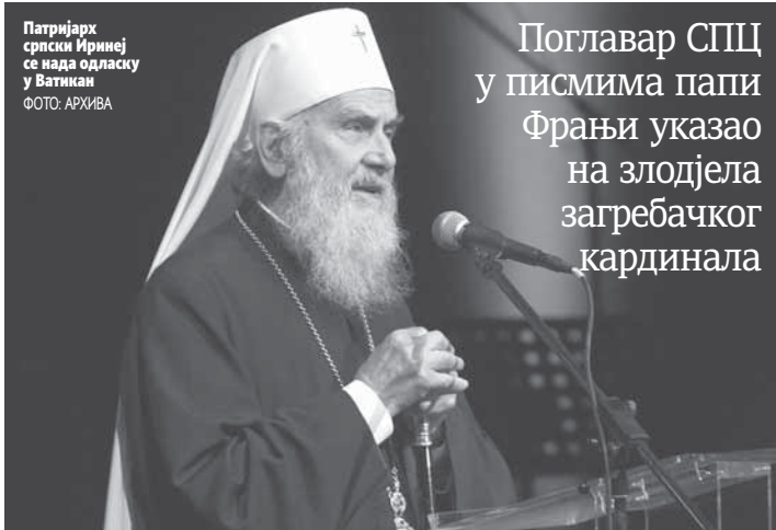
Патријарх српски Иринеј се нада одласку у Ватикан

Поглавар СПЦ у писмима папи Фрањи указао на злодјела загребачког кардинала