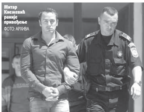
Митар Кнежевић раније привођење