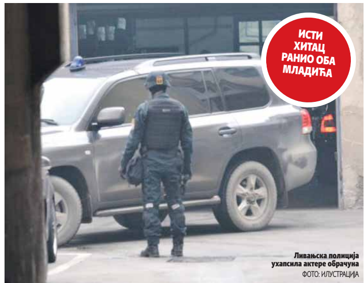
Ливањска полиција ухапсила актере обрачуна