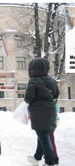
Многи нису чekali зимске службе