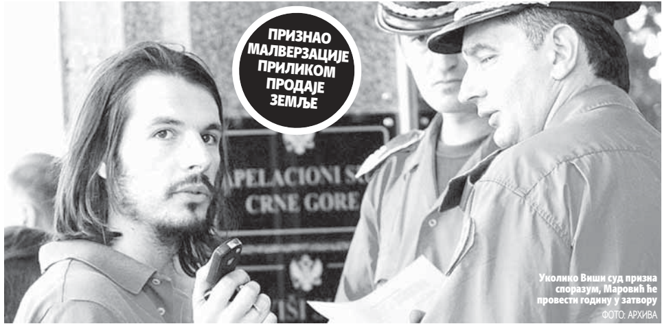
Уколико Виши суд призна споразум, Маровић ће провести годину у затвору