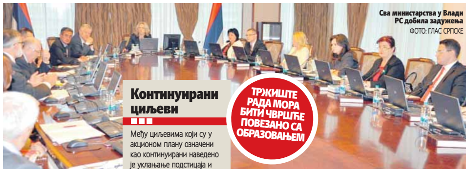
Сва министарства у Влади РС добила задужења

У акционом плану РС наведен је низ задатака на којима ће сви ресори Владе радити ове године, а међу првима је обавеза Министарства финансија да креира стратегију јавне унутрашње финансијске контроле и да створи правни оквир за наплату и рјешавање некавалитетних кредита који су последњих година у константном порасту. Оснивање и суперви-