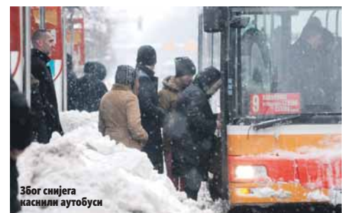
Због снијега каснили аутобуси