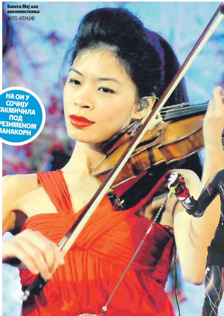
Ванеса Меј као виолинисткиња

Осјетила сам олакшање што сам завршила обје војне на Зимским олимпијским играма, иако сам била посљедња. Пресрећна сам што сам и даље олимпијка, то је фантастична вијест за позитиван