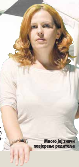
Много јој значи повјерење редитеља

До сада је, како каже, имала доста простора да у представе утка и свој ли-