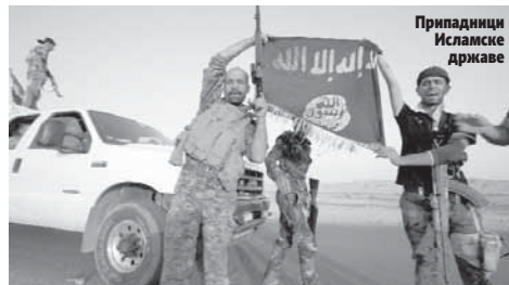
Припадници Исламске државе

Нусра фронт, фракција сириских побуњеника, такође је дио ове терористичке групе и наставља да оперише користећи као тактику бомбаше самоубице. (Агенције)