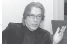
ИВАН ТАСОВАЦ ЈЕ ЈЕДАН ОД НАЧУДНИЈИХ МИНИСТАРА, НЕ САМО ЗБОГ ФРИЗУРЕ НЕГО И ЗБОГ СВОГ СТИЛА И ПОНАШАЊА.

Састанак је раније начелно био планиран за средину мјесеца, али је косовски премијер Иса Мустафа изјавио да Приштина наставља дијалог условљава добијањем визне либерализације за Косово. Стога ће 13. јануара у Београд доћи сарадници високог представника ЕУ за спољну политику Федерике Могерини како би се превазишао најновији застој до којег поново долази због неспремности Приштине, која је мјесецима у политичкој блокади управо због противљења појединих политичких група спровођењу бриселског споразума. (Танјуг)