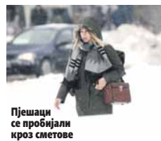
Пешаци се пробавили кроз снегов

- На коловозу су сви јер ни пешаци не могу да се крећу затрпаним тротоарима. Очишћене су само главне улице. И наша стајалишта која нису у ужом центру града су слабо очишћена. До болнице и поликлинике најтеже је доћи јер су тамо највеће гужве. На неким излазима се возила заглављују јер није очишћен снјиг, па се стварају колоне - рекли су у "Мобил таксију".