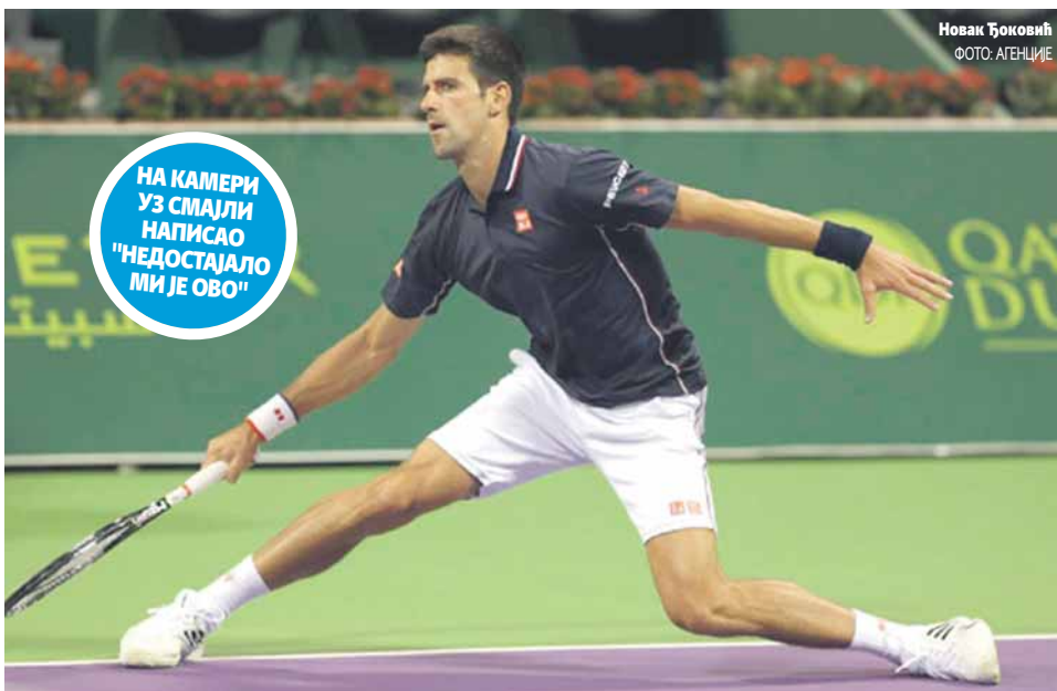
Новак Ђоковић

НА КАМЕРИ УЗ СМАЈЛИ НАПИСАО "НЕДОСТАЈАЛО МИ ЈЕ ОВО"