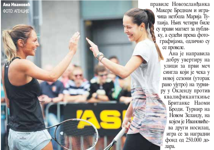
Ана Ивановић