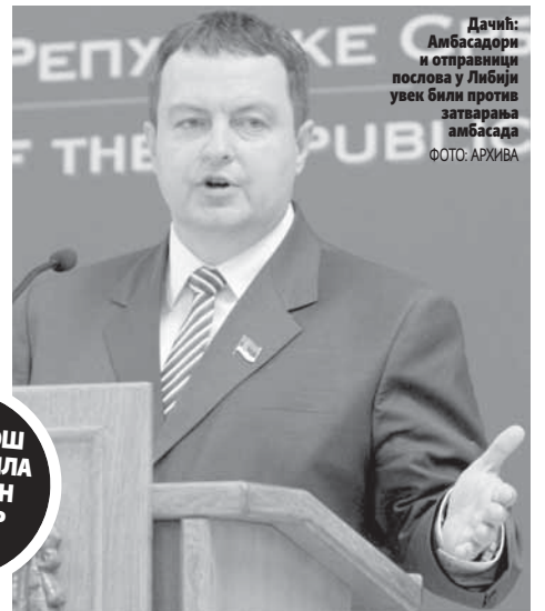
Дачић: Амбасадори и отправници послова у Либији увек били против затварања амбасада.

СРБИЈА ЈОШ НИЈЕ ДОБИЛА ЗВАНИЧАН ОДГОВОР ОД САД