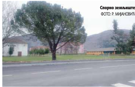
Спорно земљиште

- На основу доказа које је доставио град утврђено је да је спорна парцела у власништву Требиња од 2012. године.