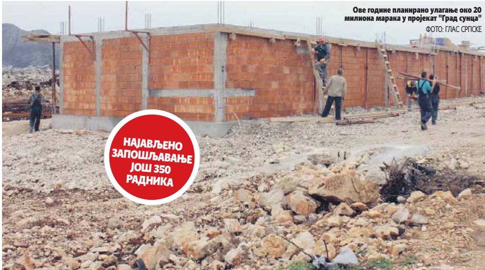
Ове године планирано улагање око 20 милиона марака у пројекат "Град сунца"