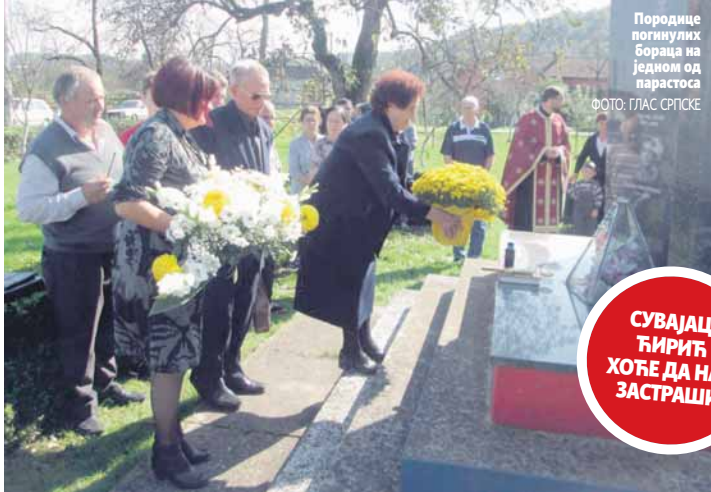
Породице погинулих бораца на једном од парастоса