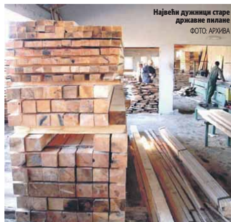
Највећи дужници старе државне пилане