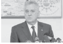
СРЦЕ НАМ ЈЕ НА ИСТОКУ, АЛИ ЖЕЛИМО ДА ЖИВИМО КАО ЗАПАД.

Она се на припремном рочишту, које ће бити настављено у марту, кратко изјаснила да није крива за дјело које јој се стављана терет, а одбрану ће детаљно изнијети на почетку суђења. Беко има статус оштећеног у овом поступку, али јуче није присуствовао припремном рочишту, већ је његове интересе пред судом заступао адвокат Зенко Томановић. Одбрана Адровчеве је предложила да се изврши реконструкција догађаја у дијелу који се односи на њу, док је тужилаштво предложило саслушање свједока који су већ испитани у истрази. (Танјуг)