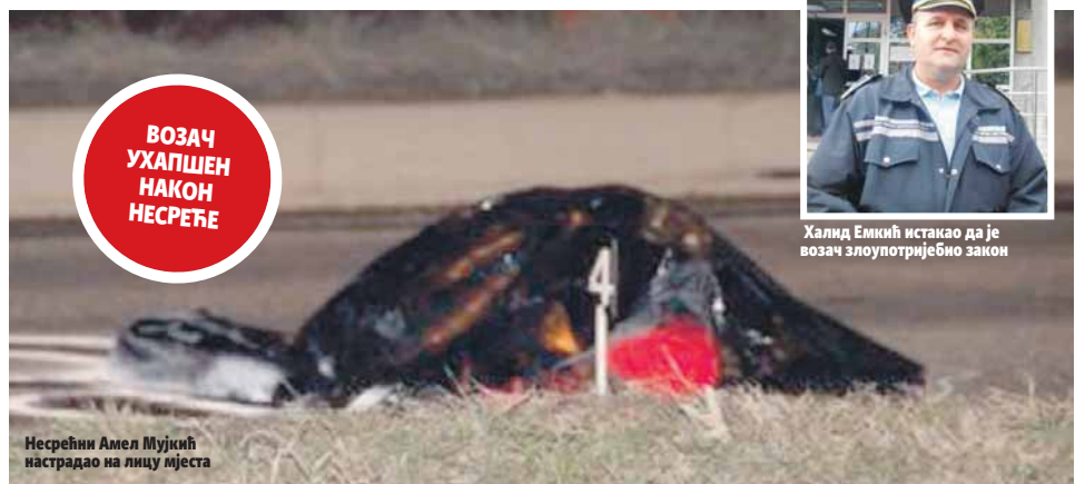
Несрећни Амел Муџић настрадао на лицу мјеста