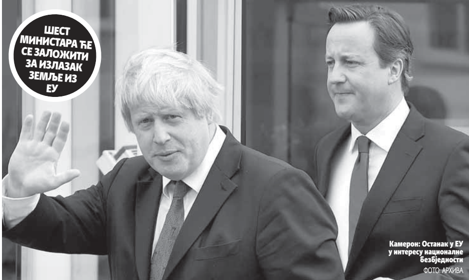
Камерон: Останак у ЕУ у интересу националне безбједности