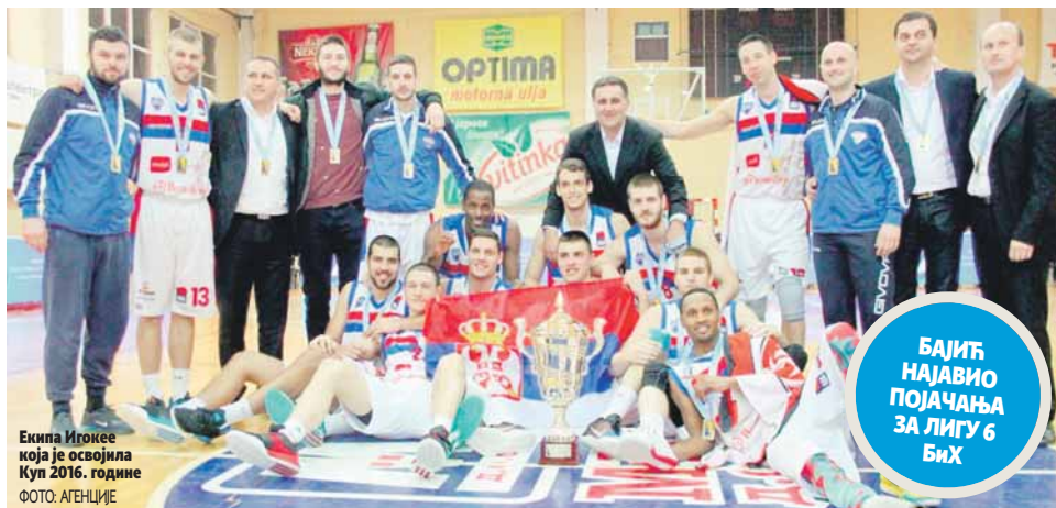
Екипа Игокеа која је освојила Куп 2016. године