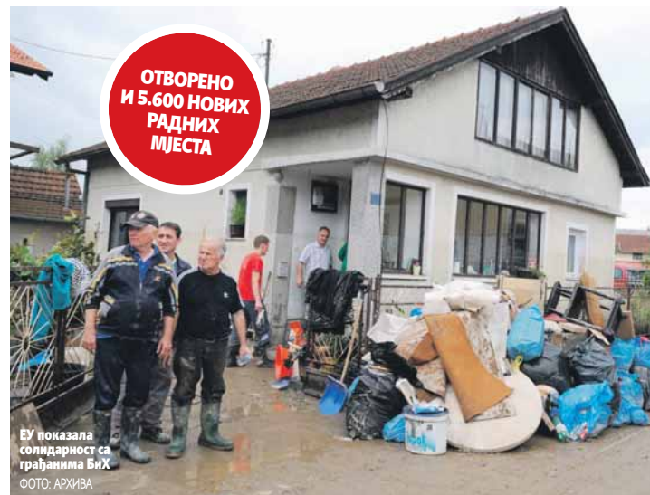
ЕУ показала солидарност са грађанима БиХ

Помоћ је пружена грађанима на директан и конкретан начин било да је ријеч о условима живота, повратку на радна мјеста и у школе или приступу здравственим услугама. У многим случајевима ситуација је сада и боља него што је била прије поплава. Један од резултата активности је и 5.600 нових радних мјеста које смо креирали - казао је Вигемарк захваљујући на подршци и сарадњи UNDP-а и