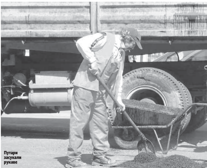
Путари засунали руке

- Тренутно обилазимо терен како бисмо утврдили какво је стање појединих саобраћај-