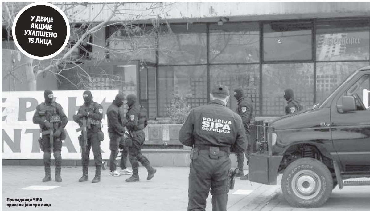
Припадници SIPA привели још три лица

Агенција за истраге и заштиту наставила акције "Корал" и "Танго"