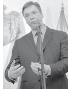
мигрантском кризом, тешка година и у економском и у по-

Вучић је рекао да је пред регионом, који се сјочава и са