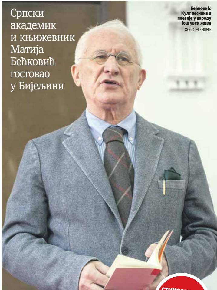
Бећковић: Култ песника и поезије у народу још увек живи

Српски академик и књижевник Матија Бећковић гостовао у Бијељини