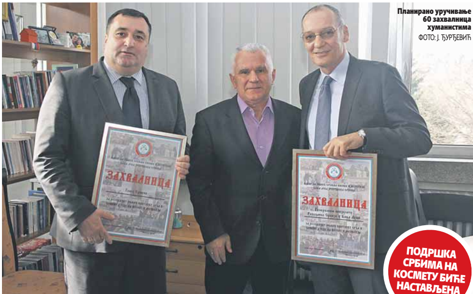
Планирано уручивање 60 захвалница хуманистима

ПОДРШКА СРБИМА НА КОСМЕТУ БИЋЕ НАСТАВЉЕНА