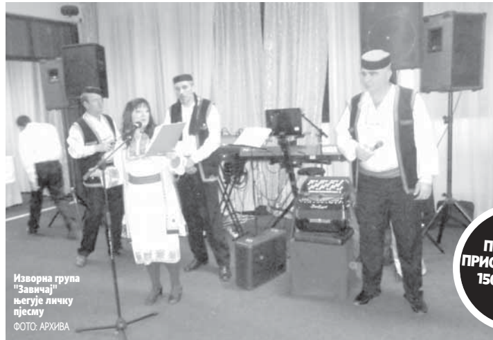
Изворна група "Завичај" његује личку пјесму

Желимо да на своје потомке пренесемо нашу традицију и обичаје, да млађи знају какав је и колико је добар човјек из Лике. Зато нам је дра-