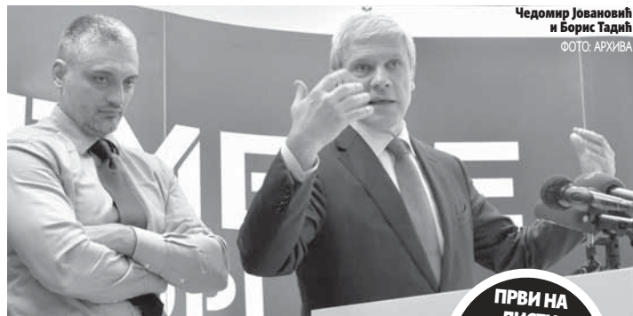
Чедомир Јовановић и Борис Тадић

- Никакав договор није постигнут. Ни око чега од онога што је објављено нисмо се