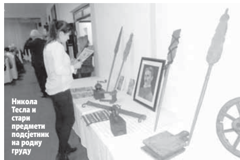
Никола Тесла и стари предмети подјетник на родну груду