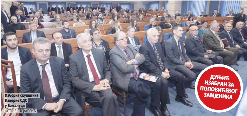
Изборна скупштина Изворне СДС у Бањалуци