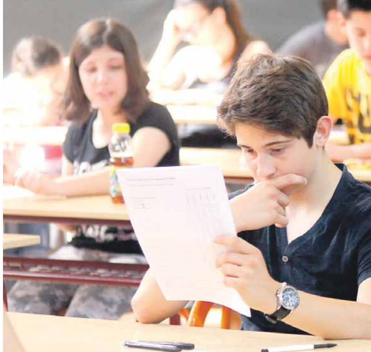
Основци годинама имају исте афинитете

ски бијели мантили и гимназија као подлога за студентске дане.