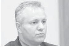
КАКО САМ ИЗАШАО ИЗ ПОЛИТИКЕ ИМАМ МНОГО ВИШЕ ИНСПИРАЦИЈЕ ЗА КОМПОНОВАЊЕ