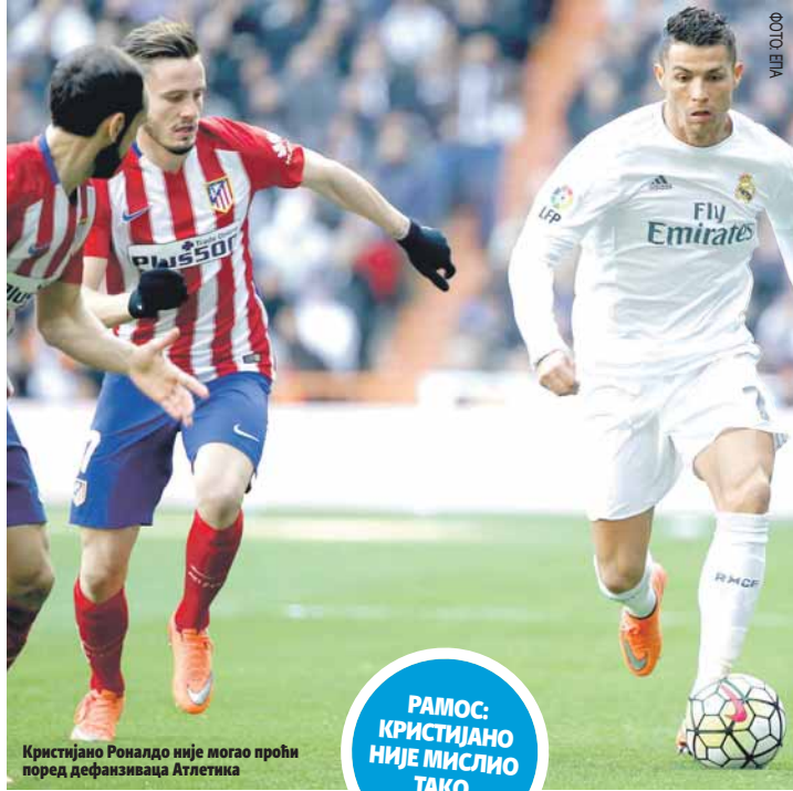
Кристијано Роналдо није могао проћи поред дефанзивца Атлетика