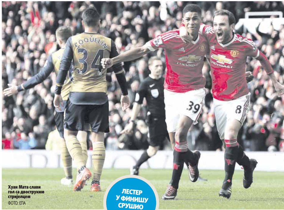
Хуан Мата слави гол са двоструким стријелцем