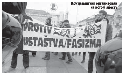
Контрамитинг организован на истом мјесту

Поред црнокошуљаша, који су дозволу за окупљање добили од власти, окупили су се и антифашисти из Радничког