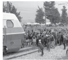
је велика, а јуче је на том мјесту било око 6.500 избјеглица.

Избјеглице нису жељеле да се помјере са пруге, а многи чекају више од седмица дана да пређу у Македонију. Гулжува у кампу на грчко-македонској граници