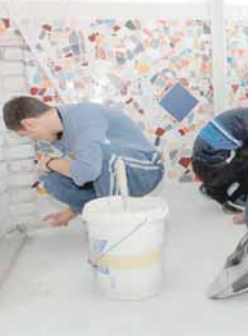
Занатлије лакше долазе до посла