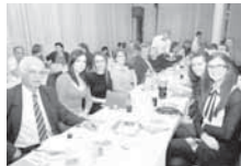
Пуна сала ресторана Угоститељске школе