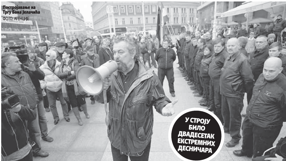
Постројавање на Тргу бана Јелачића