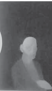
Алекса Милић, кустос уметничке збирке Музеја Козаре

ПОСТАВКУ ЋЕ ЧИНИТИ РАЗЛИЧИТИ ЛИКОВНИ ИЗРАЗИ