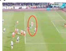
Глођовић досудио офсајд иако се на слици види да је Михајловић био у линији са дефанзивцима Звезде