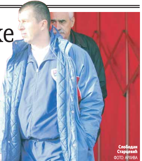
Слободан Старчевић