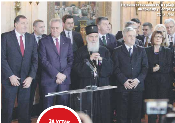
Највиши званичници РС и Србије на пријему у Београду

- Улога Народне скупштине РС у оснивању Републике била је кључна и одлучујућа. Народна скупштина је тако од 9. јануара, дана доношења Декларације о проглашењу Републике српског народа БиХ, па до избора и конституисања нових органа и институција установљених првим Уставом обављала функције државних