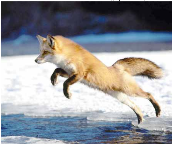
Биће повећан одстрел лисица