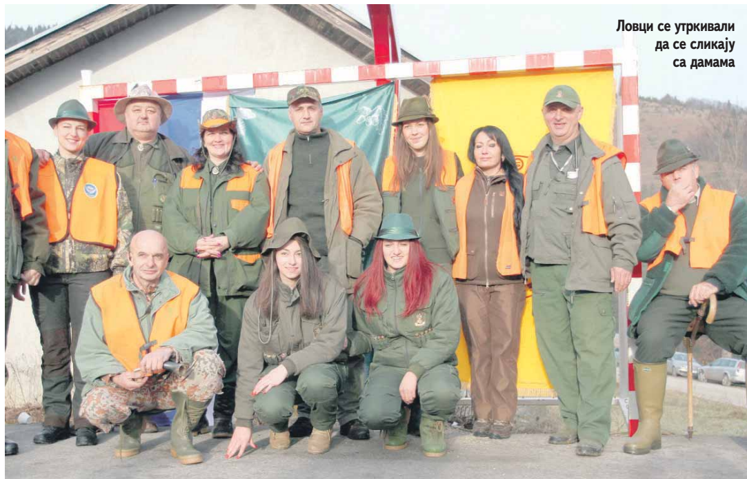
Ловци се утркивали да се сликају са дамама