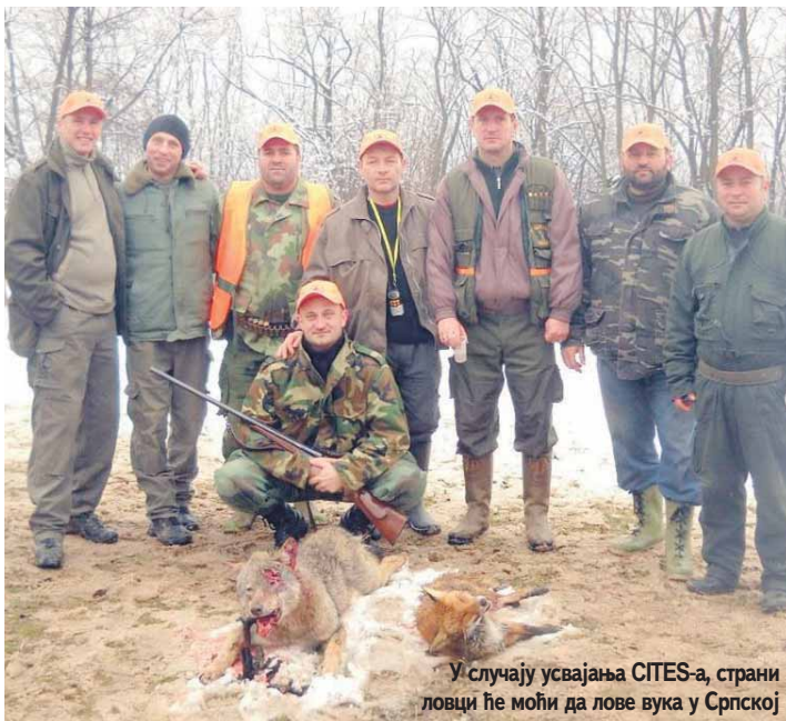
У случају усвајања CITES-а, страни ловци ће моћи да лове вука у Српској

Шуме Српске богате медвједима, али странци не долазе јер не могу да изнесу улов из БиХ