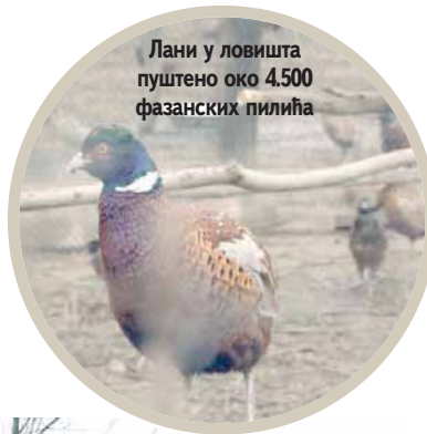
Лани у ловишта пуштено око 4.500 фазанских пилића