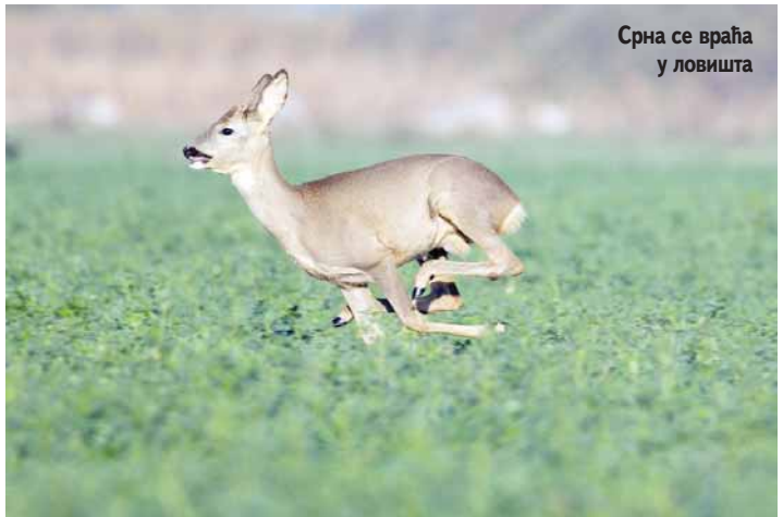
Срна се враћа у ловишта