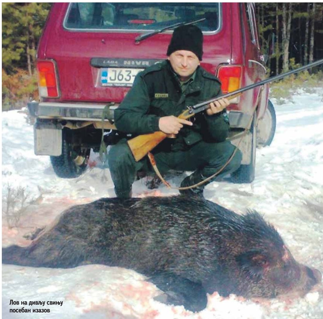
Лов на дивљу свињу посебан изазов

прича, био му је један од најсрећнијих у дјетињству. Од тада се лов дубоко усадио у његово срце.