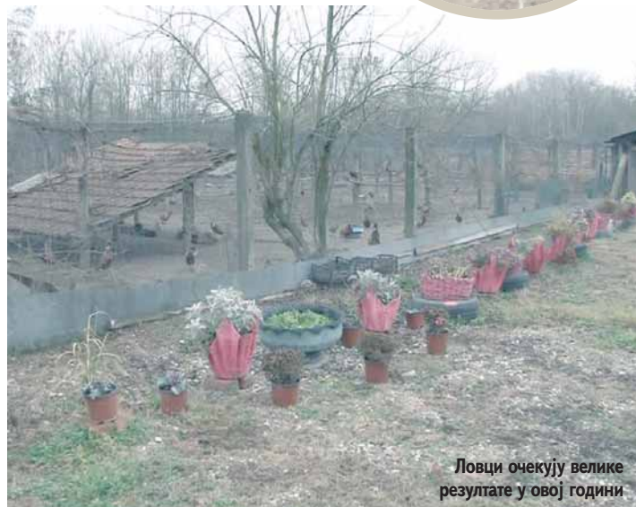
Ловци очекују велике резултате у овој години