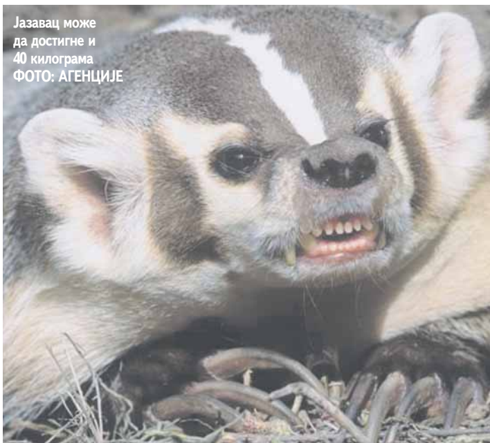
Јазавец може да достигне и 40 килограма

затрпавају се земљом и камењем, али се убрзо на мјесто прогнане често досели нека друга јазавчија породица.