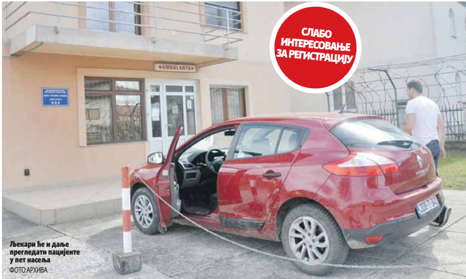
Љекари ће и даље прегледати пацијенте у пет насеља