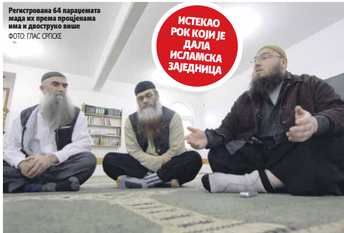
Регистрована 64 параџемата мада их према процјенама има и двоструко више

У БиХ су регистрована 64 параџемата, а према независним информацијама, њихов број досеже и 120. Ријасет Исламске заједнице обавезао је у децембру прошле године муфтије и имаме да организаторима тих параџемата укажу на штетност њиховог дјеловања и да им наложе да престану са одржавањем вјерских активности у нелегалним објектима које користе као месциде. Имами, међутим, нису успјели да у залатом року приволе представнике група да затворе нелегалне месциде и да се прикључе