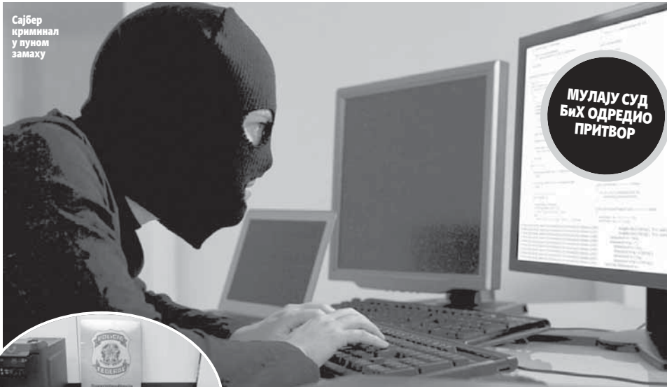
Сајбер криминал у пуном замаку