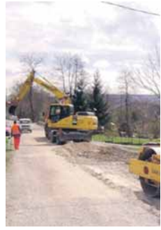
Радана, Милоша Матића, Крајишкој, Вида Симурића. - За ове радове планирано је 600.000 КМ - саопштили су из Градске управе.

У овој години биће обновљен и асфалтни коловоз на градским саобраћајницама - на дијелу Булевара Живојина Мишића, те дијелу улице Српских устаника, те улицама Др Војислава Ђеде Кеџмановића, Милана Радмана, Радоја Домановића, Паве