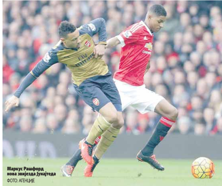
Маркус Рашфорд нова звијезда Јунајтеда

- Не могу да изађем, сутра ме чека тест из хемије - рекао је Рашфорд, који за разлику од преплаћених звијезда "ђавола" седмично зарађује само 500 фунти. На евро-сцени ни постао је најмлађи стријелац клуба, оборивши рекорд легендарног Џорџа Беста, док је у Премијер лиги тре-