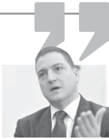
ПОСТОЈИ БОЛНА СЛИЧНОСТ ИЗМЕЂУ СРБИЈЕ И ЗЛОСТАВЉАНИХ ЖЕНА

Службеници српске амбасале у Триполију су убијени у ваздушном удару америчких снага на Сабрату 19. фебруара. Потежица и Ал-Мабрук Милал су на састанку у Триполију такође разговарали о билатералним односима и начинима да се они подстакну у будућности, пише либијски лист "Либија обсервер". Смрт двоје службеника Амбасале Србије у Либији је изазвала тензије у односима између Београда и Вашингтона. Српске власти су саопшtile да су дипломате убијене у експлозији, како је показала обдукција извршена у Београду и Либији, али Вашингтон то негира. (Тањуг)