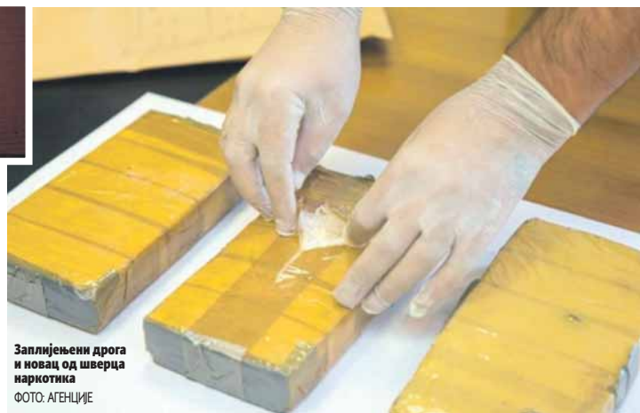
Заплијењени дрога и новац од шверца наркотика