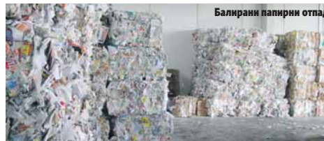
Балирани папирни отпад

жни центар ове године неће бити, јер "ДЕП-ОГ" тренутно не располаже средствима која би уложио у такав пројекат.