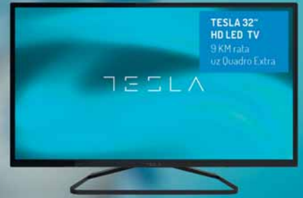
TESLA 32" HD LED TV 9 KM rata uz Quadro Extra