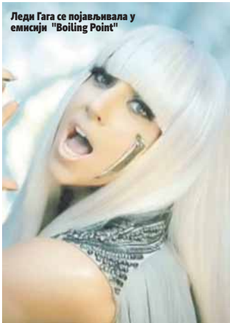
Леди Гага се појављивала у емисији "Boiling Point"