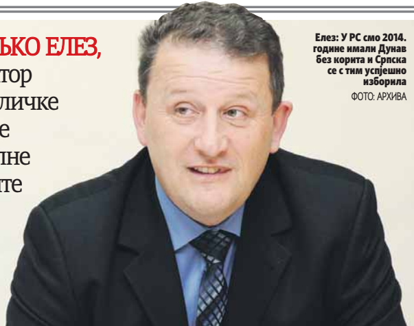
Елез: У РС смо 2014. године имали Дунав без корита и Српска се с тим успјешно изборила

директор Републичке управе Цивилне заштите РС