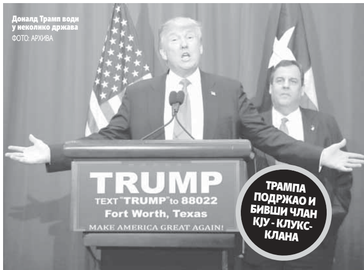
Доналд Трамп води у неколико држава

ТРАМПА ПОДРЖАО И БИВШИ ЧЛАН КЈУ - КЛУКС- КЛАНА