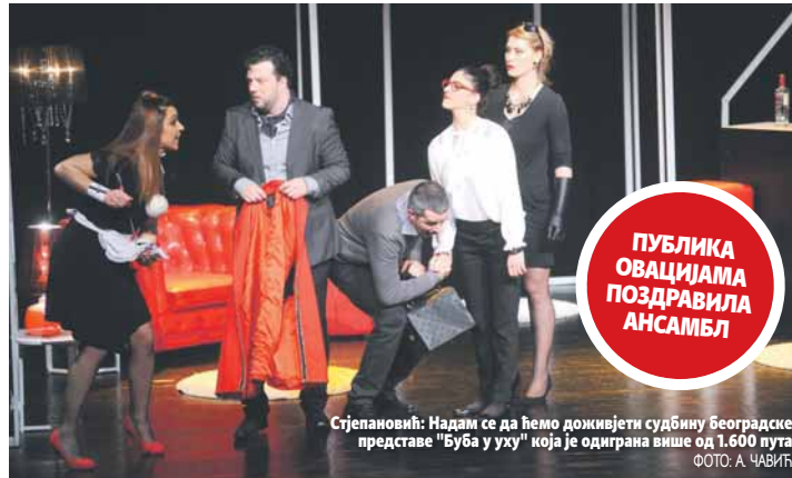
Стјепановић: Надам се да ћемо доживјети судбину београдске представе "Буба у уху" која је одиграна више од 1.600 пута