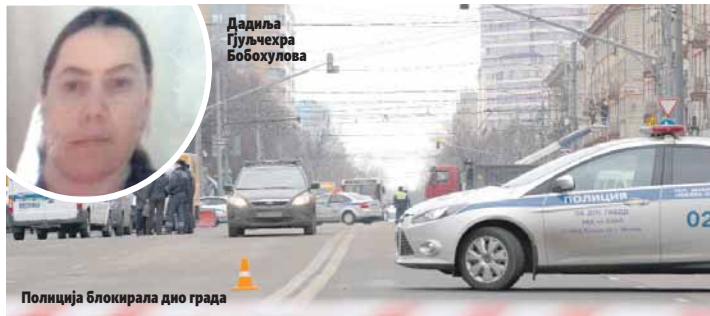
Полиција блокирала дио града

МОСКВА - Дадиља узбекистанског поријекла одсјекла је јуче главу дјевојчици коју је чувала, након чега је са одсјеченом главом у рукама шетала код московске станице метроа вичући "Алаху екбер".