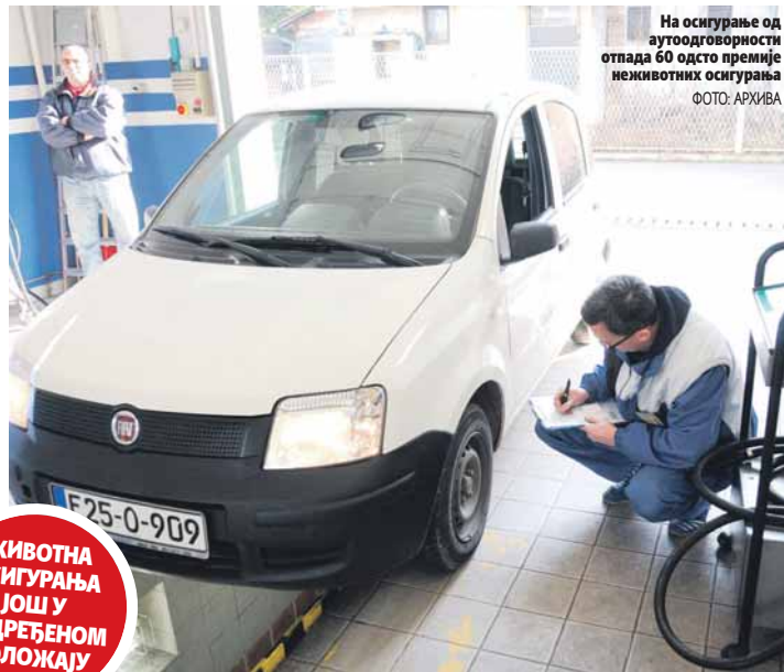
На осигурање од аутоодговорности отпада 60 одсто премије неживотних осигурања

На тржишту осигурања РС лани су пословала 23 осигуравајућа друштва која су примат дала неживотним врстама осигурања, чији је удио у укупној премији 83 одсто. Премија ове врсте осигурања, у којој са око 60 одсто учешћа доминира осигурање од аутоодговорности, лани је износила 151,89 милиона КМ и забиљежила је раст од шест одсто у односу на 2014. годину.