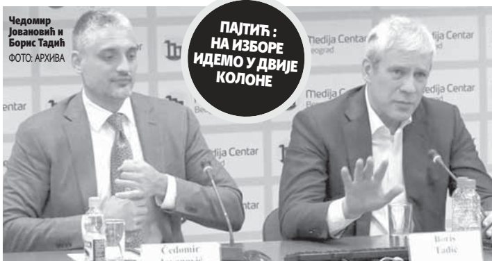
Чедомир Јовановић и Борис Тадић

- Грађане Србије не интересује број мандата нити ко ће с ким у коалицију. Њих интересује животне ствари а ови избори су питање преживљавања Србије - оценио