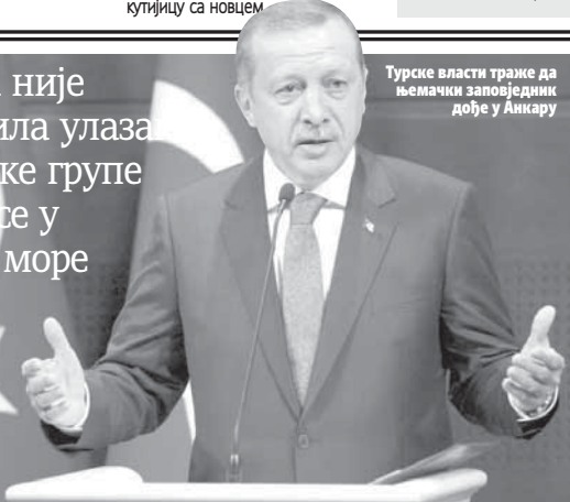
Турске власти траже да њемачки заповједник дође у Анкару

Анкара није дозволила улазак поморске групе Алијансе у Егејско море