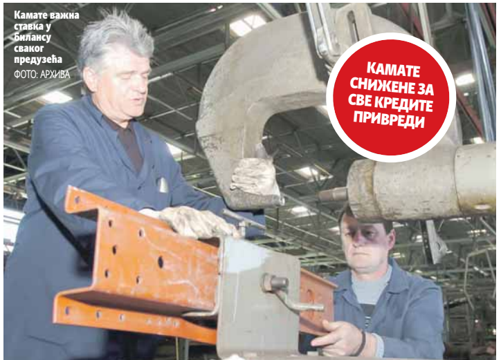
Камате важна ставка у билансу сваког предузећа

Камата је снижена за све кредитне линије које обухватају зајмове за почетне пословне активности, микробизнис у пољопривреди, предузетни-