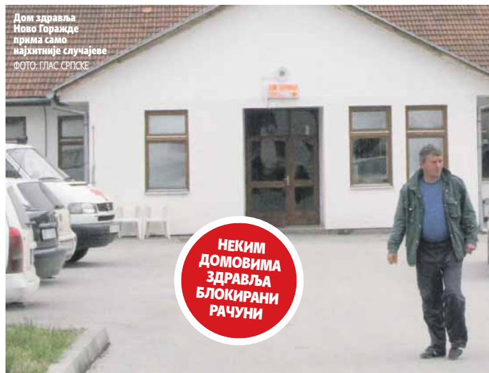
Дом здравља Ново Горажде прима само најхитније случајеве

Осим недостатка новца и мале уплате из Фонда, која је лани, како истиче Дука, за Дом здравља Берковићи била