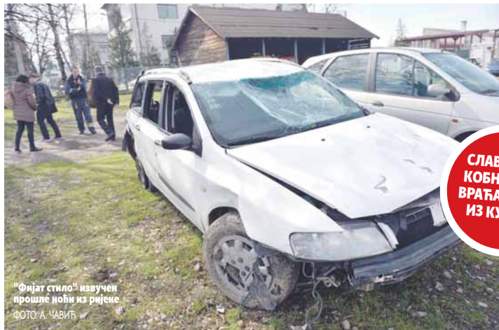
"Фијат стил" извучен прошле ноћи из ријеке

Специјално тужилаштво РС терети Праштала и друге да су несавјесним пословањем приликом куповине акција "ХЛТ фонда" из Подгорице оштетили "ВБ фонд" из Бањалуке, за чији су рачун купили акције, за око 400.000 КМ. Праштало је оптужен и за закључење штепног уговора. Оптужени су ова дјела починили током октобра и децембра 2010. године, а у то вријеме су радили за друштво "Активна инвест", које је управљало "ВБ фондом".