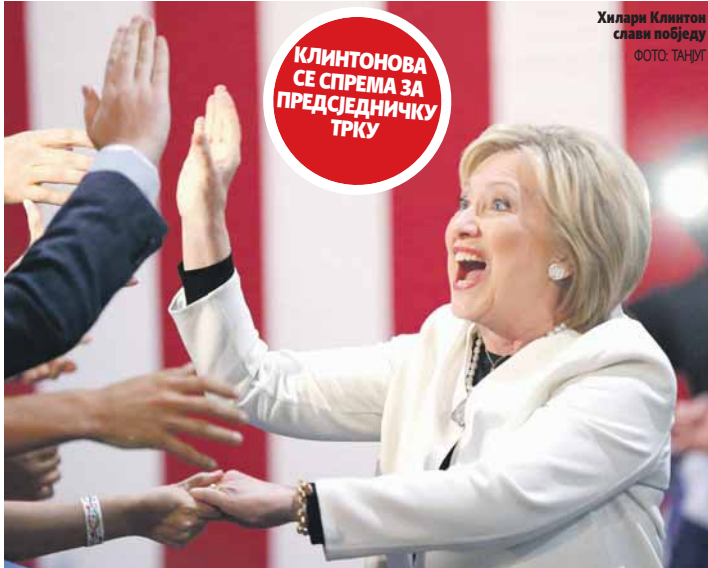
Хилари Клинтон слави побједу

Улог на овим изборима никада није био већи, а реторика коју чујемо са друге