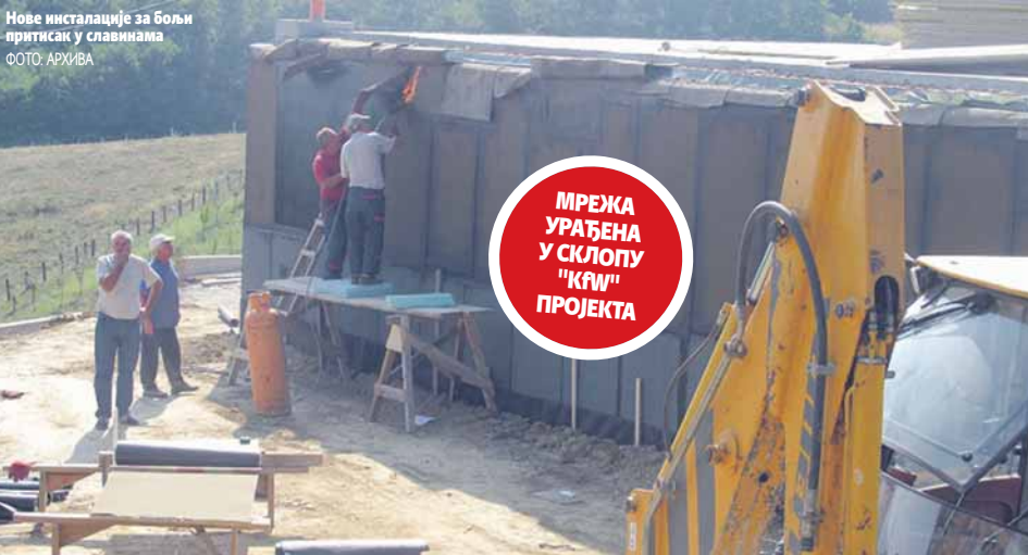
Новe инсталације за бољи притисак у сливинама