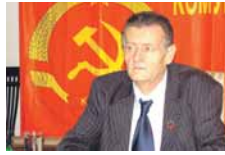
ЖИВИМ КАО ПАС. ОД ДЕДА ЈОСИПА БРОЗА ТИТА ОСТАЛО МИ ЈЕ САМО ПРЕЗИМЕ.

ЈОСИП ЈОШКА БРОЗ, ПРЕДСЈЕДНИК КОМУНИСТИЧКЕ ПАРТИЈЕ