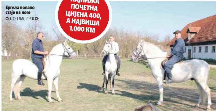
Ергела полако стаје на ноге

НАЈНИЖА ПОЧЕТНА ЦИЈЕНА 400, А НАЈВИША 1.000 КМ