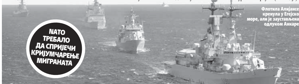
Флотила Алијансе кренула у Егејско море, али је заустављена одлуком Анкаре

АНКАРА - Бродови НАТО-а, послати у Егејско море како би надзирали миграциске путеве Турске и Грчке нису распоређени у