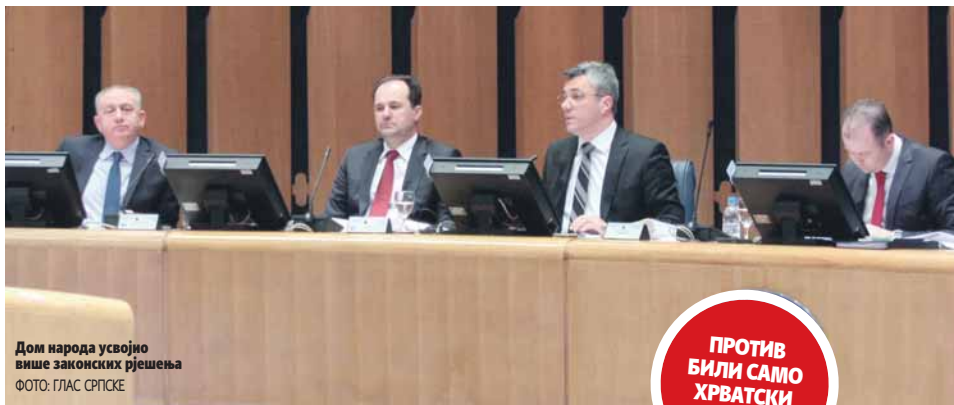
Дом народа усвојио више законских рјешења

- Ово рјешење је апсолутно спроводљиво. Неко жели цијели "бијели хљеб", неко пола "бијелог хљеба", а можда неко жели фртал "бијелог хљеба". Ми, једноставно, не желимо