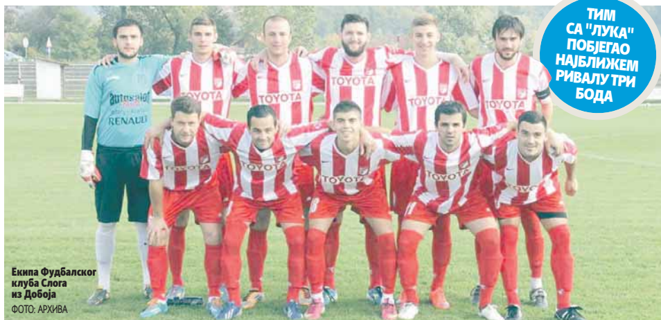
Екипа Фудбалског клуба Слога из Добоја

ТИМ СА "ЛУКА" ПОБЕГАО НАЈБЛИЖЕМ РИВАЛУ ТРИ БОДА