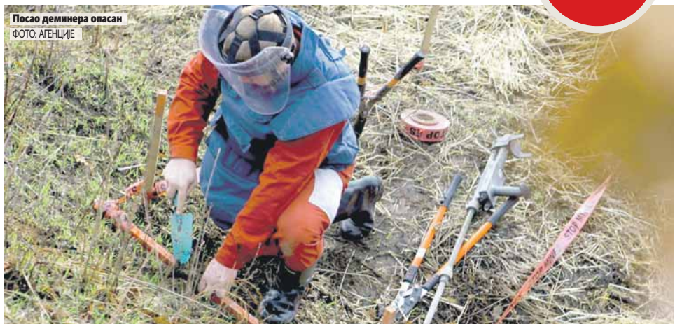
Посао деминера опасан