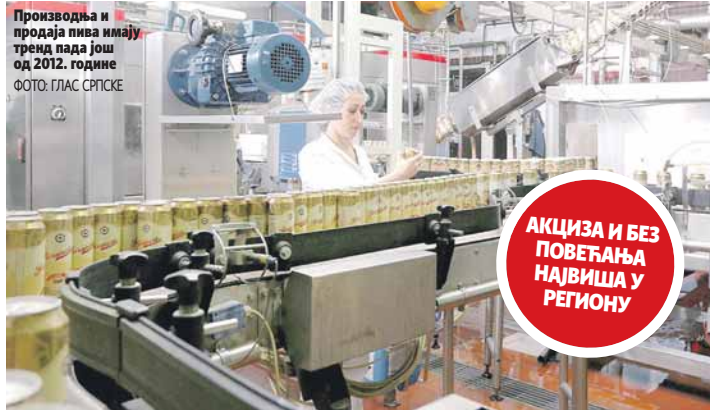
Произвођачи и продаја пива имају тренд пада још од 2012. године

Земље које имају нижу стопу акциза на пиво од БиХ (КМ)