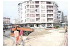
ница ће бити пуштена у употребу - рекли су у Градској управи.

- Тренутно се ради на постављању бабајућег слоја асфалта. По примопредаји од извођача радова ова саобраћај-