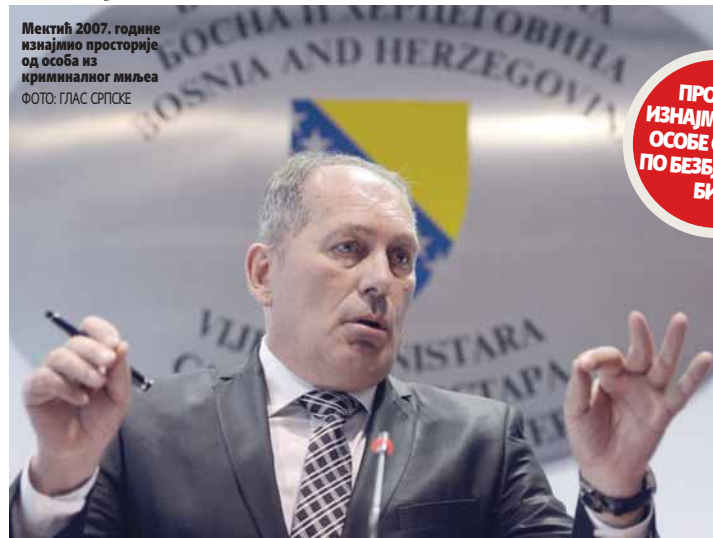
Мектић 2007. године изнајмио просторије од особа из криминалног миљеа

Истакли су то парламентарци који су чланови одбора задужених за надзор над безбједносним сектором и експерти за ту област. Служба за послове са странцима је 2007. године изнајмљивала просторије од фирме "Инсајд Ехо", која је од кире инкасирава милион и по парака. Скандал је испливао на површину када је Обавјештајно-безбједносна