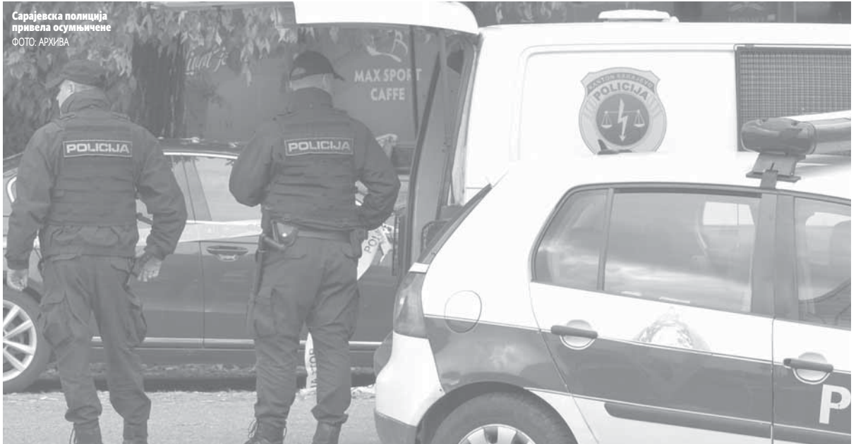
Сарајевска полиција привела осумњичене