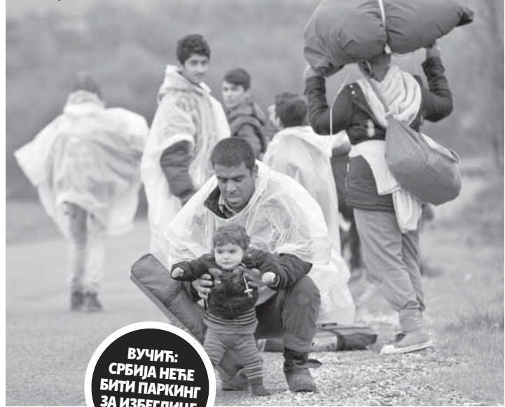
Ниједна избјеглица јуче није из Грчке прешла у Македонију

ВУЧИЋ: СРБИЈА НЕЋЕ БИТИ ПАРКИНГ ЗА ИЗБЕГЛИЦЕ