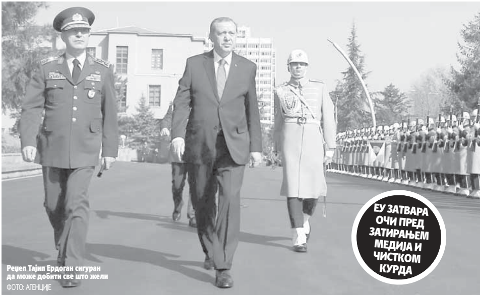
Рецеп Тајип Ердоган сигуран да може добити све што жели

ЕУ ЗАТВАРА ОЧИ ПРЕД ЗАТИРАЊЕМ МЕДИЈИ И ЧИСТКОМ КУРДА