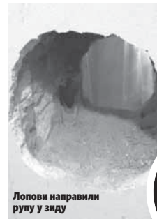
Лопови направили рупу у зиду