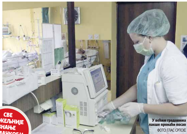
У већим градовима лакше пронаћи посао

Према њеним ријечима, занимање оператера у позивним центрима "попело се" са трећег на друго мјесто, док је угоститељски радника прошле године тражено 35 одсто мање него годину раније.