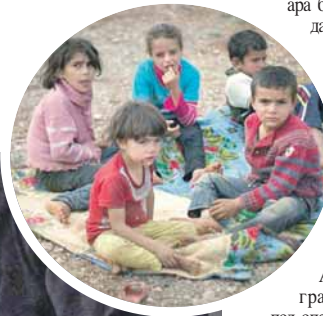
Дјеца уплашена и неухрањена

У опкољеним мјестима гдје снајперисти убијају свакога ко покуша да изађе из града, млади људи умиру на само неколико километара од складишта која су пуна лијекова и осталих медицинских потребштина, наводи организација