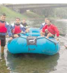
Неријетко сигнализација заврши и у Врбасу