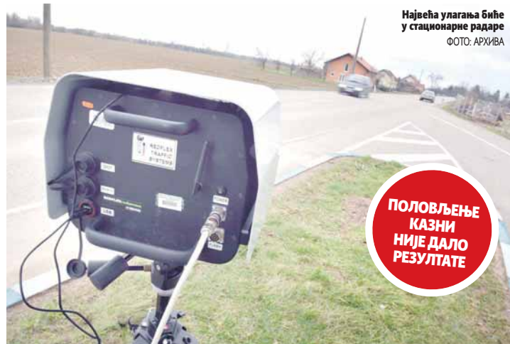
Највећа улагања бие у стационарне радаре