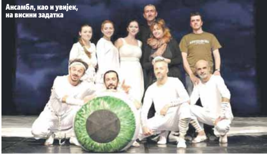
Ансамбл, као и увијек, на висини задатка

Глумци Дјечијег позоришта РС о путовању на престижни фестивал