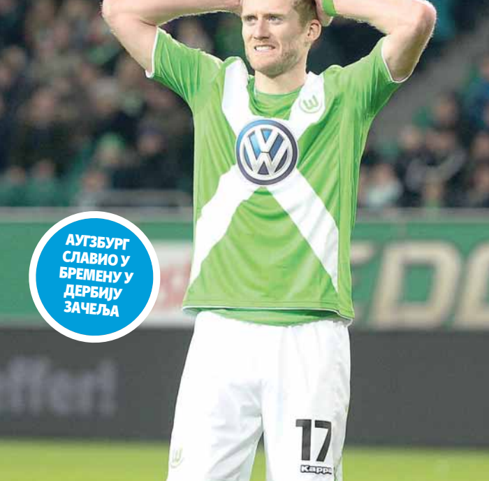
Погодак Андреа Ширлеа недовољан за славље

АУГЗБУРГ СЛАВИО У БРЕМЕНУ У ДЕРБИЈУ ЗАЧЕЉА