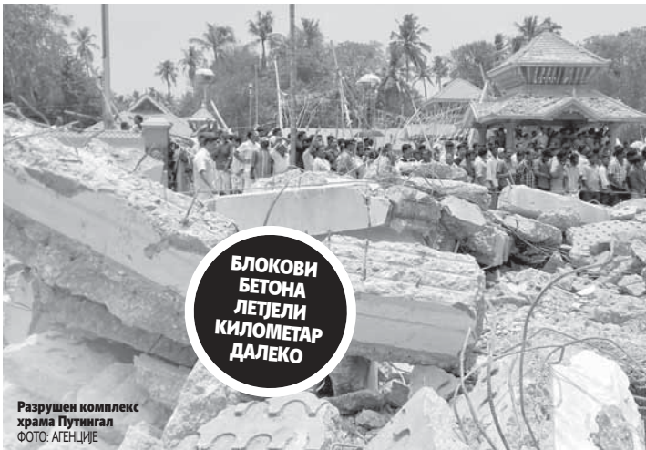
Разрушен комплекс храма Путингал

У комплексу се налазило више хиљада људи кад је дошло до велике експлозије, а затим и до пожара, који се брзо проширио кроз храм и у њему заробио велики број вјерника