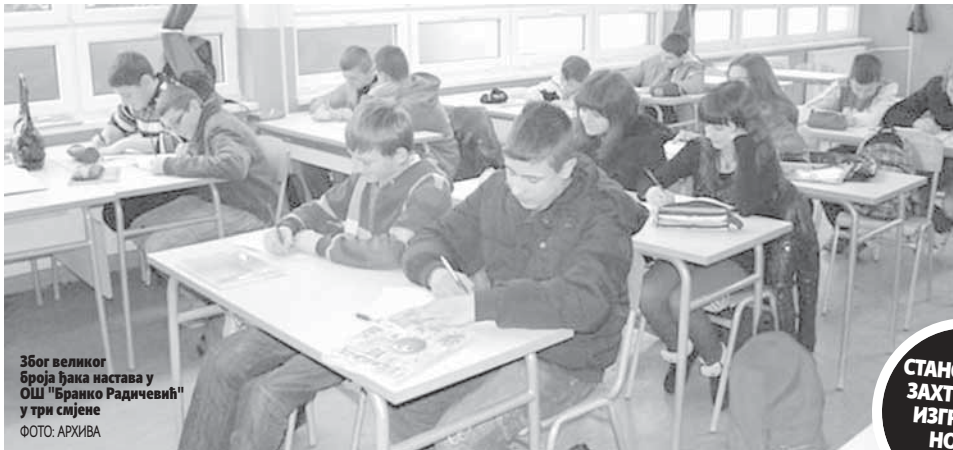
Због великог броја ђака наставу у ОШ "Бранко Радичевић" у три смијене