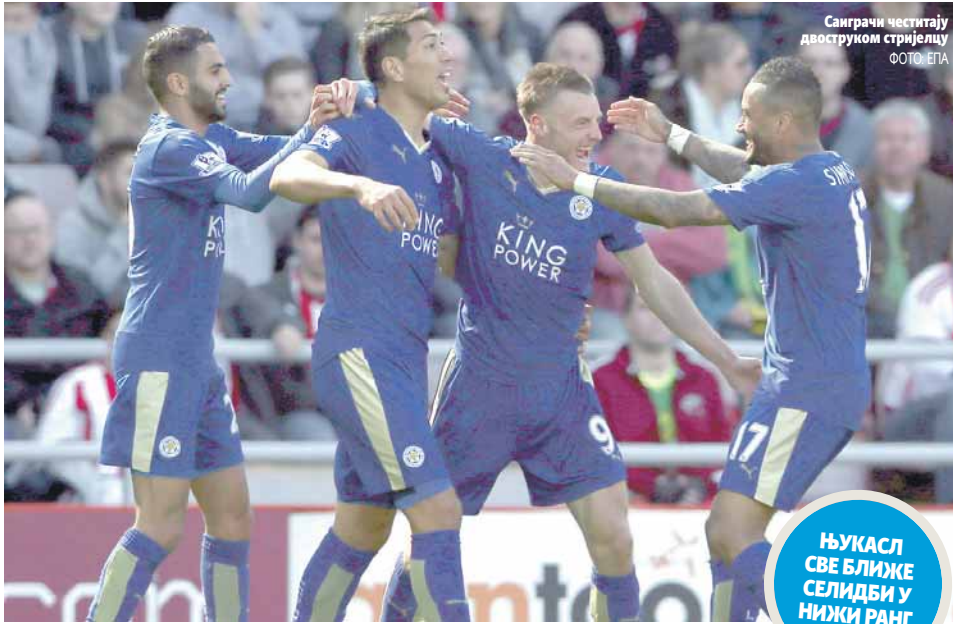
Саиграчи честитају двоstrukом стријелцу