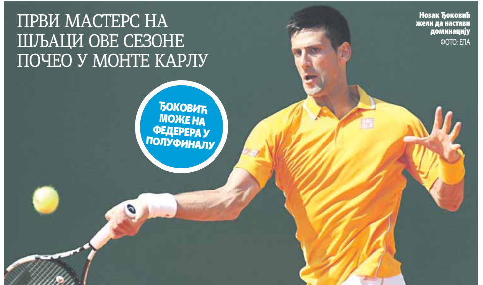
Новак Ђоковић жели да настави доминацију