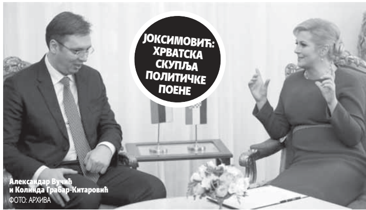
Александар Вучић и Колинда Грабар-Китаровић

- То је сад проблем ЕУ, односно 27 земаља чланица с једне и Хрватске с друге стране. Србија је урадила све што је од ње тражено, више од годину смо припремали акционе