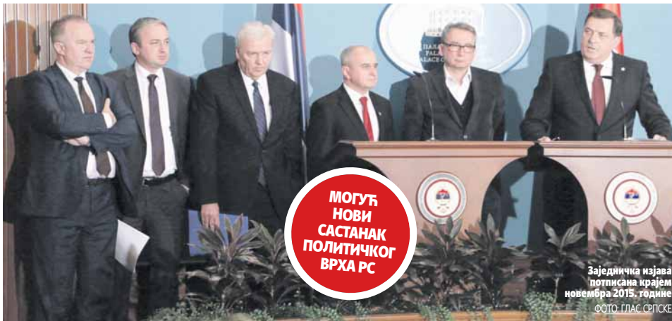
Заједничка изјава потписана крајем новембра 2015. године

Договорили смо се да се, ако не буде усвојен закон, иде на референдум. Нема ниједног разлога да сада било ко повлачи сагласност, навео Додик. Најважније да смо отворили процес и да су странке и даље иза истог циља, казао Бореновић