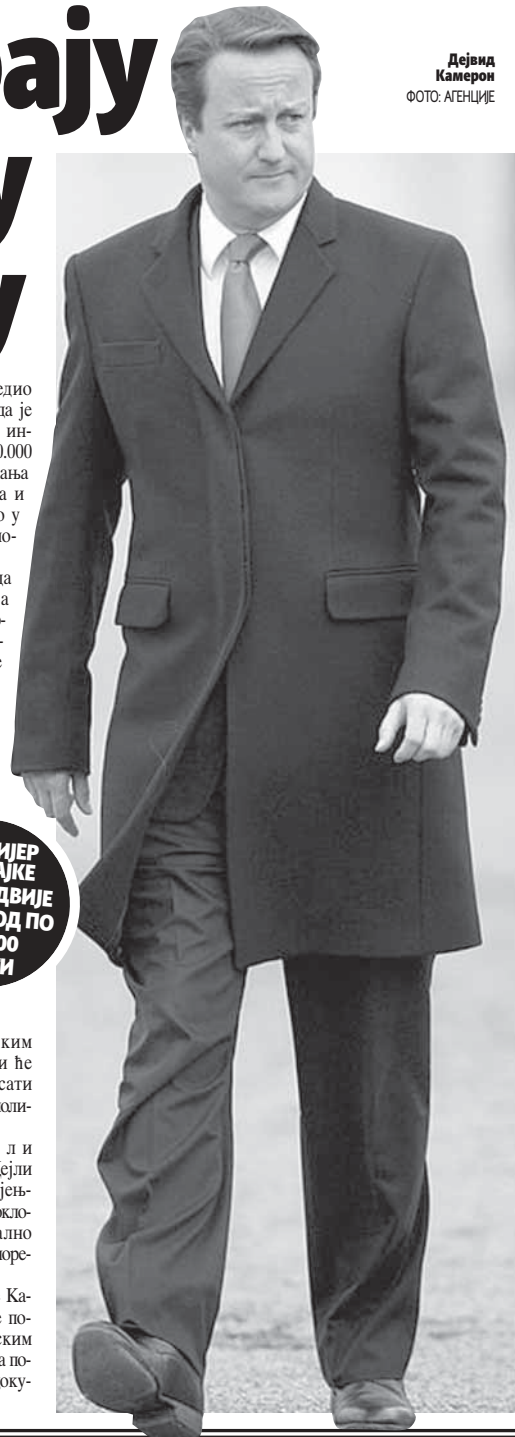
Дејвид Камерон

Очекује се да ће Камерон објавити резултате пореске истраге о британским компанијама и појединцима поменутих у "панамским документима". (Агенције)