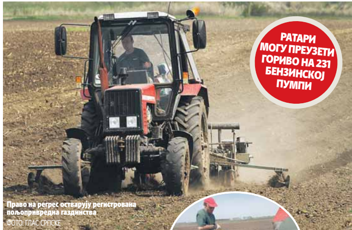
Право на регрес остварују регистрована пољопривредна газдинства.

- Почетак продаје потврдила је групација "Нестро петрол" која има 73 бензинске пумпе на