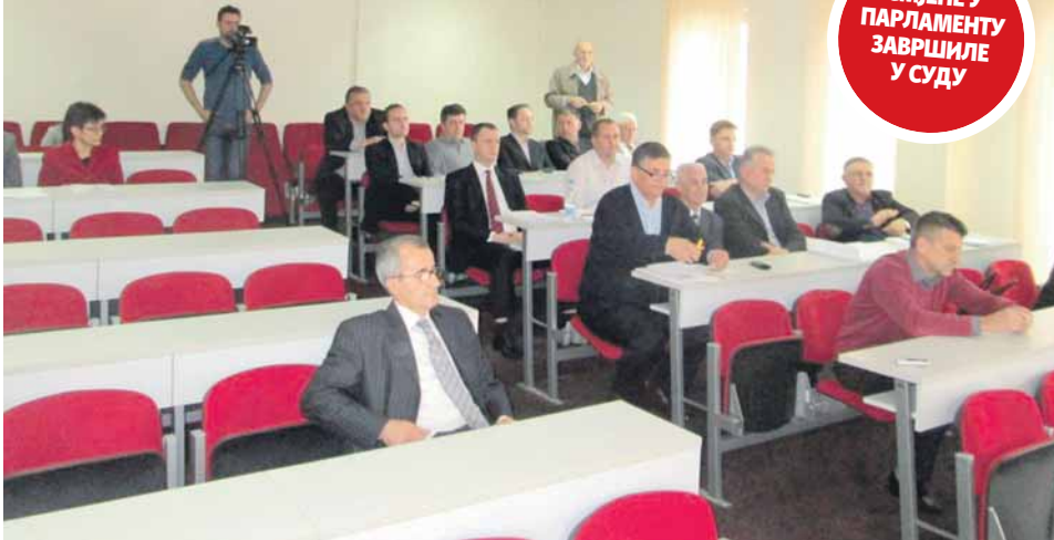
Полупразна скупштинска сала на једној од сједница које је бојкотовала опозиција