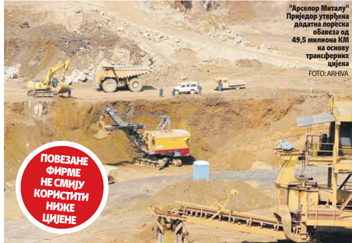
"Арселор Миталу" Приједор утврђена додатна пореска обавеза од 49,5 милиона КМ на основу трансферних цијена