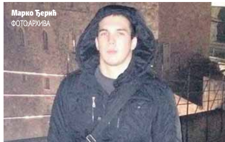
Марко Ђерић ФОТОАРХИВА

ПИСАЧ: НЕБОЈША ТОМАШЕВИЋ ntomasevic@glassrpske.com