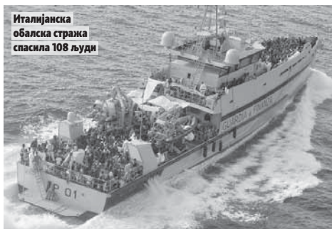
Италијанска обалска стража спасила 108 људи

Приватни спасилачки брод "Акваријус", којим управља хуманитарна група "СОС Медитеран", пронашао тијела на једном гуменом чамцу. Међу спасенима пет жена