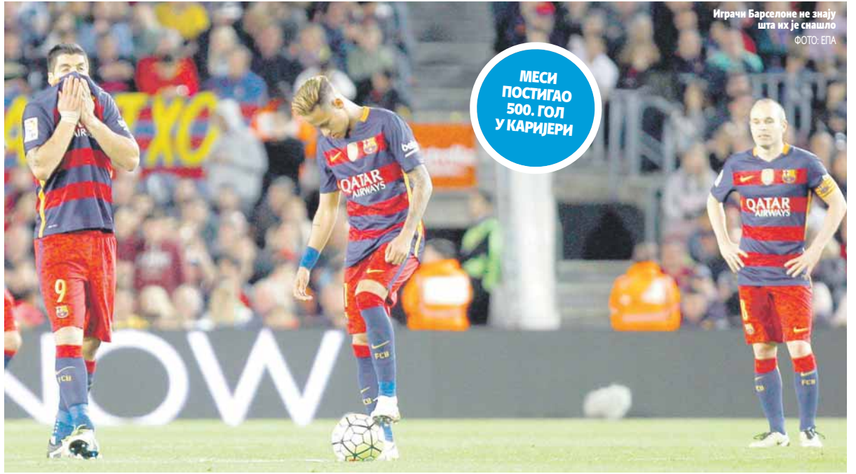
Играчи Барселоне не знају шта их је снашло