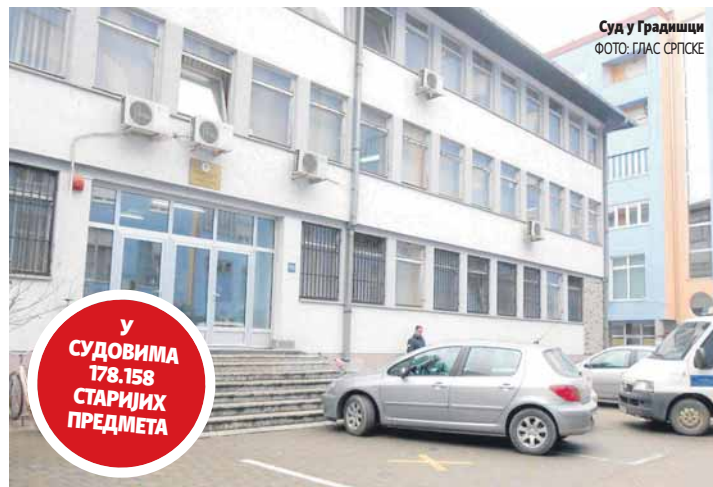
Суд у Градишци

У најлошијој позицији је суд у Сребреници са учинком од 13 одсто јер су од 1.711 старих предмета ријешили само 222. Основни суд у Градишци