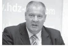
МОСТ СЕ ПОСЉЕДЊЕ ТРИ ГОДИНЕ НИЈЕ БАВИО НИЧИМ ДРУГИМ ОСИМ АРХЕОЛОГИЈОМ МОГ РАДА У ПРЕТХОДНИХ 16 ГОДИНА

Кабинет предсједника Иванова у Тетову нашао се на удару након што је он одлучио да абсолира политичаре одговорне за аферу "Прислушкивање". (Танјуг)