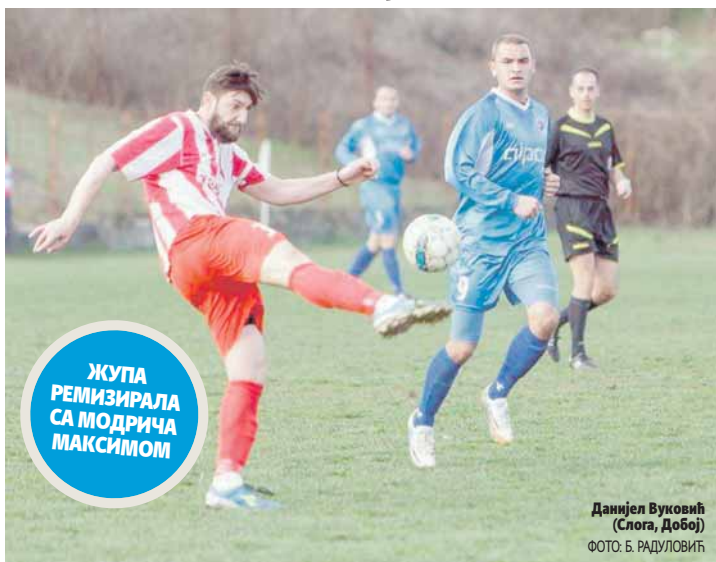
ЖУПА РЕМИЗИРАЛА СА МОДРИЧА МАКСИМОМ

Добојлије без већих проблема на гостовању у Козарској Дубици савладали домаћи Борац са 5:0 и задржали три бода предности у односу на најближег пратиоца Омарску