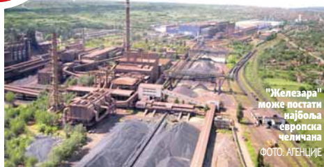
"Железара" може постати најбоља европска челичана