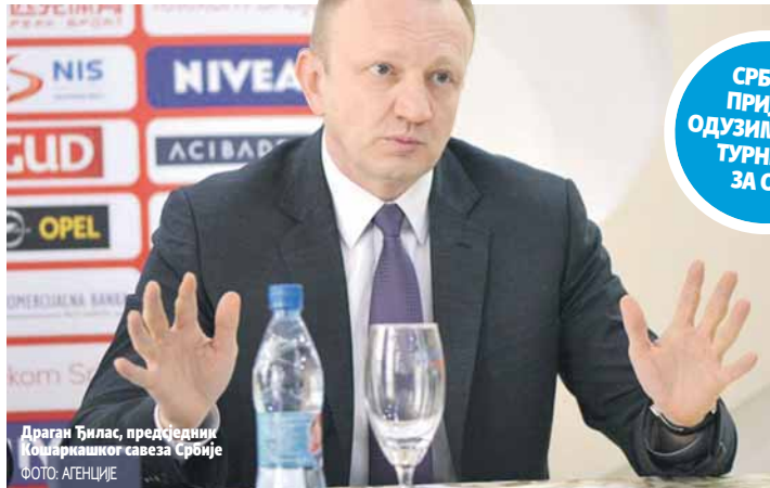
Драган Ђилас, председник Кошаркашког савеза Србије

- Није спорно да ФИБА прихвата да први иде у Евролигу, а ако је тако, не видим зашто би Евролига сама имала и друго такмичење. Зар није