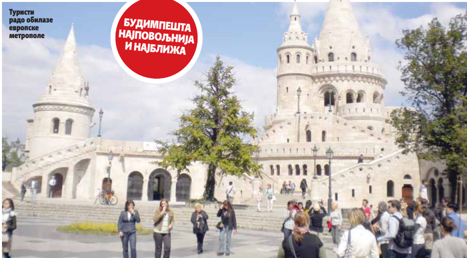
Туристи радо обилазе европске метрополе

Туристички радници објашњавају да се за путовања у Брисел, Париз и Истанбул готово нико не распитује, због страха послједије терористичких напада. Европске дестинације су међу најпопуларнијим и у ту-