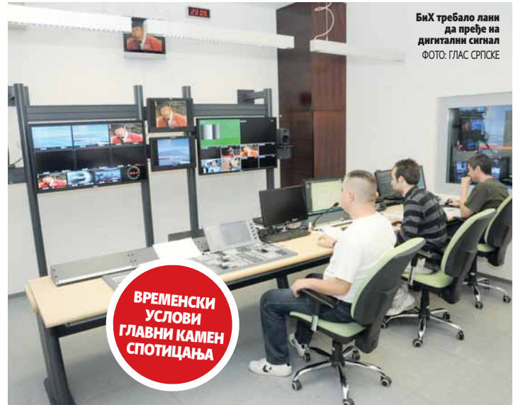
БиХ требало лани да пређе на дигитални сигнал