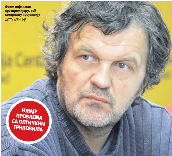
Филм није имао претпремијеру, већ контролну пројекцију