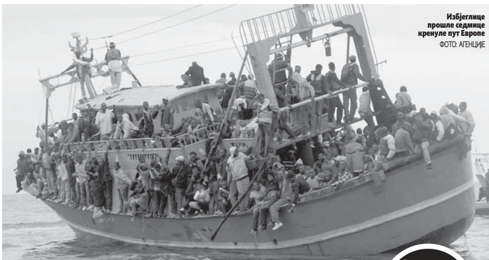
Избјеглице прошле седмице кренуле пут Европе