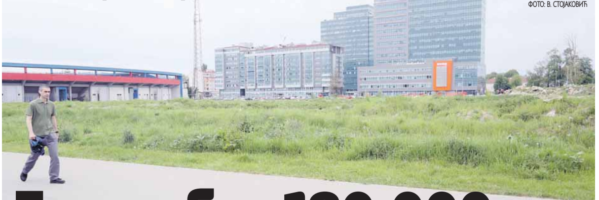
Мјесто на којем је планирана изградња помоћног терена