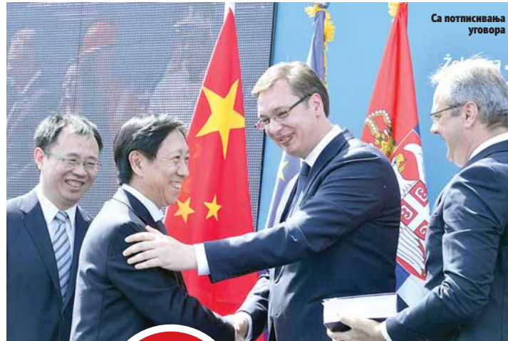
Са потписивања уговора

Ова компанија је у 2015. години произвела 47,8 милиона тона челика, пословни