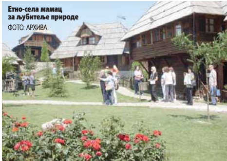
Етно-села мамац за љубитеље природе

Разноврсне понуде, а специјално за два велика празника