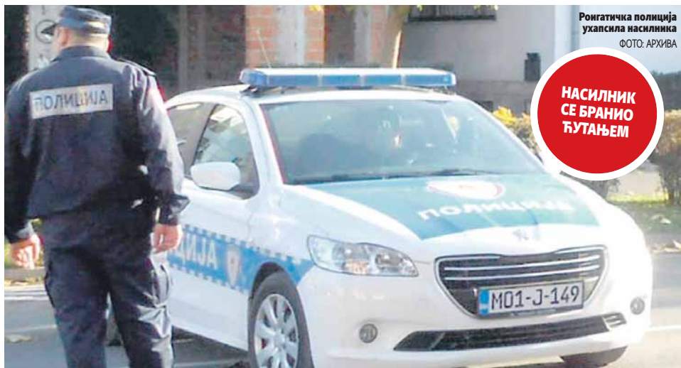
Рогатичка полиција ухапсила насилника

РОГАТИЧАНИН УХАПШЕН ЗБОГ НАПАДА НА ДЈЕВОЈКУ