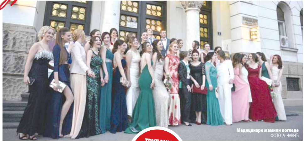
Медицинари мамиле погледе

Матурант општег смјера Душко Тица казао је да га је