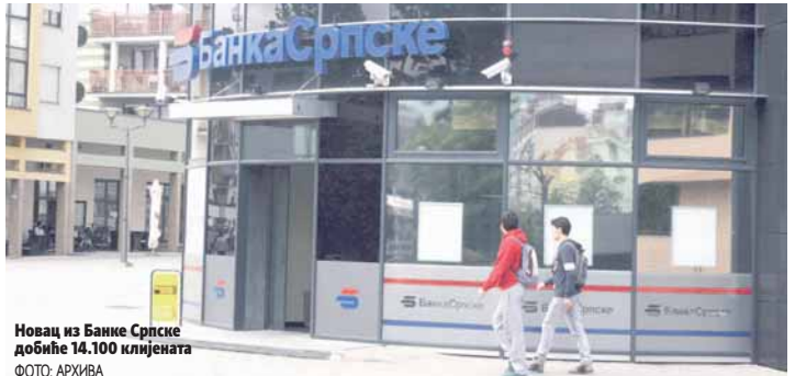
Новац из Банке Српске добиће 14.100 клијената