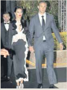
Најпознатија манекенка "Викторијас сикрета" и бивша српска снајка Адријана Лима појавила се први пут на црвеном тепиху

са новим дечком Великим Џоом. Тридесетчетворогодишња манекенка прошетала је Каном у црној одјевној комбинацији, а њен нови момак, ММА борац, био је врло заштитнички настројен према својој лепшој половини. Ово је први пут да се на неком великом догађају Лима појавила у друштву новог дечка, али је пред фотографима, на црвеном тепиху ипак позирала сама. Црна хаљина са бијелом чипком није оставила јак утисак на критичарем који познају Адријанина боља издања.