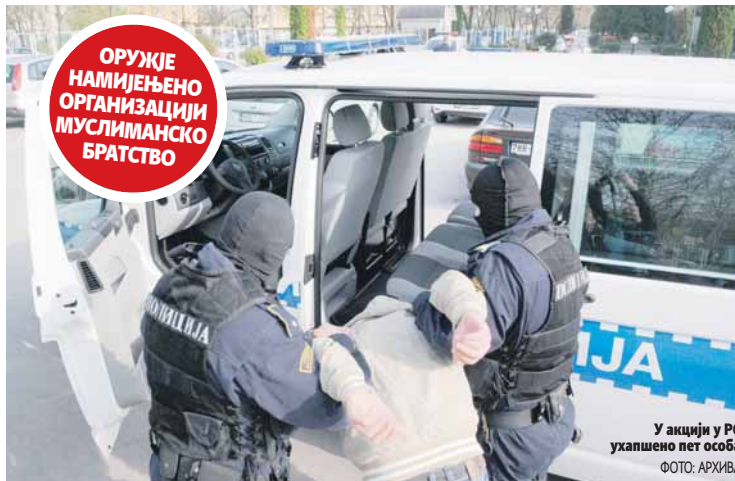
У акцији у РС ухапшено пет особа

Од безбједносних служби Шведске стигла информација да је више од десет терориста Исламске државе ушло у ту земљу међу избјеглицама и да припремају терористичке нападе у Стокхолму. Оружје требало бити продато управо њима