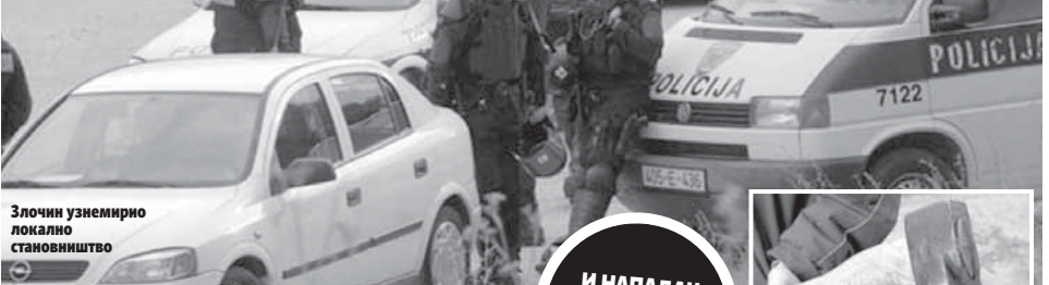
Злочин узнемирио локално становништво