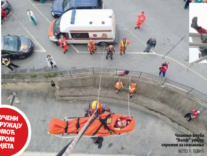
Чланови клуба "Волф" увијек спремни за спасавање