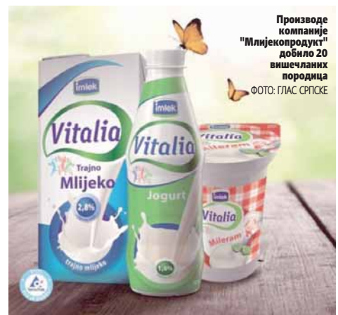
Производе компаније "Млијекопродукт" добило 20 вишечланних породица

Међународни дан породице обиљежава се, према одлуци Генералне скупштине УН од 1993. године, са циљем подизања свијести јавности о значају породице и подстицања јавности за пружање подршке породицама, нарочито оних које су