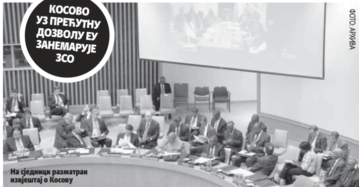
На сједници разматран извјештај о Косову

Руски представник је оцијенио да је Косово лидер по броју бораца који се боре на страни Исламске државе и рекао да је то безбједносни про-