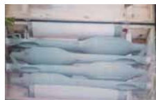
Оружје заплијењено у акцији акцији "Волф"