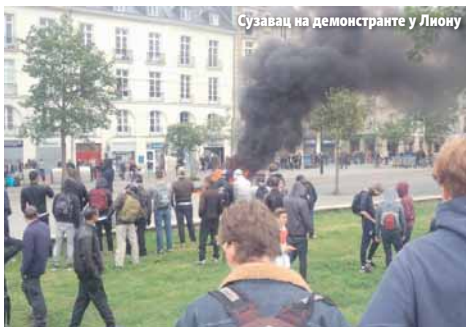
Сузавца на демонстранте у Лиону

ПАРИЗ - Седам француских синдиката дозволило је јуче на штрајк због предложених измјена закона о раду, а камioniје су блокирале саобраћај широм земље, док су истовремено демонстран-