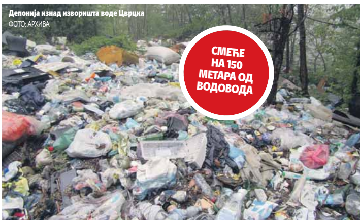
Депонија изнад изворишта воде Церцка

Становници готово цијеле општине са тог изворишта пију воду, али то изгледа није довољан разлог да депонија буде санирана. Обраћали смо се безброј пута општинским властима и још ништа није урађено, рекао Бекић