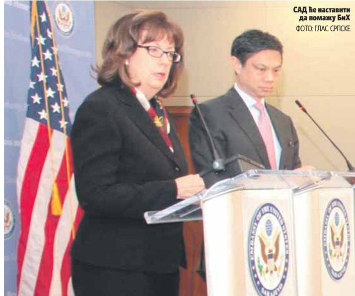
САД ће наставити да помажу БиХ