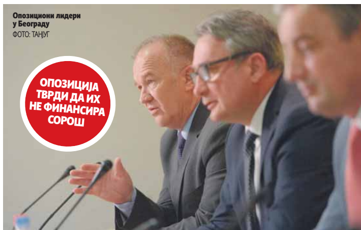
Опозициони лидери у Београду

- Ријеч је о чистој неистини и ублашком методу дисквалификације људи и организованог кампањи против истине, што нисам очекивао из Србије. Главни разлог за наш долазак је неvjероватна количина лажи и дезинформација великим дијелом пласираних из Београда и београдских медија - рекао је Босић. Чавић је рекао да је спре-