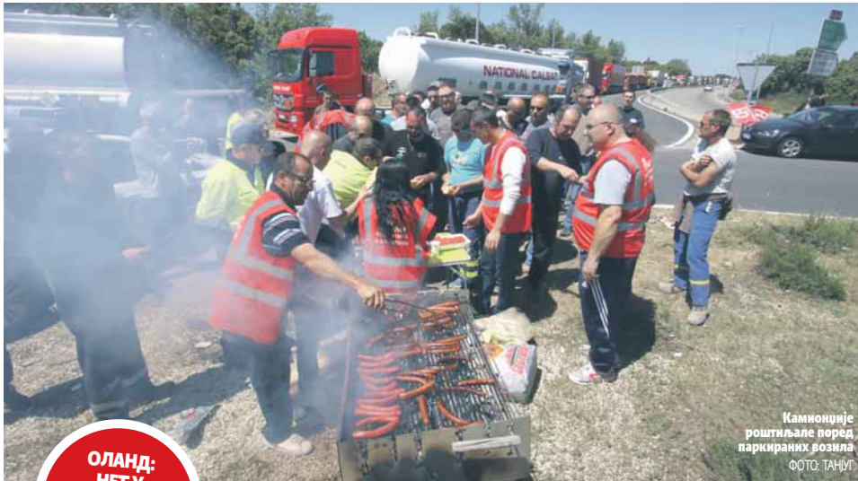
Камioniје роштиле поред паркираних возила