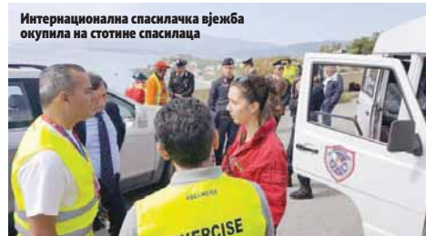
Интернационална спасилачка вјежба окупила на стотине спасилаца

Због показаних одличних способности и постигнутих резултата у Италији чланови Спасилачког клуба "Волф" позвани су на спасилачку вјежбу у Атини, која ће бити одржана од 2. до 5. јуна, а потом у новембру на вјежбу у Португалију.