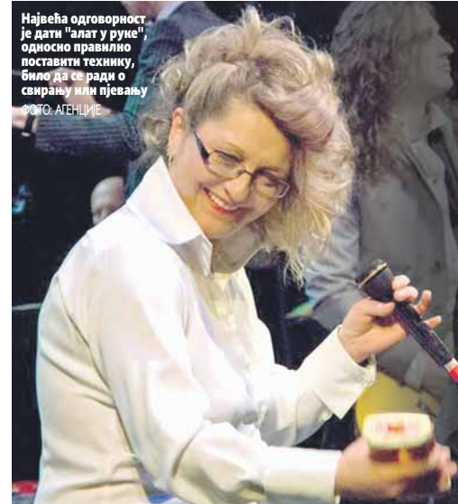
Највећа одговорност је дати "алат у руке", односно правилно поставити технику, било да се ради о свирању или пјевању