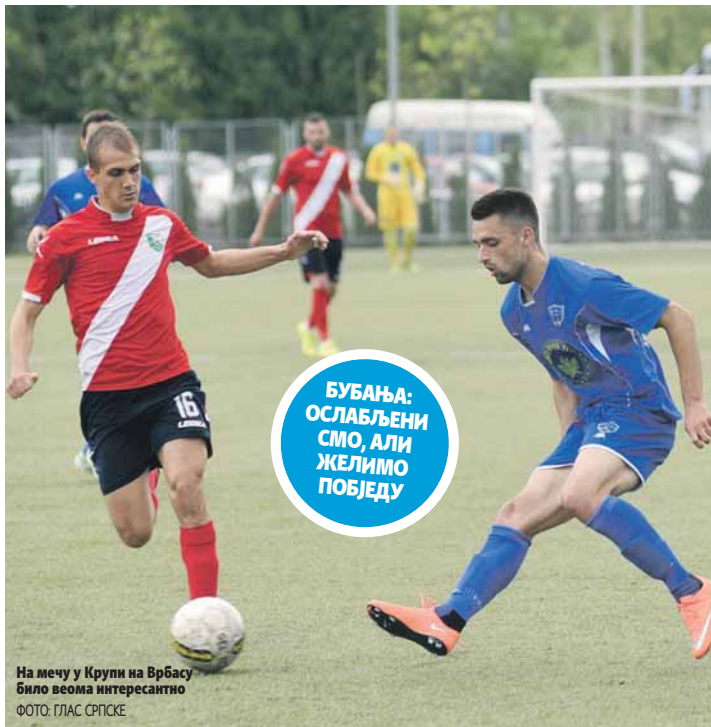
На мечу у Крупи на Врбасу било веома интересно