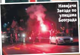
Навијачи Звезде по улицама Београда