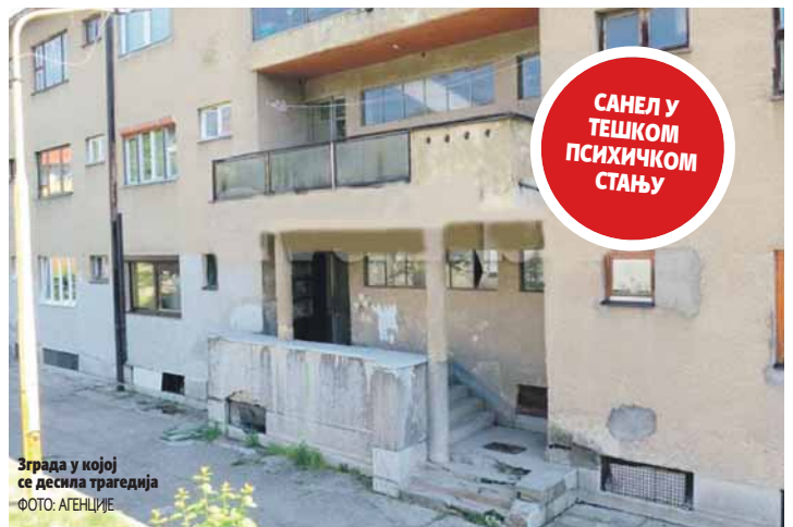
Зграда у којој се десила трагедија

Младић је нестручно руковао оружјем. Он се није