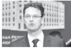
БАЦИ У ОСНОВНИМ ШКОЛАМА ПРЕОПТЕРЕЂЕНИ ЧАСОВИМА, АЛИ НЕ И УЧЕЊЕМ. СРЂАН ВЕРБИЋ, МИНИСТАР ПРОСВЕТЕ

Сачекајмо да видимо шта ће бити Вучићев предлог. У сваком случају очекујем да чујем озбиљне аргументе, а данас их не видим - навео је Стефановић.