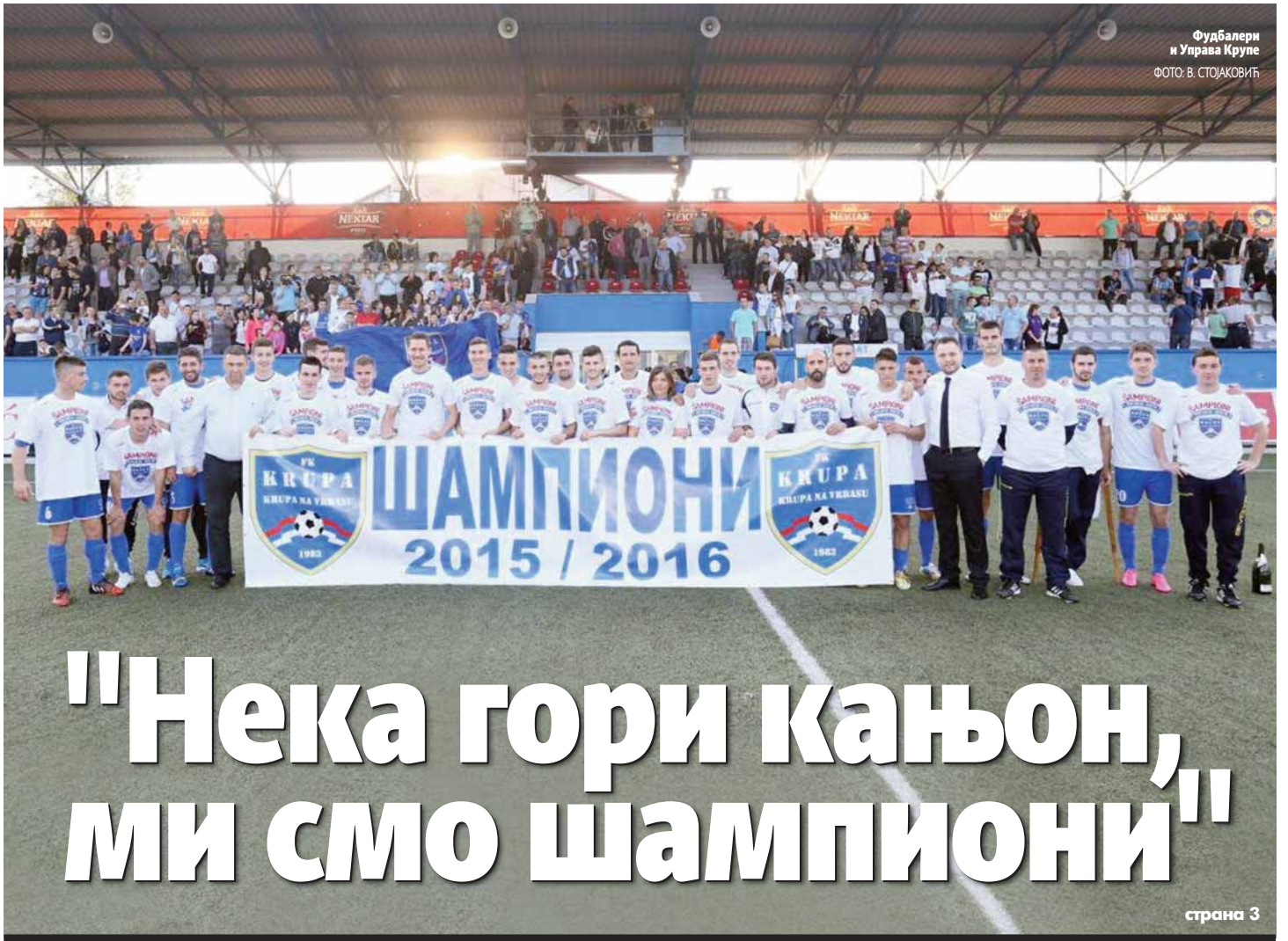
Фудбалери и Управа Крупе