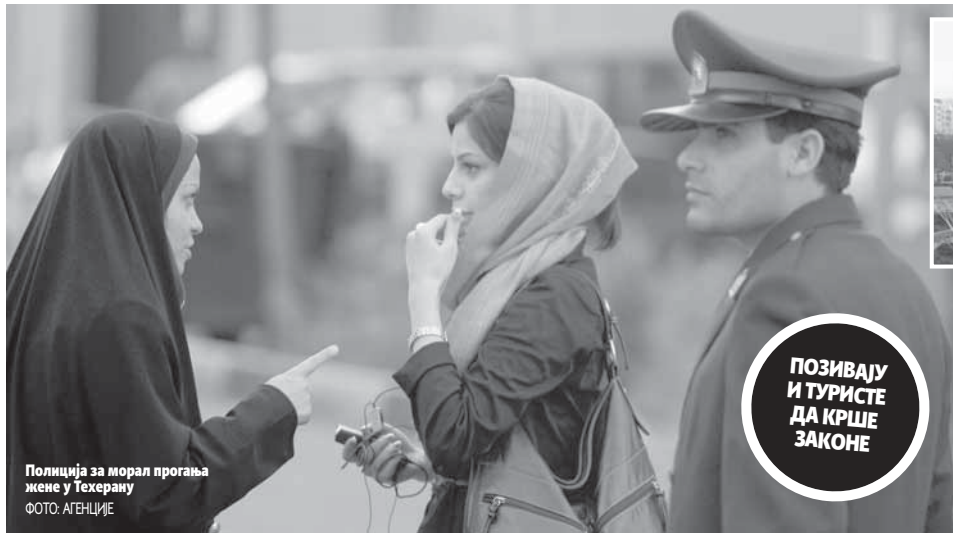
Полиција за морал прогања жене у Техерану

Иранке на све начине заобилазе покривање главе