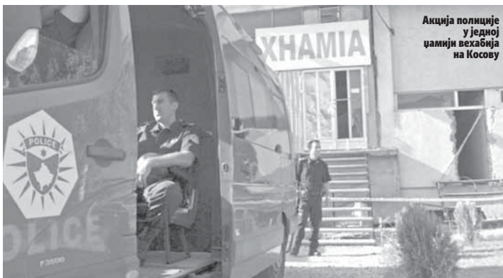
Акција полиције у једној цамији веџабие на Косову

Осуђен је на 10 година за подстицање мржње и регрутовање мушкараца за борбу у цињадистичким оружаним формацијама.