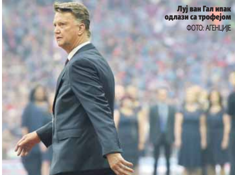
Луј ван Гал ипак одлази са трофејом

Луј ван Гал јуче напустио клупски хотел, а на питање новинара да ли ће у њему боравити и идуне сезоне, рекао је: "Не, не, готово је"