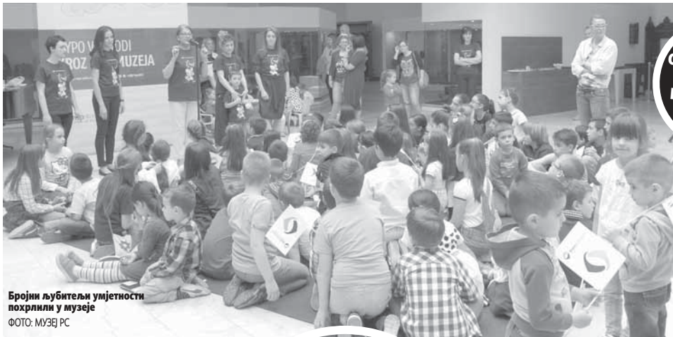
Бројни љубитељи умјетности похрлили у музеје

ОРГАНИЗОВАНА СТРУЧНА ВОЂЕЊА КРОЗ ИЗЛОЖБЕ