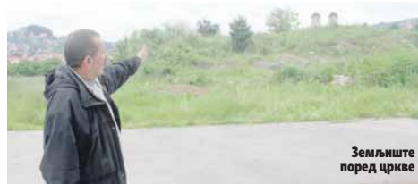
Земљиште поред цркве

- Овим ће напакон бити остварен тридесетогодишњи сан младих из мјесне заједнице Лауш. Радосни смо, јер ћемо напакон добити терен са вјештачком травом, трибинама и друге садржаје - рекао је Бошњак, додавши да све то припада фудбалском клубу који је прегазио више од шест деценија.