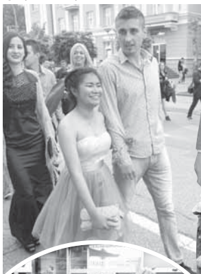
Матуранткиња из Тајланда привукла пажњу

ПРИЈЕ МАТУРЕ ПРИРЕДБА У КАТОЛИЧКОЈ ГИМНАЗИЈИ