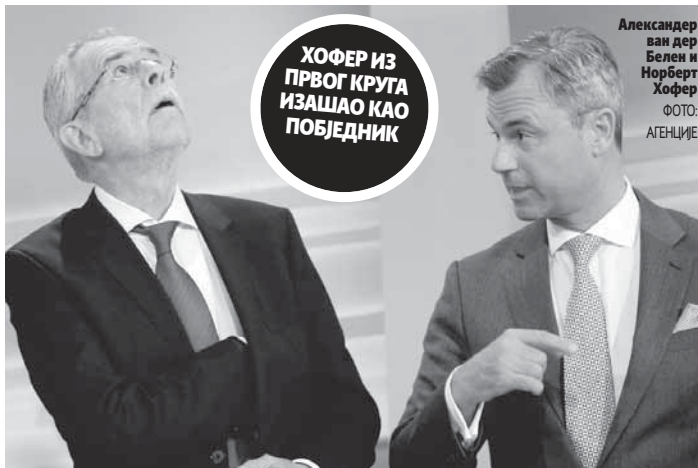
Александер ван дер Белен и Норберт Хофер

Они који у првом кругу нису гласали за Ван дер Белена могли би то да учине у другом кругу, страхујући од председника из редова деснице, оцијенили аналитичари