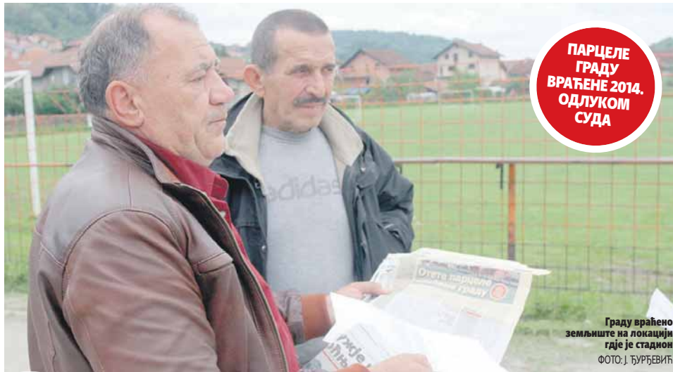
Граду враћено земљиште на локацији гдје је стадион

ПИШЕ: ДАНИЈЕЛА СТОКАНИЋ daniijela@glassrpske.com