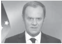
ЦРНА ГОРА ЈЕ ВЕЛИКА ЗЕМЉА, А ЦРНОГОРЦИ ВЕЛИКИ НАРОД. ДОНАЛ ТУСК, ПРЕДСЈЕДНИК ЕВРОПСКОГ САВЈЕТА