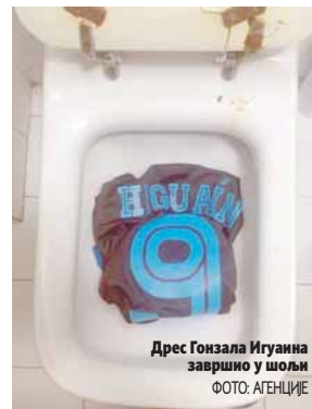
Дрес Гонзала Игуаина завршио у шољу

Навијачи нису могли да опросте издају пројектованом наследику Дијега Армандо Марадоне па се утркују како што више да дискредитују Игуаина