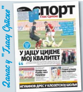
Данас у "Гласу Српске"

Сарајево не признаје ни историју Египта положену у Српској