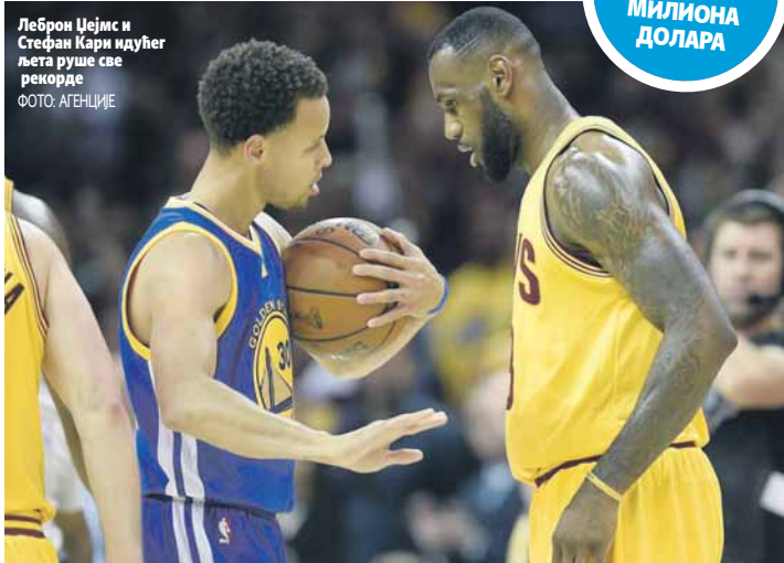
Леброн Џејмс и Стефан Кари идућег љета руше све рекорде

Садашњи уговор играча и лиге (ЦБА) истиче љета 2021. године, али обје стране имају клаузулу да из њега изађу 30. јуна наредне године што ће се највјероватније десити. НБА је потписао уносан уговор са телевизијом ТНТ којој је продао права преноса на девет година за 24 милијарде долара. Посљедица тог уговора је повећање селери кепа са прошлогодишњих 70, на 94 милиона долара, а наредне сезоне требало би да буде чак 108 милиона што би довело до рекордних уговора играча. Највеће звијезде Леброн Џејмс и Стефан Кари могли да узму по 200 милиона за пет година и тако наплате све досадашње сезоне током којих су били потплаћени. Најјача лига свијета никад није зарађивала више новца и врло вјероватно ће власници франшиза наредног љета тражити од играча већи проценат тих прихода (БРИ). Играчи од 2011. добијају 51 одсто новца, а до тада су приходovali шест процената више. Власници ће наредног љета, према неким спекулацијама, тражити да се унија играча спусти на свега 41 одсто прихода, што су тражили и прије пет година, па је локаут потпуно реална опција.