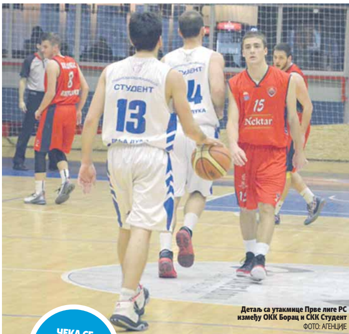
Детаљ са утакмице Прве лиге РС између ОКК Борац и СКК Студент