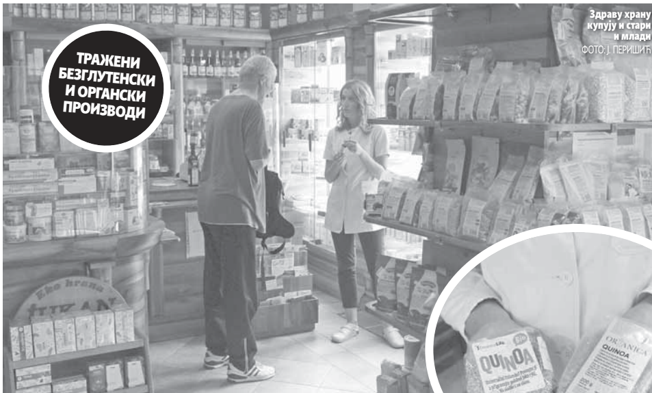
Здраву храну купују и стари и млади

ТРАЖЕНИ БЕЗГЛУТЕНСКИ И ОРГАНСКИ ПРОИЗВОДИ