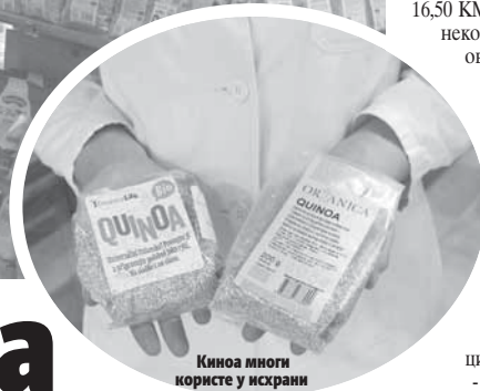
Киноа многи користе у исхрани

ТРАЖЕНИ БЕЗГЛУТЕНСКИ И ОРГАНСКИ ПРОИЗВОДИ