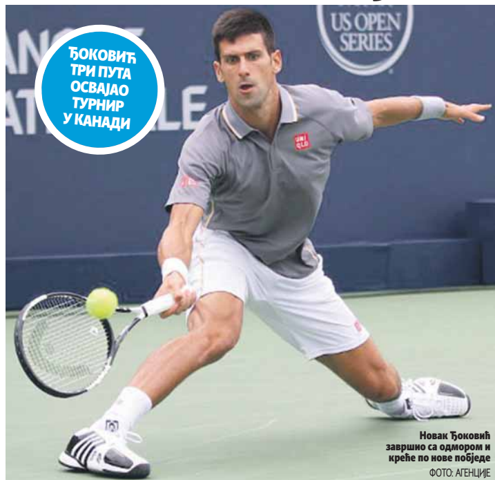
Новак Ђоковић завршио са одмором и креће по нове побједи

Како је тада рекао, био је емотивно испражњен и помало уморан, али је имао доста времена да се одмори и напунити батерије како би што спремнији дочекао искушења у Канади. Тамо ће бити једини члан "велике четворке" који ће се појавити пошто су Роџер Федерер, Рафаел Надал и Енди Мареј отказали наступ. Чак