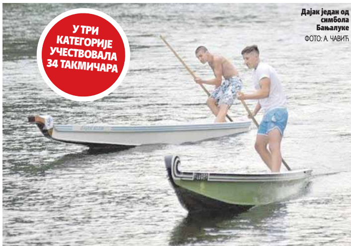
Дајак један од симбола Бањалучке

Као увертира за дајак на плажи код Зеленог моста одржане су завршне утакмице