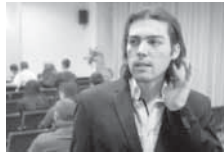
ПОСТОЈИ ЈЕДАН ЖИВИ ЗИД И САМО ЈЕДАН ШЕФ - ЈА

Сајт пише да је Степинац умро 1960. од тромбозе у 61. години, док је био у кућном притвору, на основу пресуде из 1946. године када је осуђен због сарадње са нацистима у вријеме док је био загребачки католички надбискуп. "Политико" наводи да "критичари кажу да је требало да учини више како би зауставио убијања Јевреја, Срба и Рома које је чинио усташки режим".