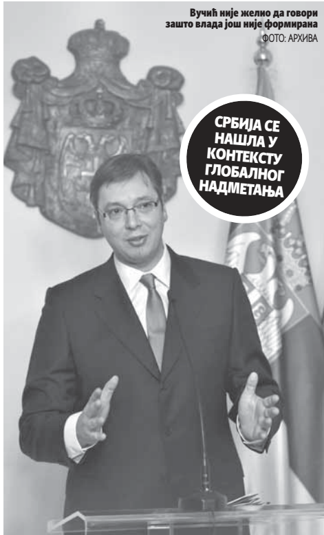
Вучић није желио да говори зашто влада још није формирана

- Јасно је да сукоб између Запада и Русије постаје све интензивнији. Србија је, с обзиром на своју централну геополитичку позицију,