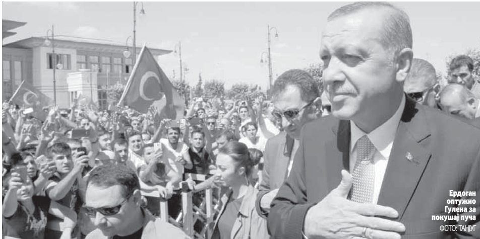
Ердоган оптужио Гулена за покушај пуча