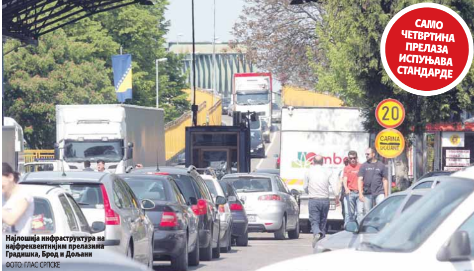
Најлошија инфраструктура на најфреквентнијим прелазима Градишка, Брод и Дољани

њавају стандарде опремљености и услове из Закона о граничној контроли. Потребно им је све - од надстрешница и контролних кабина до зауставних рампи. То се нарочито односи на међународне граничне прелазе Дољани, Требиња, Ивањича, Делуша, Хум, Витине, Металка, Устибар, Увац и Рипач.