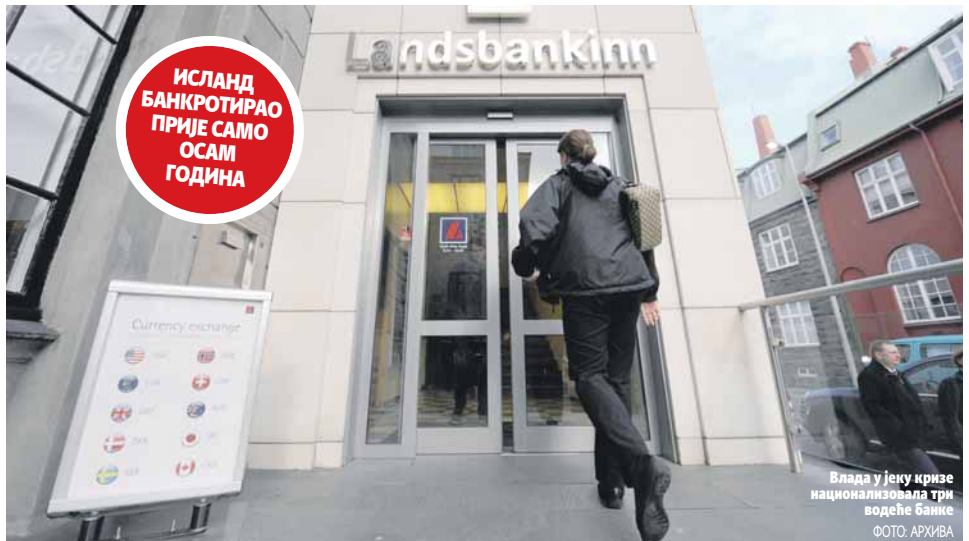
Влада у јеку кризе национализовала три водеће банке

Снажан опоравак економије се приписује значајном успону туризма, који од почетка ове деценије биљежи стабилан раст, а тренутно је већи извор прихода од извозних узданица, рибе и алуминијума