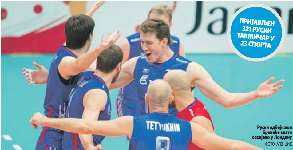
Руски одбојкаши браниће злато освојено у Лондону

У наредних 12 дана сваки од 321 руског такмичара и такмичарке, који су пријављени у 23 спорта, мора да достави доказе да није пао на независним допинг тестовима, иначе му МОК неће дозволити учешће на Олимпијским играма у Рију