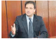
НИСАМ ПОЗВАН ДА СЕ ПО ОБУГИ И ГУСЛАМА ТАКМИЧИМ СА МИЛОРАДОМ ДОДИКОМ.