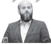
МАЧ САМ ИЗВУКАО, ЗАДЊИ ГА ИЗВЛАЧИМ, ЗАДЊИ ВРАЋАМ. ПРЕМИЈЕР АЛЕКСАНДАР ВУЧИЋ НЕЋЕ БИТИ МЕТА МОГ МАЧА, ВЕЋ МАФИЈАШКЕ СТРУКТУРЕ У ОБРАЗОВАЊУ.

Тужилаштво такође сматра да се ради о сумњивој смрти, а детаљну истрагу је затражио и председник косовског парламента Кадри Весели. (Агенције)