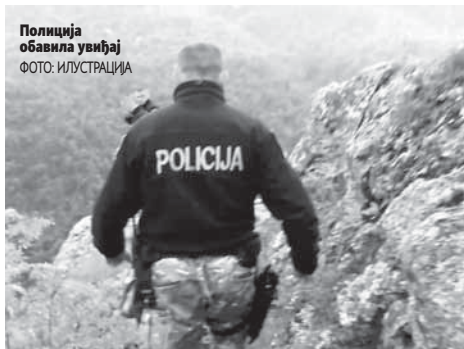
Полиција обавила увиђај ФОТО: ИЛУСТРАЦИЈА

Након што су успјели извући тијело, смрт несрећног човјека констатовао је лекар Дома здравља Грачаница, а увиђај су, по наредби дежурног кантоналног тужи-