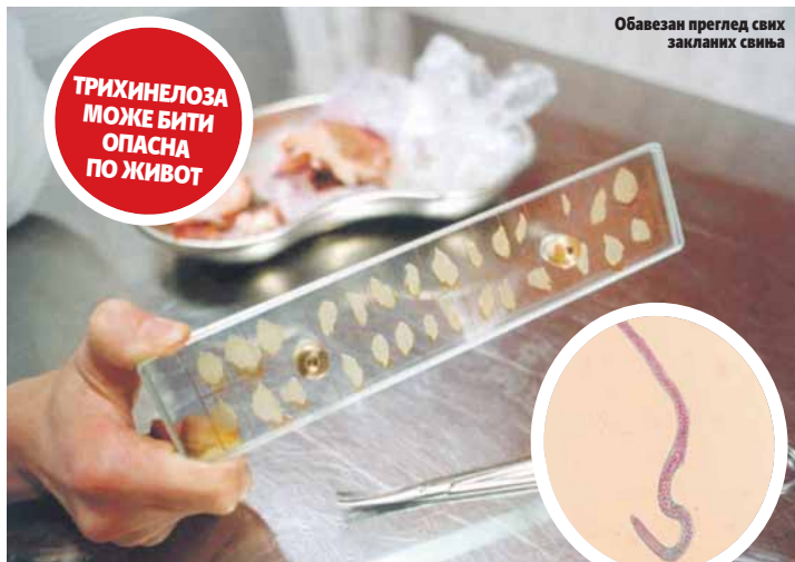
Обавезан преглед свих закљаних свиња