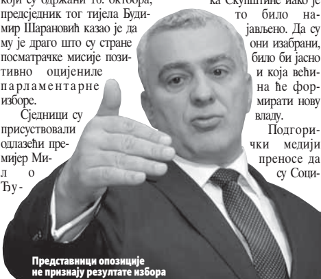
Представници опозиције не признају резултате избора