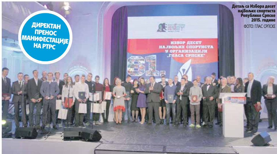
Детаљ са Избора десет најбољих спортиста Републике Српске 2015. године