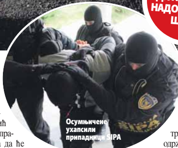
Осумњичене ухапсили припадници SIPA

Суд БиХ поништио је прошле седмице рјешење