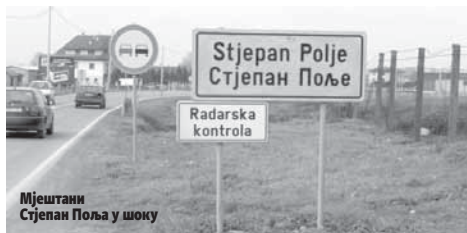
Мјештани Стјепан Поља у шоку