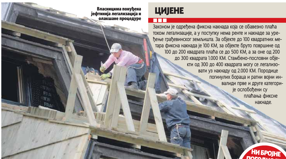
Власницима понуђена јефтинија легализација и олакшане процедуре

Од 80.000 нелегално саграђених објеката, колико се процјенује да их је у РС, готово четвртина је у Бањалуци. На већину власника таквих објеката није утицало ни то што су им понуђене олакшице приликом легализације, као што су мањи број документације и повољније цијене. То потврђује и податак Градске управе Бањалучка да је од готово 20.000 "дивљих" објеката поднесен 13.901 захтјев за легализацију.