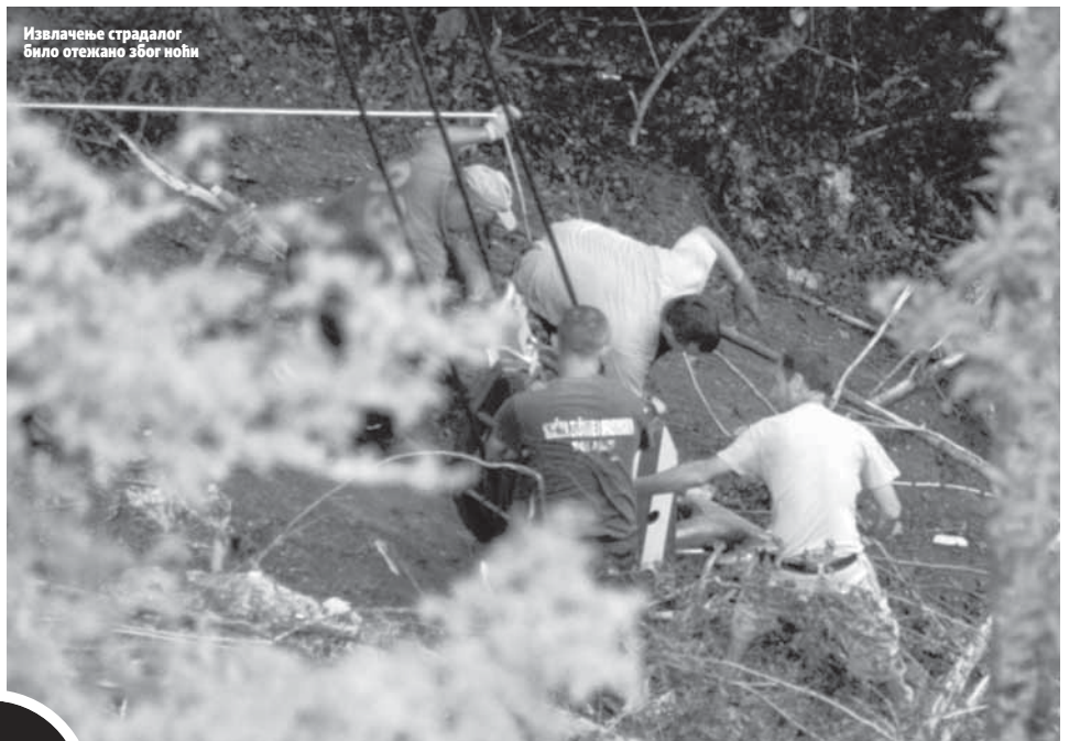
Извлачење страдалог било отежано због ноћи