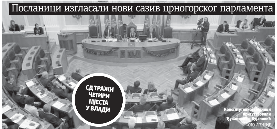
Посланици изгласали нови сазив црногорског парламента

Сједници су присуствовали одлазећи премијер Мило Ђу-