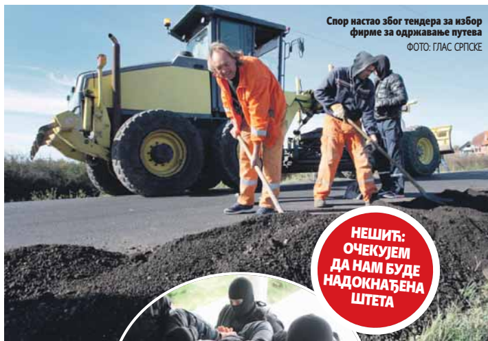
Спор настао због тендера за избор фирме за одржавање путева

Осумњичени су предати поступајућем тужиоцу, који ће их испитати и након тога одлучити о даљим активностима. Биће испитана и умјешаност