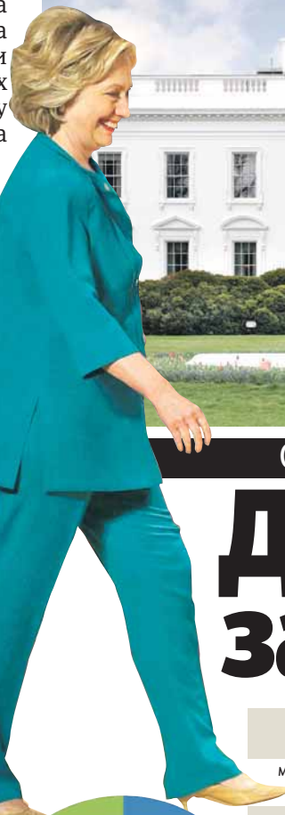
Буран пут до Бијеле куће

ФБИ је само 36 сати уочи предсједничких избора у САД