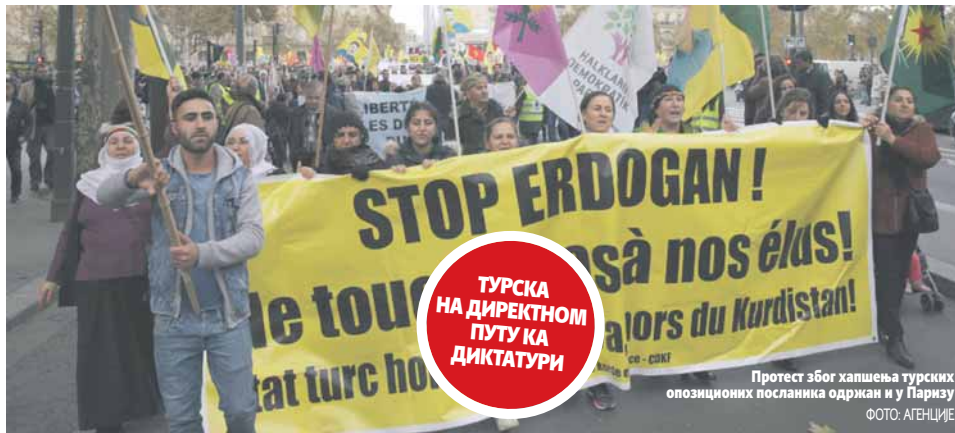
Протест због хапшења турских опозиционих посланика одржан и у Паризу

- Ти методи, мора отворено да се каже, коришћени су за вријеме нацистичке владавине. У Турској су се ствари врло лоше развијале од јула и ми као Европска унија то не можемо да прихватимо - рекао је Аселборн.