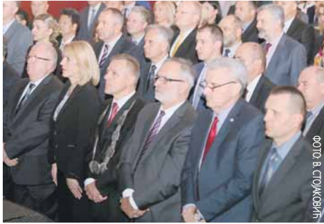
стекло више од 34.000 студената говори у прилог томе да ова установа представља један од стубова развоја и снаге РС.

Нагласила је да податак да је на Универзитету до сада дипломе основних и мастер студија, магистара и доктора