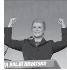
Њећути, предсједник сматра да напрт пореске реформе, који ће њој донијети повећање плате у мало мањем износу од хрватског минималца, "иас у добром смјеру јер растеређује привреду".

Према приједлогу пореске реформе, Грабар-Китаровић ће плата пораста за 2.000 куна (270 евра) нето и она није спремна одрећи се тог повећања са обзиром на стање у држави. Грабар-Китаровић, напротив, поздравља повећање својих мјесечних прихода. Будући да је шеф државе владу Зорана Милановића прозивала због социјалне неосјетљивости, а и сама је на почетку мандата обећавала штедњу и смањивала трошкове рада свог кабинета, јавност је очекивала да Грабар-Китаровић неће подржати повећање плата државним функционерима.