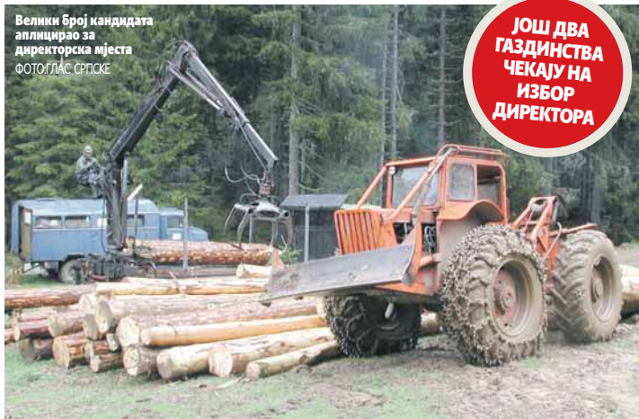
Велики број кандидата аплицирао за директорска мјеста

На челу Шумског газдинства "Бирач" из Власенице о-