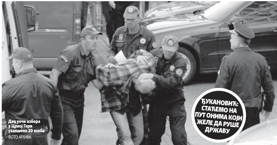
Дац уочи избора у Црној Гори уапшено 20 особа

ЋУКАНОВИЋ: СТАЋЕМО НА ПУТ ОНИМА КОЈИ ЖЕЛЕ ДА РУШЕ ДРЖАВУ