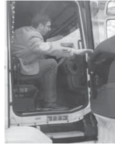
може да се мијења, да више не стоји у мјесту, да није

Подсјетимо, због дола- тних преправки на тунелима Брђани и Шарани каснило се са отварањем ове дионице аутопута дуге 40,3 киломе- тра. Премијер је на отвара- рању поручио да не крије радост, јер је тај аутопут до- каз да Србија може боље, да