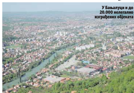
У Бањалуци и до 20.000 нелегално изграђених објеката

лизацију не могу се похвалити ни у Градишци, гдје је од 5.000 "дивљих" објеката захтјев за њихово озакоњење предало само 407 власника.