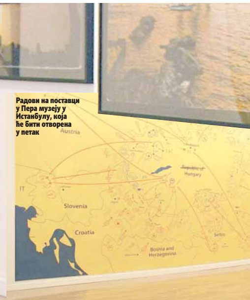
Радови на поставци у Пера музеју у Истанбулу, која ће бити отворена у петак

ГЛАС: Да ли је и овај пут поставка продукцијски ком-