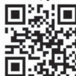
СКЕНИРАЈТЕ КОД МОБИЛНИМ ТЕЛЕФОНОМ