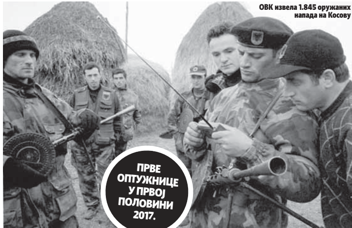
ОВК извела 1.845 оружаних напада на Косову