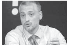
БОШКО ОБРАДОВИЋ ЈЕ ПРАЗНОГЛАВИ МОМАК КОЈИ РАДИ НА КОПЕЈКУ.

Делегацију Српске напредне странке на 29. конгресу ЦДУ-а, који је одржан у Есену, предводила је интернационална секретарка те странке Јадранка Јоксимовић. Након, како се наводи, изванредног пријема делегације и посебног поздравља на радном дијелу конгреса, од домаћина, Јоксимовићева се сусрела са Меркеловом. Она је изразила задовољство због присуства делегације СНС-а на конгресу ЦДУ-а, похваливши при том напредак и видљиве резултате Владе Србије и премијера Вучића. (Агенције)