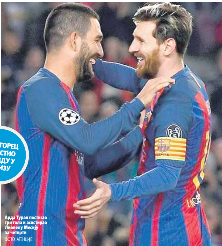
Арда Туран постигао три гола и асистирао Лионелу Месију за четврти

Бугарски Лудогорец дијелиле су секунде од највеће побједе у историји клуба, али је