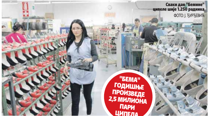
Сваки дан "Бемине" ципеле шије 1.250 радника

"БЕМА" ГОДИШЊЕ ПРОИЗВЕДЕ 2,5 МИЛИОНА ПАРИ ЦИПЕЛА