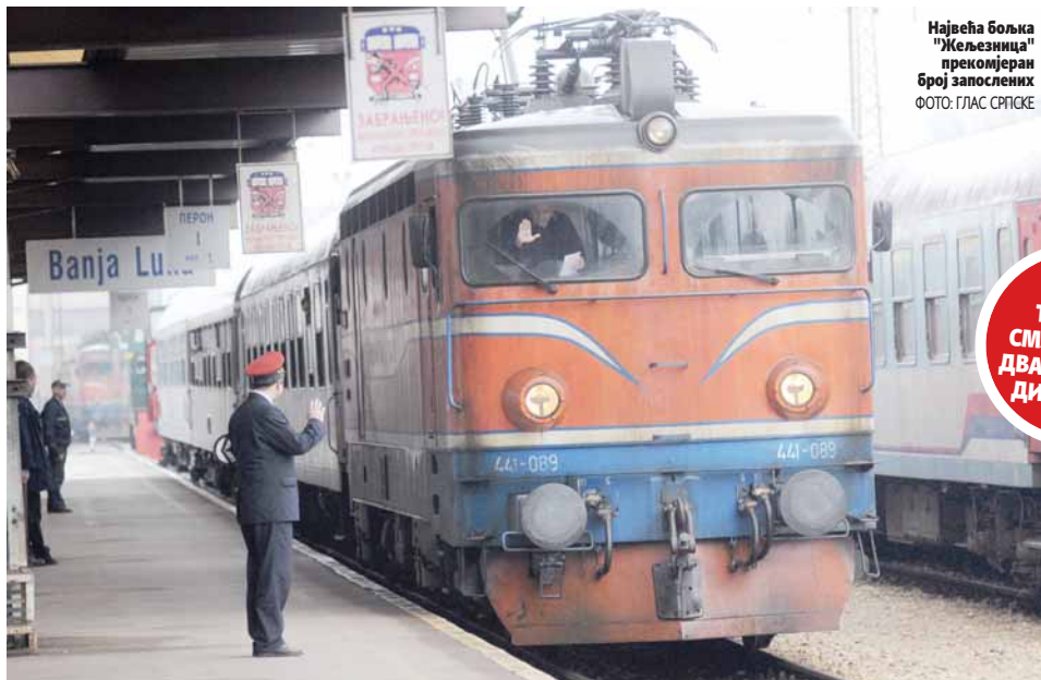
Највећа бољка "Жељезница" прекомјеран број запослених