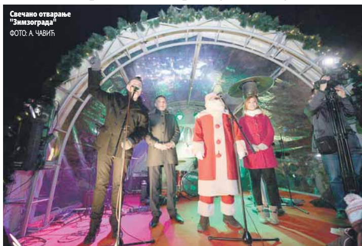
Свечано отварање "Зимзограда"