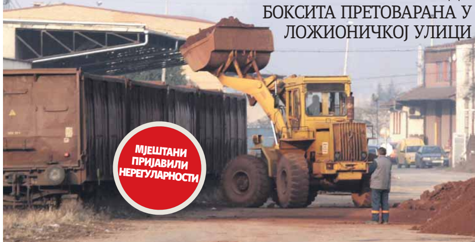
Руда јуче претоварана