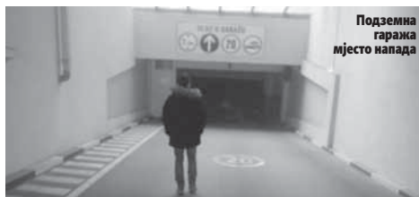
Подземна гаража мјесто напада