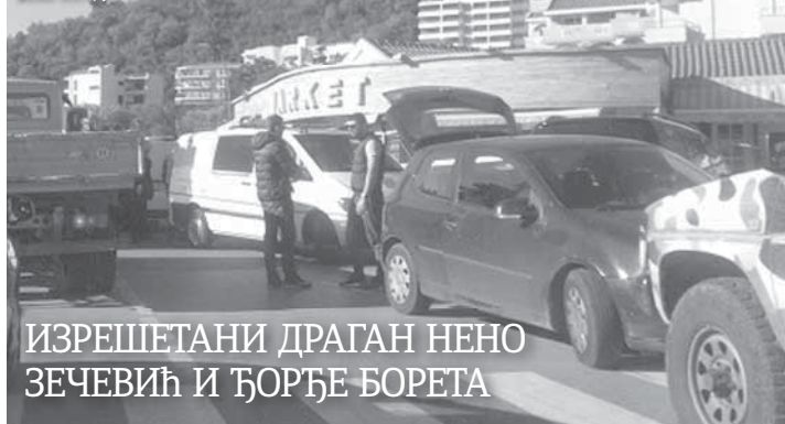
Двије маскиране особе на мотору прошле поред кафића, а затим једна од њих запуцала из "калашњикова"

Да би задржали пажњу камера и учинили натпис дуже вријеме видљивим, они су се пријавили за реплику и монотоним гласом читали законски текст о којем се у том тренутку није расправљало. Кад су исцрпили вријеме за расправу, председavajuћи Сабора Жељко Рајнер их је упозорио да нису прекршили пословник, али да су и на другачије начине могли да изрекну свој став. Претходно је СДП упозорио на непримјерен однос према жртвама рата. (Танјуг)