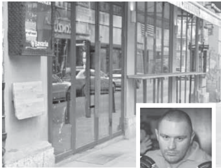
Двије експлозије одјекнуле у Сарајеву