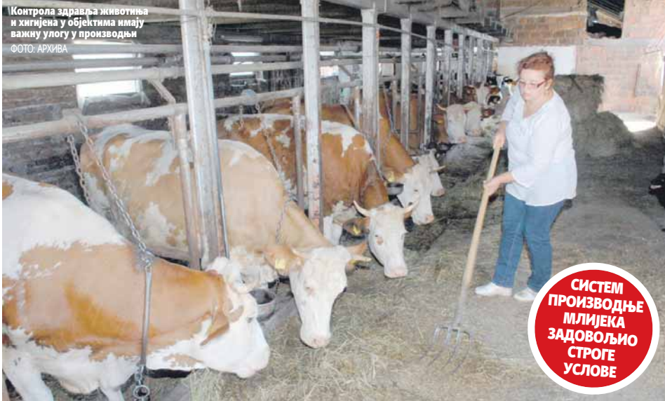
Контрола здравља животиња и хигијена у објектима имају важну улогу у производњи

Из Министарства спољне трговине и економских односа БиХ саопштили су да је контрола показала и да је обављена одговорно за службене контроле адекватно обучено и компетентно за примјену ЕУ стандарда.