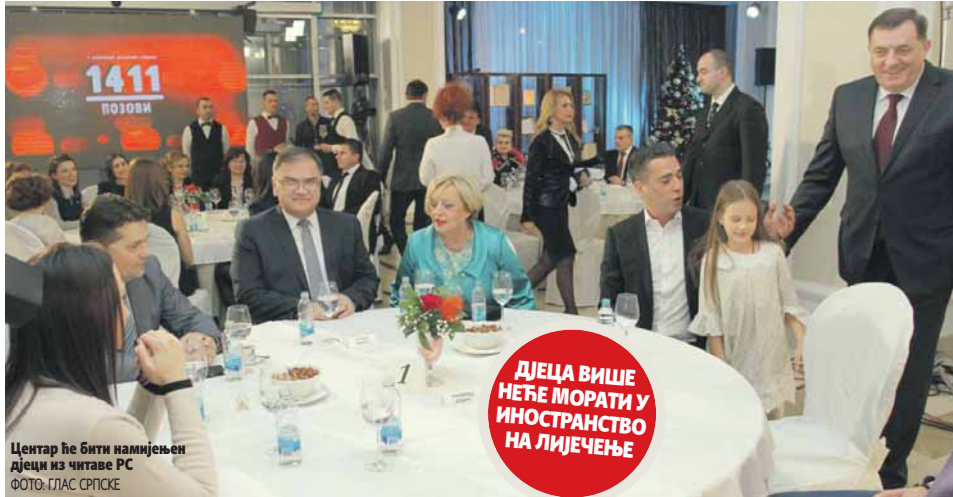
Центар ће бити намињен дјецима из читаве РС