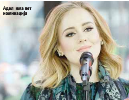
Адел има пет номинација

Бијонсиних девет номинација укључују најбољу рок изведбу ("Don't Hurt Yourself" са Цеком Вајтом), поп