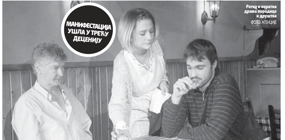
Ратна и поратна драма породице и друштва