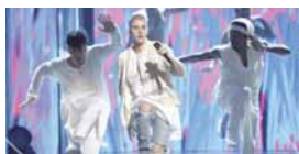
За албум године номинован и "Purpose" Џастина Бибера

Дејвид Боуви који је умро од рака у јануару ове године, добио је четири номинације за свој посљедњи албум "Blackstar", укључујући за најбољи рок наступ, рок pjesму, албум алтернативне музике и најбољи технички изведен албум.