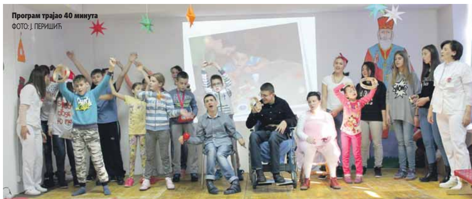
Програм трајао 40 минута