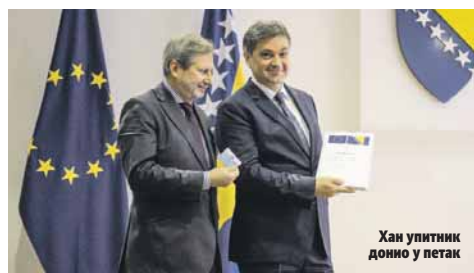
Хан упитник доноси у петак

БиХ је 15. фебруара поднијела захтјев за чланство у ЕУ који је Европска комисија прихватила и у септембру одлучила да достави упитник. Европска комисија ће на основу добијених одговора креирати мишљење о захтјеву за чланство.