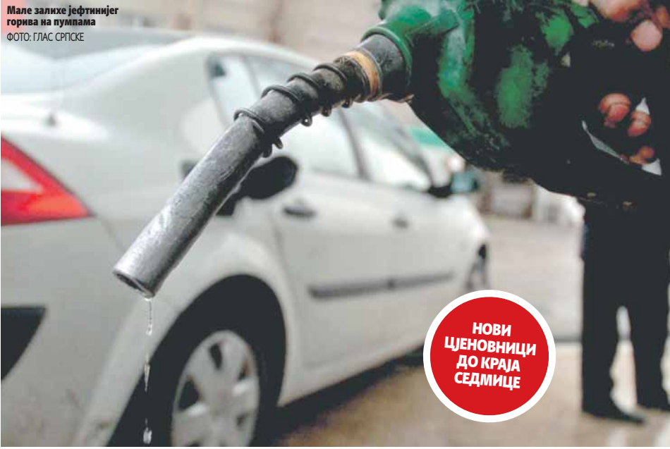
Мале залихе јефтинијег горива на пумпама

Ово је први глобални пакт о смањењу производње нафте у посљедњих 15 година, а аналитичари наводе да ће на тржишту настати дефицит. Нова ситуација на свјетском нивоу доведше до поскупљења горива и на бензинским пумпама у Српској, рекао Берак