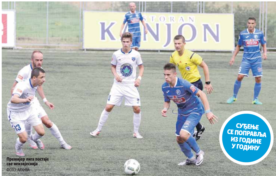
Премијер лига постаје све неизвјеснија

Прије деценију од 240 одиграних утакмица, домаћи тимови су победили у чак 191 сусрету (79,58%), само 24 меча су завршена нерішешено (10%), а 25 утакмица су побједили гости (10,42%). Тек понека побједом у гостима доносила је и преврату на табели и самим тим титулу првака, али се ситуација из сезоне у сезону драстично мијенала. Процент побједом домаћих екипа се знатно смањило, а у 18 кола одиграних ове сезоне је проценат спао на 42,59.