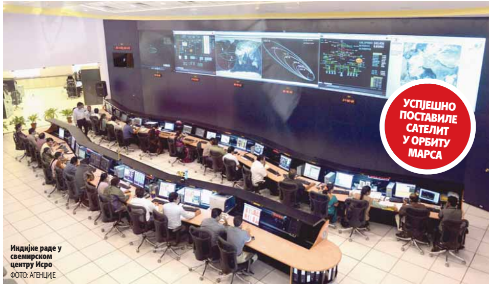
Индијке раде у свемирском центру Исро

ПРИРЕДИО: БОРИС БУРИЋ borisdj@glassrpske.com