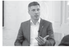
ДВЕРИ СУ НЕЧИСТА САБЕСТ АЛЕКСАНДРА ВУЧИЋА.