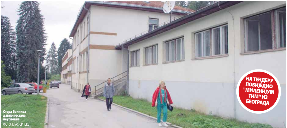
Стара болница давно постала неусловна

НА ТЕНДЕРУ ПОБИЈЕДО "МИЛЕНИЈУМ ТИМ" ИЗ БЕОГРАДА