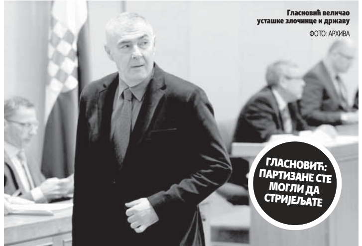
Гласновић величао усташке злочинце и државу