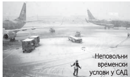
Неповољни временски услови у САД

Посјета руског председника Јапану планирана је за четвртак и петак. Путин ће се сусрести са Абесом у Нагати у Токију. (Агенције)