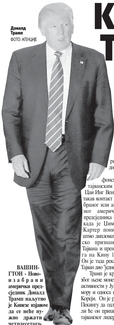
Доналд Трампа

ВАШИНГТОН - Новинари амерички председник Доналд Трамп наљутили су Кинезе изјавом да се неће нужно држати четрдесетогодишњег америчког става да је Тајван дио "једне Кине".