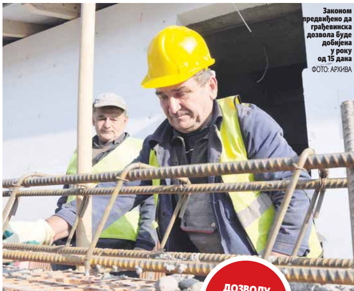
Законом предвиђено да грађевинска дозвола буде добијена у року од 15 дана

У Бањалуци је од почетка године издата 341 грађевинска дозвола, што је, како кажу, у Градској управи, за