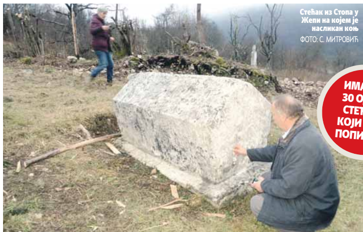
Стећак из Стопа у Жепи на којем је насликан коњ

ИМА ЈОШ 30 ОДСТО СТЕЋАКА КОЈИ НИСУ ПОПИСАНИ