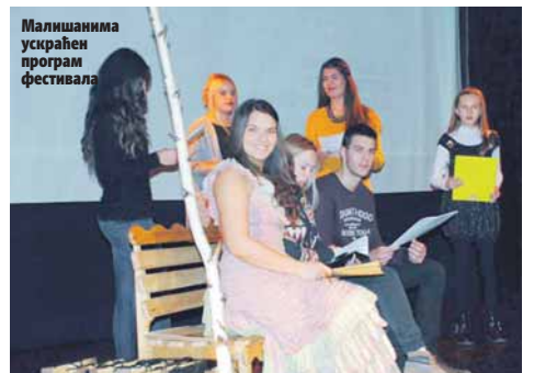
Малишанима ускраћен програм фестивала

- Надамо се да ћемо до следећег фестивала успјети да пронађемо начин за финансирање ове веома значајне манифестације како се она не би потпуно угасила - казао је Митрић.