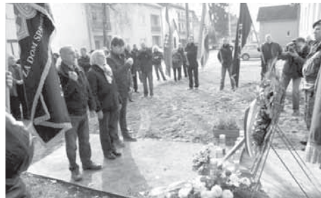
Повамирење усташтва не брине хрватске званичнике

НДХ је била међународно призната. Али ја кажем ово, пријатељи, ми морамо сами писати своју историју. Ко су партизани били? Они су били терористи, рекао Гласновић