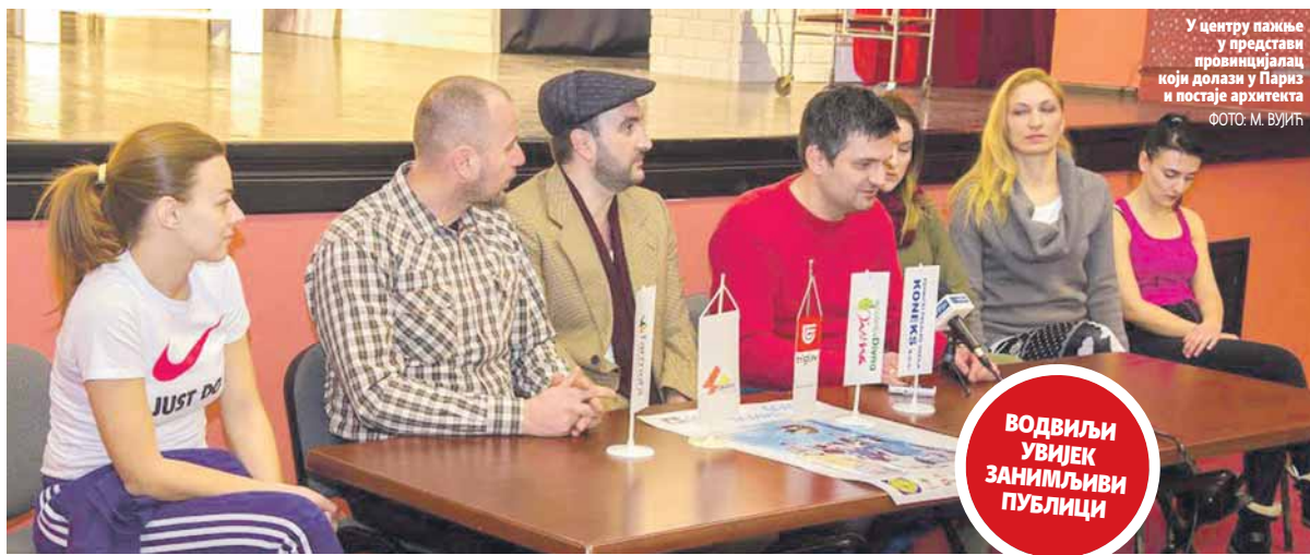
У центру пажње у представи провинцијалац који долази у Париз и постаје архитекта