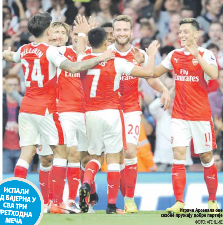
Играчи Арсенала ове сезоне пружају добре партије

"Тобсије" су доста пута лоше пролазиле на жријебу, пошто су најчешће били други у групи, па су се налазили у другом шеширу. Ове године су одлично играли у групи, били су испред Пари Сен Жермена, али ни то им није помогло, пошто су добили Бајерн, који је на изненађење био други у својој групи. Након шест сезона Арсенал ће покушати да се домогне четвртфинала, а занимљиво је да је осам пута у последњих 12 сезона учешће у Лиги шампиона завршавао међу 16 најбољих. Од тих 12 сезона три пута је играо са Бајерном и сва три пута није