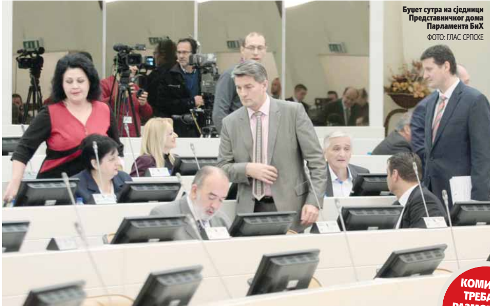
Буџет сутра на сједници Представничког дома Парламента БиХ