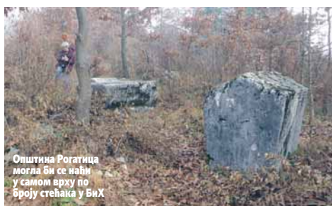
Општина Рогатица могла би се наћи у самом врху по броју стећака у БиХ

Он је додао да би се општина Рогатица могла наћи у самом врху локалних заједница по броју средњовјековних споменика. Посљедње подручје, додао је он, на којем настоје да утврде број стећака је мјесна