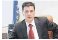
ЗЕНИЧАНИМА НИСАМ ОБЕЉАО СУЛТАНАТ, НЕГО ЕВРОПСКИ ГРАД И НА ЕВРОПСКИ НАЧИН ЋУ РИЈЕШИТИ ПРОБЛЕМА ПАСА ЛУТАЛИЦА.

Меркелова је навела да подржава Пленковићеве иницијативе.