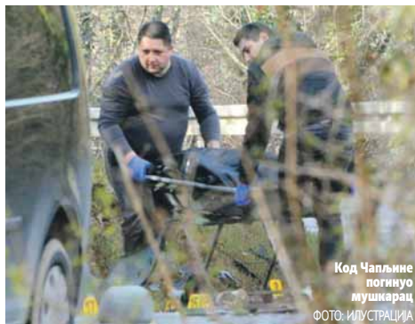
Код Чапљине погинуо мушкарац ФОТО: ИЛУСТРАЦИЈА

На подручју Тузланског и Зеничко-добојског кантона забиљежено је осам саобраћајних несрећа у којима је повријеђено седам особа.