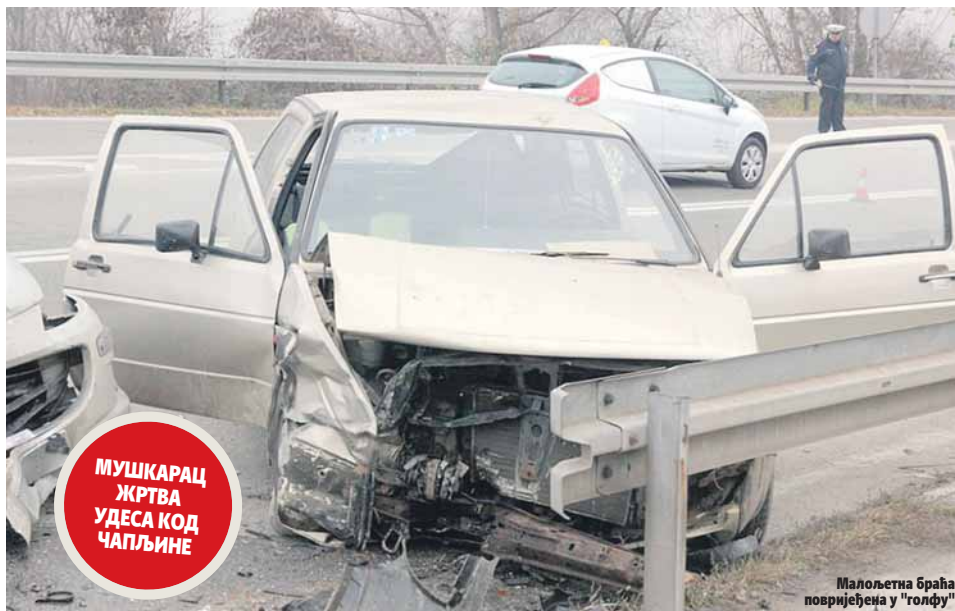
Малолетна браћа повријеђена у "голфу"

Према незваничним информацијама, саобраћајку је