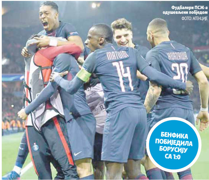
Фудбалери ПСЖ-а одушевљени победом

Лионел Меси и друге звијезде "блаугран" нису се видјеле на "Парку принчева", којим су господарили фудбалери "свештаца", почевши од младог Пренсела Килембеа, преко Антоана Рабиоа, до феноменалног Анхела ди Марије и Единсона Каванија. Ипак, највеће заслуге иду на рачун мајстора за Куп такмичења тренера Емерија који је савршено припремио утакмицу. Парижани су играли високи пресинг све вријеме притискајући последњу линију ривала примеравајући голмана Марка