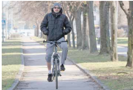
На бициклу са рукама у џеповима