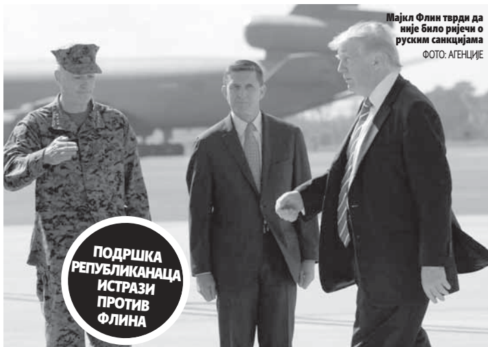
Мајкл Флин тврди да није било ријечи о руским санкцијама

- Неспорно је да је кампања за дискредитовање Флина била у пуном замаху прије инаугурације, током које су узнемирујућа и исподигнута пуцања у медијима била усмјерена на нарушавање његовог угледа - рекао је неименовани бивши савјетник за националну безбједност који има блиске