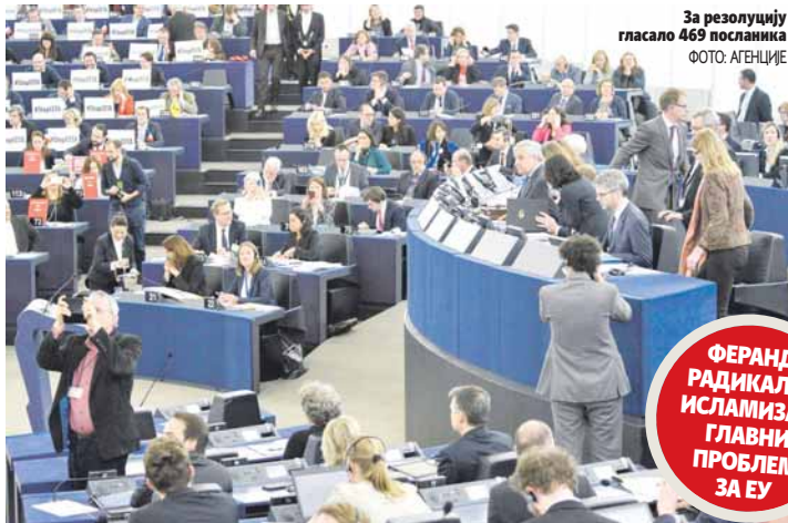
За резолуцију гласало 469 посланика

Преда је у два важна питања за Српску, попису становништва и одлуци Уставног суда БиХ у вези са Даном Републике, дефинисао став који