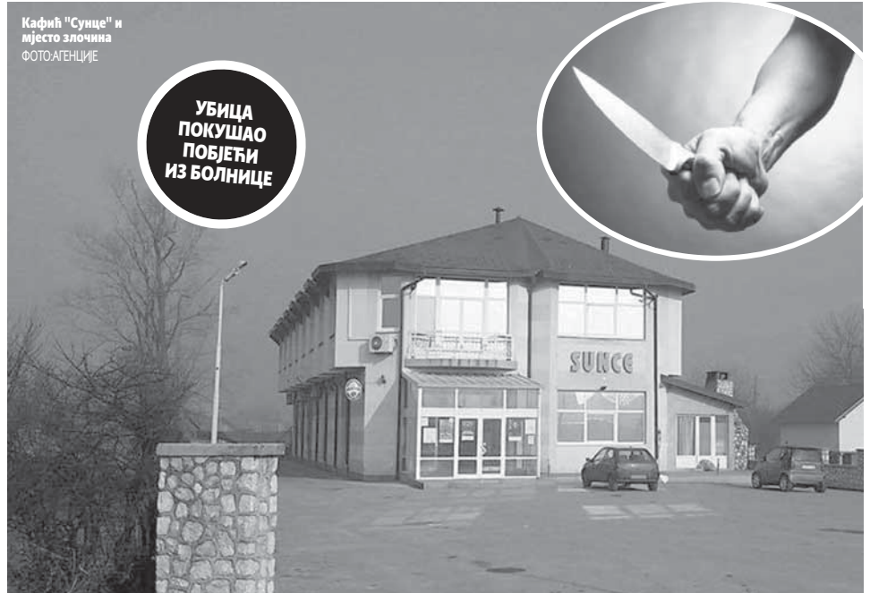
Кафић "Сунце" и мјесто злочина