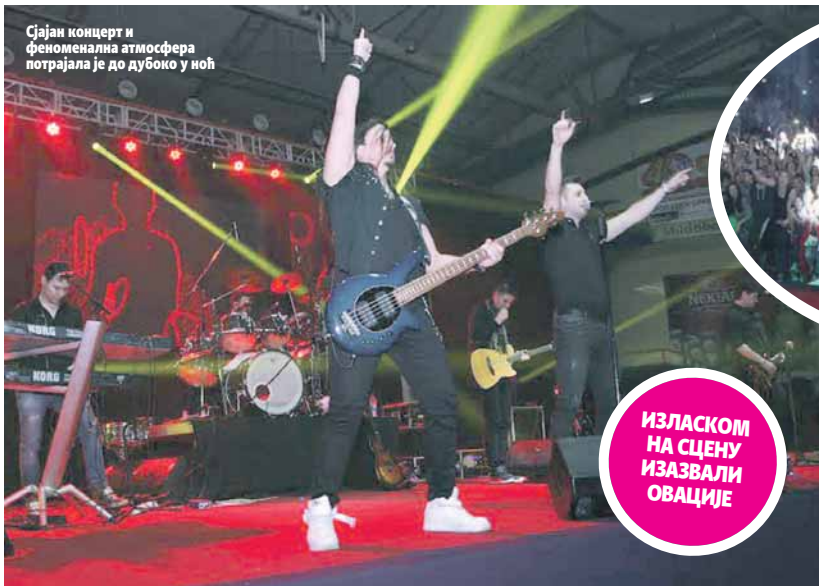
Сјајан концерт и феноменална атмосфера потрајала је до дубоко у ноћ