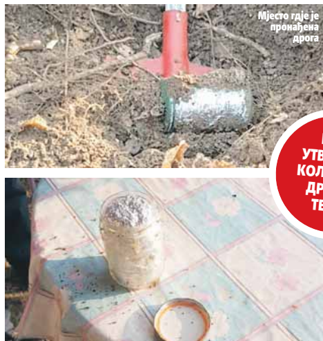
Мјесто гдје је пронађена дрога