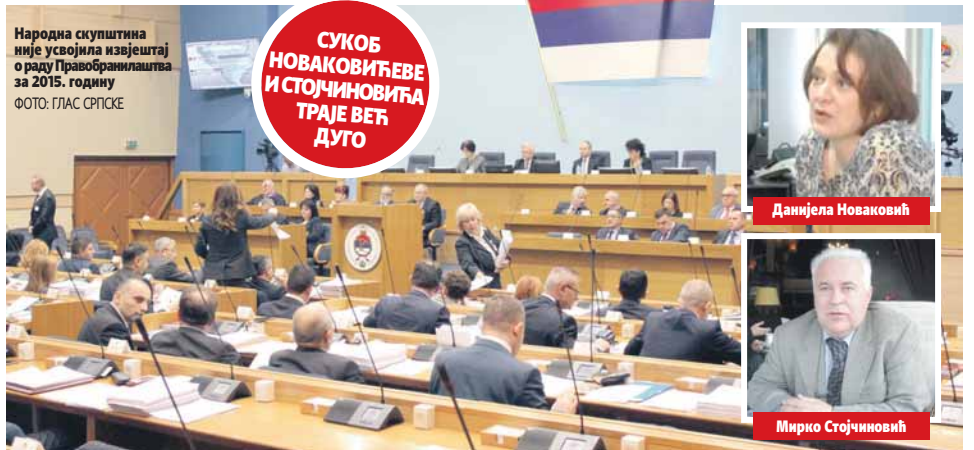
Народна скупштина није усвојила извјештај о раду Правобранилаштва за 2015. годину