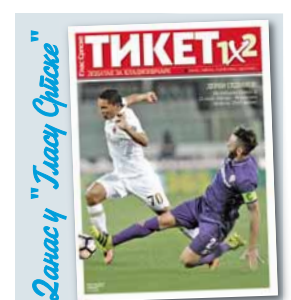
Зачас ч "Глас Српске"