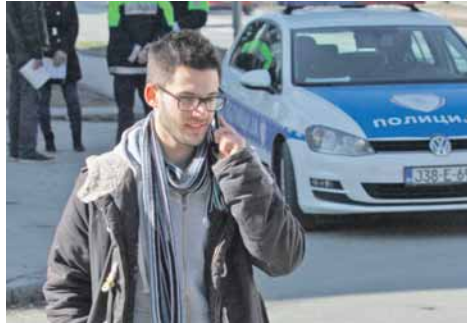
Пјешаци телефонирају на пјешачком прелазу и прелазе са слушалицама у ушима