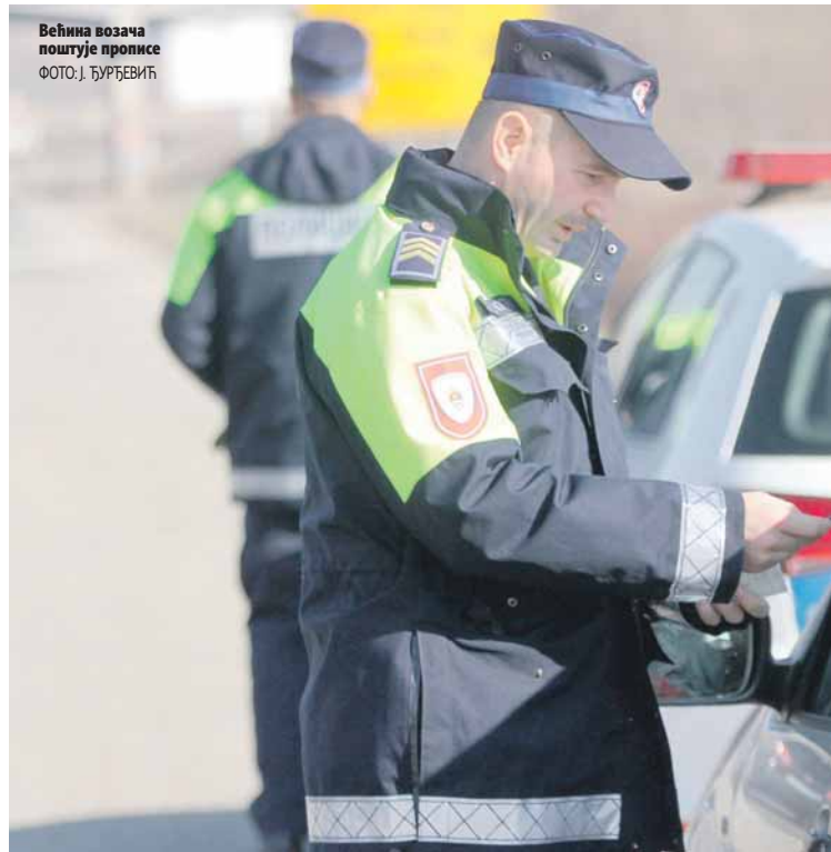
Већина возача поштује прописе

На питање полицијца да ли зна због чега ју је зауставио, стидљиво је рекла да не зна, те да јој нису познати прописи, нити да би због прекршаја требало да плати казну од 40 КМ.