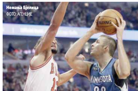
Немања Бјелица

У дербију Калифорније Сакраменто је у узбуђивом мечу победио Лос Анђелес Лејкерсе са 97:96. Кингсе је предводио Демаркус Казинс са 40 поена, 12 скокова и осам асистенција, док су Бен Маклемор и Дарен Колинс додали по 13. У екипи Лејкерса истакао се Лоу Вилијамс са 29 поена и пет асистенција док је Џулијус