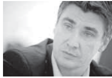
АНДРЕЈ ПЛЕНКОВИЋУ ЈЕ МАМА ИЗМИСЛИЛА АНЕМИЈУ ДА НЕ БИ ИШАО У ВОЈСКУ.

Полиција је утврдила да су се нападачи и жртва познавали, а прије трагедије чак и заједно пили у једној кафани. Снимак на "Фејсбуку" о овом догађају је прегледало готово 250.000 људи, прије него што је уклоњен. Како се наводи, мучење је трајало готово пола сата. Полиција је нападаче, старе 20 и 29 година, брзо ухватила и њима је одређен притвор, а пријете им, како се наводи, високе затворске казне. Мотив овог напада није познат. (Агенције)