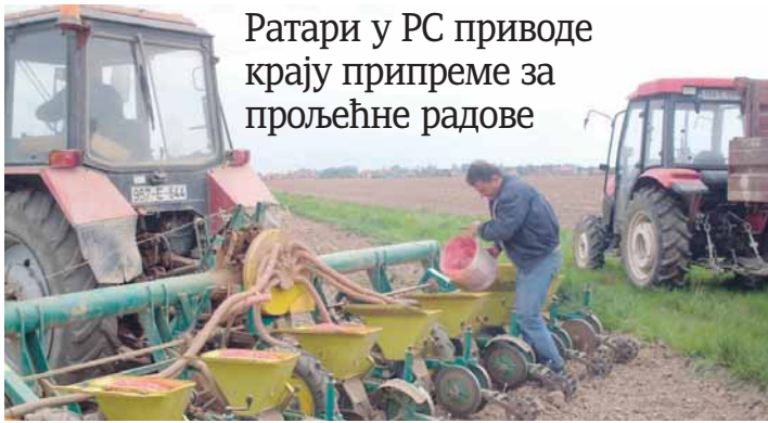
Ратарима у РС приводе крају припреме за прољећне радове

Предсједник Савеза удружења пољопривредних прои-