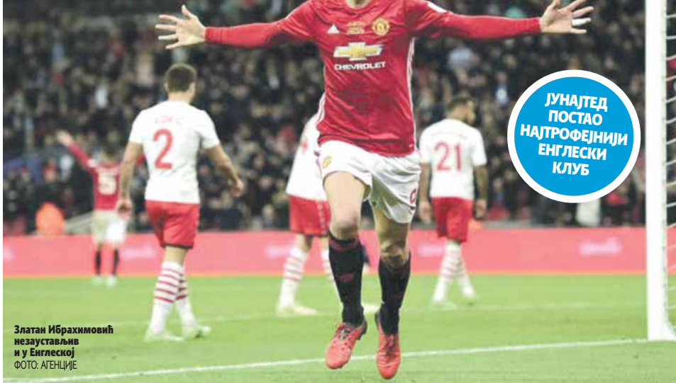
Златан Ибрахимовић незаустављив и у Енглеској

ЈУНАЈТЕД ПОСТАО НАЈТРОФЕЈНИЈИ ЕНГЛЕСКИ КЛУБ