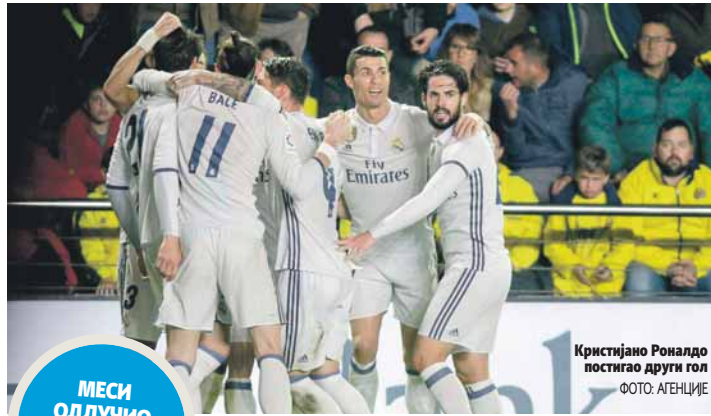
Кристијано Роналдо постигао други гол