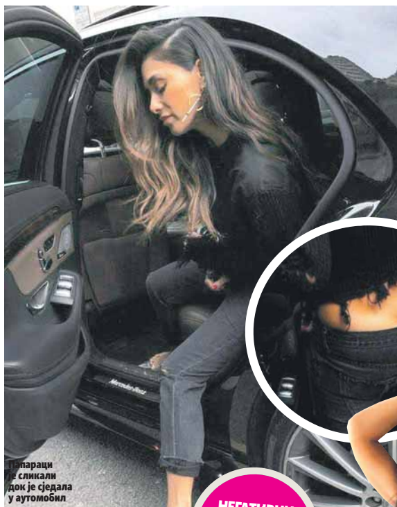
Папараци су сликали док је сједила у аутомобилу

када су њена дјеца у питању. Правно, она је открила да сваке године својој трогодишњој Кхерки Норт и једногодишњем сину Весту пише писма која планира да им преда када постану пунолетни. - Својој дјеци сваке године пишем писма о догађајима који су нам обиљежили претходну годину. Даћу им их када напуне 21 годину - написала је Ким. Инспирацију је сигурно пронашла у писмима свог оца која јој је написао након завршетка средње школе. Укупно их има три, а тичу се живота. Овај гест одушевио је многе маме.