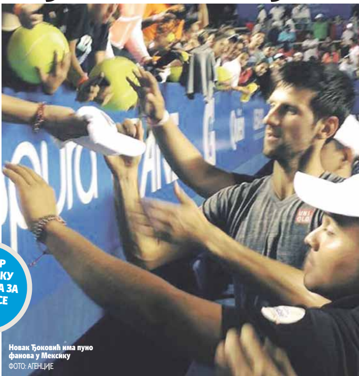
Новак Ђоковић има пуно фанова у Мексику

У четвртфиналу би му ривали могли бити Аустралијанци Ник Кирјос или Бернард Томић, а у евентуалном полуфиналу бранилац титуле Доминик Тим или Давид Гофан. Србин ће тако имати тежак пут до финала, гдје би га мо-