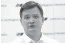
ВУК ЈЕРЕМИЋ ЈЕ ТУРИСТА НА ПРОПУТОВАЊУ У СРБИЈИ.