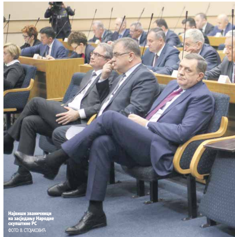
Највиши званичници на сједзању Народне скупштине РС