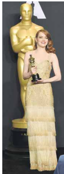
Еми Стоун очекивано "Оскар" за најбољу женску улогу

Док су продуценти филма "Ла ла ленд" Демијена Шазела увелико захваљивали на награди за најбољи филм, на сцену су изашли представници фирме "PwC" која је задужена за пребројавање гласова и саопштили да је у питању грешка