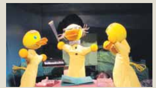
"Школа за пачиће", 18 часова

Ревија најлепших представа Дјечијег позоришта РС од 25. фебруара до 5. марта