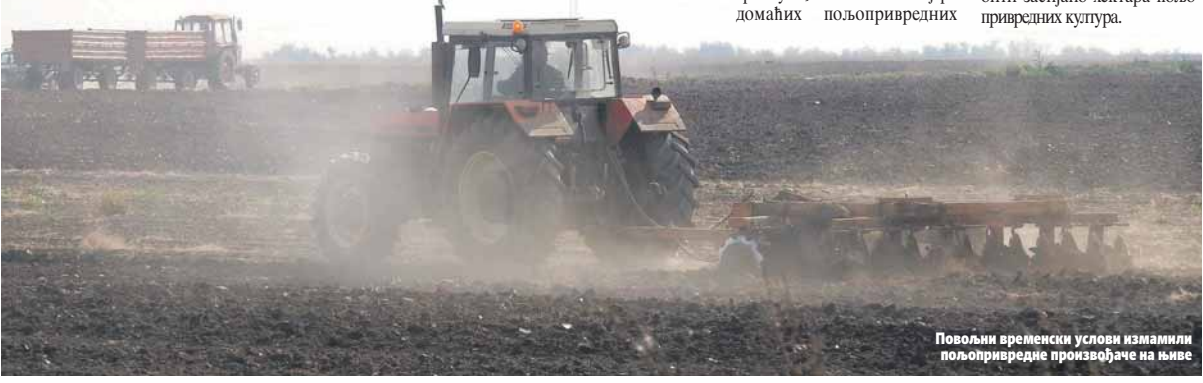
Повољни временски услови измамили пољопривредне произвођаче на њиве

Из Министарства пољопривреде, шумарства и водопривреде РС истичу да ће до половине марта бити познато колико ће ове године у Српској бити засијано хектара пољопривредних култура.