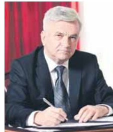
ПИСАЧЕ: Недељко ЧУБРИЛОВИЋ

Тако је 9. јануара 1992. године Скупштина српског народа донијела Декларацију о проглашењу Републике српског народа БиХ, а на првој наредној сједници донесен је Устав и Уставни закон. Ова три историјска документа представљају темеље успостављања Републике Српске на којима почива до данас.