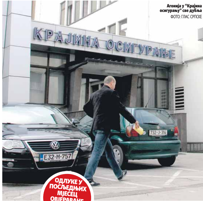
Агонија у "Крајина осигурању" све дубља