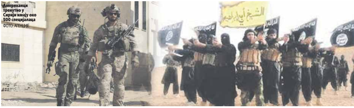
Американци тренутно у Сирији имају око 500 специјалаца

Препоруке које ће Бијела кућа добити највероватније ће укључити и невојне елементе кампање, која је већ у току, попут ограничавања извора финансирања Исламске државе, регрутовања и борбу против пропаганде ове милитантне организације