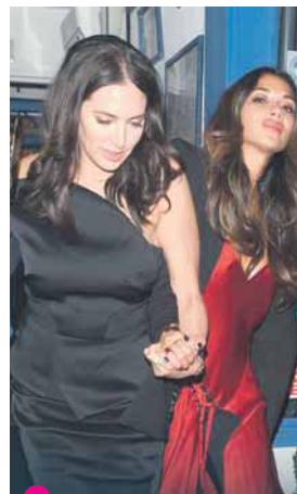
Недавно фотографисана у видно пијаном стању