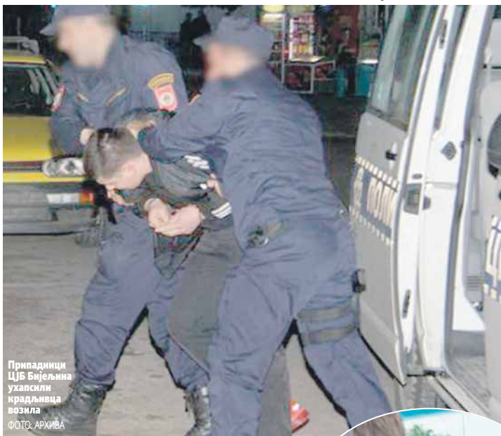
Припадници ЦЈБ Бијељина ухапсили крадљивца возила