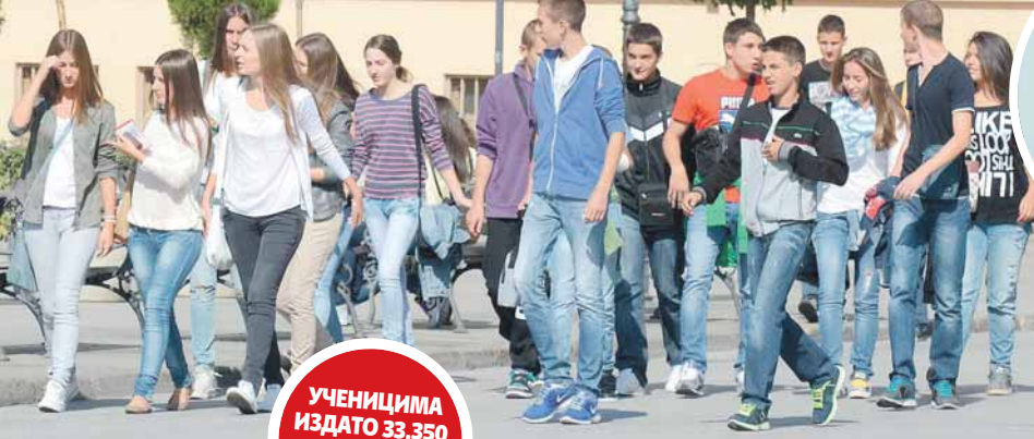
Почеле припреме за упис