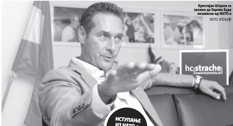
Кристијан Штрахе се залаже да Европа буде независна од НАТО-а