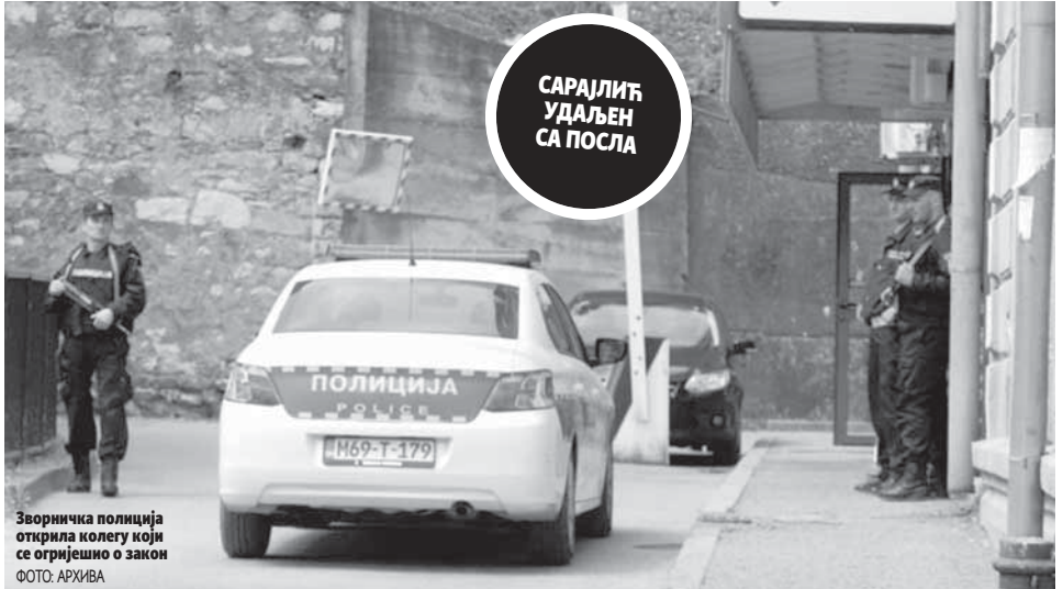
Зворничка полиција открила колегу који се огријешо о закон

У оквиру истраге утврђено је да је осумњичени злоупотребио службени положај на начин да је од више безбједносно интересантних лица узимао новац, а заузврат у Регистру новчаних казни и прекршајним евиденцијама, које користи МУП, извршио фалсифико-