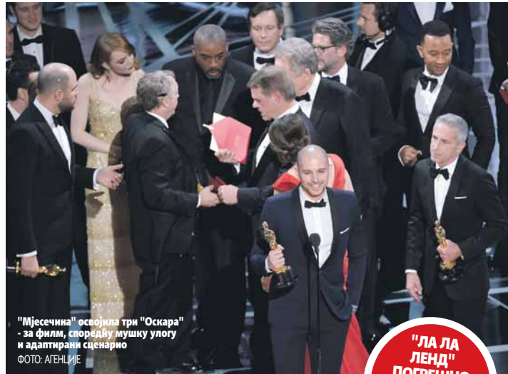
"Мјесечина" освојила три "Оскара" - за филм, споредну мушку улогу и адаптирани сценарио

Данавеј, својој партнерки из филма "Бони и Клајд" од прије 50 година, која је потом и изговорила: "Ла ла ленд".