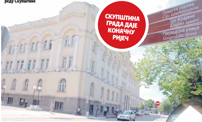
Удружења на дневном реду Скупштине

Вршилац дужности начелника Одјељења за културу, ту-