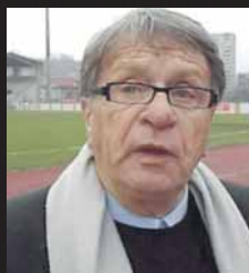
Мирослав Ћиро Блажевић

На клубу "првено-плавих" у девет мечева у Премијер лиги БиХ "првено-плаве" остварио је биланс од пет побједи, једног