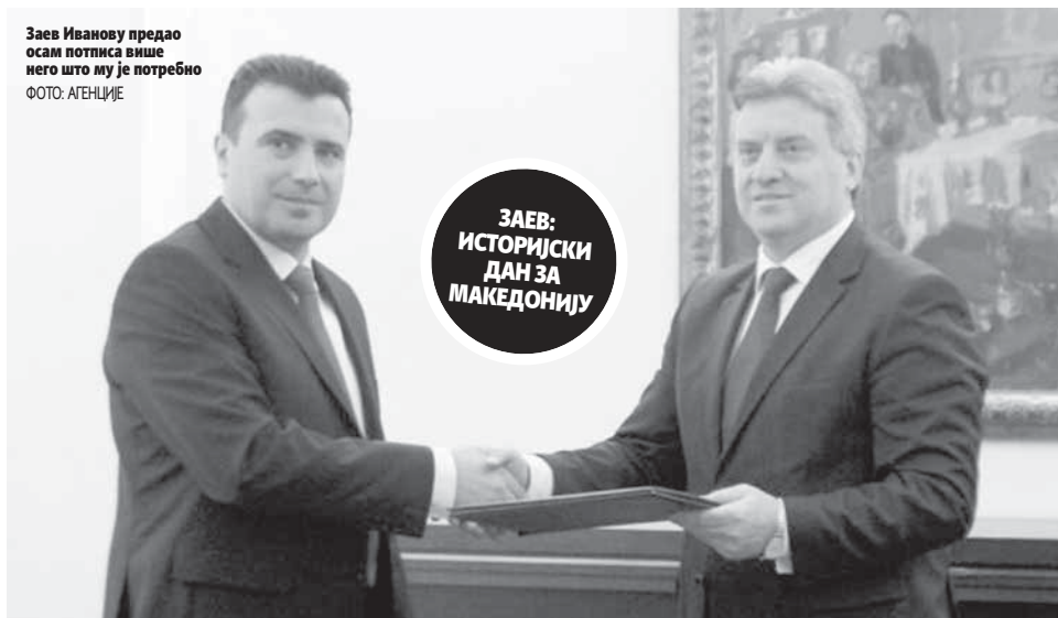
Заев Иванову предао осам потписа више него што му је потребно

Раније је Министарство спољних послова Русије саопштило да су наводи о учешћу Русије у догађајима у Црној Гори неосновани. (Агенције)