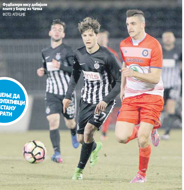
Фудбалери нису добијали плате у Борцу из Чачка

- Јагодина је имала забрану због дугова према 11 фудбалера и тренеру, као и службеним лицима. Од Дисциплинске комисије ФСС доби-