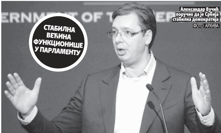
Александар Вучић поручио да је Србија стабилна демократија

Он је навео да уважава многе актере на политичкој сцени, посебно оне који су његови партнери и који добро разумију државу, државне потребе и обавезе, те да је пажљиво размотрио њихову идеју за одржавање парламентарних истовремено са председничким изборима.