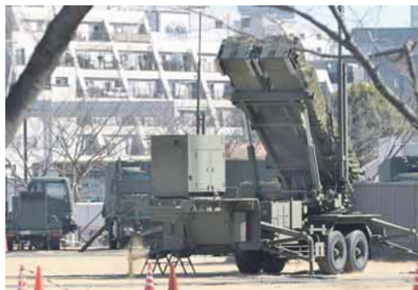
Последњу балистичку ракету Ким Јонг Ун испалио у фебруару

Двадесетогодишњи напори убјеђивања Пјонгјанга да одбаци нуклеарне амбиције су пропале. Не желимо војну акцију, али ако Сјеверна Кореја повећа пријетње својим програмом до нивоа који захтијева реакцију, онда је та опција на столу, рекао државни секретар САД