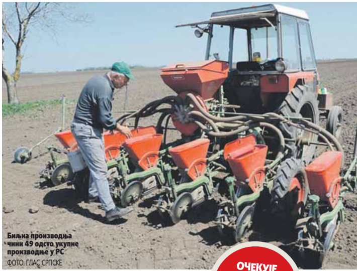
Биљна производња чини 49 одсто укупне производње у РС

Долају да ће пад обима у производњи појединих култура бити компензован кроз благи раст цијена пољоприв-