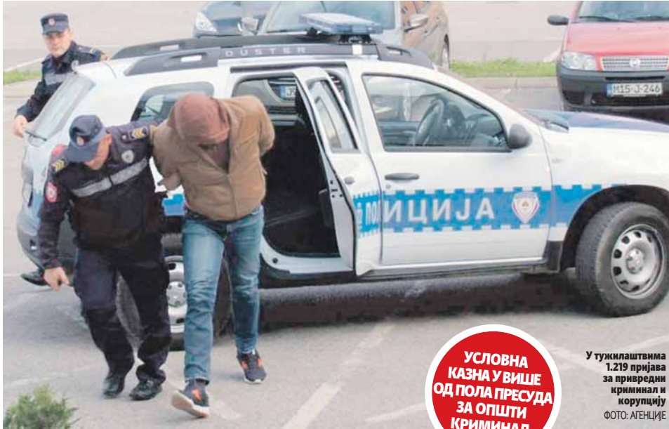
У тужилаштвима 1.219 пријава за привредни криминал и корупцију

За општи криминал подигнуто је 4.288 оптужница, ратне злочине 13, а привредни криминал 168. Судови су донијели 4.245 пресуда, али је у само 672 изречена затворска казна, док је чак 2.525 случајева