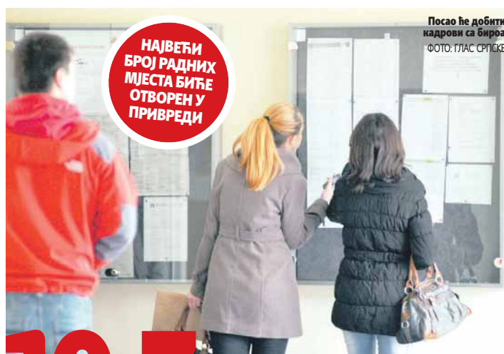
Посао ће добити кадринови са биром

Пројектом за запошљавање приправника планирано је да посао добије 100 лица са високом стручном спремом, док ће два милиона марака бити намијењено за оне који желе да покрену властити бизнис. За њих ће појединачно бити