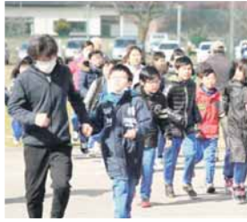
Јапани током вјежбе ишли према евакуационим центрима носећи заштитну опрему

СЕУЛ - Америчка политика "стратешког стрљена" са Сјеверном Корејом је завршена, а војна акција против Пјонгјанга је "опција на столу", навео је у петак амерички државни секретар Рекс Тилерсон током посјете Јужној Кореји.