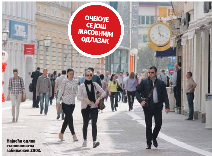
Највећи одлив становништва забиљежен 2003.