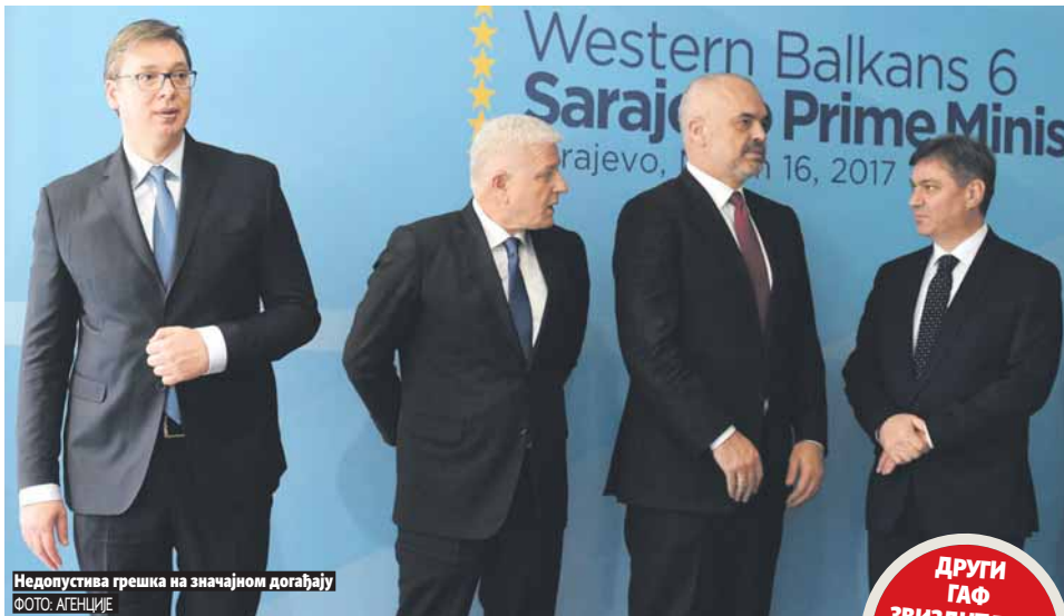
Недопустива грешка на значајном догађају

другој верзији заједничке изјаве, гдје је видљиво да нема важне ријечи "избјегавање".