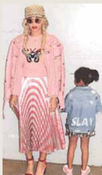
СЕВЕРИНА И БИЈОНСЕ У ИСТОЈ СУКЊИ

Пјевачица Северина Којић своје сјајне модне комбинације готово свакодневно представља пратицима на "Инстаграму", а недавно је све још једном одушевила избором одјеће за шетњу. Пјевачица се одлучила за дизајнерске комаде модне куће "Тучи", те је укомбиновала плисану сукњу и мајицу са торбицом овог престижног бренда. Идентичну сукњу прије неколико мјесеци носила је и тренутно најпознатија трудница на свијету Бијонсе, која је 1300 долара током изласка у Њујорку, а на фотографијама које је поставила на "Инстаграм" позирала је са кћерком Блу Ајви.