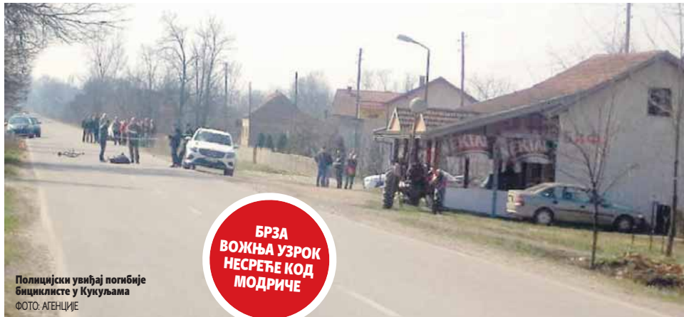
Полицијски увиђај погибије бициклисте у Кукуљама