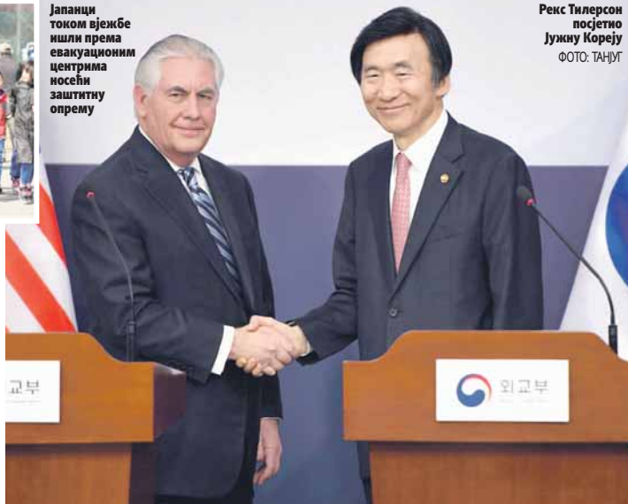
Рекс Тилерсон посјетио Јужну Кореју

Америчке власти разматрају и опцију смјене режима у Сјеверној Кореји, укључујући и смјену председника Ким Јонг Уна. То потврђује и чињеница да су у Јужној Кореји почеле вјежбе америчке војске, у којој први пут учествују специјалне јединице познате као "америчке фокс" које ће се припремати за уклањање лидерства Сјеверне Кореје. Међу њима се налази и тим Сил Тим Сикс који је убио вођу "Ал-Каиде" Осаму бин Ладена.