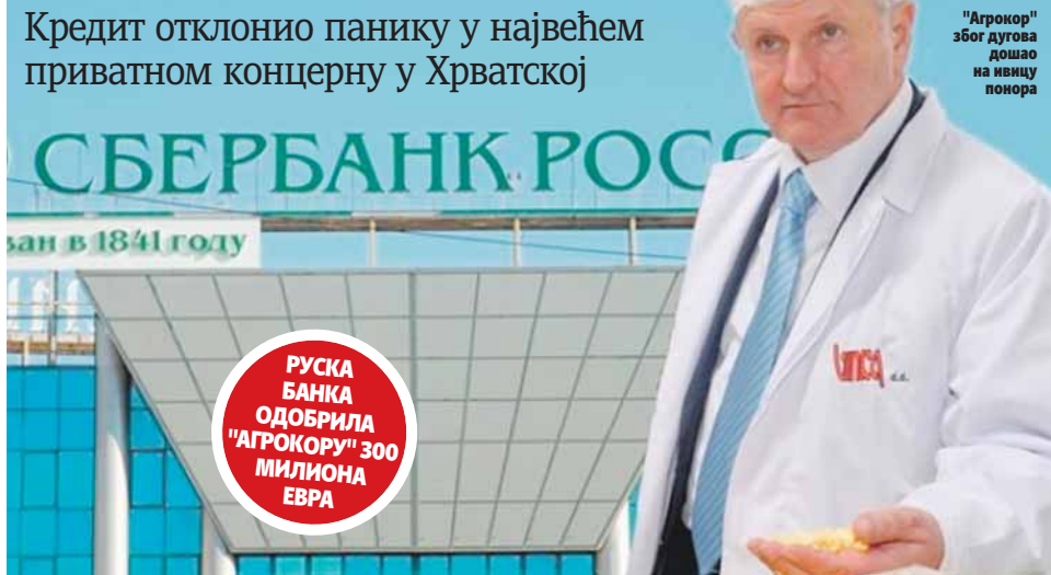
"Агрокор" због дугова дошао на ивицу понора

РУСКА БАНКА ОДОБРИЛА "АГРОКОРУ" 300 МИЛИОНА ЕВРА