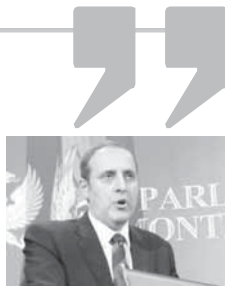
ЦРНА ГОРА ЈЕ ВЕЋ 18 МЈЕСЕЦИ У ВАНРЕДНОМ СТАЊУ.

Посљедица таквог поигравања са једним дијелом хрватске историје директно утиче на атмосферу у друштву, у којем се усташки злочини релативизују, и то на свим нивоима, док се истовремено шири ксенофобија и антисемитизам, саопштено је из "Бет Израела". Та вјерска заједница подсећа да је 80 одсто припадника јеврејске заједнице у НДХ убијено у логорима Јасеновац, Даница, Стара Градишка или су их усташе изручиле нацистима. (Агенције)