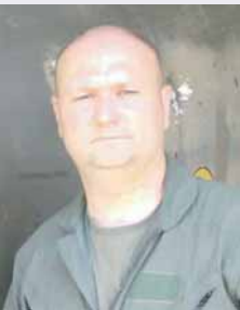
ПИШЕ: ГОРАН АДЗЕР, војни аналитичар

"Меркава" је изузетан тенк који је свој квалитет доказао у ратним сукобима, а посебно на пјесковито-прашњавим теренима који представљају ноћну мору за тенковске посаде