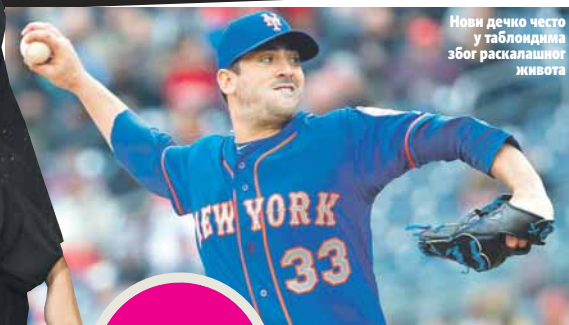
Нови дечко често у таблоидима због раскалашног живота