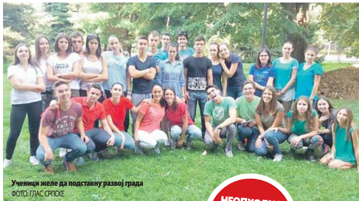
Ученици желе да подстакну развој града

Изабрали смо тему везану за туризам, који не носи са собом само материјалну добит, већ и нове перспективе развоја и уздизање како града, тако и његових становника, рекла Цвијановићева