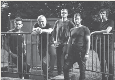
фестивалске вечери. "Лачни Франз" су 1979. године

Култни словеначки рок бенд "Лачни Франз", предвођен харизматичним Зораном Предином, ново је име ревијалног програма јубиларног "Демофеста". "Лачни Франз" ће појачати музички програм "Бетон" бине "Демофеста", на којој ће засвирати у петак, 21. Јула, друге