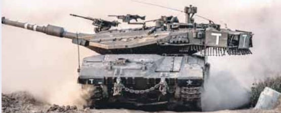
"Меркава 4" има одличан систем палбе и могућност гађања борбених хеликоптера

Освјежења би стигла у прави час, с обзиром на раније информације да у "Еплу" нису задовољни падом продаје таблета из квартала у квартал. Аналитичари већ неко вријеме говоре о замјени 9,7-инчног "ајпеда" и 12,9-