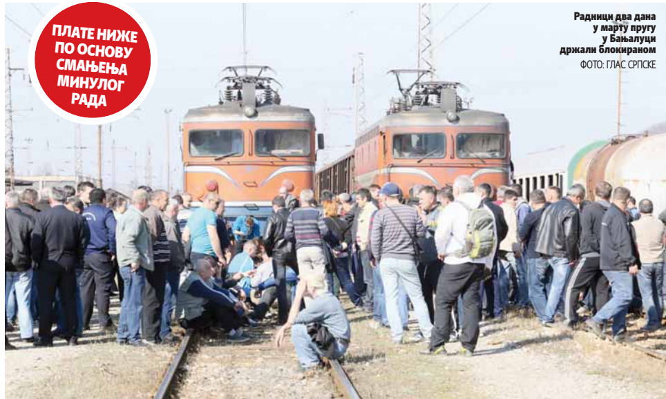
Радници два дана у марту пругу у Бањалуци држали блокираном

А њихови животи неће више зависити од било каквог хуманитарног броја. Имаће шансу на лијечење, имаће шансу на живот.