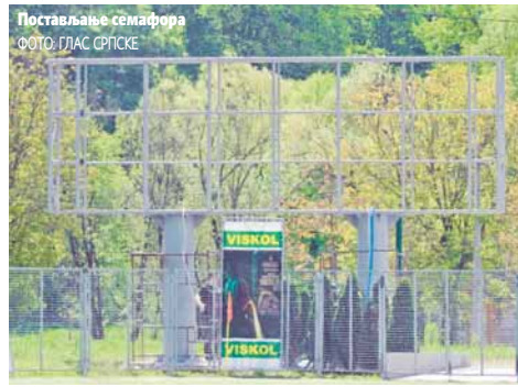
Постављање семафора

тар могућности, а монтиран је на јужној страни стадиона.