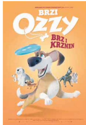
Гласови: титловано Жанр: анимирани Термин: 19 часова