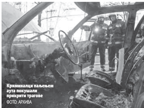
Криминалци паљењем аута покушали прикрити трагове