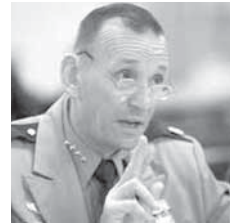
куће читавих 15 минута.

Он наслјеђује Цосефа Кленсија, који је други пут пензионисан у марту, а очекују га проблеми са безбједношћу и осомњем. Само прошлог мјесеца човек је прескочио ограду и шетао се дворштем Бијеле