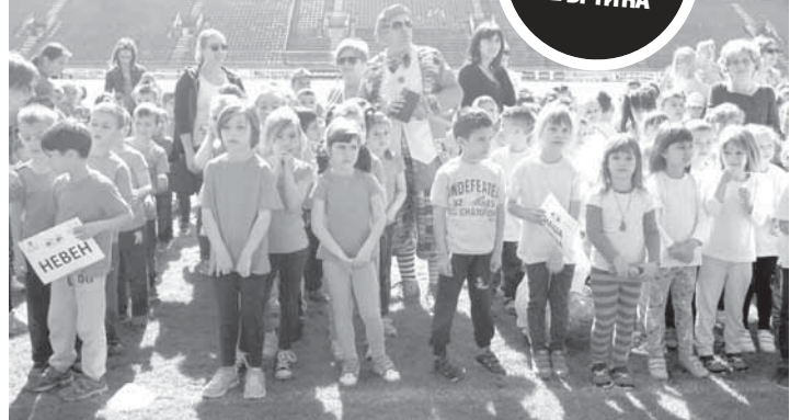
Дјеца испољила велику борбеност

- Идеју за ову манифестацију добили смо прошле године, јер већ имамо омладинске погоне у атлетској школи који броје око 150 чланова. Дјеца се радују јер се на овај начин