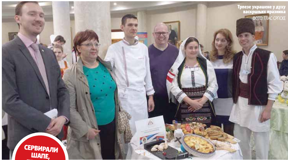
Трпезе украшене у духу васкршњих празника