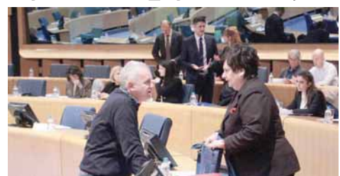
вилног друштва у БиХ - Актаунт.

То су, између осталог, истакли учесници годишње конференције о јавним набавкама која је јуче одржана у Сарајеву у организацији Антикорупционе мреже организација ци-