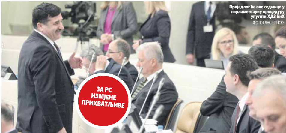
Приједлог ће ове седмице у парламентарну процедуру упућати ХДЗ БиХ

Тај приједлог подразумијева спровођење одлука Уставног суда БиХ које се тичу Мостара, Дома народа Парламента ФБиХ и чланова Председништва из ФБиХ. Што се тиче избора чланова Председништва, приједлог је да ФБиХ буде једна изборна јединица са три изборна подручја. Једно изборно подручје било би са двотрећинском већином једног народа, друго са двотрећинском већином другог наро-