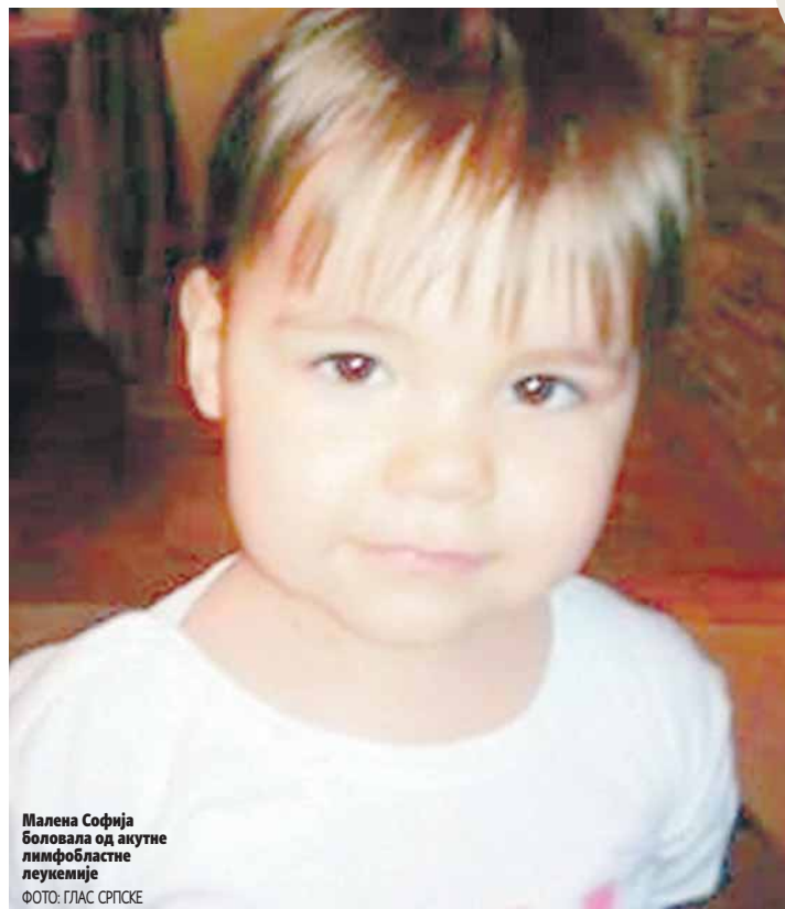
Малена Софија боловала од акутне лимфобластне леукемије

- Јутрос у девет часова стало је срце великог борца, јуна-