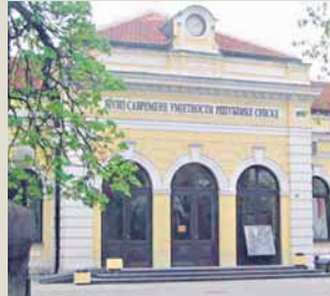
Изложба "Теме и идеје модерног: српско сликарство 1900 - 1941"

МУЗЕЈ САВРЕМЕНЕ УМЈЕТНОСТИ РЕПУБЛИКЕ СРПСКЕ