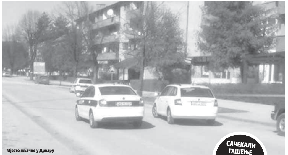
Мјесто пљачке у Дрвару