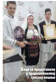
Баци се представили у традиционалној српској ношњи

ма из других школа који су дошли у Москву и упознали њихове обичаје - рекао је Суботић и додао да су се такмичили са младим куварима из православних земаља, Грчке, Србије, Бугарске.