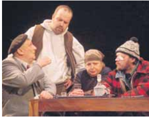
Сцена "Петар Кочић", 20.30 часова Дан за госте "Ђубриште" дипломска представа

НАРОДНО ПОЗОРИШТЕ РЕПУБЛИКЕ СРПСКЕ Велика сцена, 20 часова "Синови умиру први"