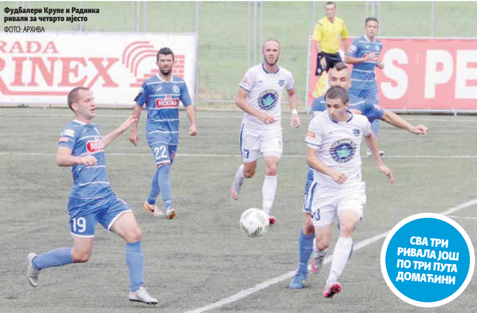
Фудбалери Крупе и Радника ривали за четврто мјесто