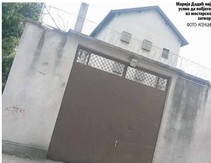
Маријо Дадић није успио да побјегне из мостарског затвора