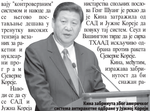
Кина забринута због америчког система антиракетне одбране у Јужној Кореји

Кина је због раста напетости на Корејском полуострву средином мјесеца распоредила додатних 100.000 војника на граници са Сјеверном Корејом, а у уторак је у Јужну Кореју стигла америчка нуклеарна подморница "УСС Мичиген" наоружана са 154 ракете типа "томахавак". Сјеверна Кореја одржала је истовремено најмасовнију војну вјежбу којој је присуствовао и лидер те земље Ким Јонг Ун. (Агенције)