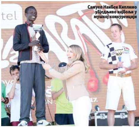
Самуел Наибен Киплимо убједљиво најбољи у мушкој конкуренцији

Ово ми је до сада најбољи полумаратон, за разлику од других стаза овдје је равно и лакше је трчати. Постигао сам добро вријеме, пред финиш сам се осјећао опуштено, рекао је Киплимо