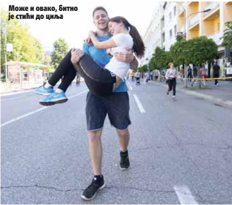
Може и овако, битно је стићи до циља