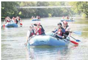
Авантуристички туризам међу главним понудама РС

- Циљ је био окупити присталице разних техника и допринијети дијалогу о теми шта је то заиста образовање и развој цијеловите личности дјетета - рекла је Рајдерова. (Срна)