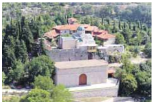
У понуди вјерског туризма издваја се источна Херцеговина

РС све примамљивија дестинација за госте из далеких земаља