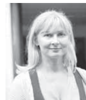
Додик: Поноси смо што је бивши студент Академије поново у Венецији