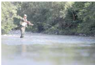
Љубитељима риболова на располагању многи водотоци