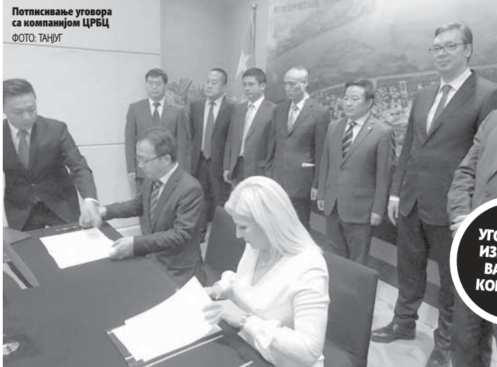
Потписивање уговора са компанијом ЦРБЦ

Алексисом Шипрасом. Вучић је разговарао и са пољском премијерком Беатом Шидло, шпанским премијером Маријаном Рахојем, британским министром финансија Филиппом Хамондом, као и са председником Свјетске банке Џимом Јонг Кимом.