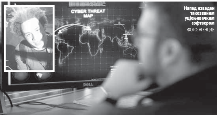
Напад изведен такозваним уцјењивачким софтвером

Планирао сам ићи на факултет, али како сам годину раније добио понуду за посао у једној фирми за компјутерску безбједност, одустао сам од свега. Ионако сам све што знам научио сам па факултет не би био вриједан мог новца и времена - објаснио је млади