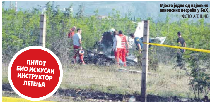
Мјесто једне од највећих авионских несрећа у БиХ

Трагедија се догодила у суботу у поподневним часовима када је у насељу Родоч пао мањи спортски авион, који је