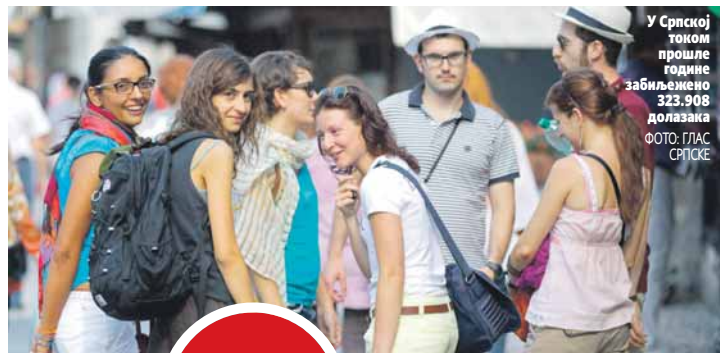
У Српској током прошле године забележено 323.908 долазака

Повећан број кинеских туриста на просторе Балкана очекују првенствено у Србији по укидању визног режима, а уз њу, и наша земља биће им незаобилазна адреса, кажу у Туристичкој организацији РС