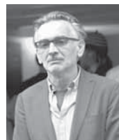
Јанковић: Врло снажно опажање свијета у којем живимо