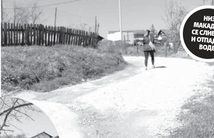
Инфраструктура недостојна 21. вијека

Наша улица је на самом врху Старчевице а припада мјесној заједници Ада. Веома је насељена и дуга скоро два километра јер води до Дебелака. Ипак, годинама живимо као у средњем вијеку, у мрачној макадамској улици пуној рупа у којој уништавамо аутомобиле