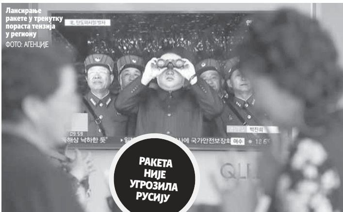
Лансирање ракете у тренутку пораста тензија у региону