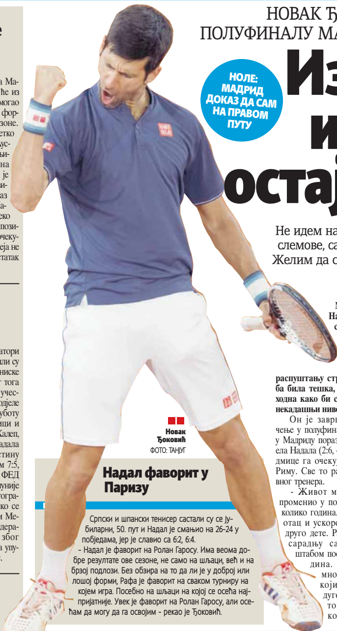
Новак Ђоковић

Новак је наставио процес повратка на нивоу на којем је био до прије годину. - Прозаљим кроз време транзиције. Имао сам среће да осетим тренутке великих успеха и играм дуго година на тако високом нивоу. После Ролан Гароса, тај осећај ме је први пут напустио. Ни-