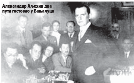
Александар Аљехин два пута гостовао у Бањалуци