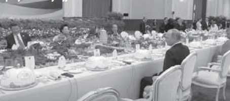
На свечаној вечери ништа није препуштено случају

Кинески председник Си Ђинпинг је у обраћању присутнима на форуму изнио најамбициознију политичку визију за "Иницијативу за Појас и пут свиле", пројекат вриједан више милијарди долара за градњу лука, пруга и других инфраструктурних објеката. Иницијатива покрива 65 држава од Јужног Пацифика преко Јужне и централне Азије до Европе и Африке. Пројекат ће обезбиједити око седам трилиона долара инвестиција у инфраструктуру, што је, према извјештају Азијске банке за развој, том региону неопходно у овој деценији.