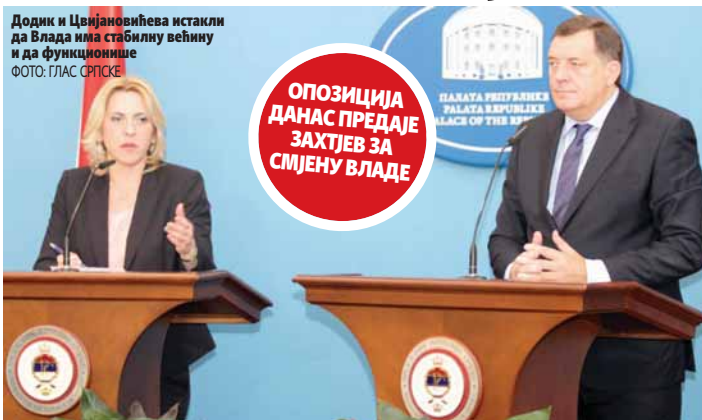
Додик и Цвијановићева истакли да Влада има стабилну већину и да функционише

- Влада је показала катастарфалне резултате, заснована