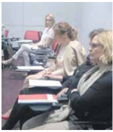
више извјештавати о стварним потребама, могућностима и способностима особа с менталним поремећајима. Радионица је организована у оквиру Пројекта менталног здравља у БиХ који спроводи Асоцијација ХУ у партнерству са ресорним министарствима здравља.