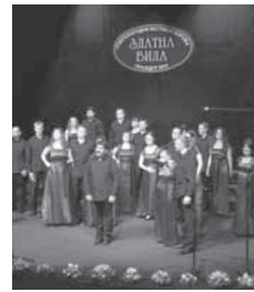
Печуја, а признање за најбоље изведено савремено дјело при-

"Јединство" је добило и друго мјесто по одлуци жирија, док се на треће мјесто пласирао хор "Кантебус Камник" из Словеније. Посебно признање за најбоље изведено дјело старог мајстора додјелиено је Мјешовитом хору из мађарског града