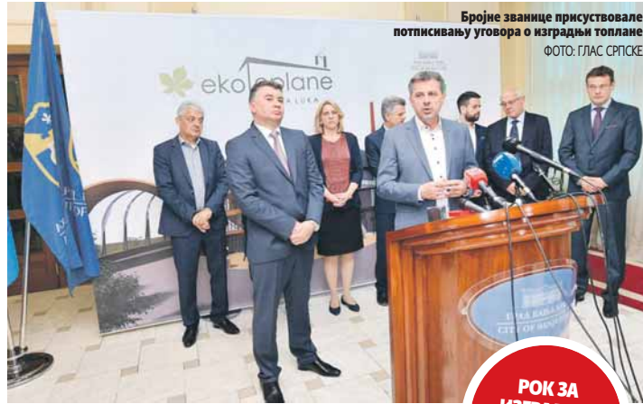
Бројне званице присуствовале потписивању уговора о изградњи топлане