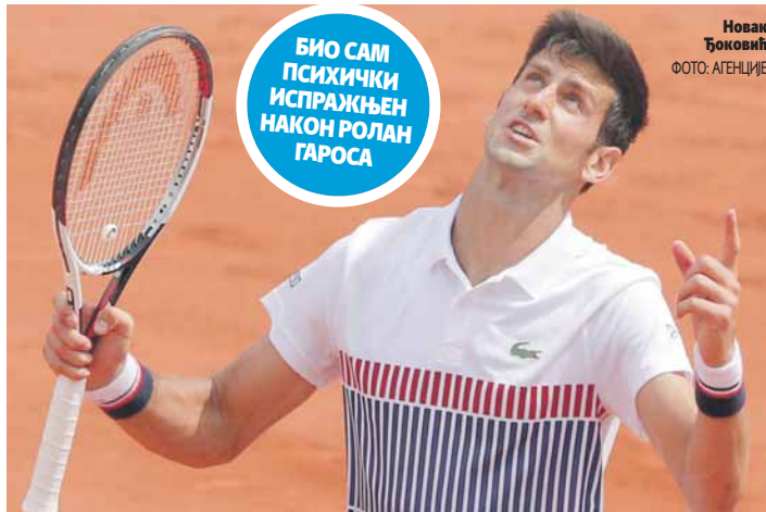
Новак Ђоковић

- Имао сам мотивацију да наставим где сам стао, али сам психички био испражњен. Све емоције као да сам потрошио баш на Ролан Гаросу. Малтене ништа није остало, а при том сам доживео и повреду. Иако сам имао фантастичне успехе