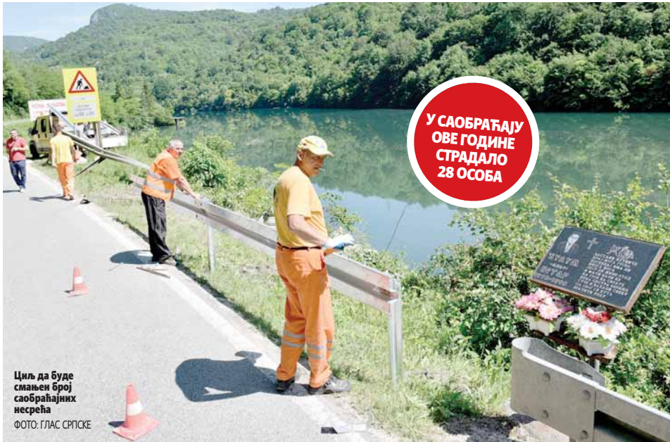
Циљ да буде смањен број саобраћајних несрећа

ПИШЕ: ДРАГАНА ОРЛОВИЋ draganak@glassrpske.com