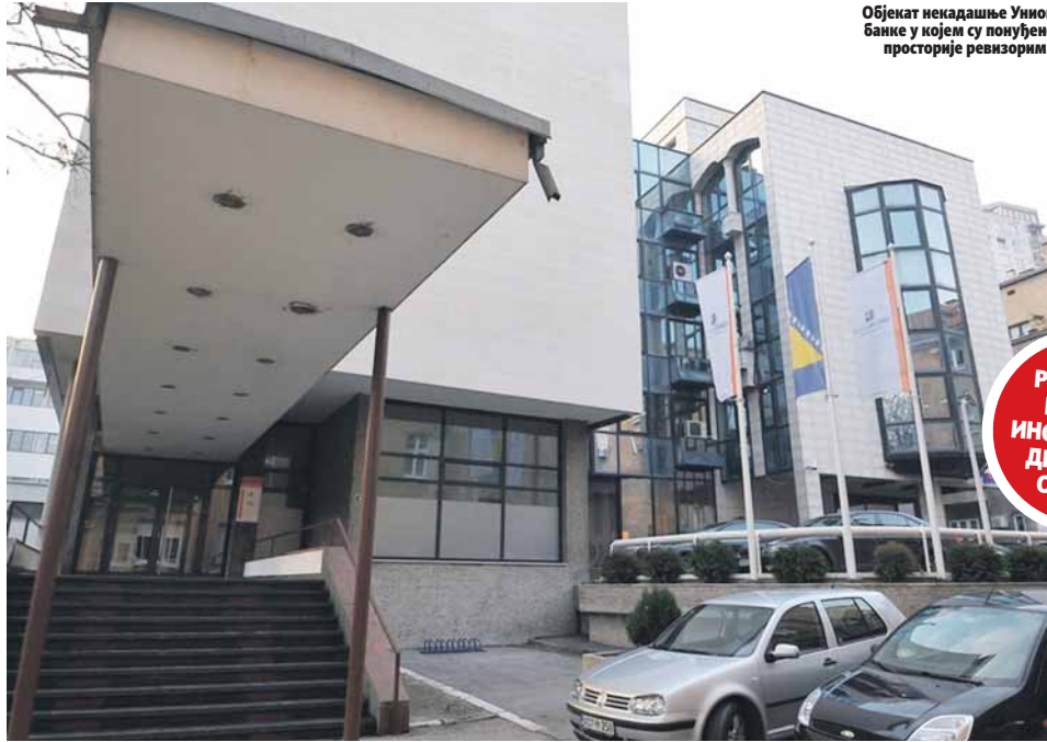
Објект некадашње Унион банке у којем су понуђене просторије ревизорима