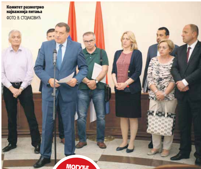
Комитет разматрао најважнија питања

- Ставићемо на дневни ред наше односе да би они били изграђени, односно