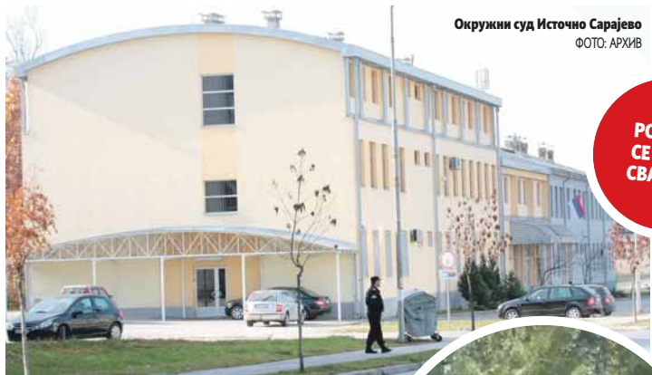
Окружни суд Источно Сарајево