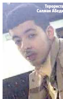
Терориста Салман Абеди