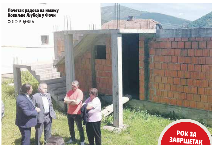
Почетак радова на имању Ковилке Љубоја у Фочи

ПОЧЕЛА ГРАДЊА 20 КУЋА ЗА ИЗБЈЕГЛЕ И РАСЕЉЕНЕ У ФОЧИ