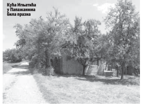
Кућа Игњатића у Папажанима била празна

ли у возило како би се младић учио да вози. Након што су покренули аутомобил, он је изненада кренуо и пригњечило баку Невенку, која је сједила на столици у дворишту. Вјероватно је нагло пустио квичило па је ауто нагло кренуо - испричала је мјештанка која није жељела да јој објавимо име.