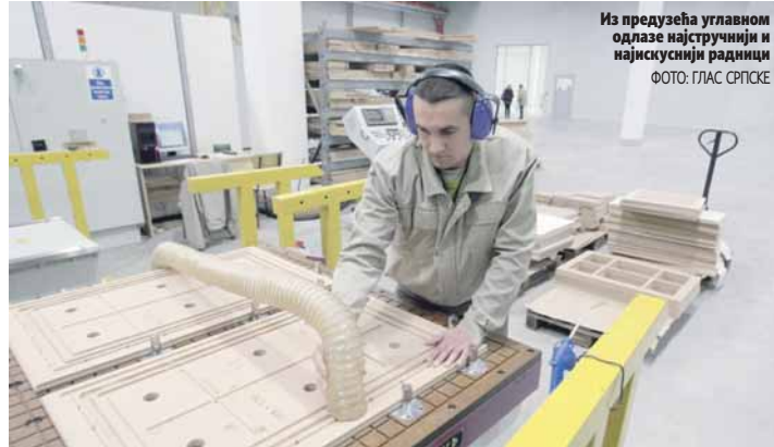
Из предузећа углавном одлазе најстручнији и најискуснији радници