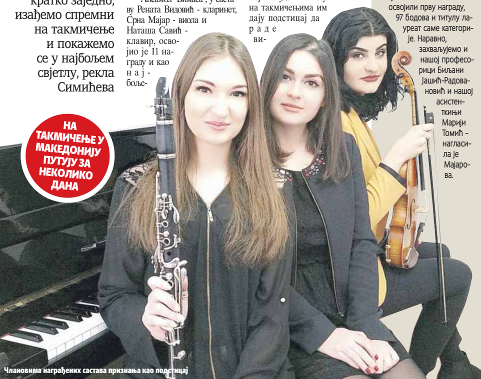
Члановима награђених састава признања као подстицај

НА ТАКМИЧЕЊЕ У МАКЕДОНИЈУ ПУТУЈУ ЗА НЕКОЛИКО ДАНА