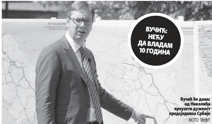
Вучић ће данас од Николића преузети дужност председника Србије

- Нисам лагао грађане, боља времена ће се осећати из дана у дан - казао је одлазећи