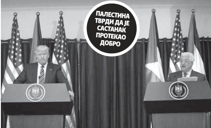
Трамп и Абас на конференцији послије састанка 23. маја у Витлејему

ПАЛЕСТИНА ТВРДИ ДА ЈЕ САСТАНАК ПРОТЕКАО ДОБРО