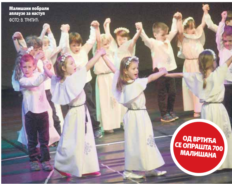
Малишани побрли аплаузе за наступ