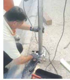
- Корисна нам је свака информација коју добијемо од суграђана, јер они најбоље

Становници су телефонски број 244-593 позивали и због недостатака и оштећења поклопаца на шахтовима и на саобраћајницама, док је било позива и у вези са одржавањем јавног зеленила, одвоџањем отпада и распоредом контејнера.