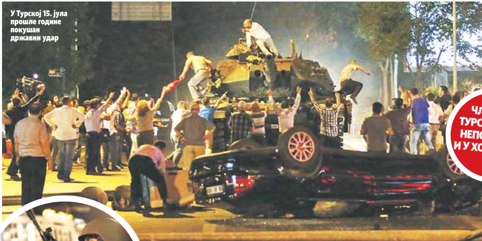
У Турској 15. јула прошле године покушан државни удар