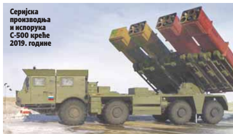
Серијска производња и испорука С-500 креће 2019. године

Систем С-500 може да пресретне балистичке ракете, али и да погоди авионе, хеликоптере и крстарачке ракете