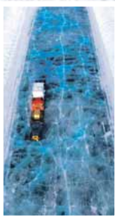
До рудника води ледени пут преко залеђеног језера