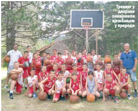
Тренинг у дворани замијенили вјежбањем у природи

Пјесма ће се проламати Ублима и првог викенда у августу када ће бити одржано саборовање народа РС и Црне Горе на које би требало да пристигне више хиљада посетилаца.