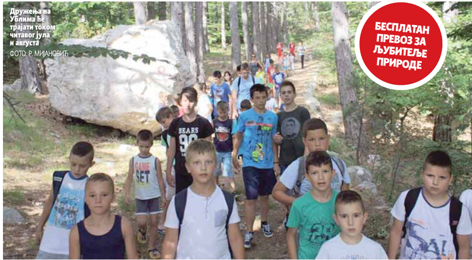
Дружења на Ублима ће трајати током читавог јула и августа.

ПИШЕ: РАТОМИР МИЈАНОВИЋ krozrs@glassrpske.com