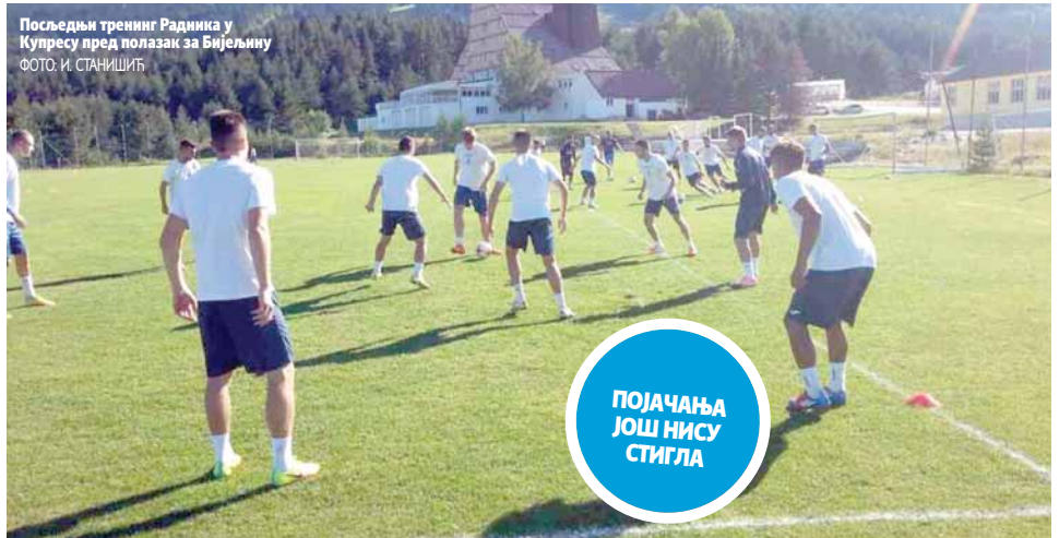
Последњи тренинг Радника у Купресу пред полазак за Бијељину