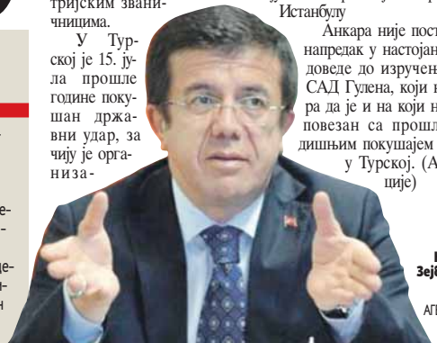
Нихат Зејбекчи

Анкара није постигла напредак у настојању да доведе до изручења из САД Гулена, који негира да је и на који начин повезан са прошлогодњим покушајем пуча у Турској. (Агенције)