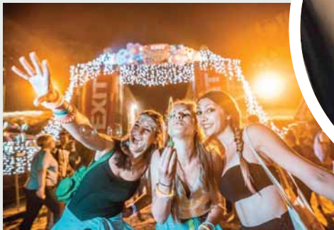
Први пут примијењен концепт "нултог дана" за наступ мегазвијезда