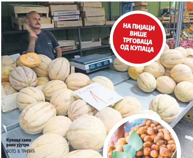
Купаца само рано ујутро

Топимо се и роба и ми, али ко нас пита? Расхлађујемо се како знамо и умјемо, али воћу и поврћу не можемо помоћи. Пропада због високих температура, рекао Шмитран