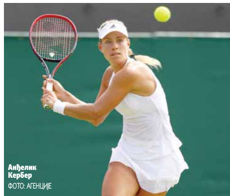
Анђелик Кербер

али је поражена од од Шпанијке након два часа и 22 минута игре, што значи да од наредног понедељка више неће бити прва на WTA листи, а у зависности од резултата које направе, замијениће је Симона Халеп или Каролина Плишкова.