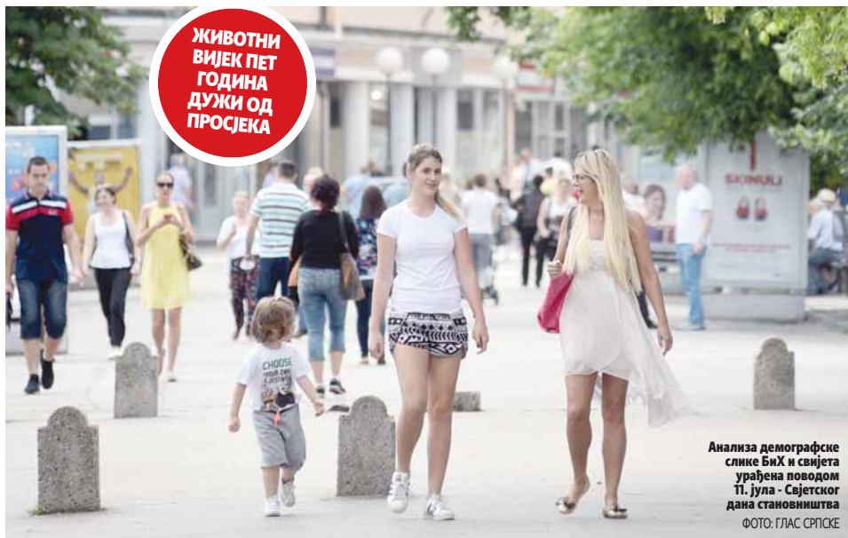
Анализа демографске слике БиХ и свијета урађена поводом 11. јула - Свјетског дана становништва

АГЕНЦИЈА ЗА СТАТИСТИКУ УПОРЕДИЛА ДЕМОГРАФСКУ СЛИКУ БиХ СА ОСТАТКОМ СВИЈЕТА