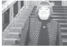
ГЛАС ЈЕ ОТВОРЕН ЗА ДРУГЕ И ДРУГАЧИЈЕ, ЗА СВЕ КОЈИМА СЕ ПОЛИТИКА ЗГАДИЛА.