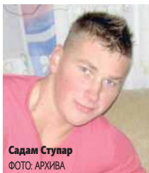
Садам Ступар

Напад на Рифата Коњића у Тузли откривен након седам мјесеци