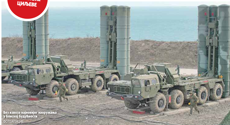
Без извоза најновијег наоружања у блиској будућности