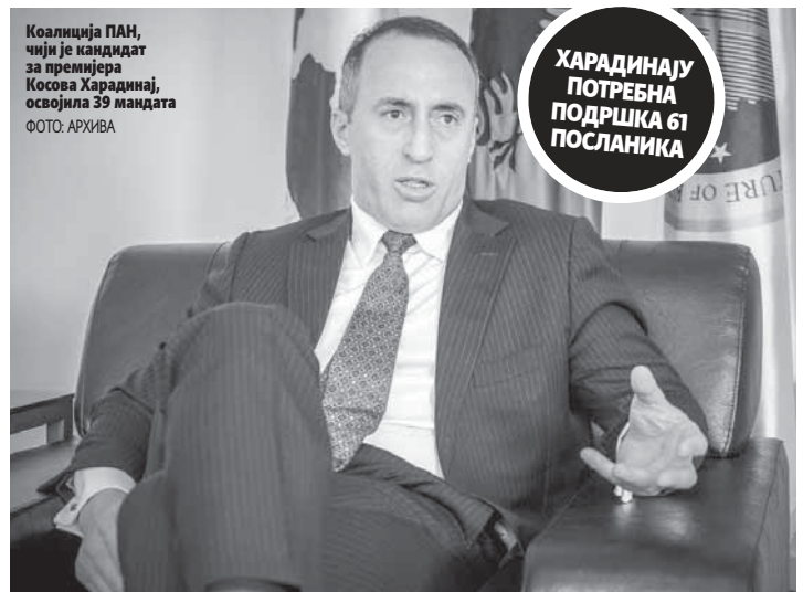
Коалиција ПАН, чији је кандидат за премијера Косова Харадинај, освојила 39 мандата

Одмах послје верификације мандата посланицима настојају да одржим консултације са свим политичким партијама. То се посебно односи на "Самоопредјељење" и Српску листу, јер од њих очекујем подршку у стварању већине за формирање владе, рекао Харадинај