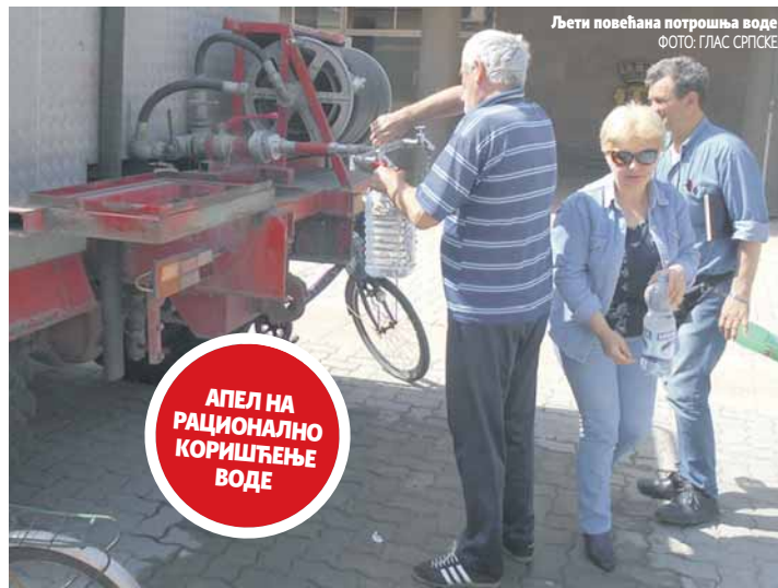
Љети повећана потрошња воде

селима потрошња воде повећана и три пута.