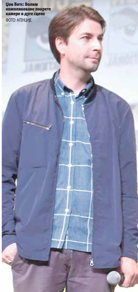
Џон Вотс: Волим компликоване покрете камере и дуге сцене

Пошто смо моја екипа и ја настављали почетну причу, нисмо морали да правимо додатна објашњења и да причамо оно што већ сви знају. Једноставно смо се забављали идејом о петнаестогодишњаку који постаје суперхерој, рекао Вотс