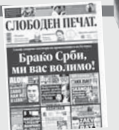
Заев: Македонија посвећена добросусједским односима са Србијом

У Јеку тензија између Македоније и Србије у вези са повлачењем српских дипломата из Скопља један македонски лист освајао је с насловницима "Браћо Срби, ми вас волимо". Ради се о листу "Слободен печат", који је уз текст о томе како је званично Скопље смирено одговорило на провокације из Београда великим словима написао "Браћо Срби, ми вас волимо".