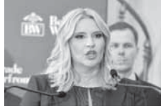
КАД ВАС ВУК ЈЕРЕМИЋ НАПАДА ЗНАТЕ ДА СТЕ У ПРАВУ.

- Мигранти су сада свесни да ће дужи период провести у Србији пре него што оду, али знају и да имају могућност да остану у Србији, мада је број оних који то желе веома мали - казао је Цуцић. (Агенције)