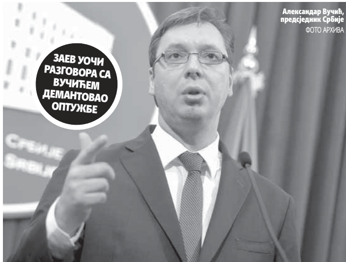
Александар Вучић, председник Србије

- Србија и Македонија ће искључиво дијалогом рјешавати сваку евентуалну несугласицу у међусобним односима. Без обзира на све политичке разлике у одређеним важним полити-