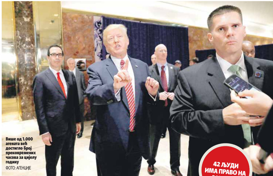
Више од 1.000 агената већ достигли број прекровених часова за цијелу годину

Обавјештајци само за најам возила за Трампове голф терене потрошили 60.000 долара, док су на пословном путу Ерика Трампа у Уругвај потрошили око 100.000 долара на хотелске собе