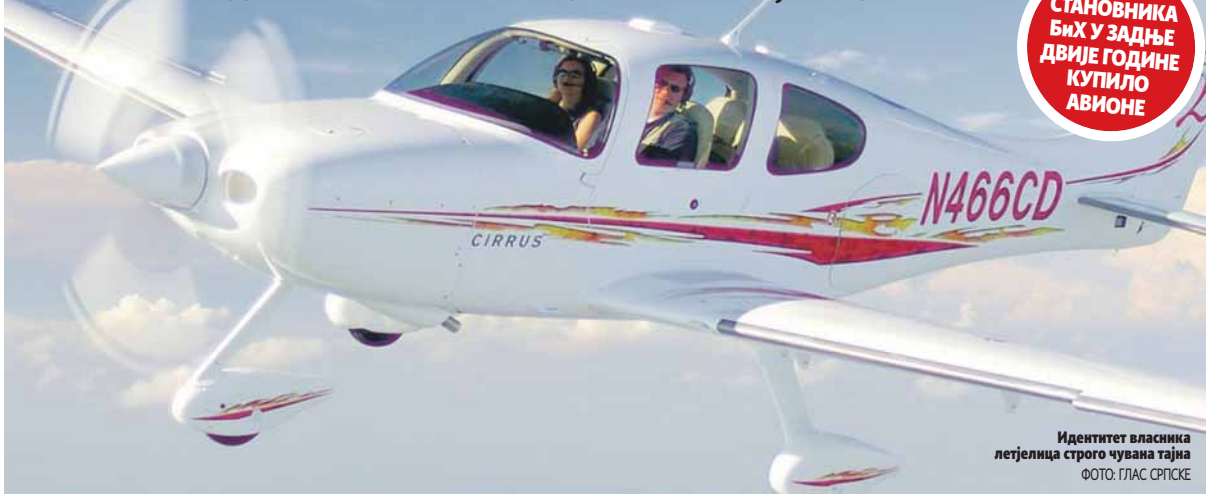
Идентитет власника летјелица строго чувана тајна

ПИШЕ: ДАНИЈЕЛА СТОКАНИЋ danieljelas@glassrpske.com