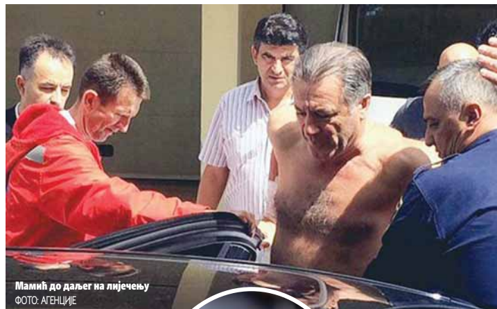
Мамић до даљег на лијечењу

Према незваничним информацијама, пронађена су и два зрна - један на зиду оближње куће и други у "голфу 7". Муниција 7,65 милиметара користи се за пиштоље ЦЗ - М70, "берета", "маузер", као и аутоматски пиштољ "шкорпион".