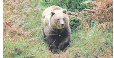
Медвјед данима пустоши штале у кнежевачким селима

пут "вечерати" у некој од сеоских штала, мјештани села Марићи организовали су ноћне страже, да би сачували стоку.