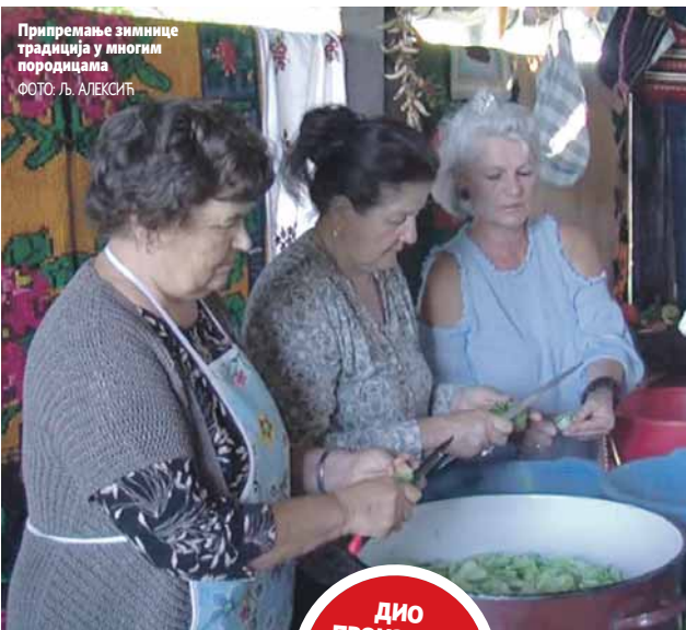
Припремање зимнице традиција у многим породицама

С обзиром на то да је Семберија пољопривредни крај на овим просторима углавном преовладава мишљење да је зимницу ипак боље правити, па је домаћа зимница и ове године поразила куповну. Чланице Удружења жена "Бели анђеос" из Дворова од заборава чувају традиционалне рецепте и са љубављу ис-