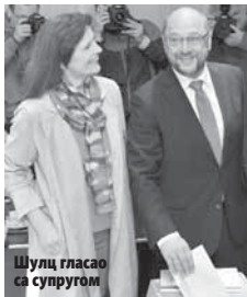
Шулиц гласао са супругом

мети критика 2015. послите одлуке да отвори врата мигрантима и избјеглицама.