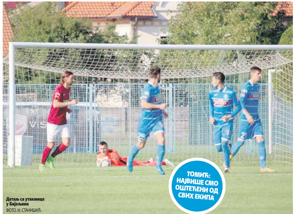
Детаљ са утакмице у Бијељини

- Пенал је одлучио даљи ток утакмице. Не знам има ли смисла радити неке ствари? Можемо ми радити колико хоћемо, али цаба је. То сам говорио након гостовања у Бањалуци, није имало превисше одјека, указивао сам на те ствари и након дјела са Жељезни-