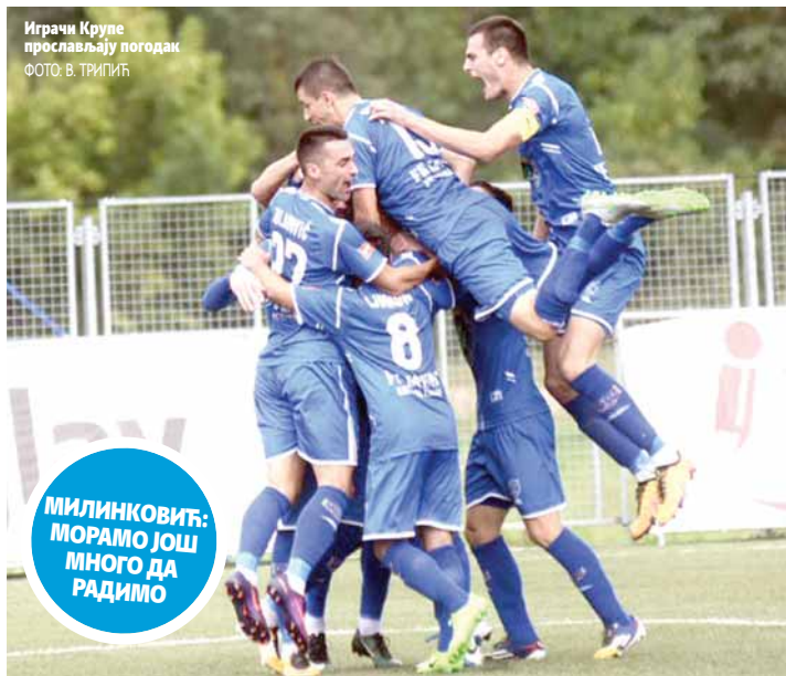
Играчи Крупе прослављају погодак