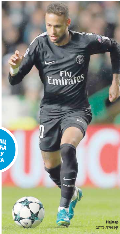
Нејмар

Велика прашина дигла се самим Нејмаровим преласком из Барселоне која је на име обештећења добила 222 милиона евра, а сада је Бразилца поново доспιο у жижу. Према подацима "Шпигла" Нејмар зарађује нејвероватних 3.069.520 евра мјесечно, односно око 4.000 евра на сат, односно скоро 37 милиона евра годишње. Ова сума не укључује разне бонусе које Нејмар има у уговору, а који зависе од његових партија на терену и резултата "светаила", а уколико се све поклопи, односно ако испуни оно због чега је доведен мјерећи у