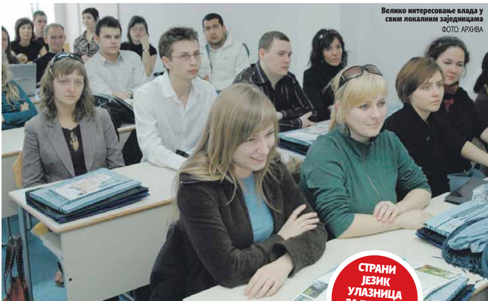
Велико интересовање влада у свим локалним заједницама