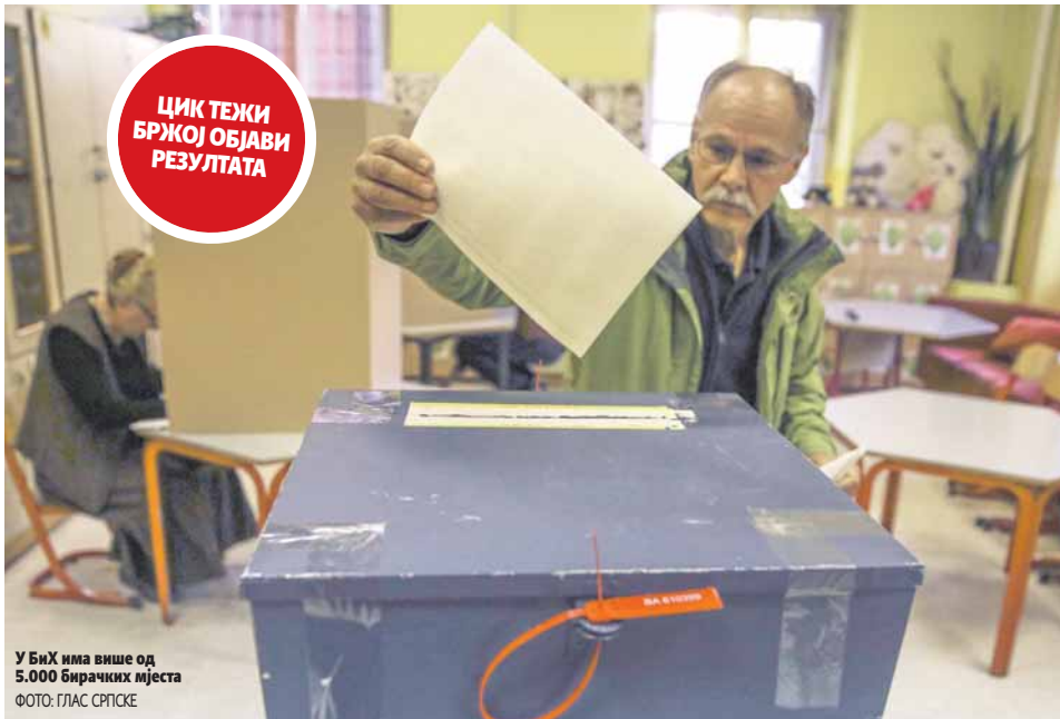
У БиХ има више од 5.000 бирачких мјеста

Кораци које БиХ мора одмах направити су тачна идентификација бирачког списка, употреба електронских гласачких машина на бирачком мјесту, те нови дизајн гласачког листића прилагодљив електронском гласању