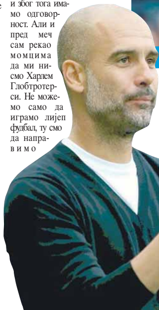
Пеп Гвардиола задовољан стартом сезоне

МАНЧЕСТЕР СИТИ СИЛАН НА СТАРТУ ПРЕМИЈЕР ЛИГЕ