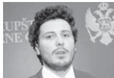
ЦРНА ГОРА ЈЕ СЈЕВЕРНА КОРЕЈА БЕЗ РАКЕТА.