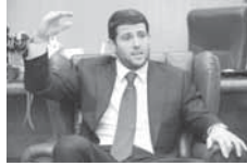
НЕ ЗНАМ ДА ЛИ САМ КОЊ, АЛИ САМ МАРЉИВО РАДИО.

Не желећи да прихвати пораз, до тада владајући СПС и његов лидер Милошевић изазвали су постизборну кризу која је запретила озбиљним сукобима и насиљем. ДОС је позвао на демонстрације због непризнавања резултата избора за председника СРЈ, а криза је окончана 5. октобра, после масовних протеста широм Србије, одступањем Милошевића с власти. (Агенције)