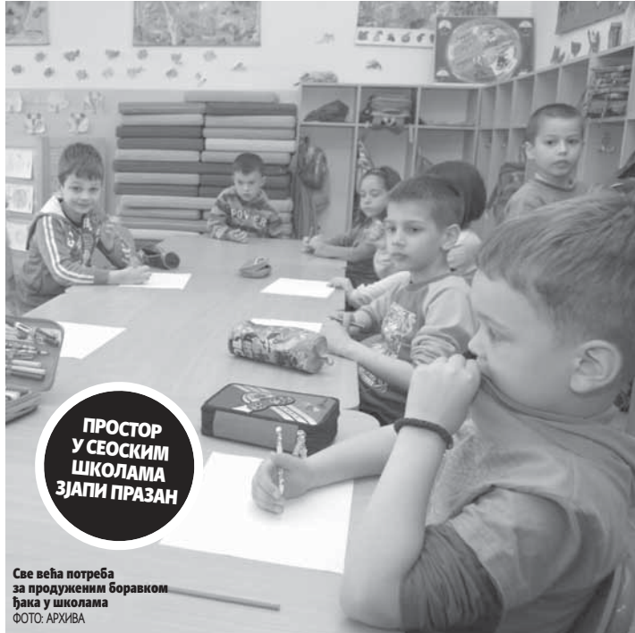
Све већа потреба за продуженим бораваком ђака у школама

- Због тога ресорном министарству ни ове године нисмо подносили захтјев за организацију проширеног програма. Постоји пројекат према којем је у плану надоградња школе и када би се обезбиједило новац за то, онда бисмо могли планирати