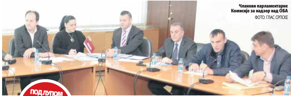
Чланови парламентарне Комисије за надзор над ОБА