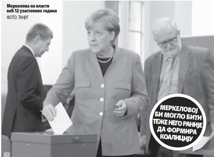
Меркелова на власти већ 12 узастопних година

Према анкетама, конзервативни блок Меркелове на путу је да остане највећа посланичка група, али би могло да јој буде теже него раније да формира владајућу коалицију. Истраживања јавног мњења показују да би Хришћанско-демократска унија (ЦДУ) Меркелове могла да добије око 37 одсто гласова. Њен главни противкандидат, лидер Социјалдемократске партије (СПД) Мартин Шулиц, није успео да озбиљније нашкочи ЦДУ током изборне кампање, а анкете предвиђају да ће освојити мало више од 20 одсто гласова. На унутрашњем плану, јака економија, снажно повјерење и ниска незапосленост на страни Ангеле Меркел, али је, с друге стране, канцеларка била на