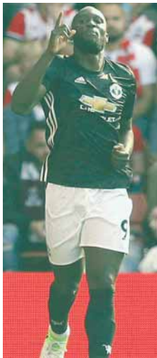
Ромелу Лукаку донио победу Манчестер јунајтеду

Премијер лига, 6. коло: Лестер - Ливерпул 2:3 (Оказак 45+3, Варди 69 - Салах 15, Кутињо 23, Хендерсон 68), Евертон - Борнмут 2:1 (Нијасе 77, 82 - Кинг 49), Манчестер с. - Кристал Палас 5:0 (Сане 44, Стерлинг 51, 59, Агуеро 79, Делф 89), Саутемптон - Манчестер ј. 0:1 (Лукаку 20), Стоук - Челси 0:4 (Мората 2, 77, 82, Педро 30), Свонси - Вотфорд 1:2 (Абрахам 56 - Греј 13, Ричарсон 90), Барнли - Хадерсфилд 0:0, Вест Хем - Тотенхем 2:3 (Чичариот 65, Кујате 87 - Кејн 34, 38, Ериксен 60). Синоћ: Брјатон - Њукасл. Вечерас: Арсенал - БВА (2:1).