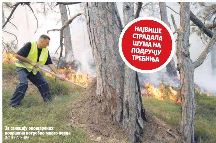
За санацију опожарених површина потребно много новца