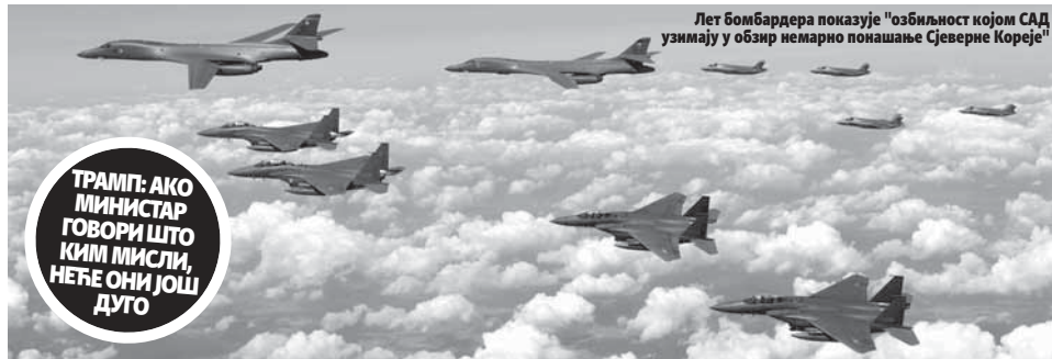
Лет бомбардера показује "озбиљност којом САД узимају у обзир немарно понашање Сјеверне Кореје"

ТРАМП: АКО МИНИСТАР ГОВОРИ ШТО КИМ МИСЛИ, НЕЋЕ ОНИ ЈОШ ДУГО