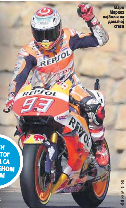
Марк Маркез најбољи на домаћој стази