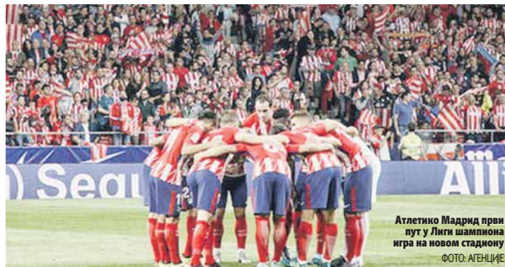
Атлетико Мадрид први пут у Лиги шампиона игра на новом стадиону

УЕФА им је наводно запрјетила избацивањем уколико не испоштују правило финансијског фер-плеја. Челини људи клуба одмах су реаговали и чак осморницу играча су ставили на трансфер листу како би их продали наредног љета, али тиме су још више унијели немир у свлачилиницу. Великанима