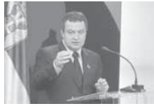
НИСАМ ЈА ДОНАЛДУ ТРАМПУ ПРИШАО НЕНАЈАВЉЕНО. ОН ЈЕ МЕНЕ ПОЗВАО. ТО ЈЕ МОЈ СТАРИ ПРИЈАТЕЉ.

Високи званичници специјализованих служби суда потврдили су да су спремни за прве оптужнице Специјалног тужилаштва, али не желе да износе детаље у вези са истрагом.