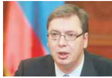
НИТИ СУ ПОЛИТИЧАРИ У РС МАЛА ДЕЦА, НИТИ САМ ЈА БИЛО КАКАВ ВЕЛИКИ ТАТА.

- Та сарадња је интензивна. Ми једни без других не можемо да сачувамо оно што су елементарне вриједности нашег народа, а то су култура, писмо, језик, вјера и идентитет - нагласио је Цицовић. (Срна)