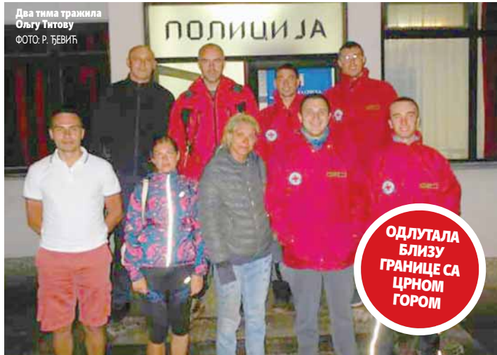
Два тима тражила Ољгу Титову

ПИШУ: РАДМИЛА ЂЕВИЋ krozrs@glassrpske.com НЕВЕНА БУНИЋ NevenaB@glassrpske.com