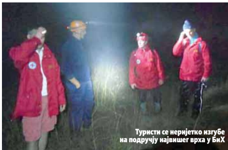
Туристи се неријетко изгубе на подручју највишег врха у БиХ