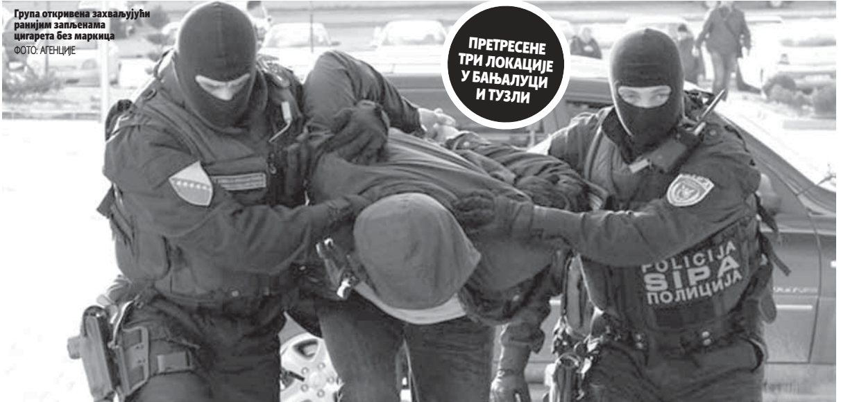
Група откривена захваљујући ранијим запленама цигарета без маркица