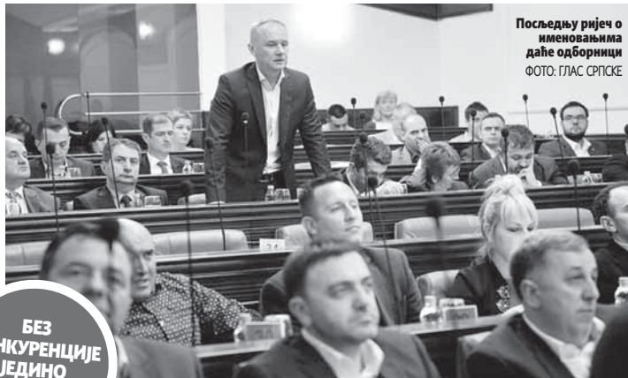
Последњу ријеч о именовањима даће одборници

Након позитивног мишљења комисије приједлози су упућени у скупштинску процедуру и о њима би требало да се изјасне одборници на