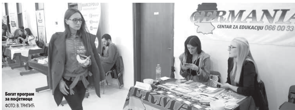
Богат програм за посетиоце

Европски дан језика обиљежен у Народној и универзитетској библиотеци Републике Српске