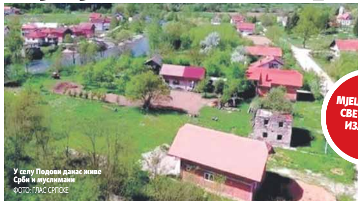
У селу Подови данас живе Срби и муслимани

Споменик, чији је илејни пројекат био на увид почетком јула у просторијама општине Сански Мост, о чему су мјештани тек недавно обавјестили, требало би да буде изграђен на захтјев Удружења ветерана и демобилисаних бораца Армије БиХ из Санског Моста. Како су објаснили у