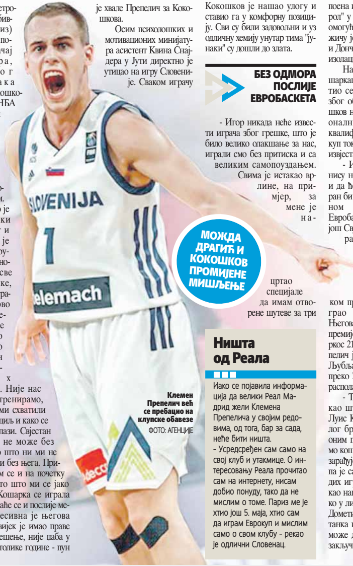
Клемен Препелич већ се пребацио на клубске обавезе

Осим психолошких и мотивационих минијатура асистент Квина Снајдера у Јути директно је утицао на игру Словеније. Сваком играчу