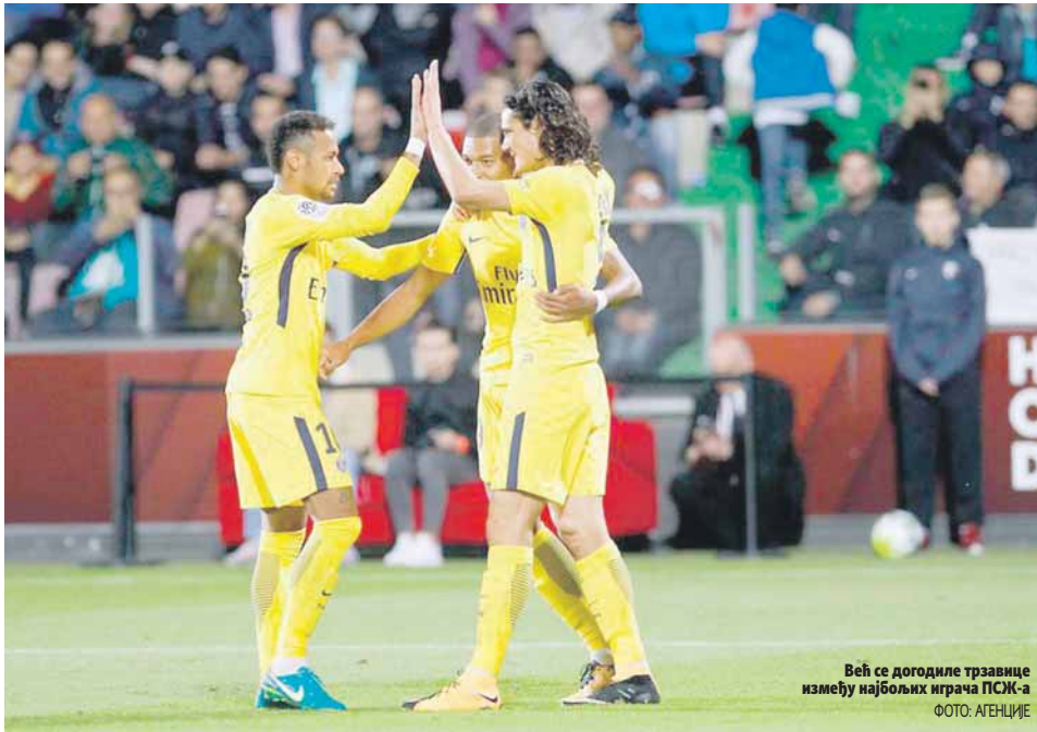
Већ се догодили тразвице између најбољих играча ПСЖ-а