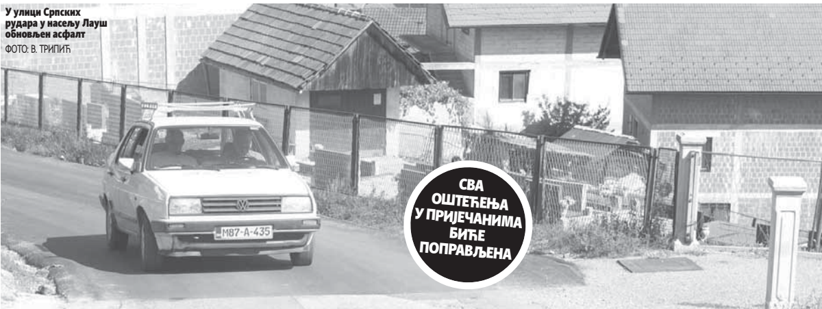
У улици Српских рудара у насељу Лауш обновљен асфалт

како бисмо без проблема ушли у зиму - објаснио је Новаковић.