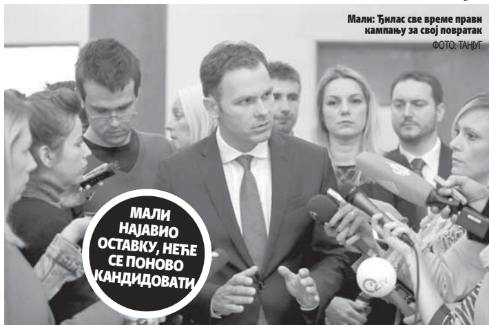
Мали: Ђилас све време прави кампању за свој повратак

Потпуно ми је јасно због чега сам био предмет најпрљавије и најодвратније кампање. Сада када видим ко је кандидат на другој страни, видим и ко је новац у кампању против мене уложио. То су Драган Ђилас и његови тајкуни, рекао Мали