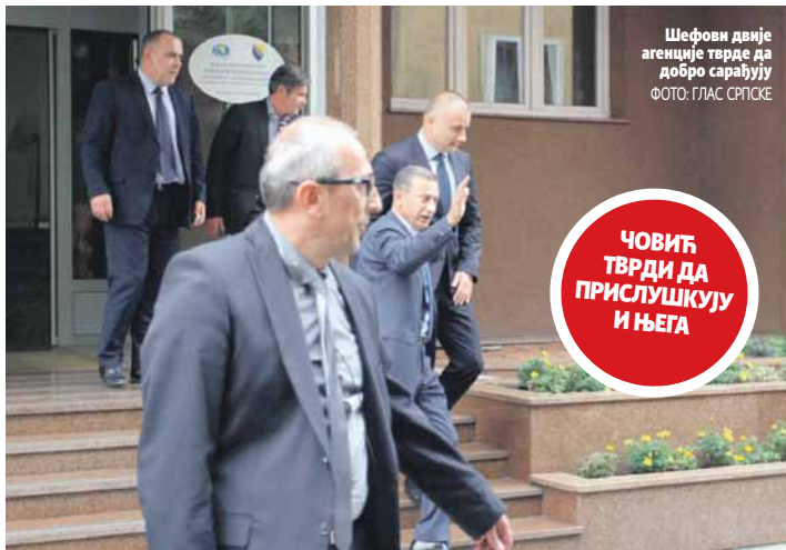
Шефови двије агенције тврде да добро сарађују