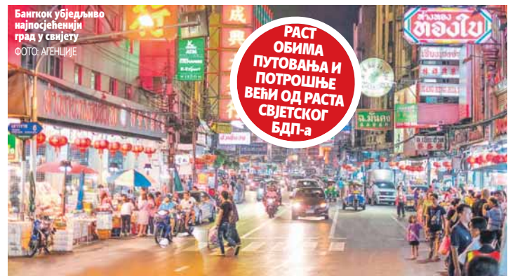
Бангкок убједљиво најпосјећенији град у свијету

Студија показује и да је раст обима међународних путовања и потрошње у најпосјећенијим дестинацијама већи од раста свјетског бруто домаћег производа (БДП) и за највећи дио градова обухваћених истраживањем су управо путовања и туризам кључна компонента привредног раста.