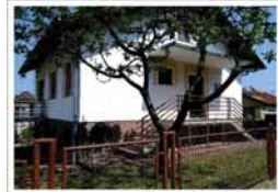
Продајем кућу на три етаже (три стана) са грађевинском и употребном дозволом. Ул. Милешевска, Обилићево, Мејдан. Тел. 065/935-191

Бањалука - Драгочај, продајем нову кућу 7,5x7,5 м, П+М, приземље завршено и фасада, зидана шупа са гаражом, плац 500 м 2 , тел. 065/569-294