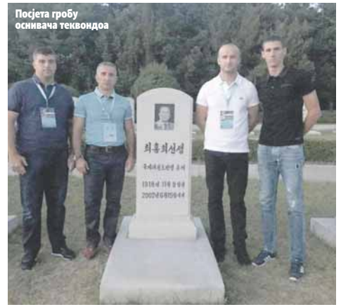
Посјета гробу оснивача теквондоа

ТЕКВОНДОИСТИ СРПског СОКОЛА ВРАТИЛИ СЕ СА СВЈЕТског ПРВЕНСТВА