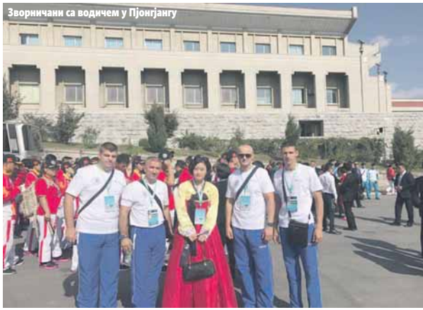
Зворничани са водичем у Пјонгјангу