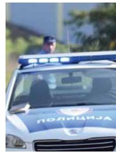
отишао. Нешто касније позвао је Полицијску станицу и