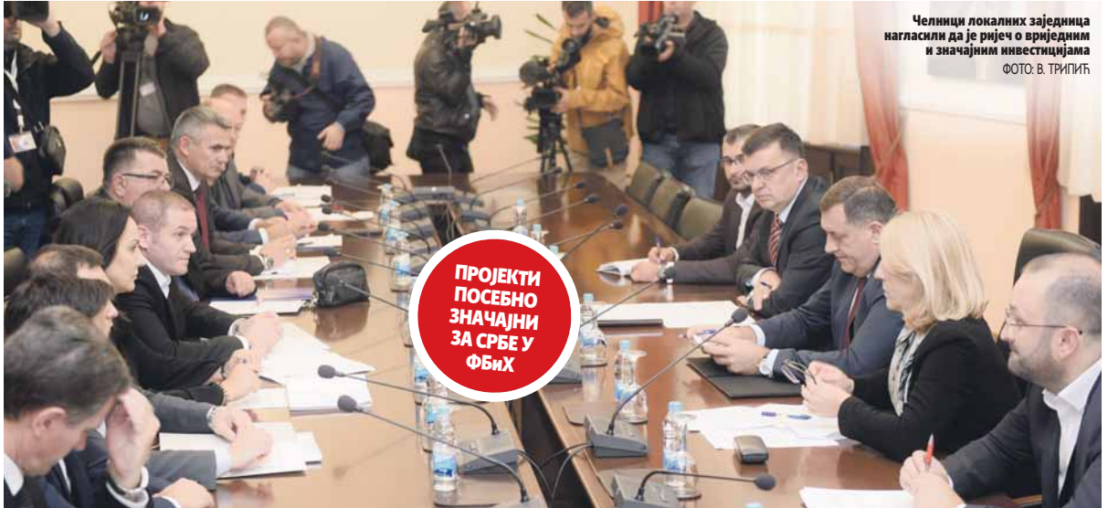
Челници локалних заједница нагласили да је ријеч о вриједним и значајним инвестицијама

Предсједник РС Милорад Додик изјавио је послједице састанка да је новац, који је обе-