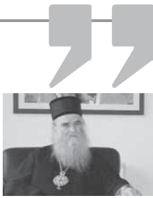
МАРКСИСТИ ИЗ НЕВЛАДНИХ ОРГАНИЗАЦИЈА ОД МЕНЕ ПРАВЕ ИЗДАЈНИКА ЦРНЕ ГОРЕ.

Новац је легао на општински рачун крајем минуле седмице, када је уплаћено готово 60.000 евра. Ђукановићева компанија, која је власник земљишног комплекса од 20.000 квадрата на самом улазу у Будву, у подножју брда Кошљун, годинама није измиривала пореске обавезе према општини на име пореза на непокретност. Преостало је да се измире још само камате, чиме би "Глобал Монтенегро" послје нива година поново био на бијелој листи општине Будва. (Агенције)