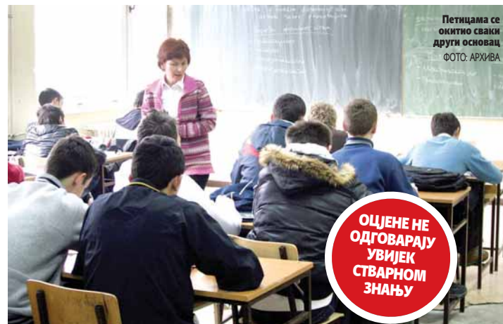
Петицама се очитују сваки други основца