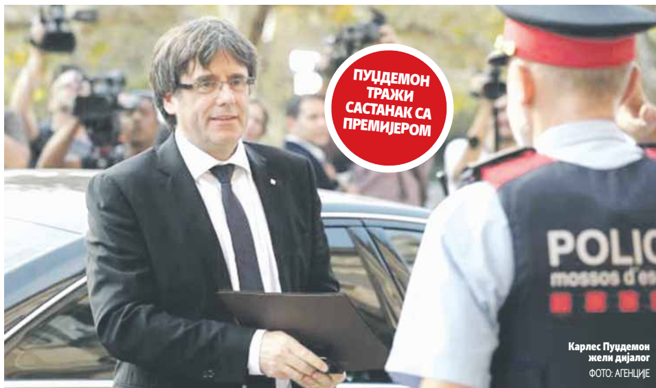
Карлес Пуцдемон жели дијалог