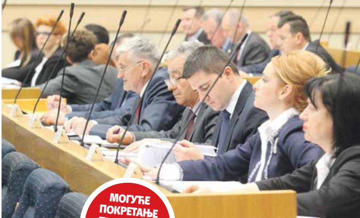
Ревизорски извјештај данас пред посланицима

МОГУЋЕ ПОКРЕТАЊЕ ПРОЦЕДУРЕ ЗА ИЗБОР РЕВИЗОРА