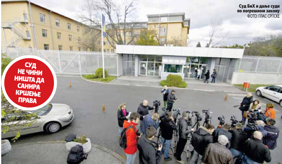
Суд БиХ и даље суди по погрешном закону

- Међу апелантима су 24 српске националности, те по четири Бошњака и Хрвата.