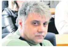
АУТОБУСИ СУ СТАРИ, АЛИ КАДА УБЕТЕ У ЊИХ, ИЗГЛЕДАЈУ КАО АПОТЕКА.

Премијерка Српске је истакла да сви полажу наду да би се, ипак, могло догодити усвајање измјена Закона о акцизама до краја октобра. (РТРС)