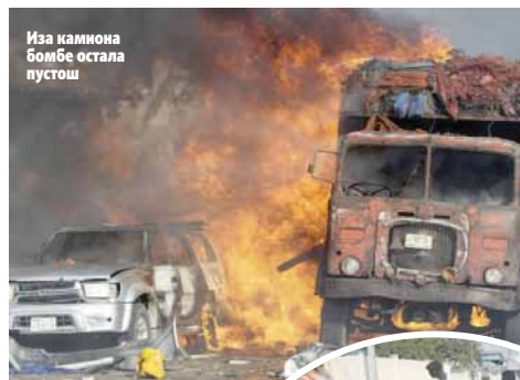
Иза камиона бомбе остала пустош

Сомалијски министар информисања Абдирахман Осман је напад назвао варварским.