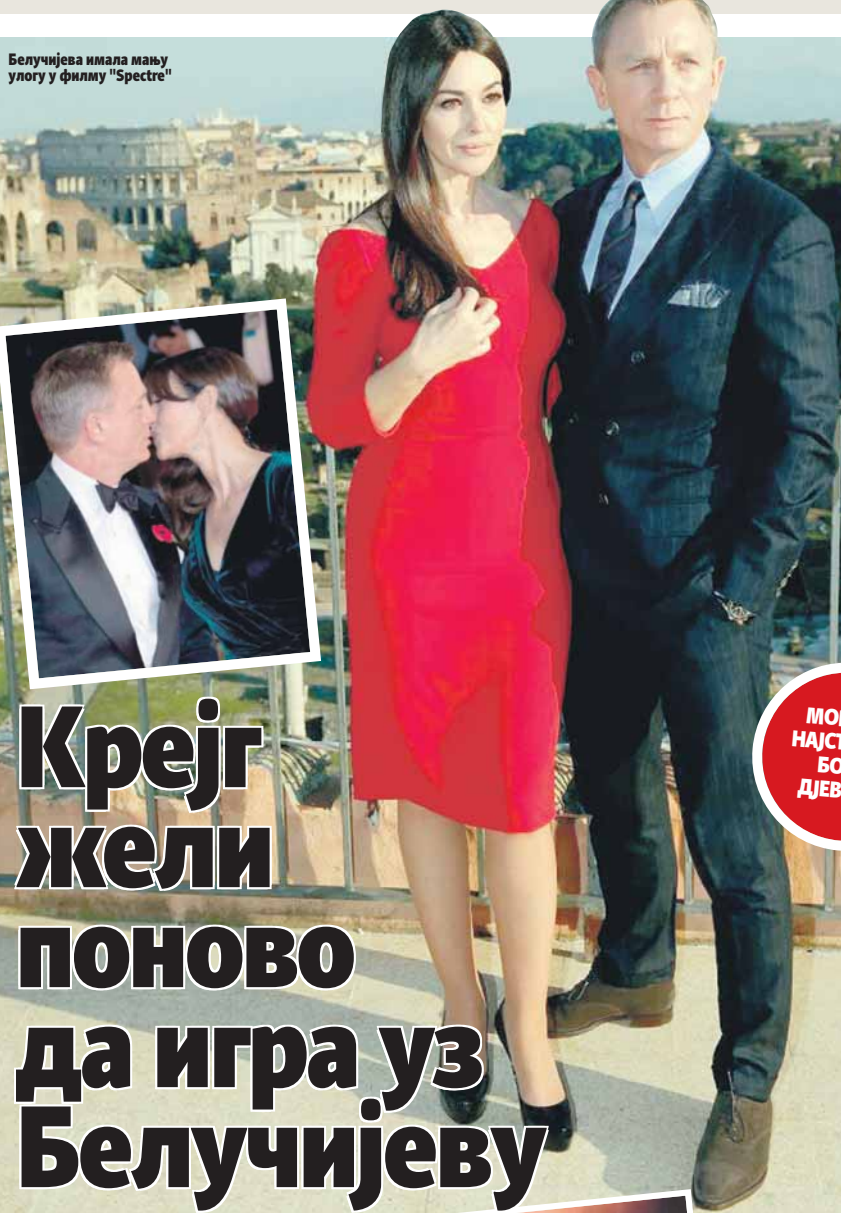
Белучијева имала мању улогу у филму "Spectre"

Тоше се током своје каријере бавио и хуманитарним радом, а на његовој сахрани говорила је и председница Црвеног крста Македоније. Нажалост, неприлагођена брзина возача довела је до тога да се аутомобил забије у шлепер и Тоше, који је сједио на мјесту сувозача, погине на лицу мјеста.