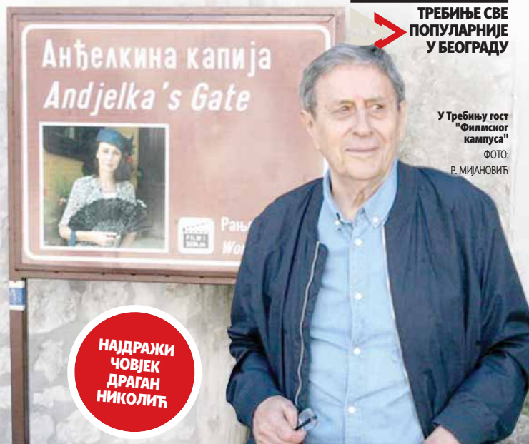
У Требињу гост "Филмског кампуса"