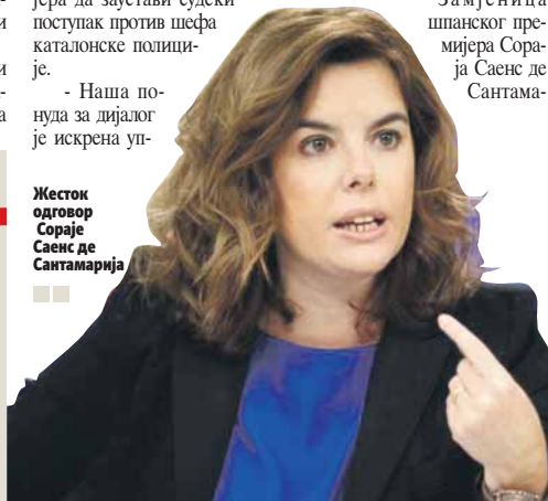
Жесток одговор Сораје Саенс де Сантамарија

Замјеница шпанског премијера Сораја Саенс де Сантамарија