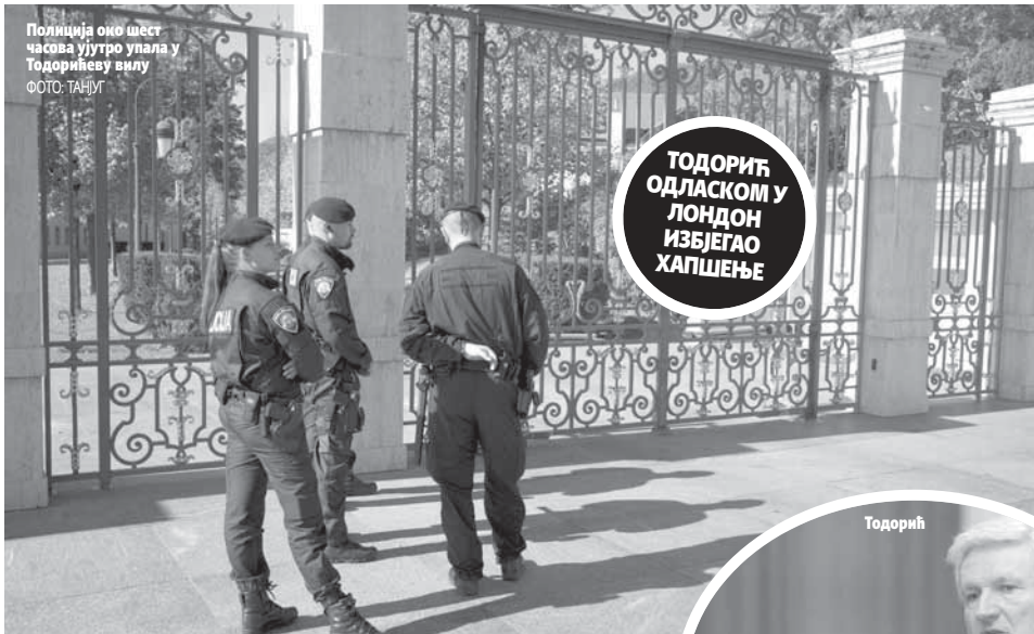
Полиција око шест часова ујутро упала у Тодорићеву вилу

ПОДГОРИЦА - Демократска партија социјалиста ће под међународним и унутрашњим притиском морати пристати на одржавање нових парламентарних избора у 2018. години, казао је лидер СДП-а Ранко Кривокапић. Како је оштрије, премијер Душко Марковић је признао политичку кризу. (Агенције)