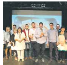
сирао сир "фармерско благо" из Ливна, а на треће "купрес млик".

Тврди сир, који се по старој швајцарској рецептури производи од млијека алпских грла која се напајају на платоу кањона Таре, добио је највише гласова посетилаца фестивала, док се на друго мјесто пла-