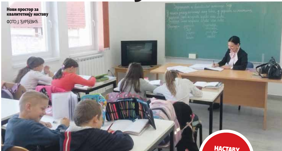
Нови простор за квалитетнију наставу