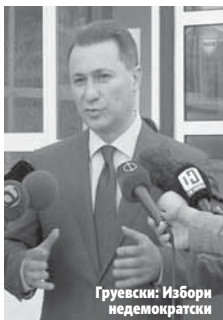
Груевски: Избори недемократски

Заев на славу поводом побјед у већини општина. СДСМ-а на локалним изборима у већини општина. Заев је новим градоначелни-