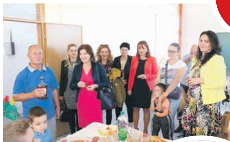
Радост са ученицима подјелили и гости

Тим поводом ученици, родитељи и наставници окупили су се у новим школским прос-