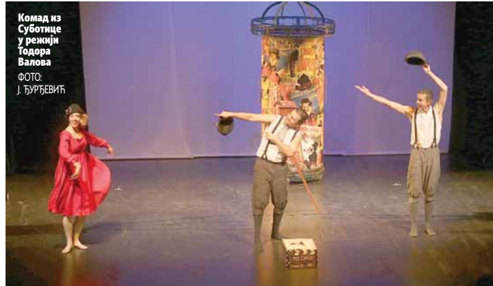
Комад из Суботице у режији Тодора Валова

Некоме се може учинити већ виђена, другима сентиментална, трећима комична или пак недовољно озбиљна и дубокоумна. Међутим, сигурно никога није оставила емоционално равнодушним и незаинтересованим, сагласни су глумци