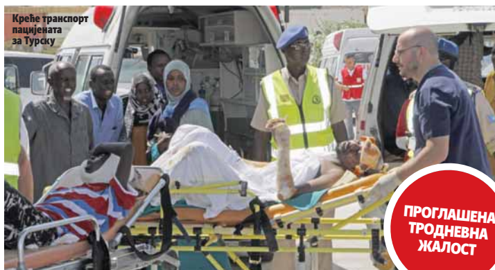
Креће транспорт пацијента за Турску

Послије експлозије камиона бомбе у главном граду Сомалије