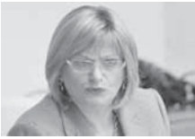
У СРБИЈИ ВИШЕ НИКО НЕ МОРА СА СТРЕПЊОМ ДА ГЛЕДА У КУРСНУ ЛИСТУ.

Споразум превиђа да суд у сјеверном дијелу Митровице треба да почне да ради данас, али косовски председник Хашим Тачи још није донио декрет о судијама и тужиоцима који ће тамо радити. У исто вријеме, српске власти још нису доставиле евиденцију којом се регулише статус пензионера за судије и тужиоце Србе. Приштина наставља и даље да касни са спровођењем споразума постигнутих са Београдом у оквиру дијалога о нормализацији односа.