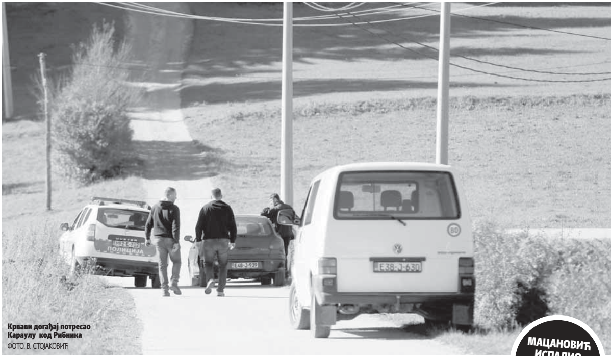
Крвави догађај потресао Караулу код Рибника

ПИШЕ: НЕВОЈША ТОМАШЕВИЋ ntomasevic@glassrpske.com