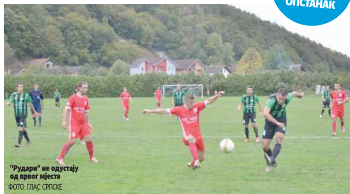
"Рудари" не одуштају од првог мјеста

Осим у прва три кола главни претенденти за титулу Звјезда 09 и Рудар Приједор држали су врх табеле. На првом мјесту углавном је екипа из етно-села Станишићи, али "рудари" им константно пријете и сигурно неће одустати до самог краја. Њихов дуел завршен је без побједника 0:0, а до краја сезоне играће још три пута и међусобни сусрети ових екипа могли би одлучити новог шампиона РС. Поред њих добре игре пружили су Дрина и Текстилац Корт који су након 11 утакмица показали да ће своју шансу вребати из прикраја. Док се од Дрвенџана очекивало да буду у врху, тим из Зворника је мало изненадио, пошто је екипа дуго била без управе и припреме нису