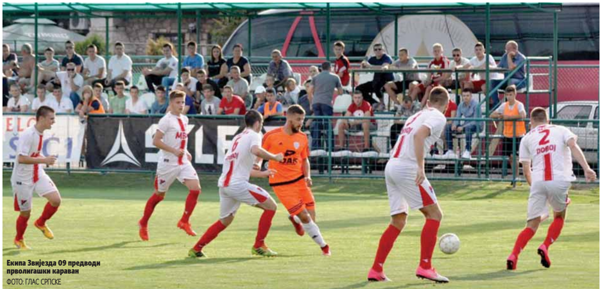
Екипа Звјезда 09 предводи прволигашки караван

Парови шестог кола: Подграб - Хан Пијеска, Романија - Рудо, Жељезница - Стакорина.