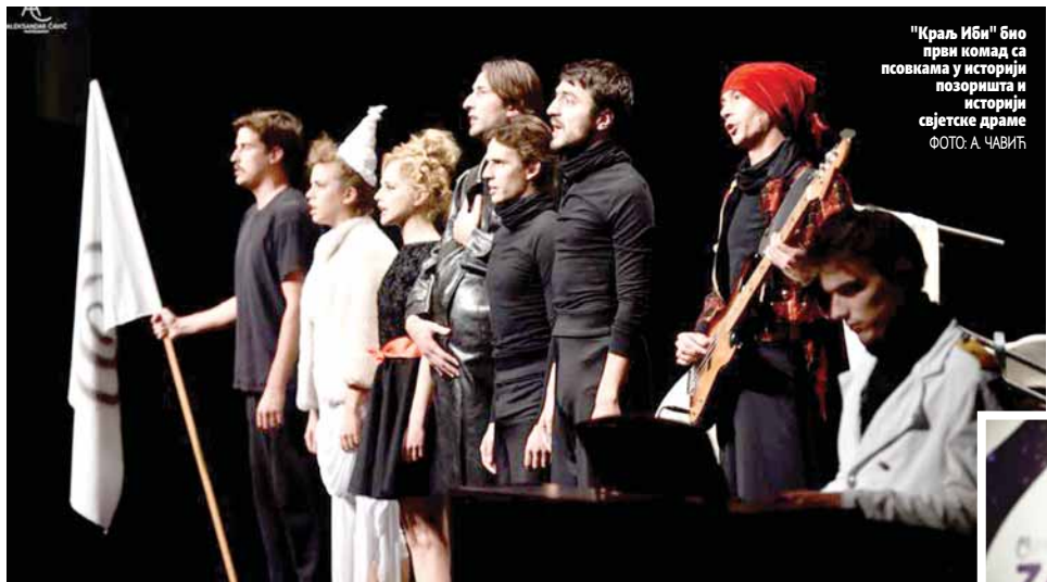
"Краљ Иби" био први комад са псовкама у историји позоришта и историји свјетске драме

Сматра да глумачка игра нема цијену. Публика ће платити улазницу онолико колико има новца, али не може да се одреди цена играња једног глумца. Живимо у времену у коме смо изложени једном страшном механизму и окрутном свету. Лепо је када млади глумци имају амбиције, али свака амбиција мора да почива на знању - нагласио је Миленковић.