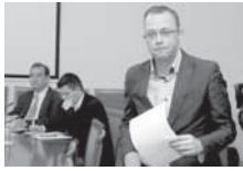
МИЛАН БАНДИЋ О ИВИ ЛОЛИ РИБАРУ ЗНА КОЛИКО И ЈА О КВАНТНОЈ ФИЗИЦИ.

"Пинк Пантери" су међународна криминална група која се бави крађом накита, а чији припадници су углавном са простора бивше Југославије.