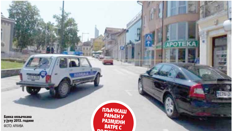
Банка опљачкана у јулу 2013. године

ПЉАЧАШ РАЂЕН У РАЗМЈЕНИ ВАТРЕ С ПОЛИЦАЈЦЕМ