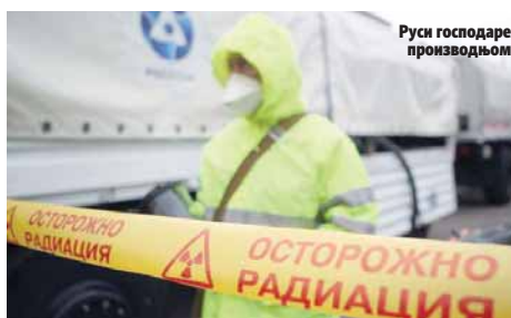
Рус господар производњом

Руски предсједник Владимир Путин је недавно говорио о програму "пребацивања" уранијума из Русије, односно растерећивању обогаћеног уранијума са еквивалентом од око 20.000 нуклеарних бојевих глава, како би он био коришћен као гориво у америчким електранама у периоду од 1993. до 2013. године. Путин је то назвао једним од "најефикаснијих покушаја за разоружање у историји". Како је рекао, амерички званичници су тада имали 170 посјета руским постројењима.