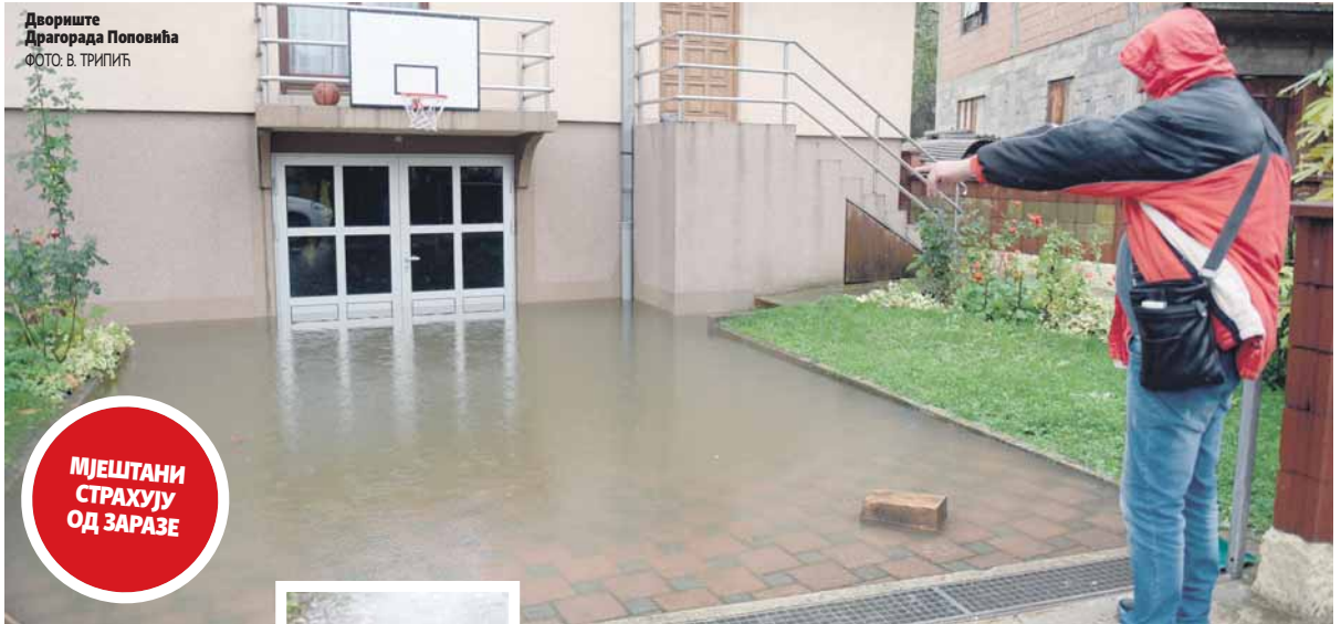
Двориште Драгорада Поповића

Сваки пут када пада киша дешава се иста ствар. Најгоре је када се све то осуши и остане прашина коју удишу дјеца док се играју, рекао Поповић