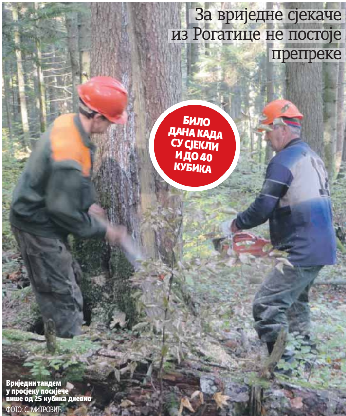
Вриједни тандем у просјеку посјече више од 25 кубика дневно

БИЛО ДАНА КАДА СУ СЈЕКАЛИ И ДО 40 КУБИКА