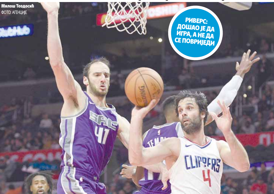
Милош Теодосић

РИВЕРС: ДОШАО ЈЕ ДА ИГРА, А НЕ ДА СЕ ПОВРИЈЕДИ