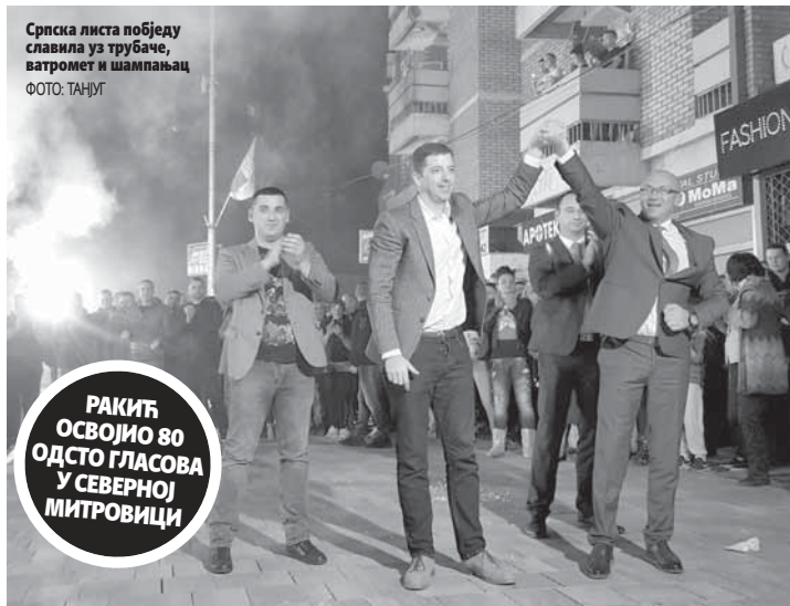
Српска листа побједу славила уз трубаче, ватромет и шампањац

Судије и тужиоци из српске заједнице на Косову требало је да заклетву положи прошле седмице, али се то није догодило. (Агенције)