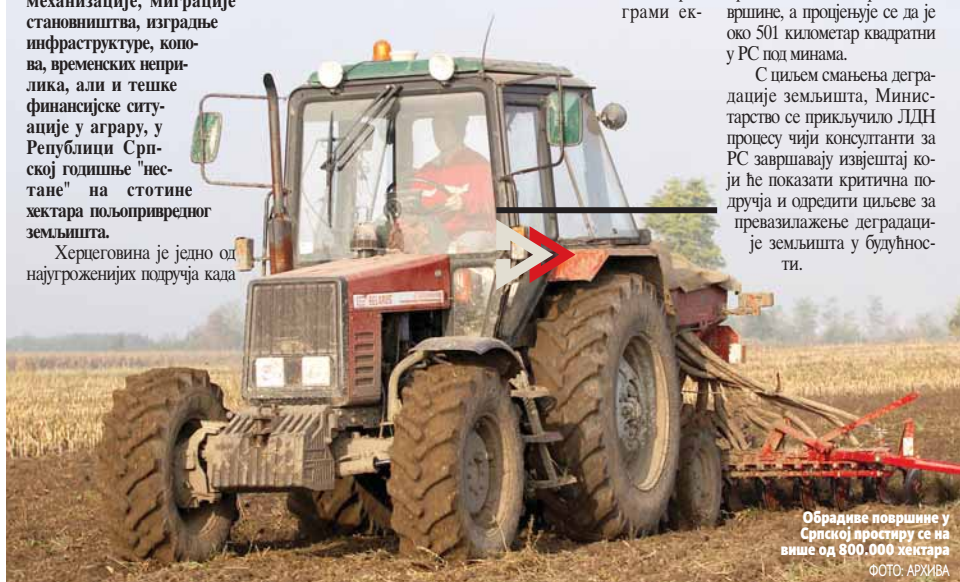
Обрадиве површине у Српској простору се на више од 800.000 хектара