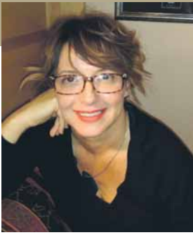
Пише: Ана ТРИФУНОВИЋ-БАБИЋ , бивша заменица министра иностранних послова БиХ