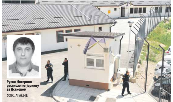
Руски Интерпол расписо потјерницу за Исаковом

"Глас Српске" сазнаје да Исаков није могао бити изручен Русији јер је путем адвоката успио да издејствује од Европског суда за људска