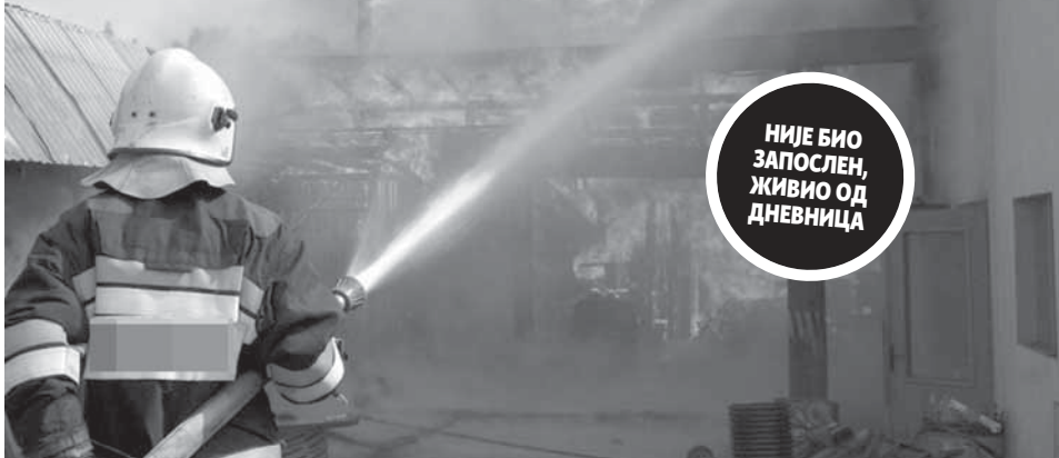
Ватрогасци из Модриче угасили пожар