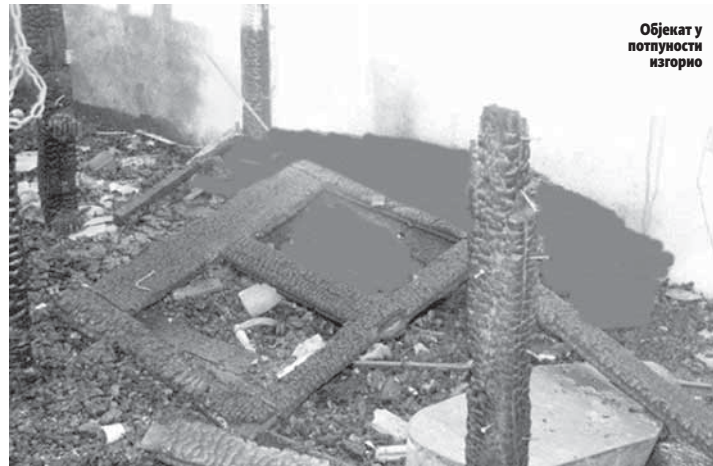
Објект у потпуности изгоррио