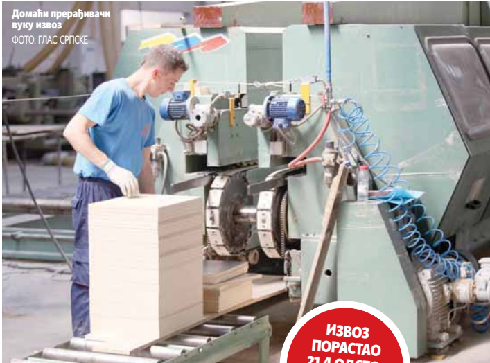
Домаћи прерађивачи вуку извоз

ИЗВОЗ ПОРАСТАО 21,4 ОДСТО, УВОЗ П,3 ОДСТО