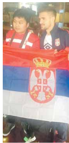
Душан Тадић популаран у Кини