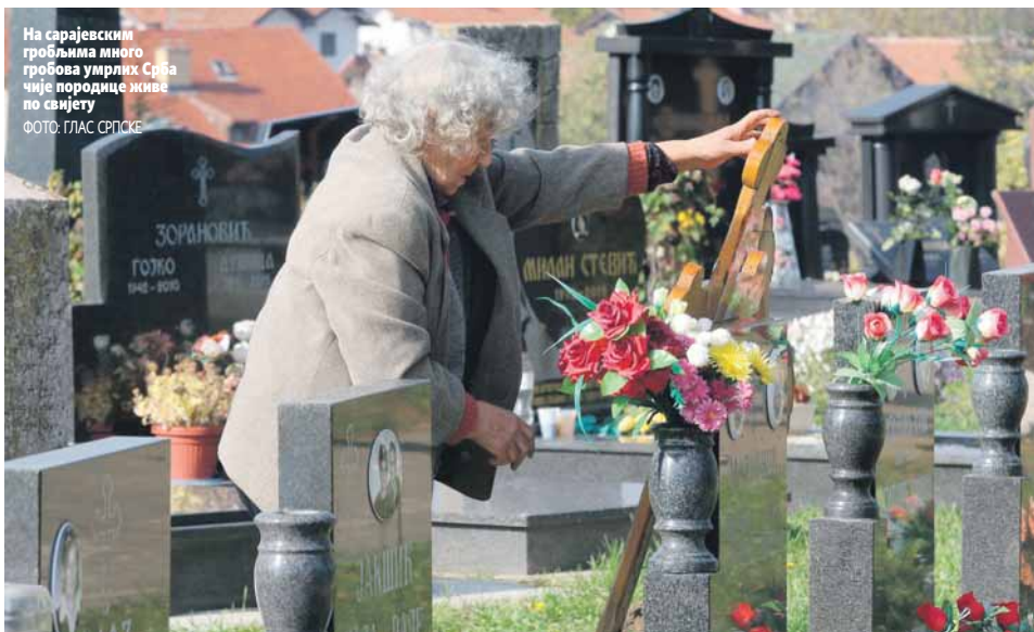
На сарајевским гробљима много гробова умрлих Срба чије породице живе по свијету

Отац је сахрањен осамдесетих година прошлог вијека, а моја породица и ја смо током рата и етничког чишћења истјерани из тог града. Због даљине нисам могао редовно да идем на гроб оцу, а ваљда би требало да буде разумијевања за ситуацију у којој су се нашли сарајевски Срби, казао бивши Сарајлија, којем је познаник јавио да је прекопан гроб његовог оца