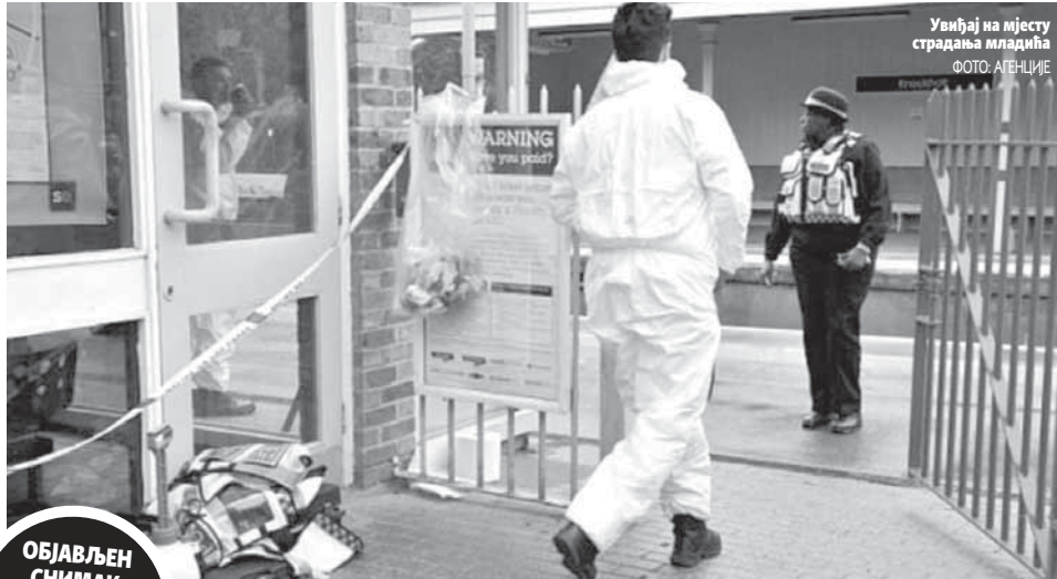
Увиђај на мјесту страдања младића

ОБЈАВЉЕН СНИМАК МОГУЋЕГ ПОЧИНИОЦА УБИСТВА