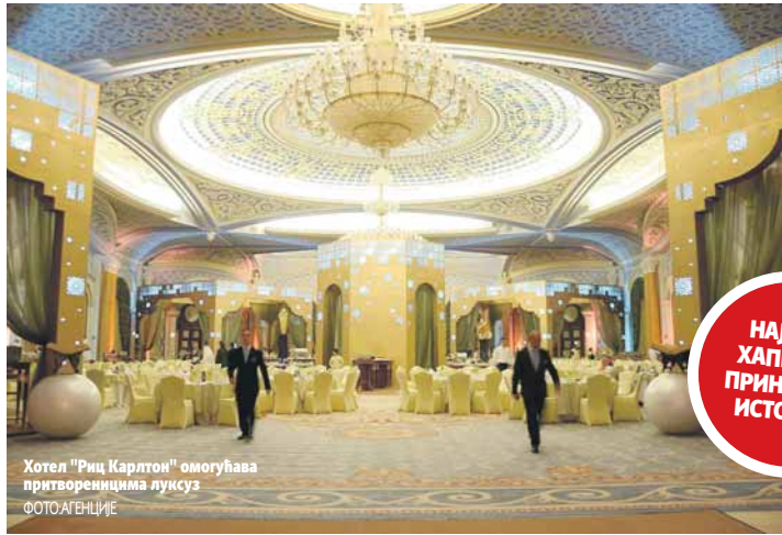
Хотел "Риц Карлтон" омогућава притвореницима луксуз

Више од 40 истакнутих Саудијаца, 11 принчева који су у директном сродству са владарима, као и 30 високих државних званичника и бивших министара, закључани су у "Риц Карлтон", који је њихова "затворска ћелија"