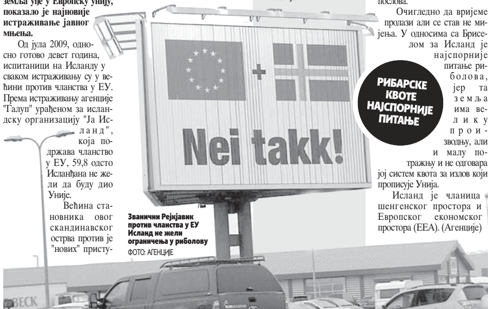
Званични Рејкјавик против чланства у ЕУ Исланд не жели ограничења у риболову

- Пет радника је изгубило живот, а 16 особа, међу којима и грађани који су се у том тренутку нашли у фабрици, је повријеђено - рекла је Саридероглу. (Агенције)