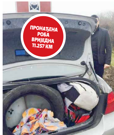
Ухапшена на основу раније прикупљених информација

У Полицијској управи Зворник, наводећи иницијале, рекли су да је држављанка Србије крила робу у аутомобилу