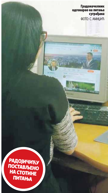
Градоначелник одговарао на питања суграђана

Љубитеље животиња занимало је како ће бити збринути пси луталице, док је возачима болна тачка недостатак мјеста за паркирање, па су питали и када ће никнути пар-