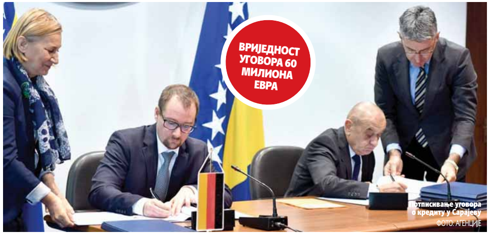
Потписивање уговора о кредиту у Сарајеву

Потписан уговор о кредиту за пројекат "Хргуд" у Берковићима