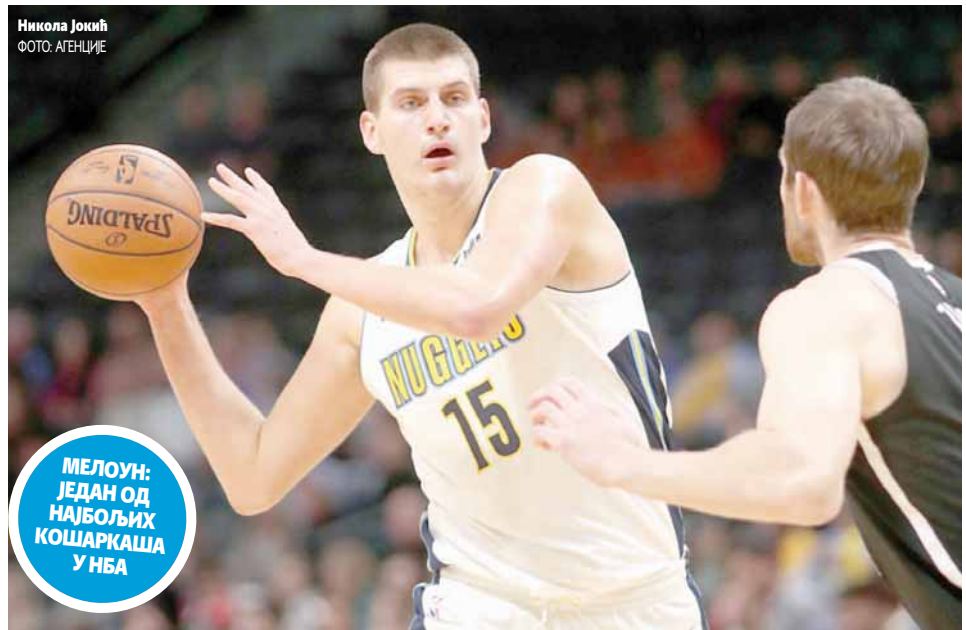
Никола Јокић

МЕЛОУН: ЈЕДАН ОД НАЈБОЉИХ КОШАРКАША У НБА