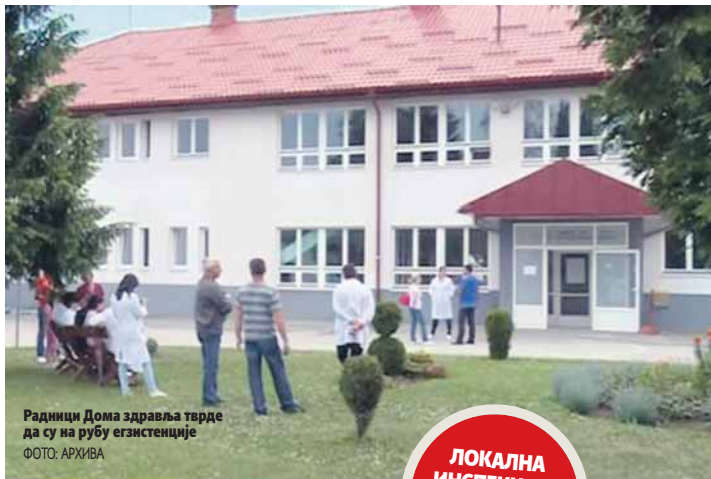
Радници Дома здравља тврде да су на рубу egzистенције

Додао је да Фонд здравственог осигурања РС реловно измирује своје обавезе према установи, али то, како каже, није довољно. Од Пореске управе РС, како каже Мандићева, стигла је опомене