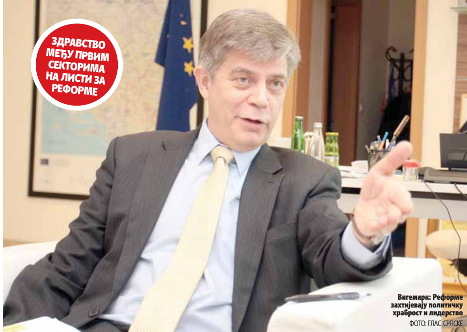
Вигемарк: Реформе захтијевају политичку храброст и лидерство

Новац који би БиХ прво изгубила је новац од Европске комисије и то у форми грантова, дакле бесповратних готовинских средстава. Тај новац није неограничено доступан и отићи ће негдје другдје на подручју западног Балкана, истакао Вигемарк