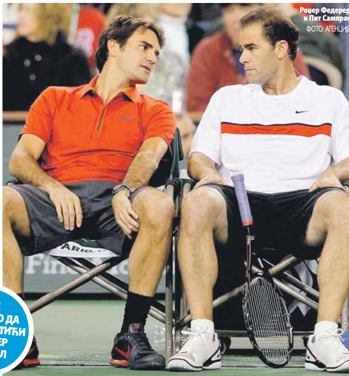
Роџер Федерер и Пит Сампрас

- Ако сам био изненађен када је Роџер освојио Аустралијан опен, то сигурно нисам био после његовог тријумфа на Вимблдону, због подлоге и искуства које је имао