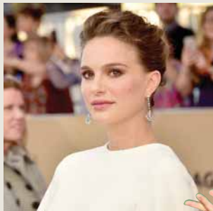
Холивудска глумица и оскаровка Натали Портман награђена је израелском наградом "Генеца" за 2018. годину, у знак признања за

посвећеност социјалним питањима и дубокој вези са својим јеврејским и израелским коријенима, навели су организатори. Награда од милион долара, позната и као "Јеврејска Нобелова награда", даје се сваке године особи која се сматра инспирацијом за следећу генерацију Јевреја због својих професионалних достигнућа и посвећености Јеврејским вриједностима.