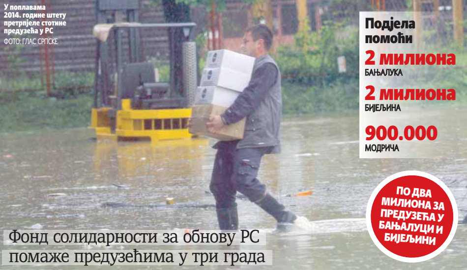
У поплавама 2014. године штету претрпјеле стотине предузећа у РС

Фонд солидарности за обнову РС помаже предузећима у три града