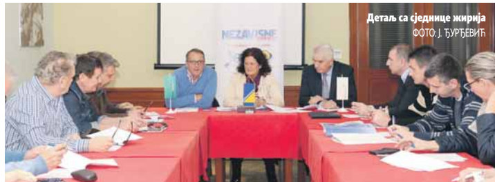
Детаљ са сједнице жирија