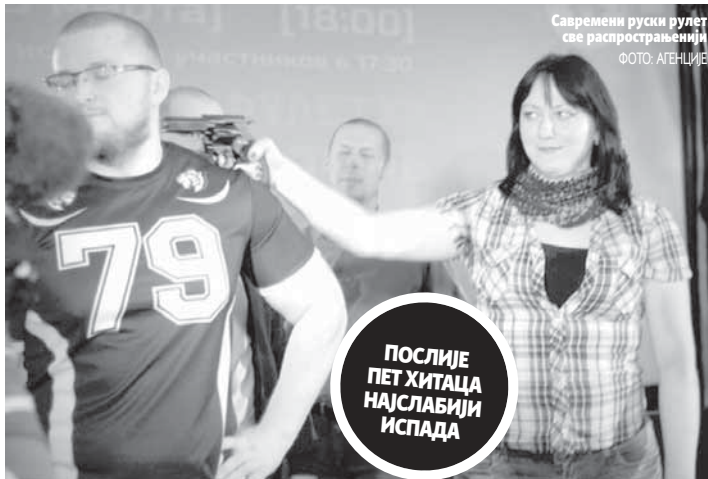
Савремени руски рулет све распрострањенији