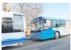
да је аутобус превозника "Толубић" са задње стране ударио возило "Боца турса".

Очевици ове мање саобраћајне несреће су испричали