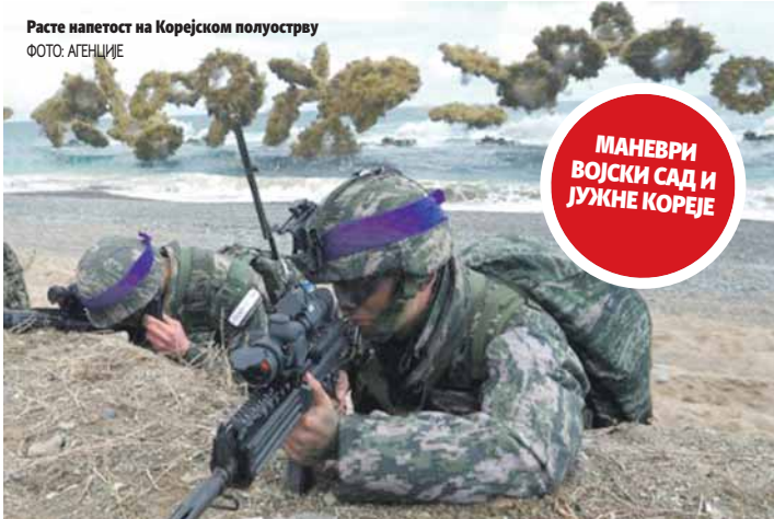
Расте напетост на Корејском полуострву

- Приближавамо се војном сукобу зато што Сјеверна Кореја иде ка технологији интерконтиненталне балистичке ракете са нуклеарним оружјем на врху која не само да може да досегне до Америке, већ и да испоручи то оружје. Понестаје нам времена - рекао је Грејем.