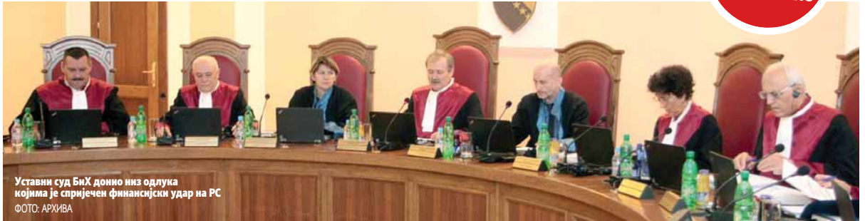
Уставни суд БиХ донио низ одлука којима је спречен финансијски удар на РС