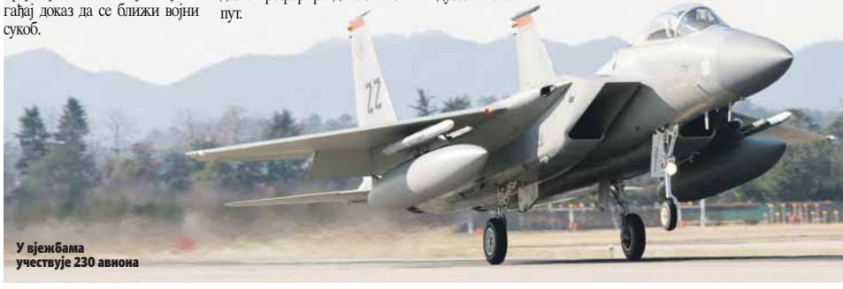
У вјежбама учествује 230 авиона