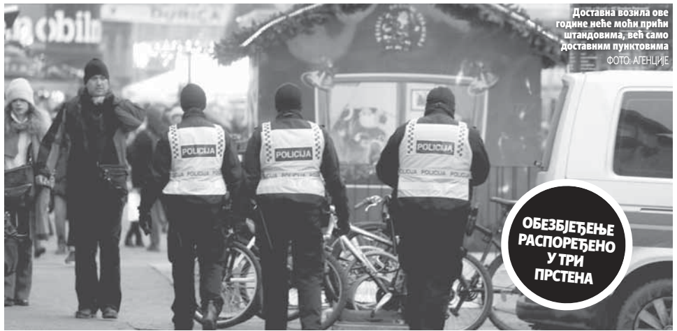
Доставна возила ове године неће моћи прићи штандовима, већ само доставним пунктovima