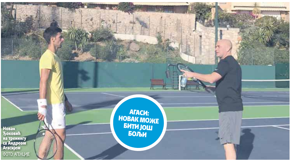
Новак Ђоковић на тренингу са Андреом Агасијем