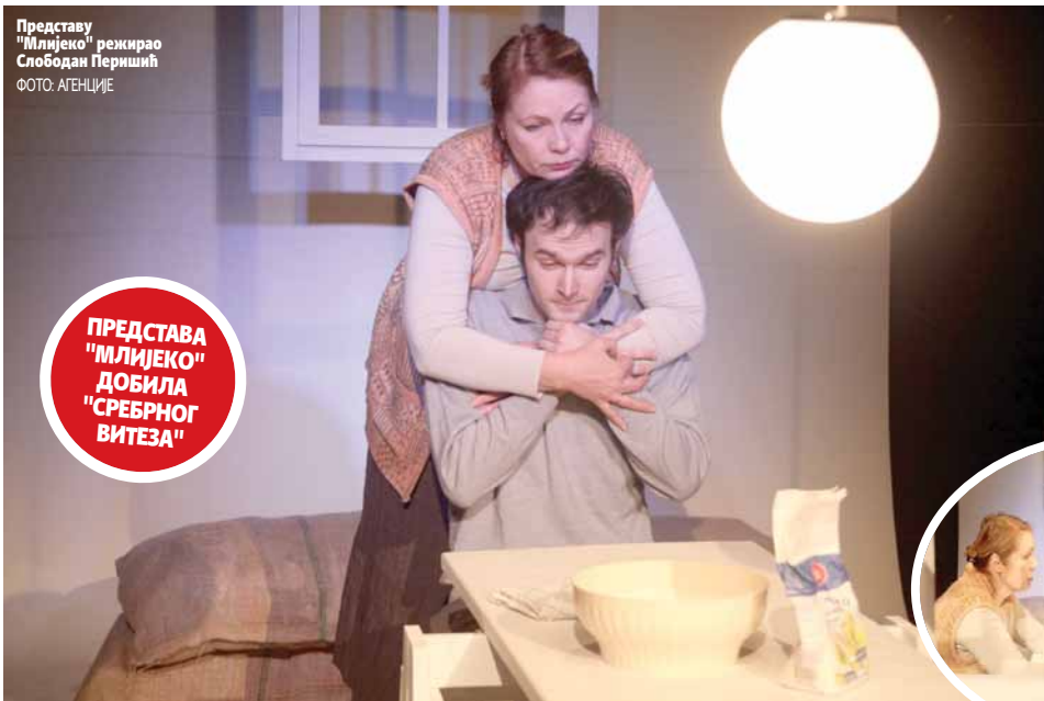
Представу "Млијeko" режирала Слободана Перишића

ПРЕДСТАВА "МЛИЈЕКО" ДОБИЛА "СРЕБРНОГ ВИТЕЗА"