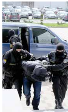
Акција спроведена у неколико општина