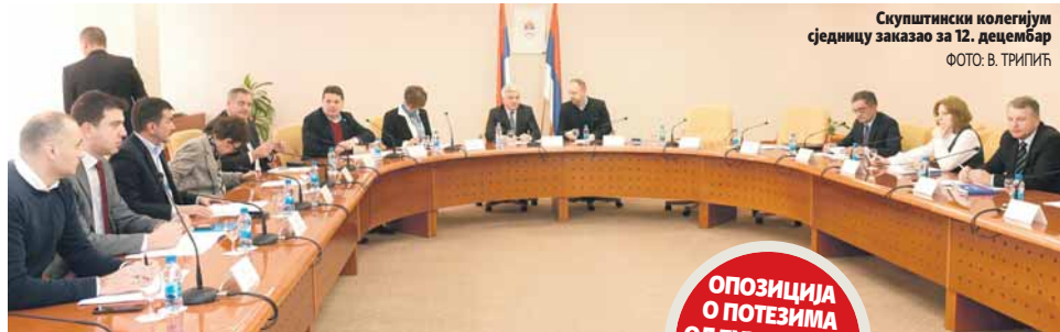
Скупштински колегијум сједницу заказану за 12. децембар

ОПОЗИЦИЈА О ПОТЕЗИМА ОДЛУЧУЈЕ ПРЕД ПОЧЕТАК СЈЕДНИЦЕ