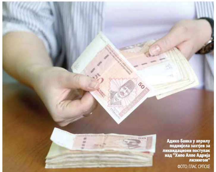
Адио банка у априлу поднијела захтјев за ликвидациони поступак над "Хипо Алпе Адрија лизингом"