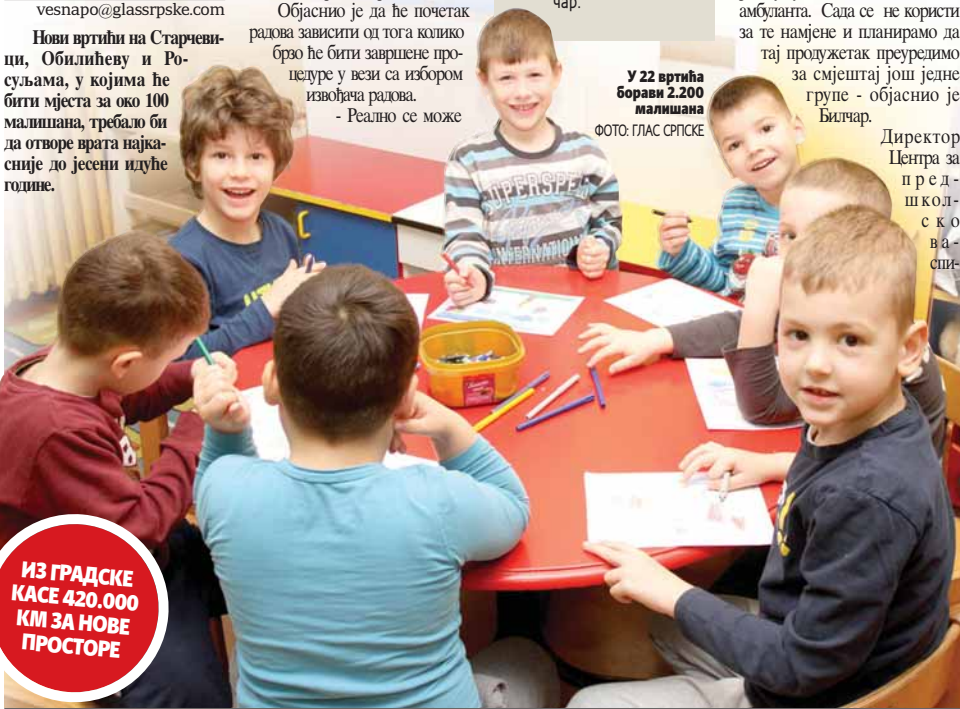
У 22 вртића борави 2.200 малишана