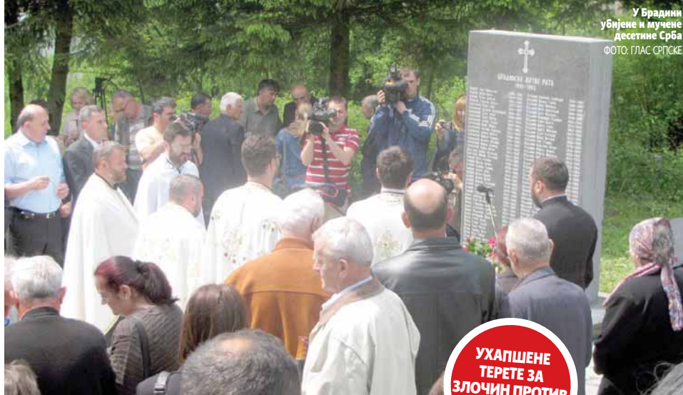
У Брadini убијене и мучене десетине Срба

пишу: ГОРАН МАУНАГА ЖЕЛКА ДОМАЗЕТ desk@glassrpske.com