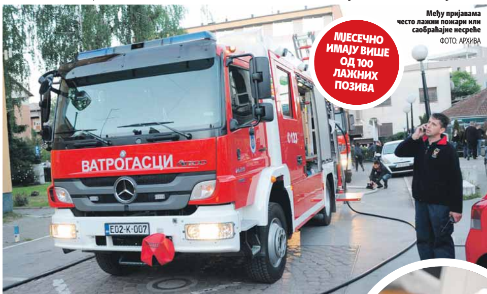
Међу пријавама често лажни пожари или саобраћајне несреће