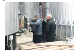
Истакли су да су прва два котла пуштена у пробни рад прошле седмице.

Ријеч је о редовном подешавању филтерског система и тестирању система изнад номиналних вриједности, усљед чега долази до овакве појаве - навели су у саопштењу.