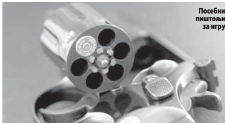
Посебни пиштољи за игру