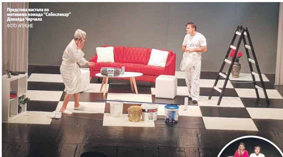
Представа настала по мотивима комада "Собосликар" Доналда Черчила