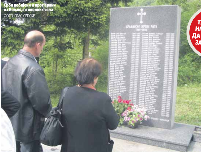
Срби побијени и протјерани из Коњица и околних села

ТУШЕВЉАК: ИМА ОСНОВА ДА ИХ ОПТУЖИ ЗА ГЕНОЦИД