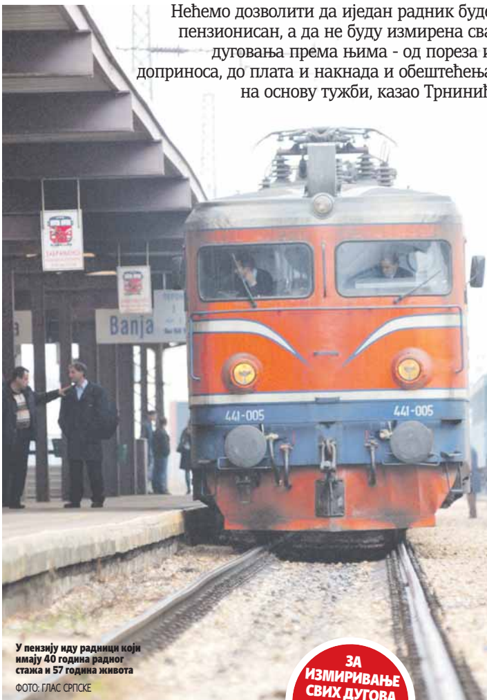
У пензију иду радници који имају 40 година радног стажа и 57 година живота

Нећемо дозволити да иједан радник буде пензионисан, а да не буду измирена сва дуговања према њима - од пореза и доприноса, до плата и накнада и обештећења на основу тужби, казао Трнинић