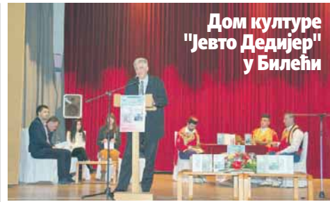
Дом културе "Јевто Дедијер" у Билећи