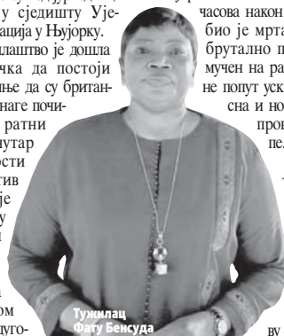
Тужилац Фату Бенсуда

Британски војни суд није оптужио ни једног војника за његову смрт.