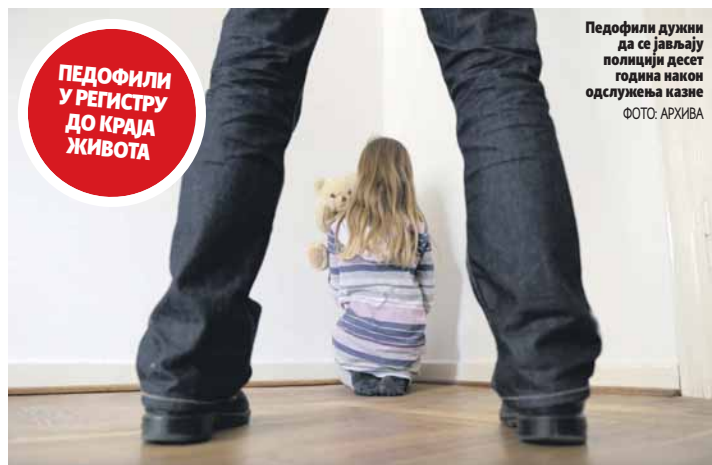
Педофили дужни да се јављају полицији десет година након одслужења казне

Сви органи, институције, удружења, спортски клубови и други субјекти који у раду