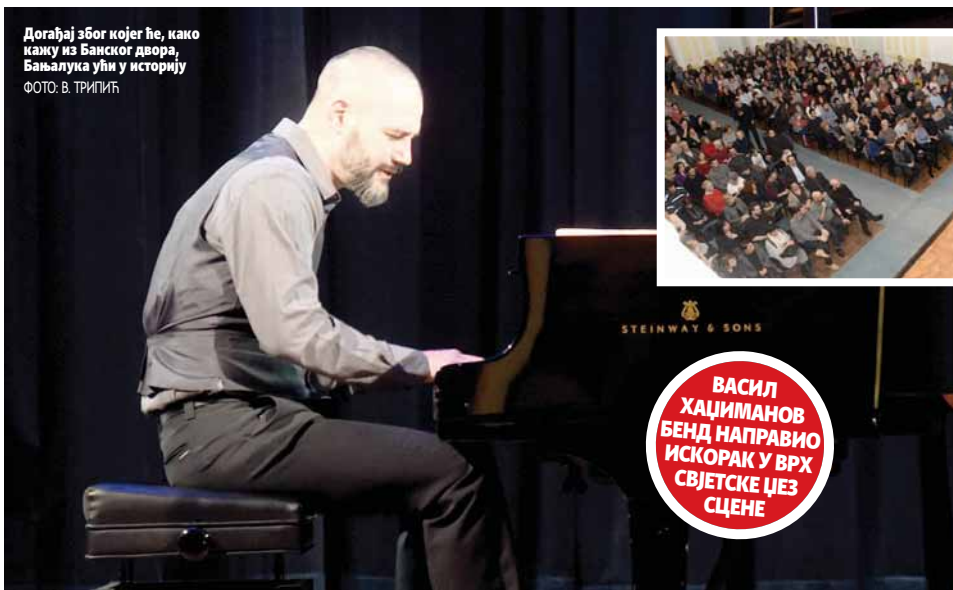
Догађај због којег ће, како кажу из Банског двора, Бањалука ући у историју