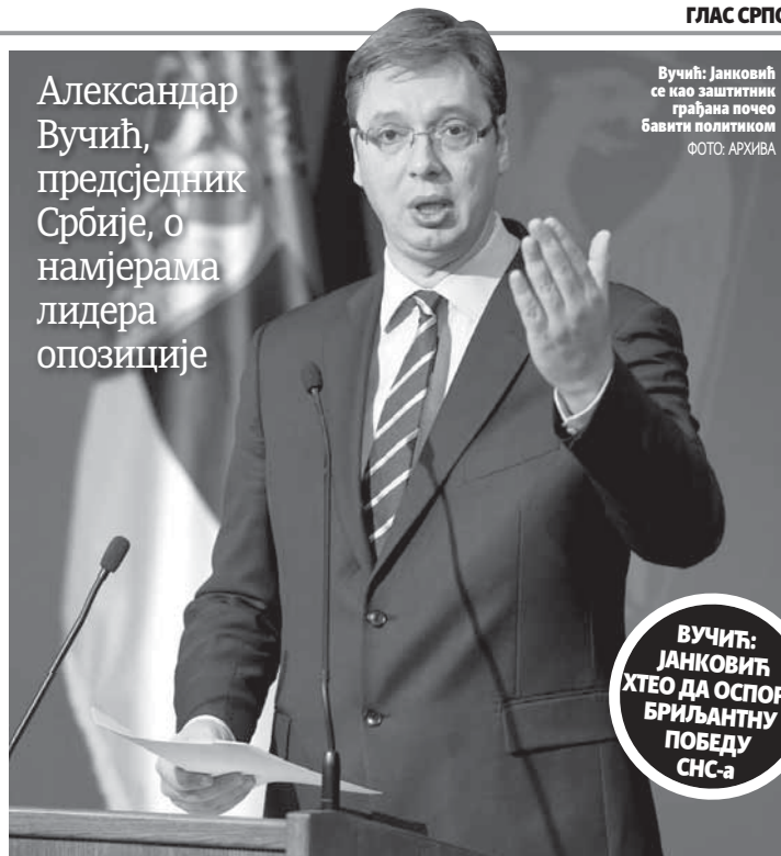
Вучић: Јанковић се као заштитник грађана почео бавити политиком

Александар Вучић, председник Србије, о намјерама лидера опозиције