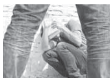
шло до свађе између њих двојице, а потом и туче - рекли су у полицији.

- Затекли смо оца, његовог сина и мајку. У разговору са њима утврдили смо да је до-