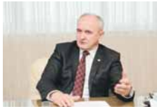
МИ ПО НЕКИМ ПИТАЊИМА КАО ДА СМО У 1996. ГОДИНИ.