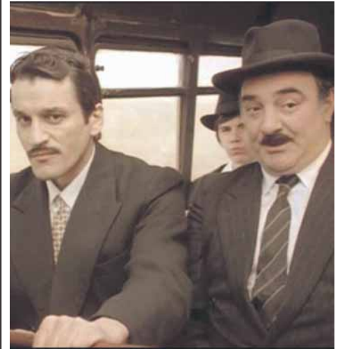
Дигитална рестаурација десет културних српских филмова

Фанови се надају да ће у новом филму добити одговор на питање ко су Рејини родитељи