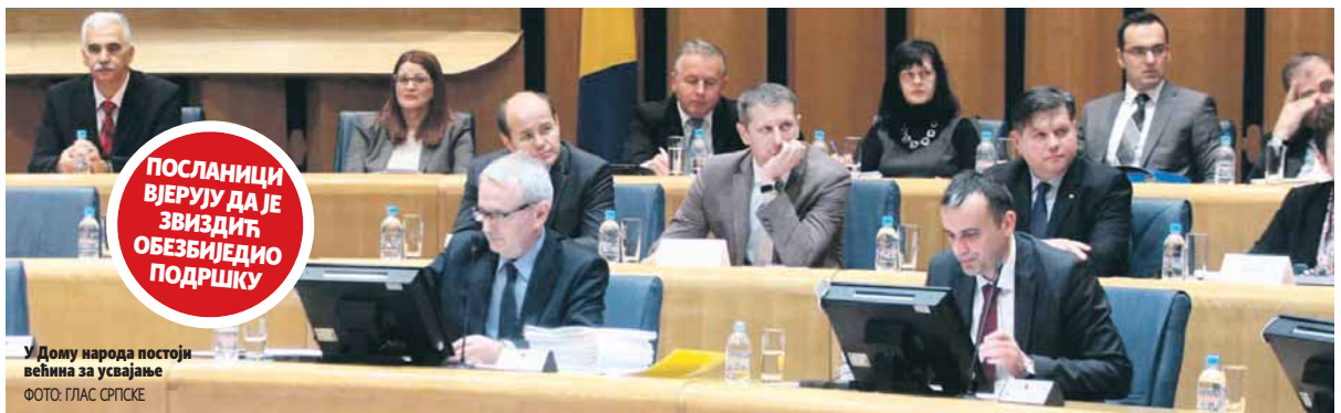
У Дому народа постоји већина за усвајање

САРАЈЕВО - У оптужници против помагача генералу Ратку Младићу, коју је српско тужилаштво доставило БИРН-у након што је првобитно означило као државну тајну, наводи се да је он током скривања у Београду имао помоћ ЈНА. Оптужница сугерише да је ЈНА пружала помоћ генералу Младићу док се 2002. скривао у Београду. Оптужени за помагање Младићу су у августу ослобођени оптужби. (Агенције)