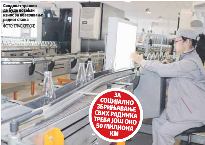
Синдикат тражи да буде повећан износ за повезивање радног стажа