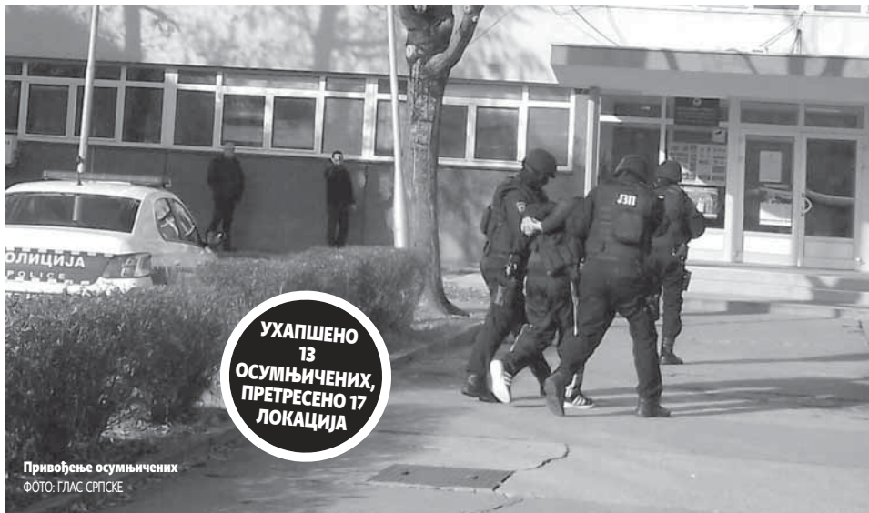
Привођење осумњичених

ПИСАЧ: НЕВОЈША ТОМАШЕВИЋ ntomasevic@glassrpske.com