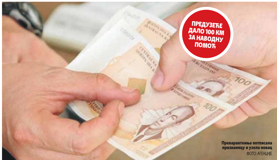
Преваранткиња потписала признаницу и узела новац