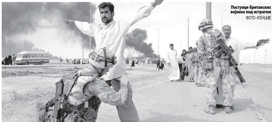
Поступци британских војника под истрагом

Француски председник Емануел Макрон изјавио је раније да је "забринут" због могуће одлуке председника САД Доналда Трампа да једнострано призна Јерусалим као главни град Израела. Он је рекао да статус тог града мора бити одређен "у оквиру преговора између Израелца и Палестинаца". Слична упозорења стигла су и из муслиманских земаља. Медији су пренијели да би Трамп ове седмице могао да призна Јерусалим као главни град Израела.