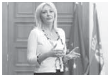
ПОЛИТИКА ПРОШИРЕЊА ЕВРОПСКЕ УНИЈЕ НЕЋЕ ОТИЋИ У ПЕНЗИЈУ.

- Ви позивате на милосрђе, радите у области образовања, просвећења, што је веома важно - рекао је Путин. (Агенције)