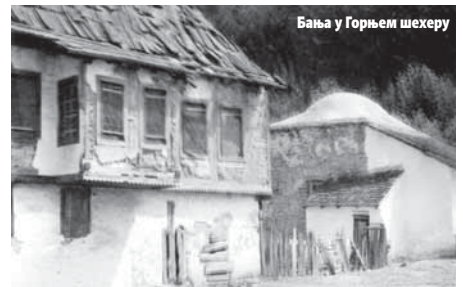
Бања у Горњем шехеру

на позив Банске управе и Туристичког друштва, град сјетила група од 60 чланова Међународног ПЕН клуба. Домаћини, заједно са овлашћеним дописницима београдских и загребачких листова, госте су дочекали у Јају. Аутобусе за превоз до Бањалуке обезбиједило је Туристичко друштво. Гости су разгледали град и његове знаменитости, а увече је у њихову част приређен банкет. Без ноћења, јер град није ни имао на располагању 60 кревета, гости су увече возом отпутовали за Бихаћ, а одатле продужили за Плитвичка језера.