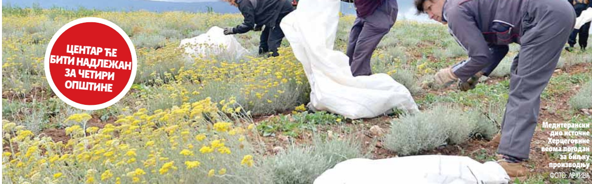
Медитерански дио источне Херцеговине веома погодан за биљну производњу

ЦЕНТАР ЋЕ БИТИ НАДЛЕЖАН ЗА ЧЕТИРИ ОПШТИНЕ