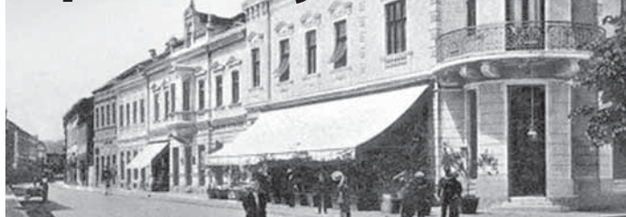
Бањалука средином 1925. године имала скромне туристичке капацитете

су градске власти почеле да му прилажу пажњу.