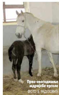
Прво овогодишње ждрилије ергеле

До почетка прољећне испаше на свијет ће доћи још 12 малих парина, па ће "Вучијак" ускоро поново имати троцифрен број грла разних старосних категорија. Благовременно су обезбијеђене довољне количине хране, а радници су уредили боксове, па