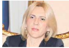
ОД ИНИЦИЈАТИВЕ МАЈКИ ДА СЕ САСТАНУ СА МНОМ БИЛА ЈЕ ОЧИГЛЕДНИЈА НАМЈЕРА ДА СЕ ДОБЕ СЛИКАТИ ДЕЧКИТ КОЈИ НИЈЕ МАЈКА.

Министар финансија РС Зоран Тегелтија каже да од укупне одобрене суме трећина иде Српској, а новац очекује у првом кварталу наредне године. (Агенције)