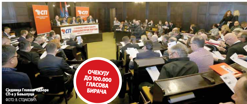
Сједница Главног одбора СП-а у Бањалуци