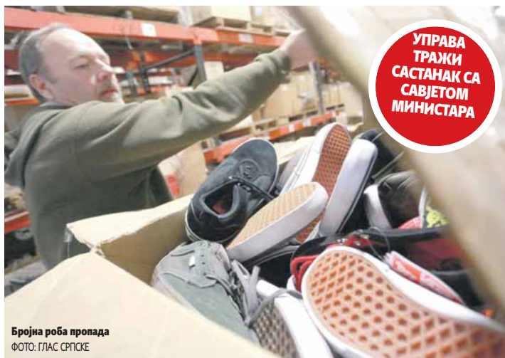
Бројна роба пропада

У УИО су потврдили да је готов нацрт одлуке о процедури и критеријумима за донирање робе која је одузета, заплијењена или уступљена Управи, али додају да они нису надлежни да одреде крајњег корисника. Због тога је Савету