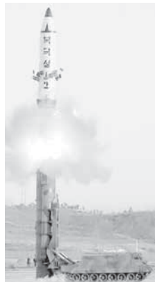
Савет безбједности УН једногласно је увео нове санкције Сјеверној Кореји након њеног најновијег теста интерконтиненталне балистичке ракете.

вернокорејска државна агенција КЦНА, преноси Ројтерс. - САД, које су у потпуности престашиле нашим остварењем великог историјског циља комплетирања нуклеарних снага државе, све више махнито повлаче потезе којима се намећу до сада најстроже санкције, саопштио Пјонгјанг