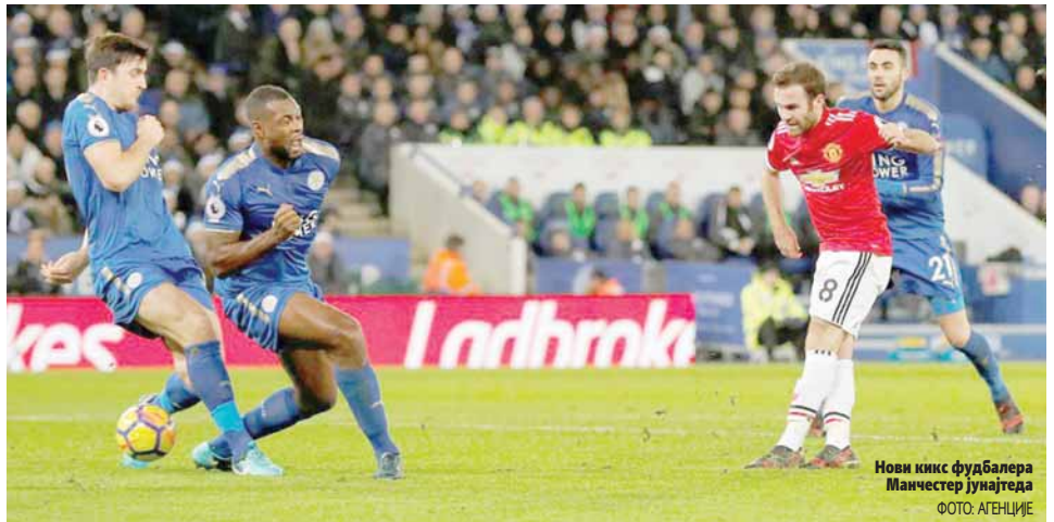
Нови кикс фудбалера Манчестер јунајтеда