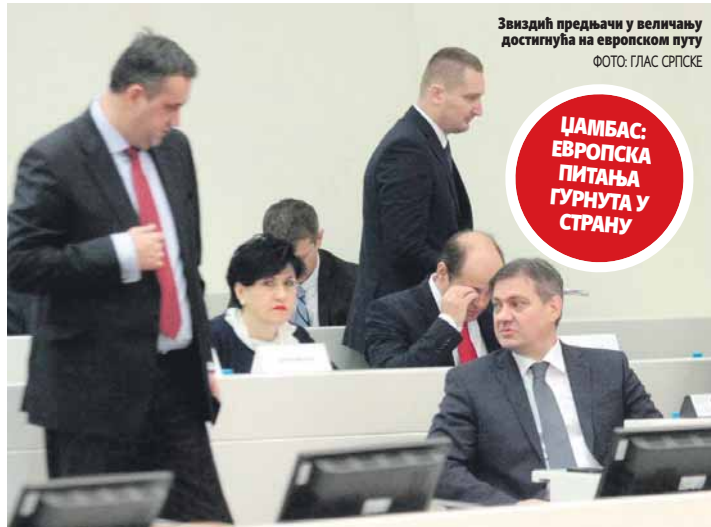
Звиздић предјачи у величању достигнућа на европском путу

ЏАМБАС: ЕВРОПСКА ПИТАЊА ГУРНУТА У СТРАНУ