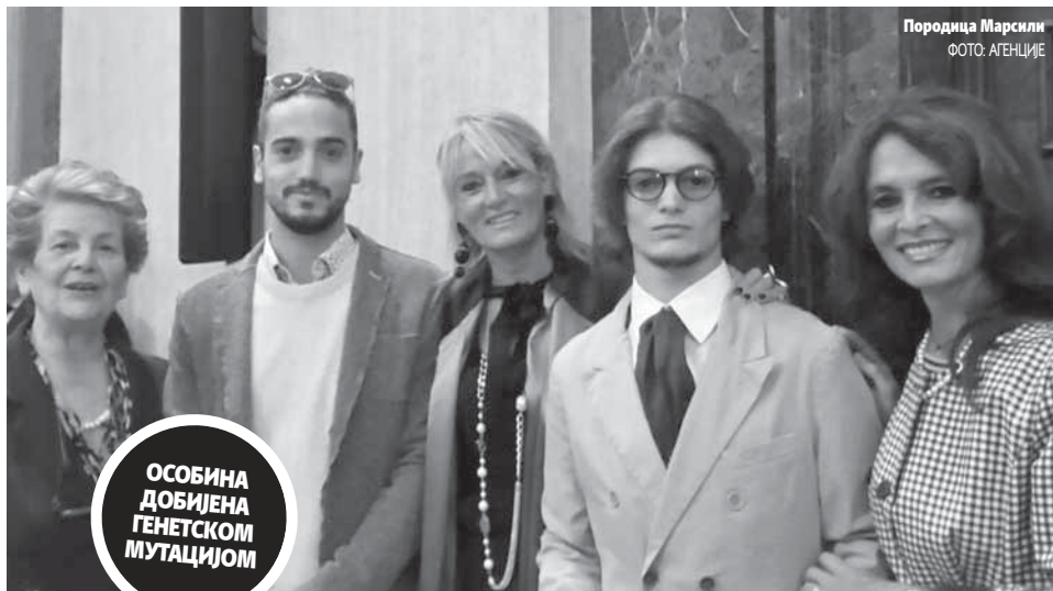
Породица Марсили