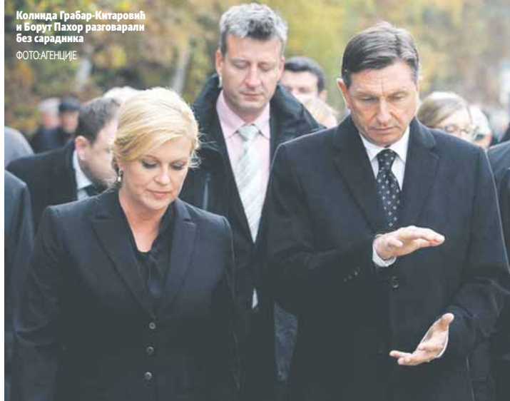
Коринда Грабар-Китаровић и Борут Пахор разговарали без сарадника

дних држава поводом почетка свог другог мандата.