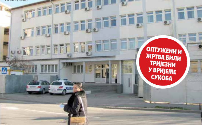
Окружни суд

гађају за који је оптужен говорио је да се не сјећа и ништа не зна и симулирао је амнезију - рекла је Вукадиновић-Стојановић.