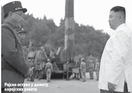
Рајско острво у домету корејских ракета

- Председник је упознат са ситуацијом у вези са вјежбом за ванредне околности на Хавајима. Ријеч је искључиво о вјежби - казала је портпаролка Бијеле куће Линдзи Волтерс, пренио је Ројтерс.