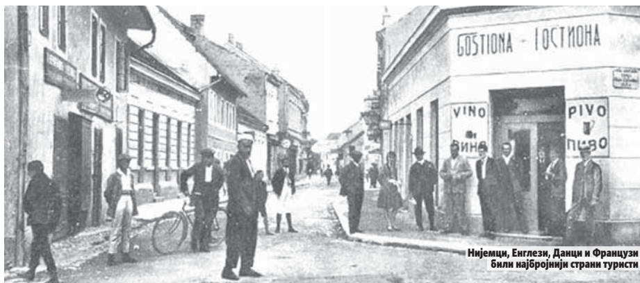
Нијемци, Енглези, Данци и Французи били најбројнији страни туристи

Примитивно уређене горњошехерске бање није било одвећ привлачно страним туристима. Октобра 1933. године једна фирма је откупила