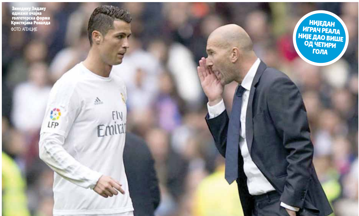
Зинедину Зидану одмаже очажна голгетерска форма Кристијана Роналда

Зидан је Мадрићане одвео до узастопних титула европског и свјетског шампиона, али се у великим заслугама старе заслуге брзо заборавају када кола крену низбрдо. "Краљеви" су доживјели нови неуспјех, на домаћем терену изгубили су од Вилјареала са 0:1 у 19. колу Ла лиге. Навијачима на "Бернабеу" приређено је ново разочарање, њихови љубимци побједили су само једном у последњих пет сусрета и то Нумансију у Купу краља. О титули више нико ни размишља, све је постало јасно после пораза у дербију са Барселоном. Иако се кола леме на Зидану чија је смјена све извјеснија, разлози лоших игара можда леже у лошој форми најбољих играча. Податак да су исповрјеђивани Герет Бејл и резервиста Марко Асенсио постигли једнак број голова (четири) као Кристијано Роналдо довољно говори о неефикасности Португалца, док је Карим