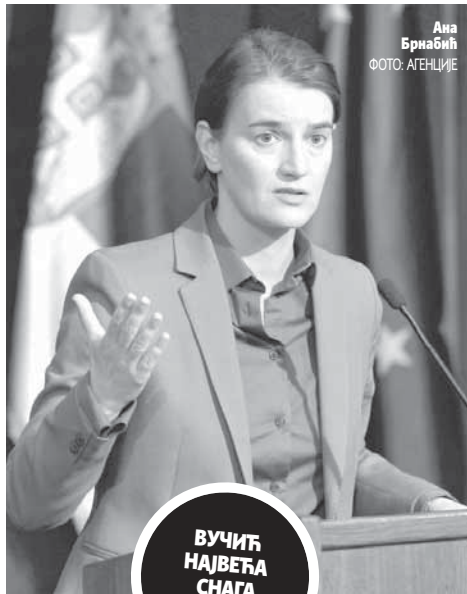
Ана Брнабић

- Мислим да треба да дамо сигнал, ја прва као председница Владе, да у политици ипак није све дозвољено, да треба да пазимо на изговорену реч и да морамо да водимо рачуна о тиму, јер нико не може ништа да уради сам. Мени је тим на првом месту, иако ми позиција председнице Владе даје глас који може да буде ја-