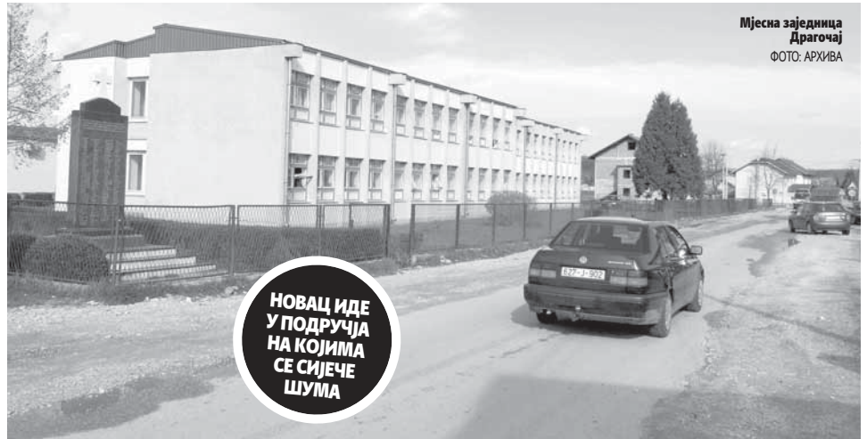
Мјесна заједница Драгочај

ПИСА: ВЕСНА ПОПОВИЋ vesnapo@glassrpske.com