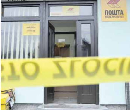
Увијај у Врбању