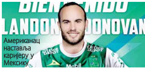
Американац наставља каријеру у Мексику