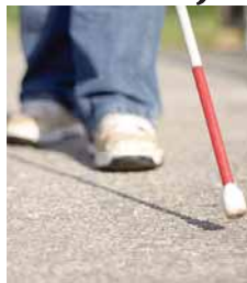
са сензорима за слијепе у Дому здравља Бијељина и подсјећа да слијепи и слабовиди