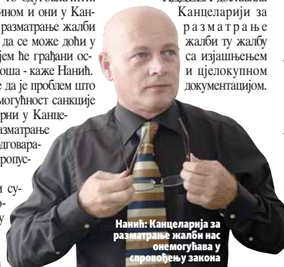
Нанић: Канцеларија за разматрање жалби не онемогућава спровођење закона

Доао је да ће ове седмице бити близу два мјесеца како је ИДДЕЕА доставила Канцеларији за разматрање жалби ту жалбу са изјашњењем и цјелокупном документацијом.