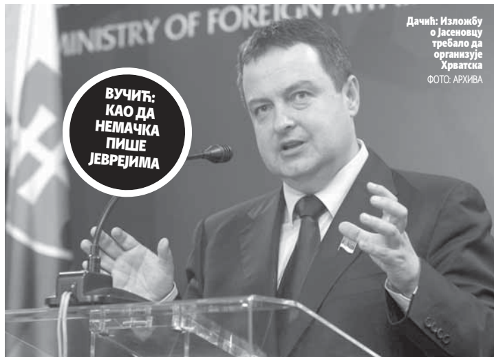
Дачић: Изложбу о Јасеновцу требало да организује Хрватска

- Шта је у томе лажно? Ја сам рекао да је то једини логор у Европи који није био под Хитлером Немачком, него под усташама, друго да су