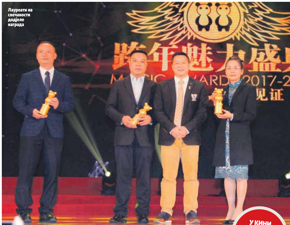
Лауреати на свечаности додјеле награда