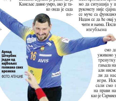
Арпад Штербик један од најбољих голмана свих времена

- Ово је страшно важно за шпански рукомет, нарочито јер смо претходних година пролазили кроз доста проблема. Знамо да ситуација у шпанском рукомету није сјајна, клубови се муче са функционисањем. Надам се да ће овај успјех значити и њима. После четири изгубљена