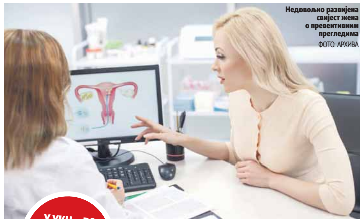
Недовољно развијена свјест жена о превентивним прегледима