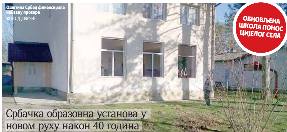
Општина Србац финансира наставку прозора

Србачка образовна установа у новом руху након 40 година