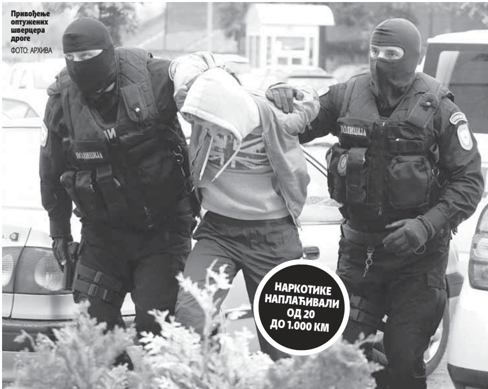
Привођење оптужених шверцера дроге

рихану од 1. јануара 2016. до 19. септембра прошле године на подручју Бањалуке, Приједора, Пњаваора и Козарске Дубице.