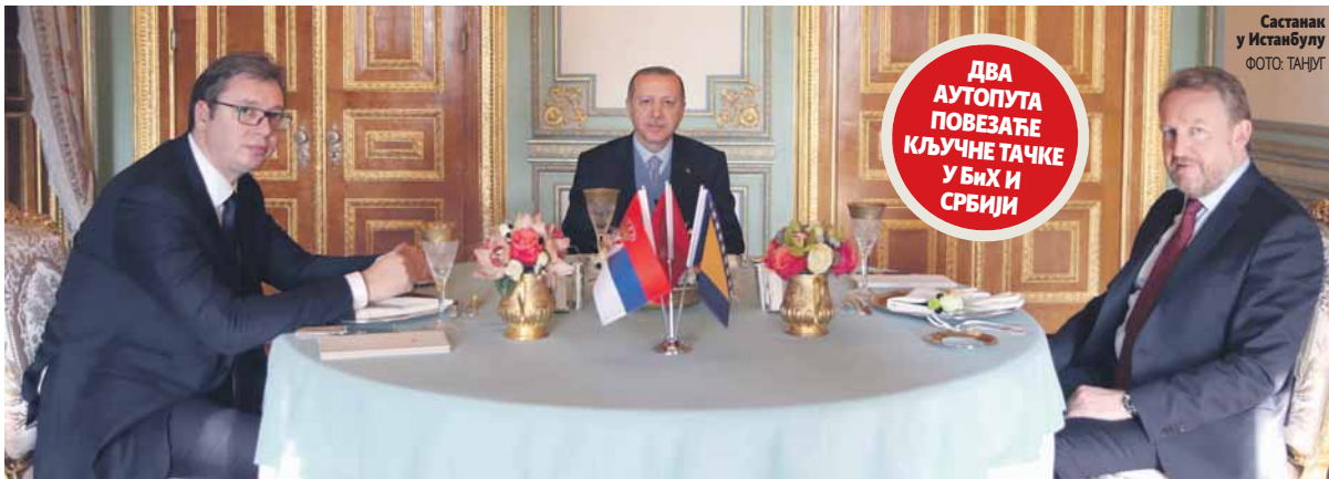
Састанак у Истанбулу

ДВА АУТОПУТА ПОВЕЗАЋЕ КЉУЧНЕ ТАЧКЕ У БИХ И СРБИЈИ