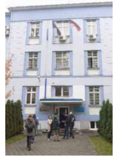
Бањалуци јуче нису били у прилици да коментаришу поменути допис, истакавши да ће се данас огласити о овом питању.