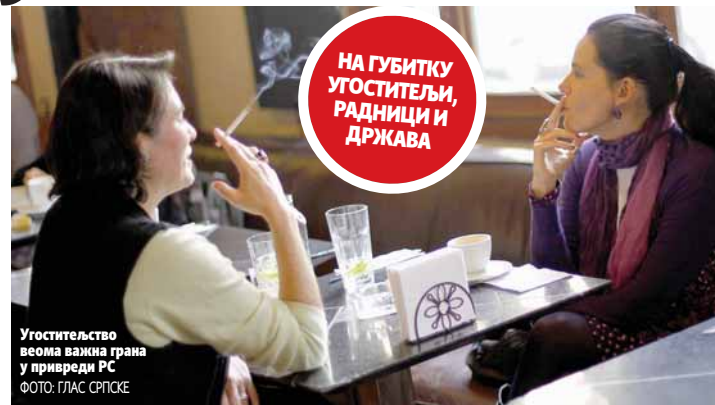
Угоститељство веома важна грана у привреди РС

Потпуна забрана пушења у угоститељским објектима означила је почетак пропасти угоститеља. Они ће почети масовно да стављају кључ у браву, јер ће им пасти промет. Радници ће остати без посла и још више одлазити преко границе, рекао Татић