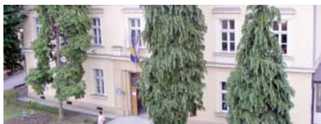
У општини Вишеград лани запослено шест радника

Рекордер по вишку радника је Требиње, у чијој је Градској управи прије двије године