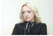
УМРО ВЛАСНИК "ИКЕЕ", ЦАБА СМО УВОДИЛИ АКЦИЗЕ.