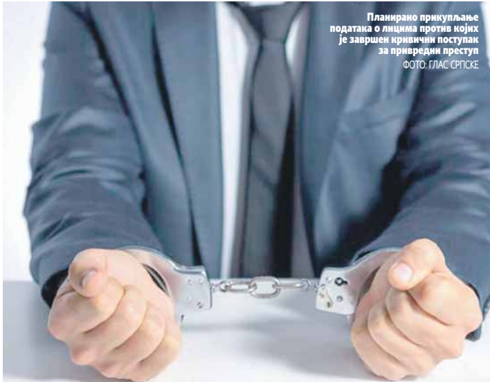
Планирано прикупљање података о лицима против којих је завршен кривични поступак за привредни преступ

Успјех истраживања ће, према њеним ријечима, зависити и од сарадње судова