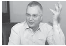
ИЗ БЕОГРАДА ЂЕМО ОСЛОБОДИТИ ДРУГЕ ДЕЛОВЕ СРБИЈЕ.

- Мислим да је овај Косово супротно међународном праву, али вам морам рећи да у овом домену међународна пракса није у довољној мери правна пракса. Истовремено, чињеница је да Косово де факто није део Србије, тако да аргументација да треба да сачувамо Косово је таква да човек може смотривати да је разумно, али тешко је сачувати нешто што у овом часу није у нашем поседу - рекао је Варди. (Тањуг)