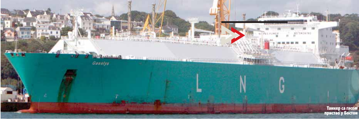
Танкер са гасом пристао у Бостон

У међувремену, саопштено је да ће други танкер, "Провалис", испоручити нову пошиљку руског гаса, који би требало да стигне 15. фебруара. (Агенције)