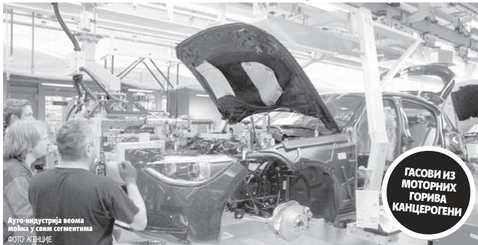
Ауто-индустрија веома моћна у свим сегментима