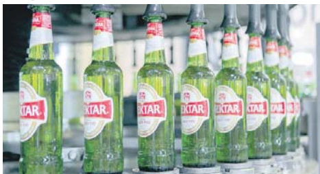
"Нектар" међу омиљеним пивом хиљада пивопојца

Већ од првих година постојања "Бањалучке пиваре" било је видљиво да ће 21. вијек бити посебно успјешан за ову компанију.