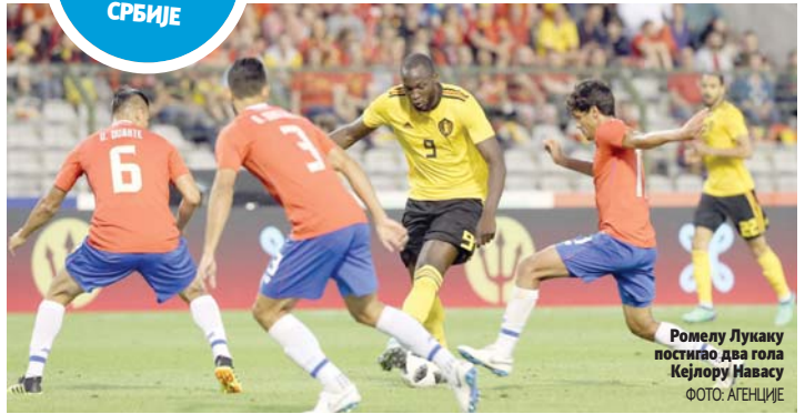
Ромелу Лукаку постигао два гола Кејрулу Навасу