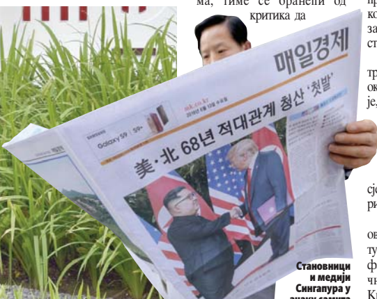
Становници и медији Сингапура у замицу самита