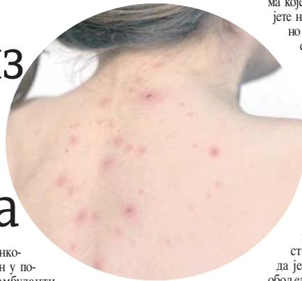
на дијагноза морбила и у току је дијагностичка обрада. Према подаци-

- Постављена је сумња на морбиле. За сада није потврђе-