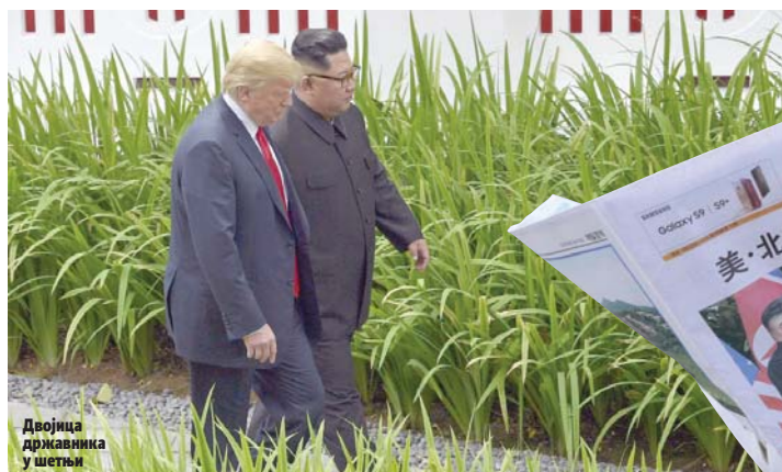
Двојица државника у шетњи

Још је казао и да се "ничега није одрекао" у корист Кима, тиме се бранећи од критика да