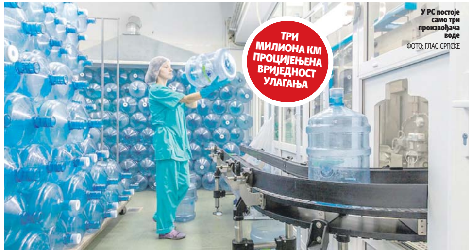
У РС постоје само три произвођача воде

Додијељене концесије за експлоатацију на подручју Козарске Дубице и Брода