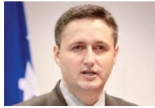
ИЗЈАВЕ АЛЕКСАНДРА ВУЧИЋА СУ АЛАРМ ДА СЕ ЗАПИТАМО КОЛИКО СУ СНАЖНЕ И ОПРЕМЉЕНЕ ОРУЖАНЕ СНАГЕ БиХ.

- Грађани РС треба да знају да СДС није био против измене Закона о акцизама, већ је тражио да се у тај закон угради клаузула о плавом дизелу за пољопривреднике. Да је та клаузула била уграђена у закон, СДС би гласао за измене Закона о акцизама - истакао је Кошарац. (Срна)