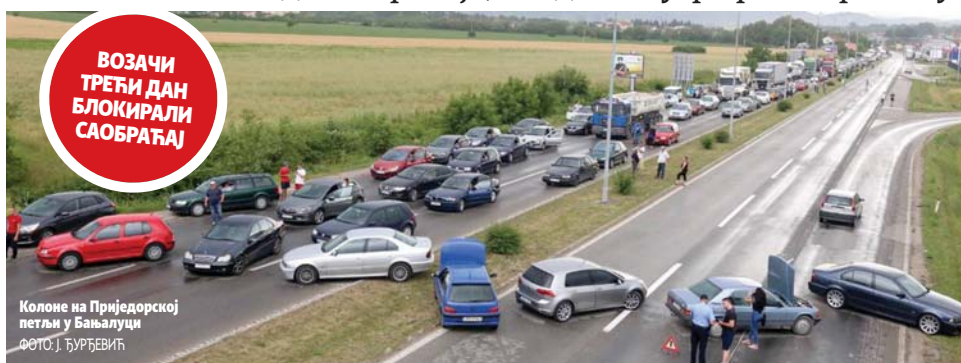
Колоне на Приједорској петљи у Бањалуци