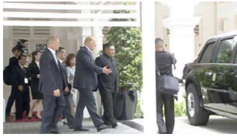
државници да кроз отворена стражња врата посебно

Трамп је, рема писању лондонског "Дејли мејла", дозволио Киму привилегију какву су имали само ријетки