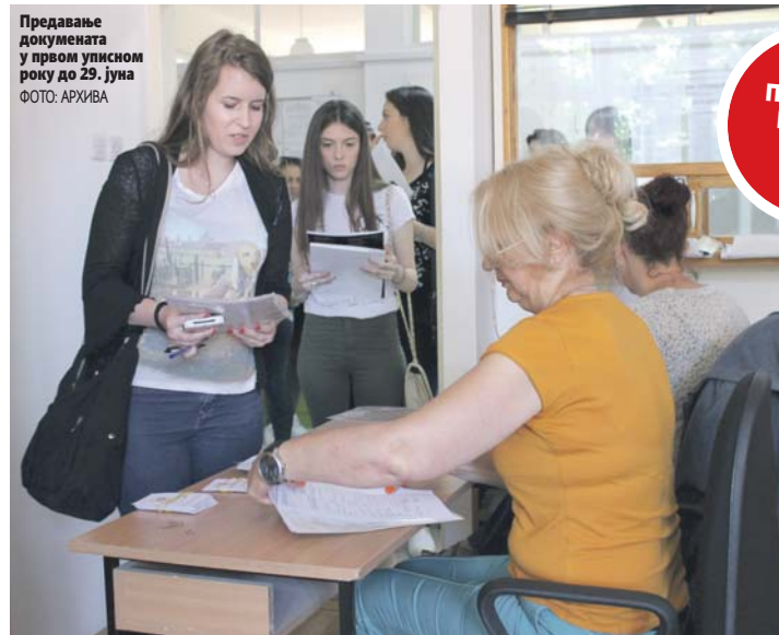
Предавање докумената у првом уписном року до 29. јуна

Онима који желе да на јесен кроче у амфитеатар на располагању су два уписна рока. Први уписни рок, који почиње у понедељак, трајаће до 29. јуна, а полагање прије-