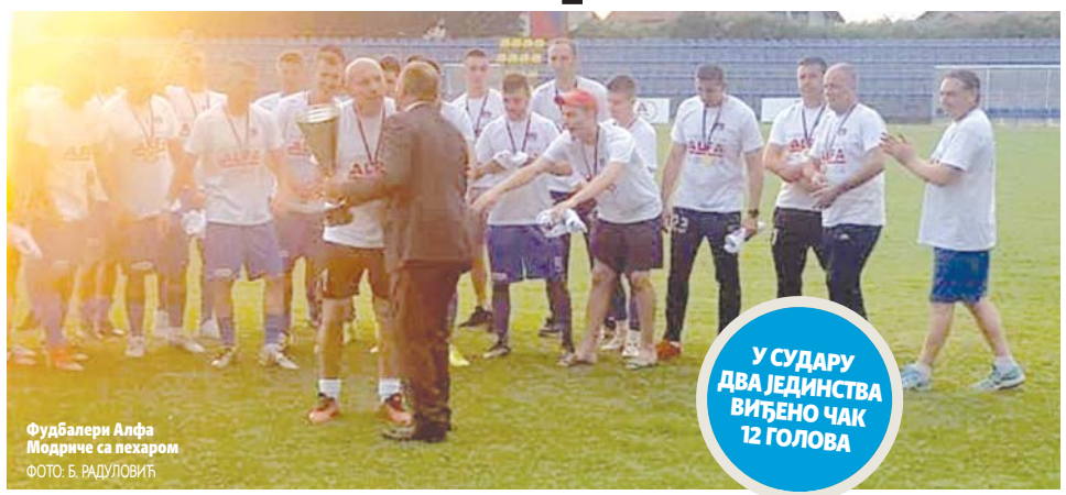
Фудбалери Алфа Модриче са пехаром

У СУДАРУ ДВА ЈЕДИНСТВА ВИЂЕНО ЧАК 12 ГОЛОВА