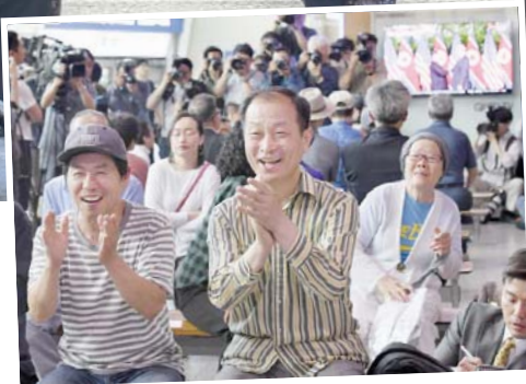
Историјски потпис на мировном документу председника Доналда Трампа и Ким Јонг Уна