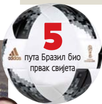
5 пута Бразил био првак свијета

Први меч Мундијала између Русије и Саудијске Арабије судиће Аргентинац Нестор Питана, познат и по томе што се поред овог посла бави и драмским умјетностима, па би сваки покушај глуме код њега требало да буде врло брзо санкциониран. Питани ће ово бити друго Свјетско првенство, а на претходном је судио на четири утакмице. Правду у Русији дијелиће 36 главних судија, међу којима је и најбољи српски арбитар Милорад Мажић.