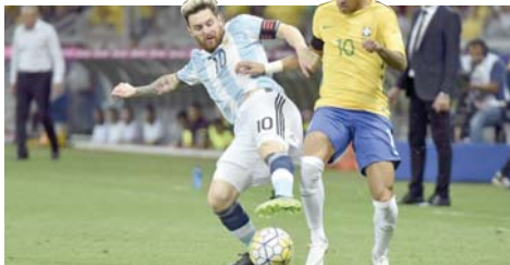
милијарди долара потрошили Руси на градњу стадиона

Послије осам година већа еуфориа него уобичајено захватила је навијаче Србије, јер су "орлови" поново дио елите. Чини се да су очекивања јавности овај пут мања, па момци Младена Крстајића утолико мирнији дочекују неједнаки меч са Костариком, кључни за испуњење првог циља - друге фазе.