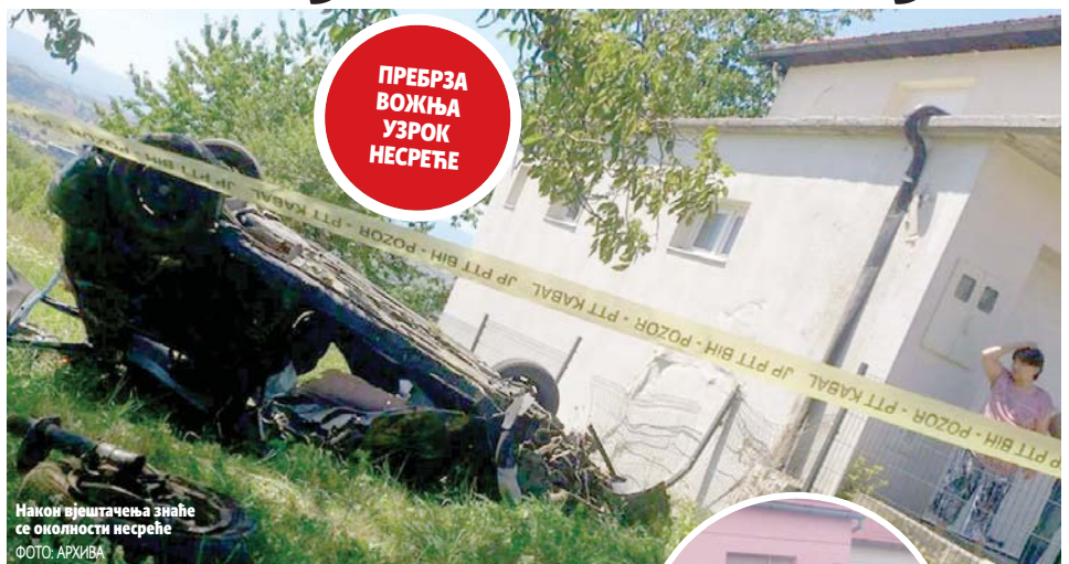
Након вјештачења знаће се околности несреће

Васић је за воланом "тојоте" ударио жену пјешака на тротоару, а потом се забио у зид оближње куће. Од задобијених повреда преминуо је у теслићком Дому здравља