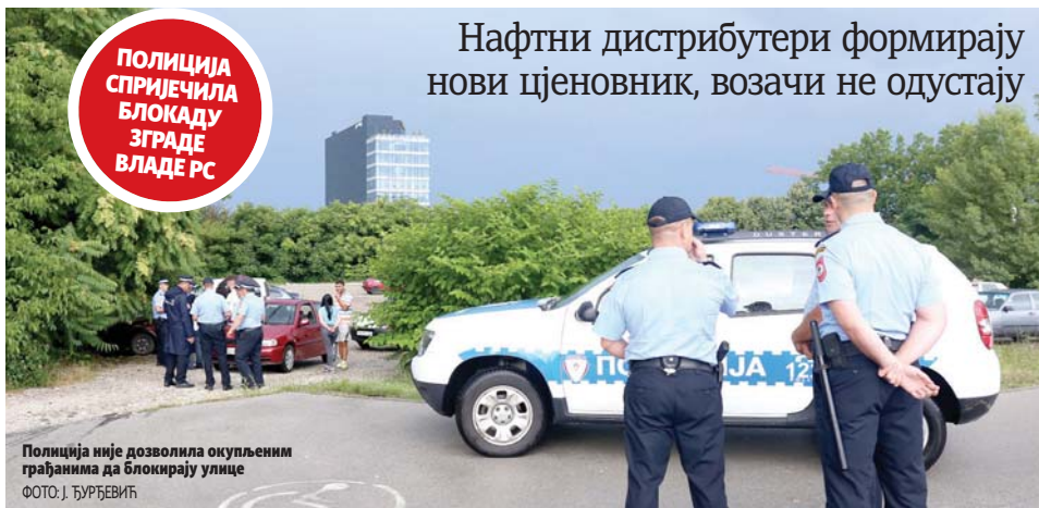
Полиција није дозволила окупљеним грађанима да блокирају улице

Шаровић је савјетовао грађанима да не узимају половњаке ако не могу да добију потврду да је он произведен у ЕУ. (Срна)