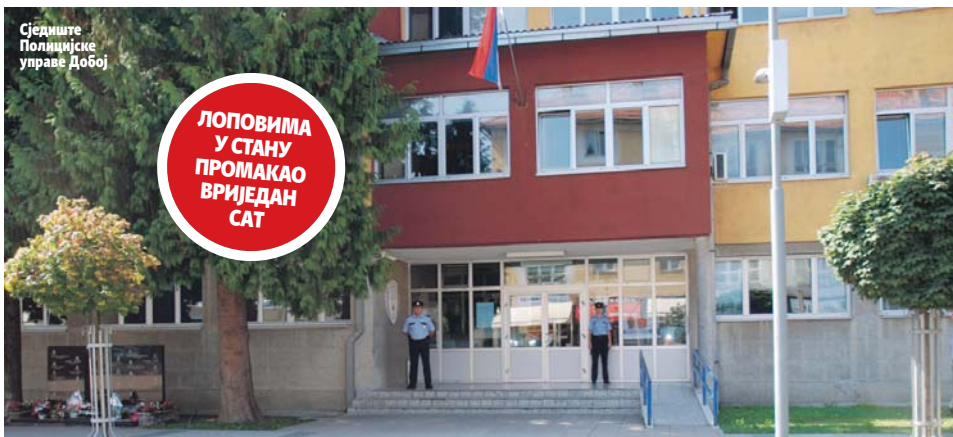
Сједиште Полицијске управе Добој