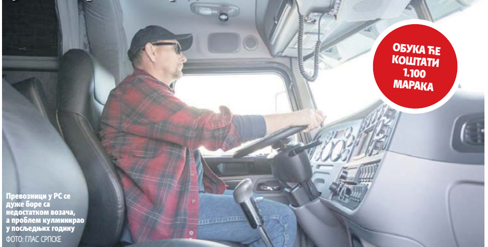
Превозници у РС се дуже боре са недостатком возача, а проблем мулминирао у последњих годину