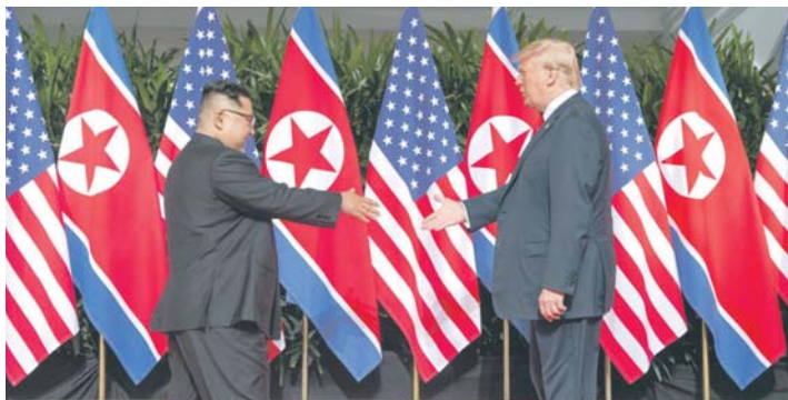
Доналд Трамп и Ким Јонг Ун смањили ратне тензије у свијету