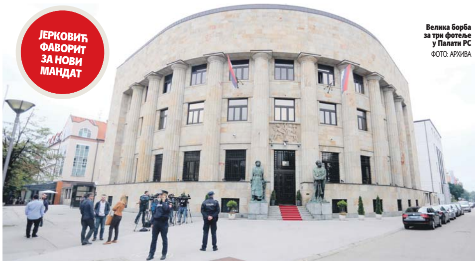
Велика борба за три фотеле у Палати РС