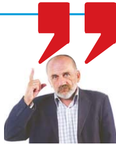
МНОГО ТОГА НИЈЕ ПРАВЕДНО, ЖИВОТИЊЕ У ЦУНГЛИ ЈЕДУ ЉУДЕ.