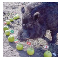
дио фудбалске резултате, било је сјајно - говори 50-годишња фармерка.

- Прије неколико година позвали су ме у радио емисију јер је хоботница Паул предвиђала резултате и хтјели су да виде имам ли ја неку животињу са таквим способностима. Користили су јабуке и наранџе и Маркус је предви-