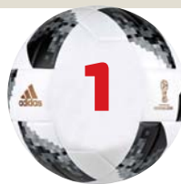
домаћин није прошао у другу фазу - 2010. Јужна Африка

та и Уругваја имају реалне шансе да прођу у други круг. Много тога ће зависити од прве утакмице, јер су Саудијци један од највећих аутсајдера, па уколико не савладају њих, биће врло тешко у предстојећа два меча. Оно што је забринуло јавност, али и селектора Станислава Черчесова свакако је припремни период. Како су као домаћини били ослобођени квалификација, имали су времена за уигравање, али су, судећи по резултатима, мало тога урадили. Немају побједу од почетка октобра 2017, од када су на седам утакмица нанизали четири пораза и три ремија.