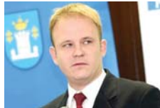
ИАКО СМО ПРИЈАТЕЉИ, ДАВОР БЕРНАРДИЋ МОРА ОТИЋИ С ЧЕЛА СТРАНКЕ.