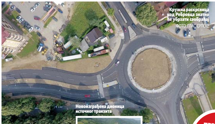
Кружна раскрсница код Ребровца знатно ће убрзати саобраћај

Пропусна моћ раскрснице на Ребровцу биће 24.000 возила, а осим тога биће повећана безбједности свих учесника у саобраћају како возила тако и пјешака, рекао Нешић