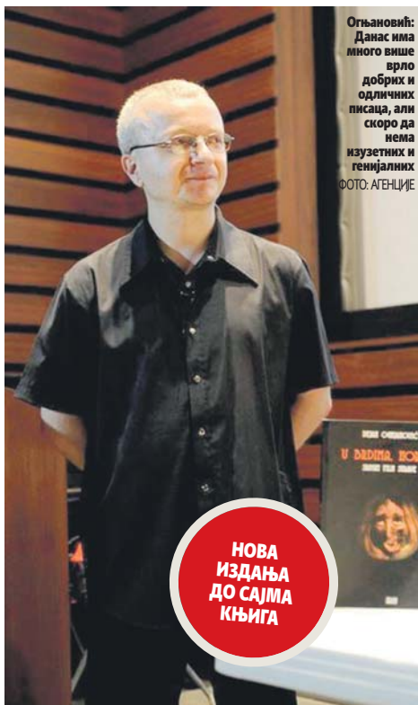
Огњановић: Данас има много више врло добрих и одличних писаца, али скоро да нема изузетних и генијалних

ОГЊАНОВИЋ: Мислим да су за лош имиџ хорора пресудне две ствари: прво, овдашњи људи навикли су на тзв. реализам као на једини валидни и зрели однос према стварности, као једини могући израз у наративној уметности (пре