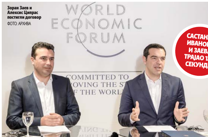
Зоран Заев и Алексис Ципрас потписали су споразум.

Специјални изасланик УН Метју Ниџић поздрављају договор Атине и Скопља о рјешењу спора у вези са именом.