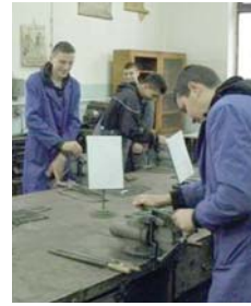
пошљавање и самозапошљавање, за које је ове године на

Истим позивом биће распоређене субвенције за за-