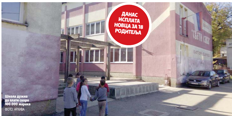
Школа дужна да плати скоро 100.000 марака

Креће исплата одштете родитељима которварошких ученика због пропале екскурзије