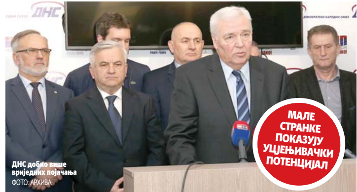
ДНС добио више врједних појачања

ДНС би према скоро свим досадашњим истраживањима требало да има од 12 до 15 одсто гласова и то му даје највећи преговарачки и коалициони капацитет. Без обзира на то какав резултат ће остварити СНСД, они неће имати проблем у формирању већине са ДНС-ом - каже Вукојевић.