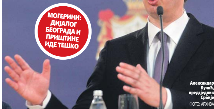
Александар Вучић, председник Србије

МОГЕРИНИ: ДИЈАЛОГ БЕОГРАДА И ПРИШТИНЕ ИДЕ ТЕШКО