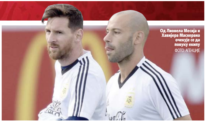
Од Лионела Месија и Хавијера Маскерана очекује се да повуку екипу

Повјерење да дијели правду добио је Иранац Алиреза Фагани.