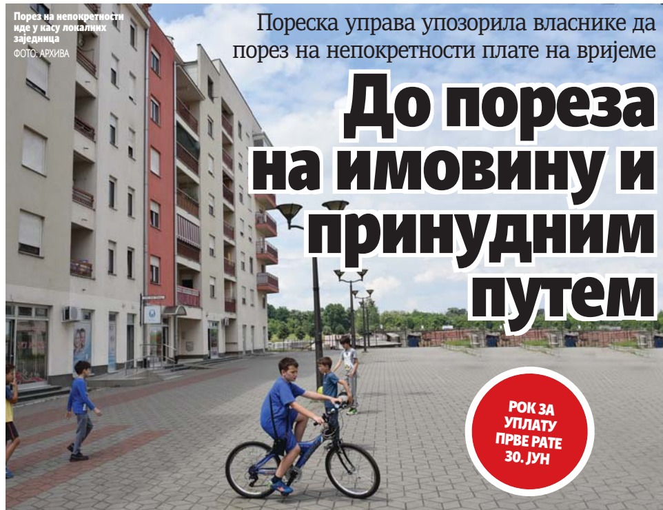
Порез на непокретности иде у касу локалних заједница

Пореска управа упозорила власнике да порез на непокретности плате на вријеме