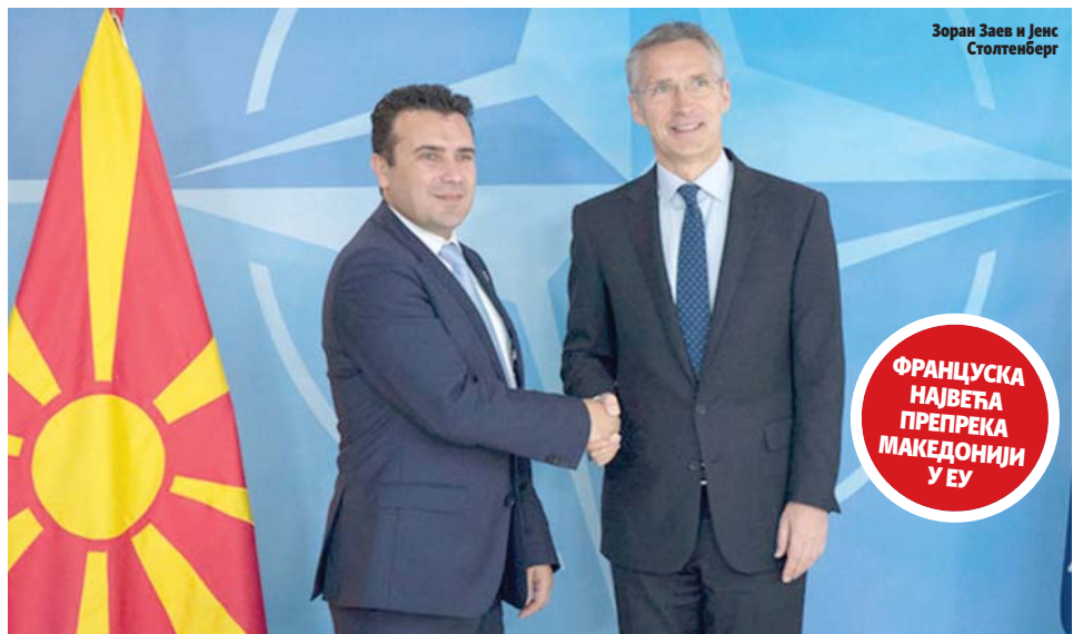
Зоран Заев и Јенс Столтенберг