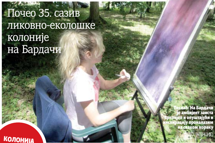
Песлаћ: На Бардачи је амбијент заиста прелијеп и опуштајући и инспирацију проналазим на сваком кораку

Почео 35. сазив ликовно-еколошке колоније на Бардачи