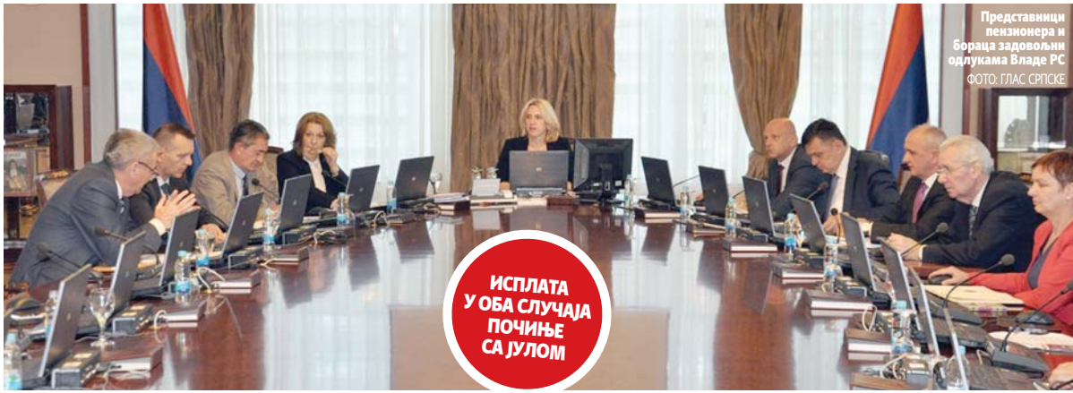
Представници пензионера и бораца задовољни одлукама Владе РС

Додатни новац који ће бити обезбијеђен из буџета РС