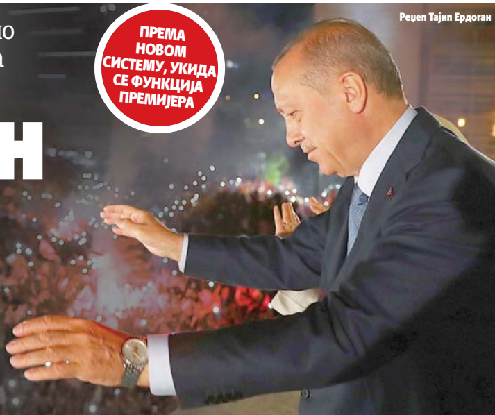
Реџеп Тајип Ердоган

ПРЕМА НОВОМ СИСТЕМУ, УКИДА СЕ ФУНКЦИЈА ПРЕМИЈЕРА