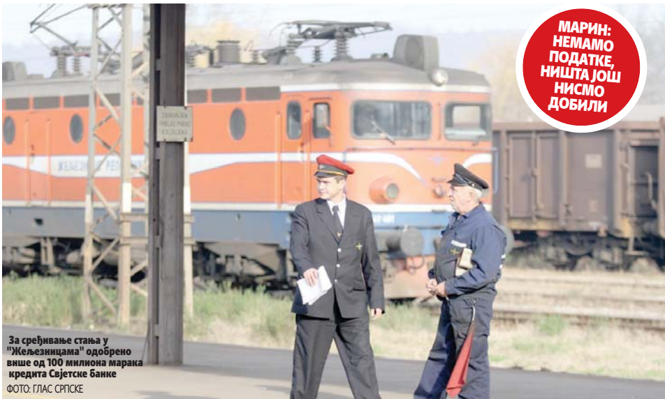
За сређивање стања у "Жељезницама" одобрено више од 100 милиона марака кредита Свјетске банке

МАРИН: НЕМАМО ПОДАТКЕ, НИШТА ЈОШ НИСМО ДОБИЛИ