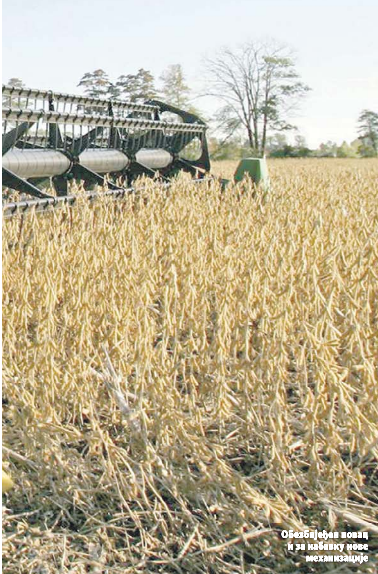
Обезбијеђен новац и за набавку нове механизације

М инистарство пољопривреде, шумарства и водопривреде обезбиједило је за ову годину 71 милион конвертибилних марака за развој пољопривреде и села у Републици Српској.