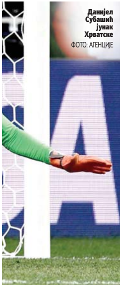
Данијел Субашић јунак Хрватске