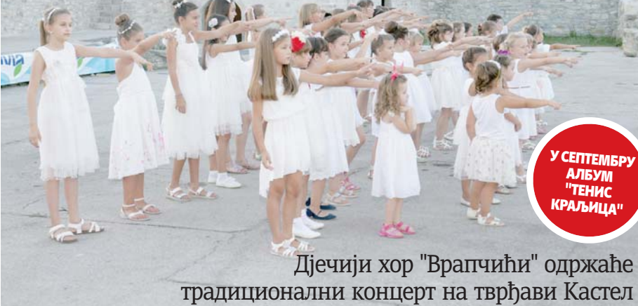
Дјечији хор "Врапчићи" одржаће традиционални концерт на тврђави Кастел

Прошлогодишњи наступ "Врапчића" на Кастелу