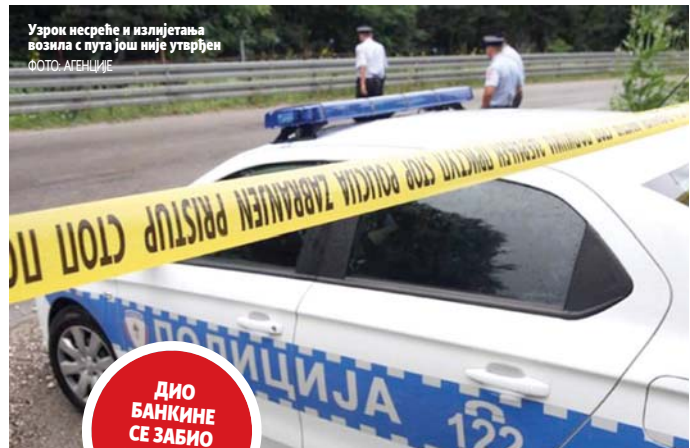
Узрок несреће и излијетања возила с пута још није утврђен