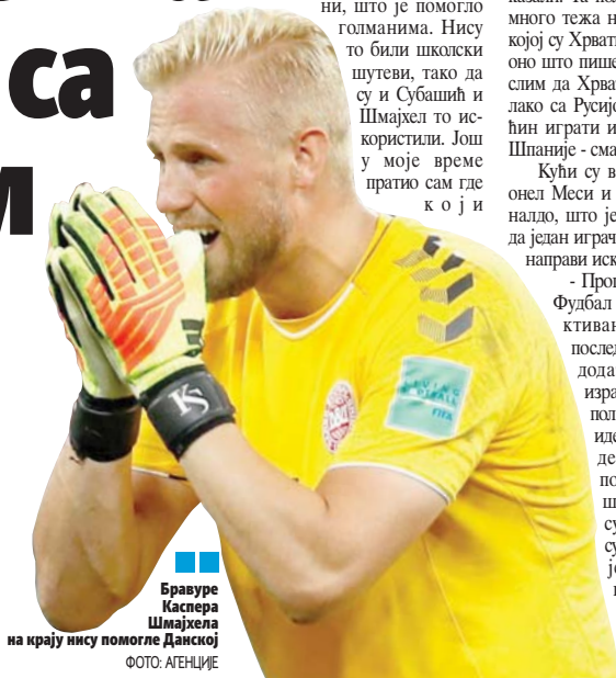
Бравуре Каспера Шмајхела на крају нису помогле Данској