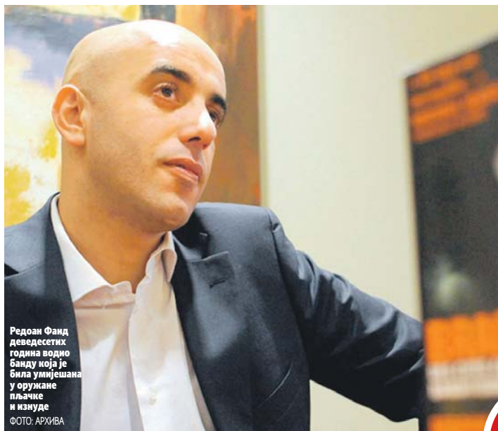
Редоан Фаид деведесетих година водио банду која је била умјешана у оружане пљачке и изануде

Они су извели Фаида из просторије за састанке, гдје је он у том тренутку разговарао са братом, и одвели га до хеликоптера. Бјекство је трајало десетак минута.