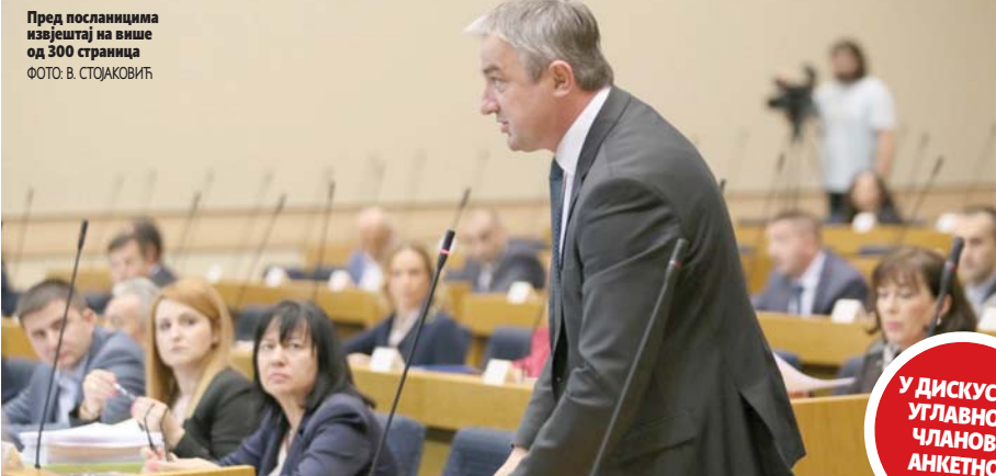
Пред посланицима извјештај на више од 300 страница

овом него и низу претходних сумњивих догађаја са смртним исходом чије су околности остале неразјашњене.