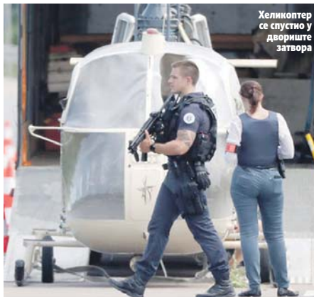
Хеликоптер се спустио у дворште затвора

Један од његових супервизора из затвора је рекао да он никада није улазио у сукобе са