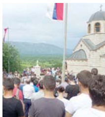
којег ће бити расписан тендер за извођача радова. Рок за ове

- Могу са радошћу да потврдим да је новац уплаћен. Након презентације идејног рјешења које је усвојено слиједи израда пројекта на основу