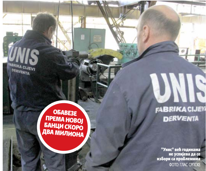
"Унис" већ годинама не успијева да се избори са проблемима

Учешће долара у глобалним резервама је смањено пети квартал узастопно и девизне резерве централних банака широм свијета у америчкој валути износиле су у првом тромјесечју 6.449 милијарди долара и њихов удио смањен је са 62,72 из посљедњег лањског тромјесечја на 62,48 одсто. (Тајгу)