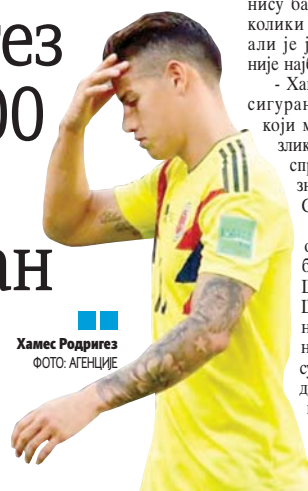
Хамес Родригез

МОСКВА - Колумбијски фудбалер Хамес Родригез пропустио је јучерашњи тренинг националног тима и његов наступ у вечерашњем мечу са Енглеском (20) и даље је под знаком питања.