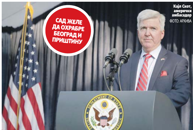
Кајл Скот, амерички амбасадор

- Зато је толико важан овај дијалог који води ЕУ. Мислим да мора ући у интензивнију фазу, ја се надам да ће доћи до