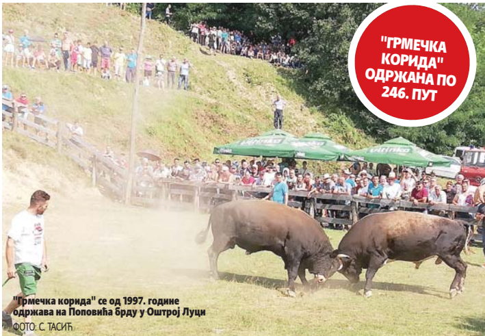
"Грмечка кориде" се од 1997. године одржава на Поповића брду у Оштрој Луци

Врела лјетна неједна била препрека за више стотина љубитеља народних обичаја и дружења да присуствују традиционалној борби бикова, гдје је рогаве укрстило по осам бикова у средњој категорији до 850 килограма и тешкој категорији са више од