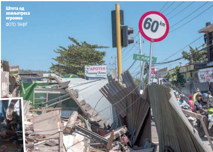
Штета од земљотреса огромна

У току евакуација око 900 страних и домаћих туриста са групе малих острва Жили код Ломбока. Спасилачке екипе не могу да се пробију због срушених мостова, несташице струје и путева блокираних одронима или рушевинама