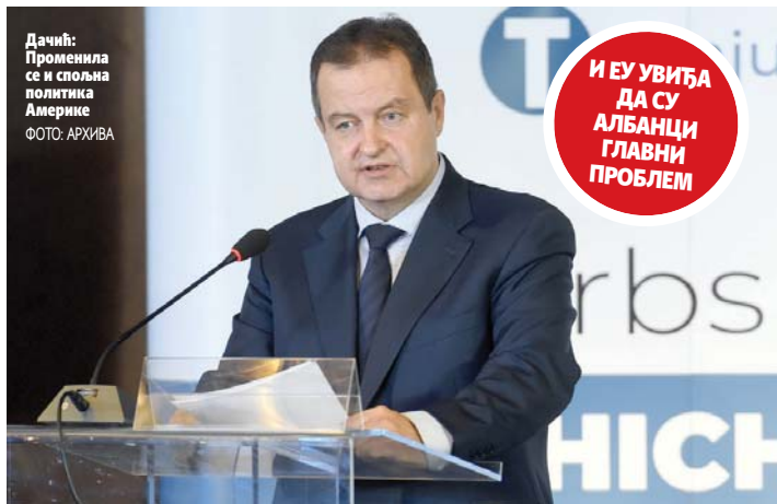
Дачић: Променила се и спољна политика Америке

Према његовим ријечима, отворена је могућност за дијалог, Србија је остварила ближе односе са Немачком, Францу-