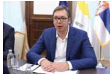
НЕЋЕМО ДОЗВОЛИТИ ДА СЕ СА НАМА СПРДА ЦЕО СВЕТ.

Ови навијачи су у петак послје поноћи били ослобођени у прекршајном поступку за кршење Закона о јавном реду и миру, али су задржани због сумње да су извршили кривично дјело, па је случај против њих преузело тужилаштво. (Танјуг)