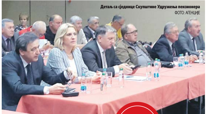
Детаљ са сједнице Скупштине Удружења пензионера

- Пензионери су задовољни активностима предсједнице Владе РС, како на унапређењу положаја пензионерске популације, тако и на стабилизацији и развоју Српске - нагласио је Ракуљ.