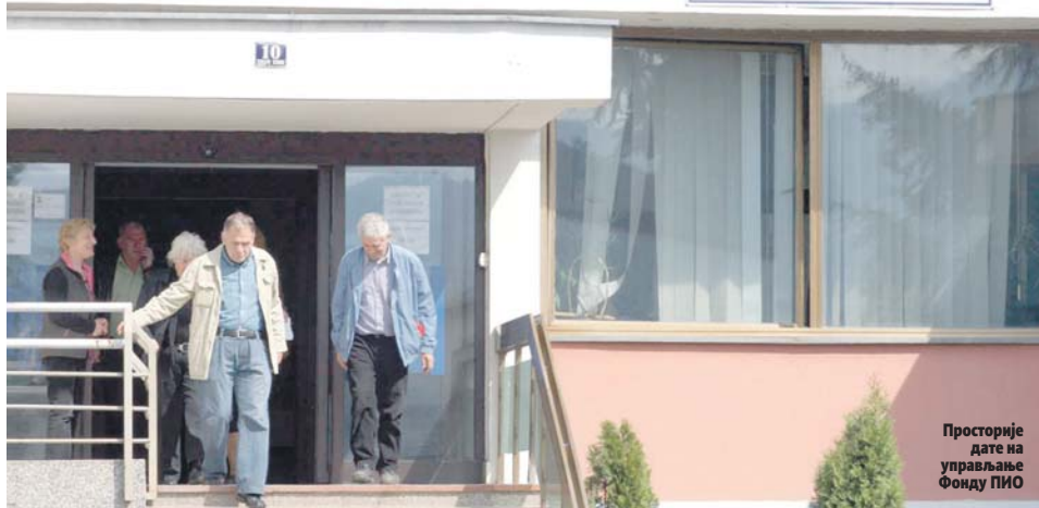
Просторије дате на управљање Фонду ПИО