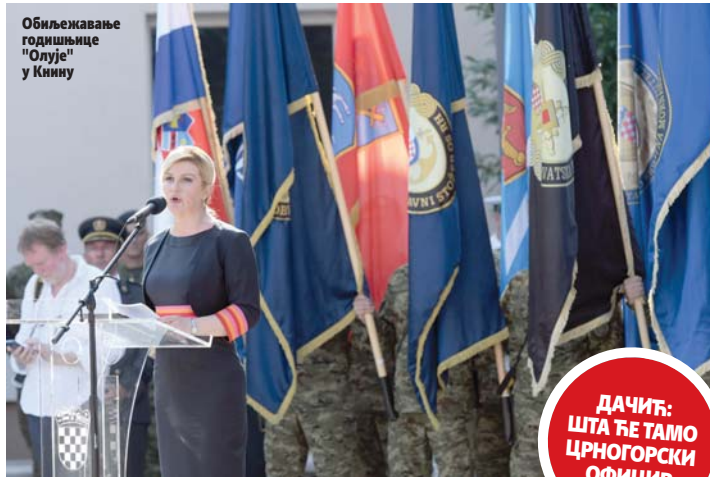
Обиљежавање годишњице "Олује" у Книну

- Хрватска је купила авионе Ф16 од Израела, а њихово учешће је у искључивој вези са овим купопродајним уговором. Оно нема политичке елементе - иста -