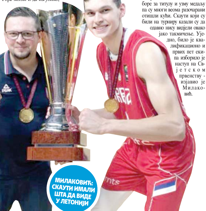
МИЛАКОВИЋ: СКАУТИ ИМАЛИ ШТА ДА ВИДЕ У ЛЕТОНИЈИ

али смо се вратили након великог минуса. Преломна и најтежа утакмица била је са Немачком у четвртфиналу јер је противник дошао спреман у такмичарском ритму и када смо њих добили, знали смо да смо добили трофеј.